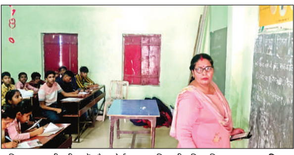
जूनियर कक्षा की परीक्षा में ब्लैक बोर्ड पर प्रश्न लिखती महिला शिक्षक।

अमृत विचार। जिले भर के सभी प्राथमिक, जूनियर व कंपोजिट विद्यालयों की वार्षिक परीक्षाओं का पेपर व्हाट्सएप पर वायरल कर दिया गया। मजाक व लापरवाही के बीच बच्चों का भविष्य तय करने वाले इम्तिहान शुरू हो गए। कई परिषदीय स्कूल ऐसे हैं जहां प्रश्न पत्र नहीं पहुंचे आनन-फानन में शिक्षक-शिक्षिकाओं के व्हाट्सएप पर पेपर की पीडीएफ भेजी गई और उसे ब्लैक बोर्ड में लिखकर परीक्षा कराई गई। कहीं-कहीं चार से पांच छात्र-छात्राओं के बीच एक ही पेपर दिया गया।