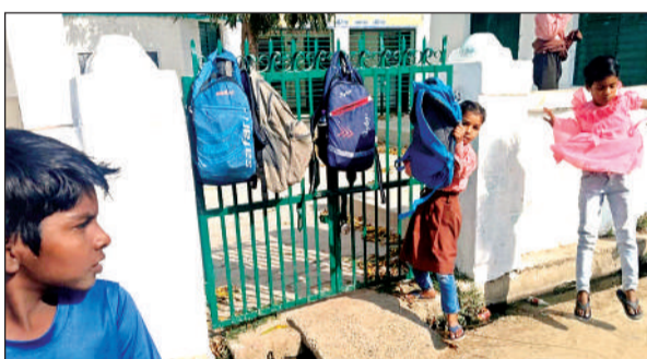
विद्यालय में ताला लगा होने पर बाहर खेलते बच्चे।