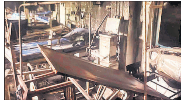
एससीबी मेडिकल कॉलेज एवं अस्पताल के आईसीयू में जला पड़ा सामान।