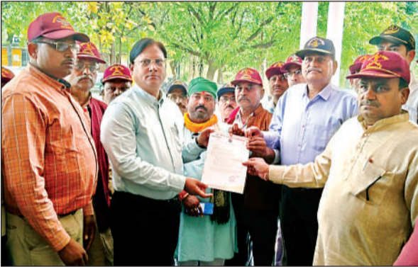
एडीएम को ज्ञापन सौंपते पूर्व सैनिक।

ज्ञापन में बताया कि सभी पूर्व सैनिकों ने लेह लद्दाक जैसे दुर्गम सीमाओं में रहकर देश की सीमा की सुरक्षा के लिए अपना सबकुछ न्योछावर करने का जज्बा रखा है। आज भी वह सीमा की सुरक्षा के