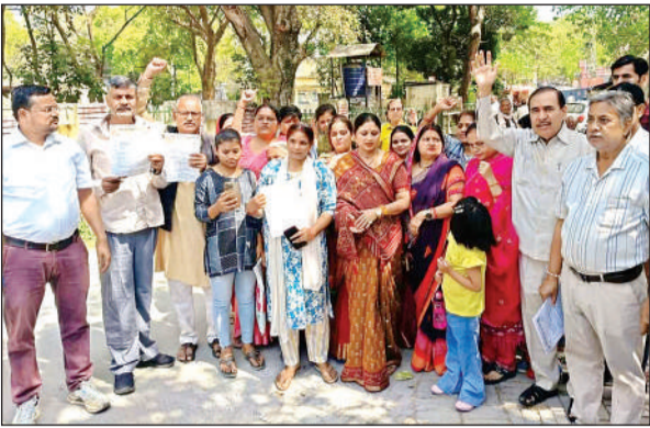
कलेक्ट्रेट में प्रदर्शन करते ब्राह्मण समाज के लोग ।

● एबीबीएपी कार्यकर्ताओं ने विरोध प्रदर्शन कर डीएम को सौंपा ज्ञापन