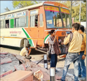
बस की टक्कर से टूटा अटल प्रतिमा का चबूतरा व खड़ी बस।

अमृत विचार। थाना सिविल लाइन क्षेत्र के अंतर्गत डीएम चौराहा स्थित अटल बिहारी बाजपेयी की प्रतिमा की बाउंड्री से ब्रेक फेल होने से रोडवेज बस टकरा गई जिससे बाउंड्री और बस क्षतिग्रस्त हो गई और एक बड़ा हादसा होने से बच गया।