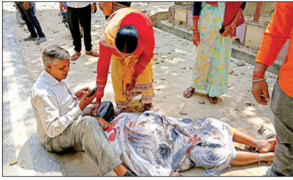
एस्पपी कार्यालय के बाहर सड़क किनारे घायल अवस्था में पुत्र की गांठ में लेटी वृद्ध महिला।

अमृत विचार। कार की टक्कर से बाइक सवार वृद्ध महिला गिर कर घायल हो गई। जिला अस्पताल ले जाते समय रास्ते में उनकी मौत हो गई। मौत की जानकारी पर परिजनों में कोहराम मच गया। ट्रेजरी में पेंशन सत्यापन को लेकर पुत्र की बाइक पर बैठ कर वह आई थी। एस्पपी कार्यालय के सामने दुर्घटना हो गई।