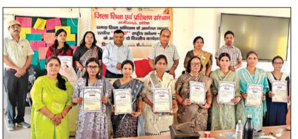
प्रशिक्षण के दौरान मौजूद शिक्षक।