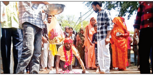
वैष्णो देवी के लिए दंडवत यात्रा पर निकला युवक।