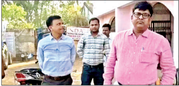
गैस एजेंसी का निरीक्षण करते एसडीएम।

जनसुनवाई के दौरान 23 पीडित महिलाओं, बालिकाओं द्वारा शिकायती प्रार्थना पत्र प्रस्तुत किये गये, जिसमें अधिकारियों ने दो शिकायतों का मौके पर निस्तारण किया। शेष शिकायतों के निस्तारण के लिए सदस्य ने सम्बन्धित अधिकारियों को यथोचित निस्तारण किये गये जाने निर्देश दिये। सदस्य के आने की खबर मिलते ही तमाम पीडित महिलाएं बालिकाएं तहसील परिसर चरखारी पहुंच गईं और सदस्य को अपनी समस्याओं से अवगत कराया।