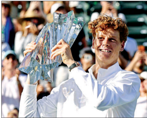
इंडियन वेल्स सिंगल्स खिताब के साथ यानिक सिनर व एरिना सबालेंका।

महिला वर्ग में दुनिया की नंबर एक खिलाड़ी एरिना सबालेंका ने एलेना रिबाकिना को 3-6, 6-3, 7-6 से हराकर खिताब जीता। इससे पहले 2023 और 2025 में उपविजेता रही सबालेंका का यह पहला खिताब है। सिनर ने फेडरर और जोकोविच की बराबरी की: इंडियन वेल्स फाइनल में दानिल मेदवेदेव पर जीत के साथ हार्ड-कोर्ट ट्राफियों का पूरा सेट जीतने वाले सबसे कम उम्र के पुरुष खिलाड़ी बनने के बाद यानिक सिनर ने कहा कि यह मेरे लिए बहुत मायने रखता है। दुनिया के दूसरे नंबर के खिलाड़ी सिनर ने कैलिफोर्निया की तेज गर्मी में, दो घंटे से कुछ कम समय