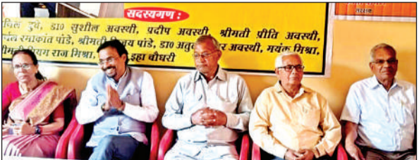
नेत्र शिविर में उपस्थित अतिथि व आयोजक।