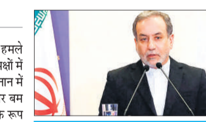
● ब्रिटेन के प्रधानमंत्री बोले- वह पश्चिम एशिया के व्यापक संघर्ष में नहीं शामिल होंगे

ईरान पर अमेरिका-इजराइल के संयुक्त हमले के दो सप्ताह बाद भी सोमवार को दोनों पक्षों में लड़ाई जारी रही। इजराइल ने जहां लेबनान में ईरान समर्थक हिजबुल्ला के ठिकानों पर बम वर्षा की वहीं, ईरान ने जवाबी हमले के रूप में इजराइल के अलावा पड़ोसी देशों में मौजूद अमेरिकी ठिकानों और तेल अवसंरचना को नुकसान पहुंचाने की कोशिश की। ईरान के विदेश मंत्री अब्बास अराघची ने सोमवार को कहा कि होर्मुज मार्ग ईरान के दृष्टिकोण से खुला है, लेकिन उन देशों और उनके सहयोगियों के लिए बंद है जिन्होंने ईरान के खिलाफ कार्रवाईपूर्ण आक्रामकता की है। अराघची ने कहा कि ईरान अपनी रक्षा करने में किसी प्रकार की हिचकिचाहट नहीं रखता और आवश्यकता पड़ने तक युद्ध जारी रखेगा। वहीं, ब्रिटेन के प्रधानमंत्री स्टार्मर ने कहा कि वह ब्रिटेन को प. व्यापक युद्ध में घसीटे जाने की अनुमति नहीं देगा। वह यूरोपीय सहयोगियों से मिलकर खाड़ी को खोलने के लिए एक व्यवहार्य योजना तैयार कर रहे हैं।