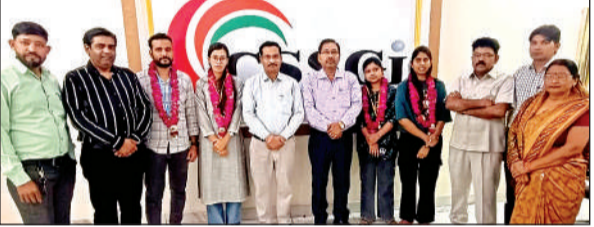
छात्र छात्राओं के साथ कालेज का स्टाफ।