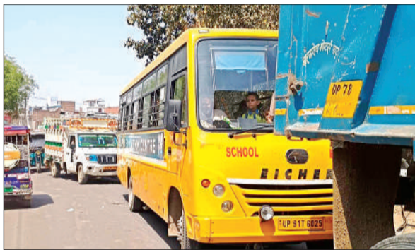
चिलचिलाती धूप के बीच जाम में फंसे स्कूली और अन्य वाहन ।

बांदा रोड पर छोटी बाजार एवं धर्मेश्वर बाबा मुहाल के मध्य रेलवे का गेट संख्या 31 है। ट्रेनों के गुजरने के कारण इसको दिन में कई मिनट बंद किया जाता है। सुबह करीब 11 बजे दुर्ग से कानपुर जा रही बेटवा एक्सप्रेस को निकालने के लिए गेट बंद किया गया था। यात्री गाड़ी के निकलने के बाद जब गेट खोला गया तो भीषण जाम लग गया। प्रत्यक्षदर्शियों के अनुसार जाम लगने का मुख्य कारण वाहनों के आड़ा तिरछा घुसना था। जाम से करीब एक घंटा बांदा मार्ग बाधित रहा और