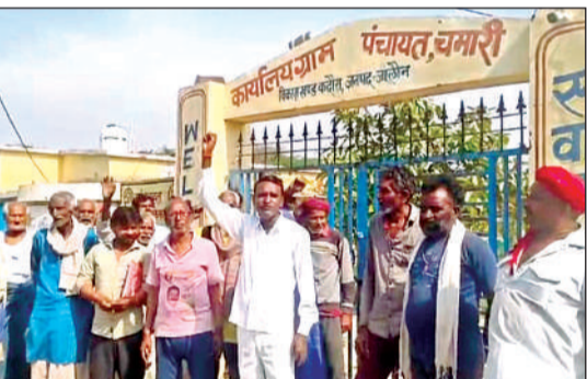
विरोध में नारेबाजी करते ग्रामीण।