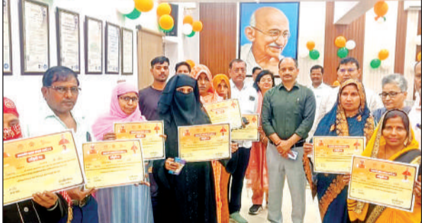
कलेक्ट्रेट सभागार में प्रमाण पत्र लिए खड़ी लाभार्थी, डीएम व डूडा पीओ।