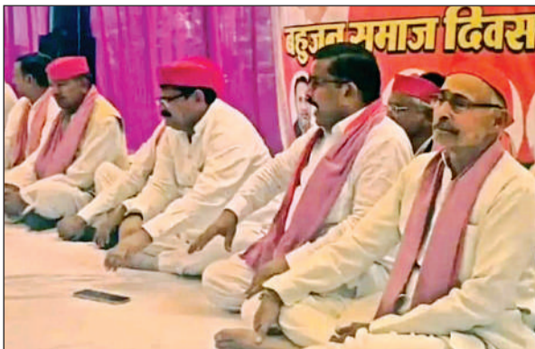
कार्यक्रम में मौजूद सपा नेता।