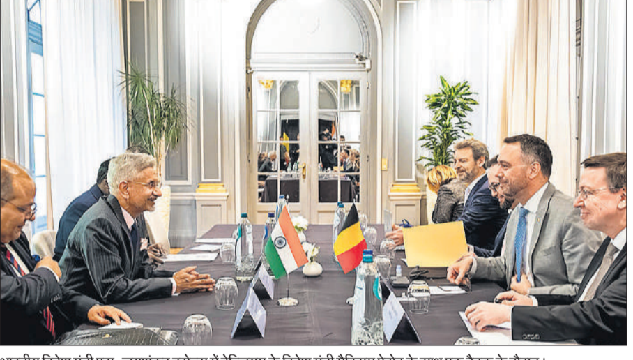
भारतीय विदेश मंत्री एस. जयशंकर ब्रसेल्स में बेलजियम के विदेश मंत्री मैक्सिम प्रेवोट के साथ एक बैठक के दौरान।

की बेरोजगारी दर जनवरी 2026 में 8.7 प्रतिशत रह गई। ग्रामीण महिलाओं की बेरोजगारी दर इसी अवधि में 4.3 से घटकर चार प्रतिशत हो गई। पुरुषों में कुल बेरोजगारी दर 4.8 प्रतिशत पर स्थिर रही। सर्वेक्षण के अनुसार, 15 वर्ष एवं उससे अधिक आयु के लोगों में समग्र श्रम बल सहभागिता दर (एलएफपीआर) फरवरी में 55.9 प्रतिशत पर अपरिवर्तित रही। ग्रामीण क्षेत्रों में एलएफपीआर फरवरी, 2026 में 58.7 प्रतिशत रही जबकि शहरी क्षेत्रों में यह 50.4 प्रतिशत आंकी गई जो जनवरी, 2026 के 50.3 प्रतिशत से थोड़ा अधिक है। वहीं 15 वर्ष एवं उससे अधिक आयु की महिलाओं में एलएफपीआर जनवरी, 2026 के 35.1 प्रतिशत से बढ़कर फरवरी, 2026 में 35.3 प्रतिशत हो गई। सर्वेक्षण में पाया गया कि 15 वर्ष एवं उससे अधिक आयु वर्ग में श्रमिक जनसंख्या अनुपात फरवरी, 2026 में ग्रामीण एवं शहरी दोनों क्षेत्रों में लगभग स्थिर रहा।