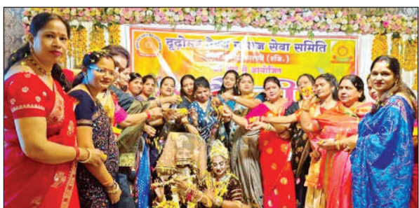
होली मिलन समारोह में राधा-कृष्ण की झांकी की प्रस्तुति दी गई।