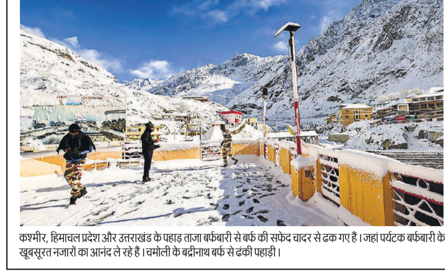
कश्मीर, हिमाचल प्रदेश और उत्तराखंड के पहाड़ ताजा बर्फबारी से बर्फ की सफेद चादर से ढक गए हैं। जहां पर्यटक बर्फबारी के खूबसूरत नजारों का आनंद ले रहे हैं। चमोली के बद्रीनाथ बर्फ से ढकी पहाड़ी।