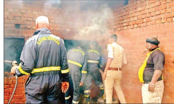
आग बुझाते फायर ब्रिगेड की टीम व पुलिस।

मौत की जानकारी पर परिजनों में कोहराम मच गया। सोमवार को पुलिस ने परिजनों की तहरीर पर अज्ञात वाहन के चालक के खिलाफ रिपोर्ट दर्ज कर शव को पोस्टमार्टम के लिये भेजा है। पुलिस मामले की जांच में जुट गई है।