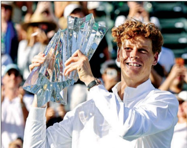
इंडियन वेल्स सिंगल्स खिताब के साथ यानिक सिनर व एरिना सबालेंका।

सिनर ने फेडरर और जोकोविच की बराबरी की : इंडियन वेल्स फाइनल में दानिल मेदवेदेव पर जीत के साथ हार्ड-कोर्ट ट्राफियों का पूरा सेट जीतने वाले सबसे कम उम्र के पुरुष खिलाड़ी बनने के बाद यानिक सिनर ने कहा कि यह मेरे लिए बहुत मायने रखता है। दुनिया के दूसरे नंबर के खिलाड़ी सिनर ने कैलिफोर्निया की तेज गर्मी में, दो घंटे से कुछ कम समय