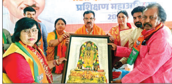
मुख्य अतिथि का स्वागत करते भाजपा नेता।