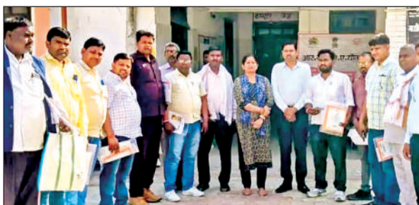
रसूलाबाद में डिजिटल साक्षरता प्रशिक्षण कार्यक्रम में भाग लेने आए ग्राम प्रधान।

तैयारी, रोजगारपरक जानकारी एवं ज्ञानवर्धक साहित्य सुलभ हो सकेगा। उन्होंने कहा कि यह पहल डिजिटल इंडिया और साक्षर भारत जैसे राष्ट्रीय अभियानों को सशक्त बनाने में महत्वपूर्ण भूमिका निभाएगी। उन्होंने संबंधित अधिकारियों को निर्देश दिए कि चयनित ग्राम पंचायतों में डिजिटल लाइब्रेरी की स्थापना एवं उसका क्रियान्वयन निर्धारित समयसीमा के भीतर सुनिश्चित की जाए। इसके साथ ही आवश्यक संसाधनों की उपलब्धता, बेहतर इंटरनेट कनेक्टिविटी, कंप्यूटर, फर्नीचर एवं अन्य तकनीकी सुविधाओं पर विशेष ध्यान दिया जाए। उन्होंने स्पष्ट किया कि किसी भी स्तर पर लापरवाही