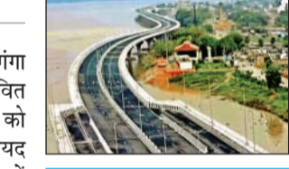
7.5 किमी लंबा होगा शुक्लागंज से बैराज तक रिवर फ्रंट

अमृत विचार। अटल घाट गंगा बैराज से जाजमऊ तक प्रस्तावित रिवर फ्रंट डेवलपमेंट प्रोजेक्ट को धरातल पर उतारने की कवायद तेज हो गई है। यह प्रोजेक्ट दो चरणों में पूरा होगा। पहले चरण में गंगा बैराज से शुक्लागंज तक बनाया जाना है। इसकी डिटेल्ड प्रोजेक्ट रिपोर्ट तैयार करने के लिए सेतु निर्माण निगम ने आरएफपी मांगी थी। चार कंपनियों ने टेंडर डाला है। अब उनकी तकनीकी क्षमता का आकलन किया जा रहा है। इनमें जो कंपनी मानक पर खरी उतरेंगी उनकी आर्थिक क्षमता और कार्य के लिए की गई धनराशि की डिमांड का आधार पर उनमें से किसी एक को काम दिया जाएगा। यूं कहें तो अप्रैल से डीपीआर बनाने का काम शुरू हो