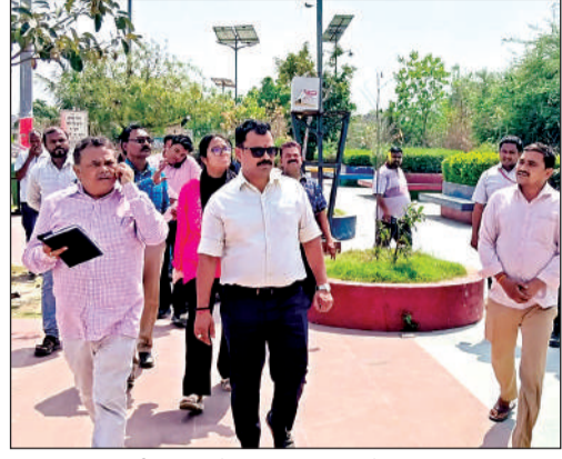
नगर आयुक्त निरीक्षण करने अटल घाट पर पहुंचे।