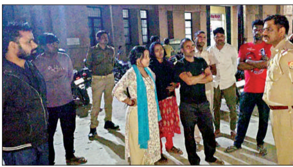
मौके पर हादसे की जानकारी लेते पुलिसकर्मी।