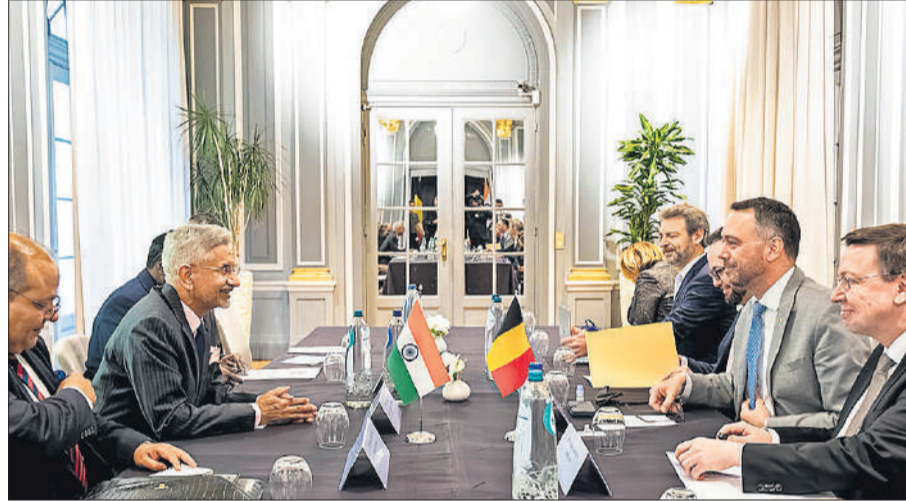
भारतीय विदेश मंत्री एस. जयशंकर ब्रसेल्स में बेलजियम के विदेश मंत्री मैक्सिम प्रेवोट के साथ एक बैठक के दौरान।

उन्होंने कहा कि हम कृत्रिम मेधा (एआई) के क्षेत्र में उभरने वाली किसी भी प्रतिस्पर्धा-विरोधी गतिविधि के खिलाफ कार्रवाई करने की तैयारी कर रहे हैं। हमने संभावित प्रतिस्पर्धा-विरोधी गतिविधियों की पहचान की है जिसमें कृत्रिम मेधा (एआई) की मूल्य श्रृंखला में अत्यधिक केंद्रीकरण शामिल हो सकता है। उन्होंने कहा कि हमें हर क्षेत्र से प्रतिस्पर्धा-विरोधी मामलों की जानकारी मिलती है।