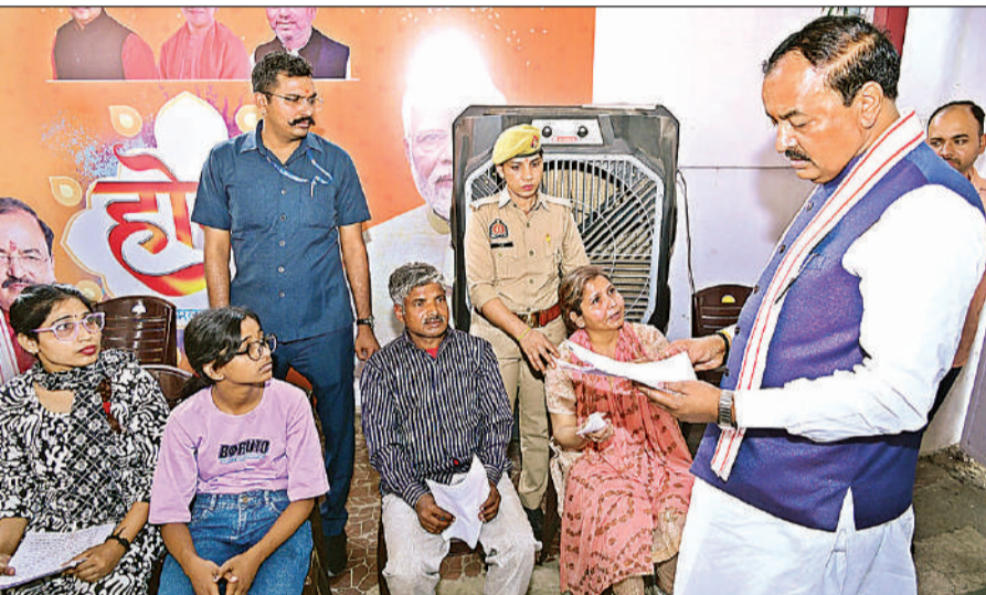
लखनऊ स्थित अपने आवास पर जनता दर्शन कार्यक्रम में फरियादियों की समस्याएं सुनते उप मुख्यमंत्री केशव प्रसाद मौर्य।

सोमवार को पावर कारपोरेशन के प्रवक्ता ने बताया कि बिजली सप्लाई बंद होने के बाद यदि उपभोक्ता बकाए का 50 फीसदी प्रीपेड स्मार्ट मीटर रिचार्ज करता है तो तो कनेक्शन केवल तीन दिनों के लिए पुनः जोड़ दिया जाएगा। प्रवक्ता का कहना है कि यदि इन तीन दिनों के भीतर पूरा बिल नहीं रिचार्ज किया तो दोबारा कनेक्शन कट दिया जाएगा। स्मार्ट मीटरों के प्रमुख लाभों में सटीक बिलिंग, समय से रिचार्ज और मीटर से छेड़छाड़ नहीं करने पर निर्धारित विद्युत टैरिफ पर दो प्रतिशत छूट दी जा रही है।