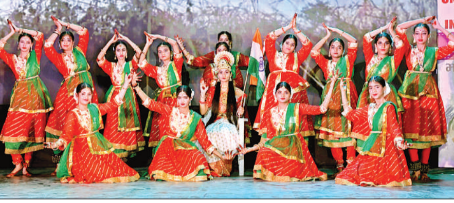
बच्चों ने शानदार नृत्य पेश किया।