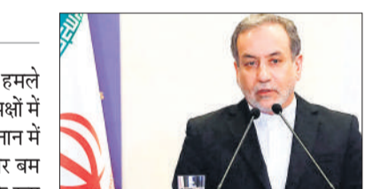
● ब्रिटेन के प्रधानमंत्री बोले- वह पश्चिम एशिया के व्यापक संघर्ष में नहीं शामिल होंगे

ईरान पर अमेरिका-इजराइल के संयुक्त हमले के दो सप्ताह बाद भी सोमवार को दोनों पक्षों में लड़ाई जारी रही। इजराइल ने जहां लेबनान में ईरान समर्थक हिजबुल्ला के ठिकानों पर बम वर्षा की वहीं, ईरान ने जवाबी हमले के रूप में इजराइल के अलावा पड़ोसी देशों में मौजूद अमेरिकी ठिकानों और तेल अवसंरचना को नुकसान पहुंचाने की कोशिश की। ईरान के विदेश मंत्री अब्बास अराघची ने सोमवार को कहा कि होर्मुज मार्ग ईरान के दृष्टिकोण से खुला है, लेकिन उन देशों और उनके सहयोगियों के लिए बंद है जिन्होंने ईरान के खिलाफ कार्रवाईपूर्ण आक्रामकता की है। अराघची ने कहा कि ईरान अपनी रक्षा करने में किसी प्रकार की हिचकिचाहट नहीं रखता और आवश्यकता पड़ने तक युद्ध जारी रखेगा। वहीं, ब्रिटेन के प्रधानमंत्री स्टार्मर ने कहा कि वह ब्रिटेन को प. व्यापक युद्ध में घसीटे जाने की अनुमति नहीं देगा। वह यूरोपीय सहयोगियों से मिलकर खाड़ी को खोलने के लिए एक व्यवहार्य योजना तैयार कर रहे हैं।