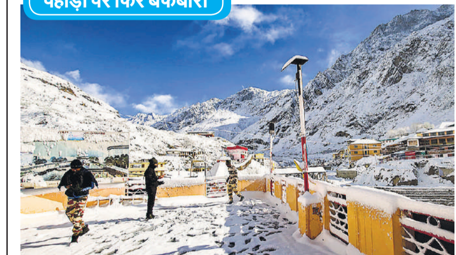
कश्मीर, हिमाचल प्रदेश और उत्तराखंड के पहाड़ ताजा बर्फबारी से बर्फ की सफेद चादर से ढक गए हैं। जहां पर्यटक बर्फबारी के खूबसूरत नजारों का आनंद ले रहे हैं। चमोली के बद्रीनाथ बर्फ से ढकी पहाड़ी।