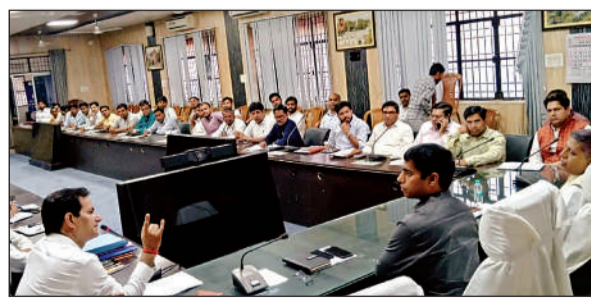
कलेक्ट्रेट सभागार में अफसरों संग डीएम कपिल सिंह ने की बैठक। अमृत विचार

अमृत विचार: सोमवार को डीएम कपिल सिंह की अध्यक्षता एवं सीडीओ विधान जायसवाल की उपस्थिति में पीएम सूर्य घर मुफ्त बिजली योजना के अंतर्गत जनपद में संचालित कार्यों की समीक्षा बैठक हुई। बैठक में योजना के क्रियान्वयन की वर्तमान स्थिति की विस्तृत समीक्षा करते हुए संबंधित विभागों को आवश्यक दिशा-निर्देश दिए गए। बैठक के दौरान जिलाधिकारी ने अधिकारियों को निर्देशित किया कि योजना के निर्धारित लक्ष्यों के अनुरूप कार्यों की प्रगति सुनिश्चित की जाए तथा अधिक से अधिक पात्र लाभार्थियों को योजना से जोड़ने के लिए विशेष प्रयास किए जाएं। उन्होंने कहा कि यह योजना आमजन को सस्ती एवं स्वच्छ