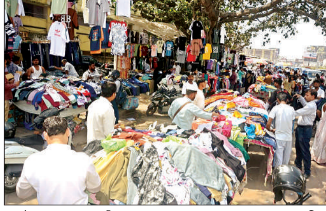
बड़ा चौराहा पर सड़क तक अतिक्रमण।