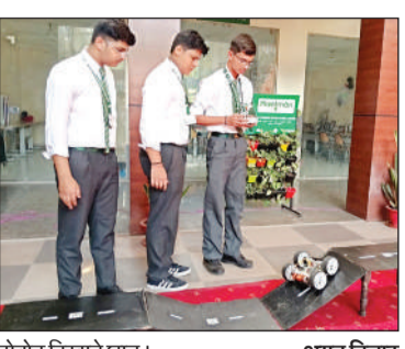
रोबोट दिखाते छात्र।