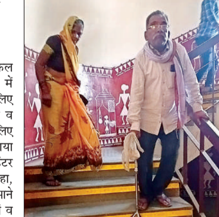
लिफ्ट बंद होने से बुजुर्ग परेशान।