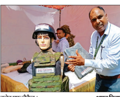
बुलेट प्रूफ जैकेट। अमृत विचार

20 बाधाएं की दूर तकनीकी महोत्सव में युवाओं की ओर से रोबोट का प्रदर्शन भी किया। टीमों ने खुद के बनाए हुए रोबोट के जरिए 20 बाधाओं को पार किया। इन बाधाओं में रेत, हडल जैसी बाधाएं शामिल रहीं। युवाओं की ओर से रोबोट को बाधाओं से गुजरते हुए किस तरह से वह चलता है, कितनी बार वह रुका या गिरा व कितनी बार रोबोट को मानवीय सपोर्ट दिया गया इस आधार पर रोबोट बनाने वाली टीम को अंक प्रदान किए गए।