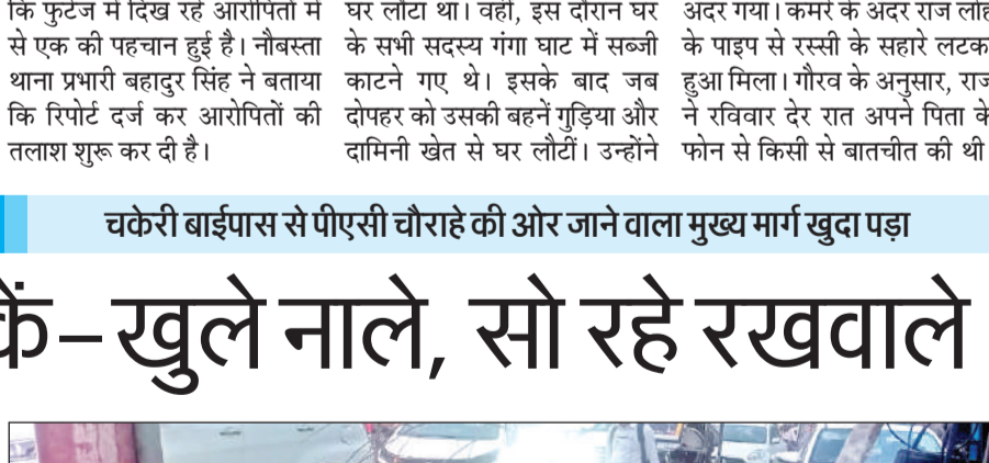
खुदी सड़क पर बैरिकेडिंग न होने से हादसे का खतरा।

स्थानीय लोगों के अनुसार सड़क की खुदाई के बाद गड्ढे के आसपास न तो कोई चेतावनी संकेत लगाया गया है और न ही बैरिकेडिंग की गई है। सड़क को फुटपाथ से सटे