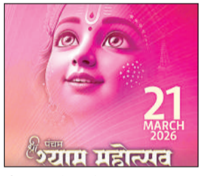
श्री श्याम महोत्सव के का पत्रक।