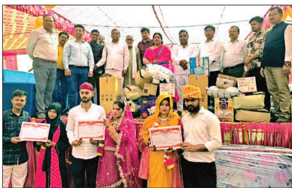
विवाह के प्रमाण पत्र के साथ मौजूद वर-वधु।