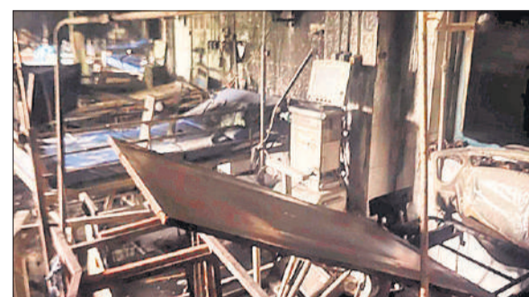
एससीबी मेडिकल कॉलेज एवं अस्पताल के आईसीयू में जला पड़ा सामान।

ओडिशा सरकार द्वारा कटक में संचालित एससीबी मेडिकल कॉलेज एवं अस्पताल के आईसीयू में रविवार देर रात भीषण आग लगने से 10 मरीजों की मौत हो गई। घटना के बाद अस्पताल पहुंचे मुख्यमंत्री मोहन चरण माझी ने बताया कि मरीजों को सुरक्षित बाहर निकालने के दौरान अस्पताल के करीब 11 कर्मचारी झुलस गए। मुख्यमंत्री ने छह सदस्यों की एक जांच टीम बनाई है, जो आग लगने की वजह की जांच करेगी और आज शाम तक अपनी रिपोर्ट देगी।