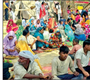
भंडारे में प्रसाद ग्रहण करते भक्त।