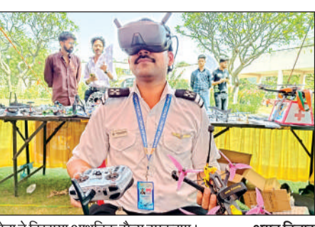
सेना ने दिखाया आधुनिक सैन्य उपकरण। अमृत विचार