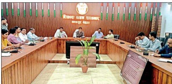
अधिकारियों के साथ सीडीओ ने की बैठक। अमृत विचार

सीडीओ ने कहा कि ग्राम पंचायतों में डिजिटल लाइब्रेरी की स्थापना से ग्रामीण क्षेत्रों के छात्र-छात्राओं, युवाओं एवं आम नागरिकों को शिक्षा, प्रतियोगी परीक्षाओं की