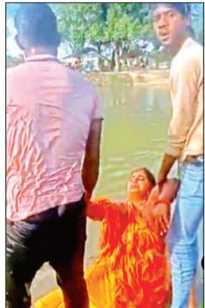
नहर से महिला को बचाकर लाते युवक।