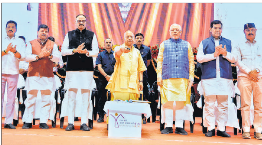
लखनऊ : इंदिरा गांधी प्रतिष्ठान में आयोजित कार्यक्रम में रिमोट दबाकर पीएम आवास योजना के लाभार्थियों हेतु किस्त जारी करते सीएम योगी (साथ में मंत्रिमंडल के उनके सहयोगी)।

अमृत विचार: मुख्यमंत्री योगी आदित्यनाथ ने सोमवार को प्रधानमंत्री आवास योजना-शहरी 2.0 के तहत प्रदेश के 90 हजार लाभार्थियों के खातों में डीबीटी के माध्यम से 900 करोड़ रुपये की पहली किस्त जारी की। इस अवसर पर उन्होंने कहा कि प्रदेश में किसी गरीब को बिना आवास के नहीं रहने दिया जाएगा। जिन माफियाओं ने वर्षों तक गरीबों का हक छीना और जमीनों पर कब्जा किया, अब उन्हीं जमीनों को मुक्त करार गरीबों के लिए घर बनाए जाएंगे। मुख्यमंत्री ने स्पष्ट किया कि सरकार का लक्ष्य केवल मकान देना नहीं, बल्कि गरीबों को सम्मानजनक जीवन उपलब्ध कराना है।