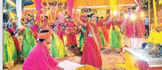
मां बाराही मंदिर परिसर में गीत की शूटिंग करती कलाकार।