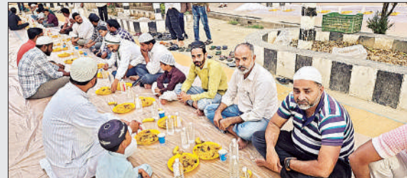
इफतार पार्टी में शामिल रोजेदार।