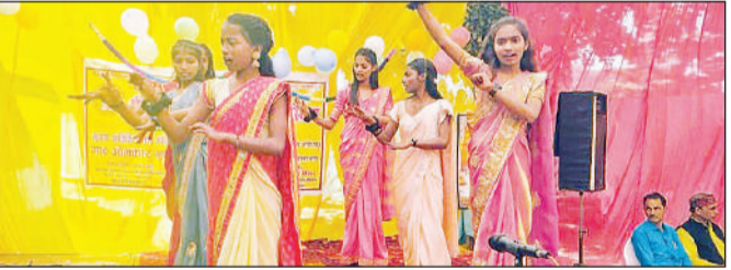
विद्यालय में आयोजित वार्षिकोत्सव कार्यक्रम में सांस्कृतिक प्रस्तुतियां देती छात्राएं ।