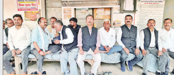
क्रमिक अनशन पर बैठे अधिवक्ता।