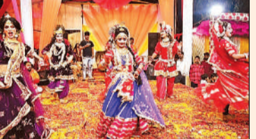
भजन के दौरान कार्यक्रम पेश करते कलाकार।