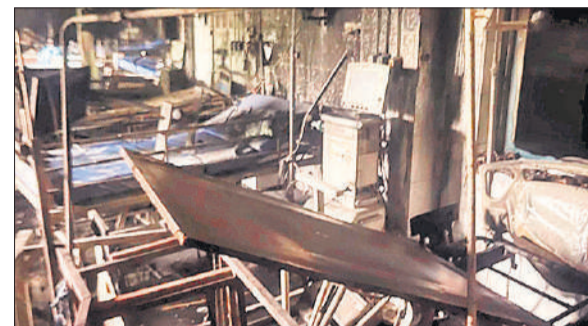
एससीबी मेडिकल कॉलेज एवं अस्पताल के आईसीयू में जला पड़ा सामान।