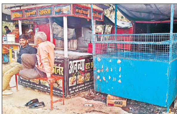
रोडवेंज के निकट सिलेंडर न मिलने के कारण बंद दुकानें।