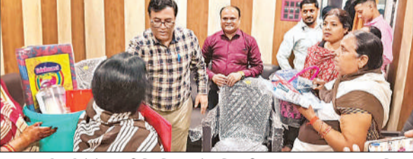
आशा कार्यकर्ताओं में सामग्री वितरित करते अधिकारी। अमृत विचार

अमृत विचार। ग्रामीण क्षेत्रों में मातृ एवं शिशु स्वास्थ्य सेवाओं की रीढ़ माने जाने वाले वीएचएसएनडी सत्रों को अब और अधिक प्रभावी व सुदृढ़ बनाया जा रहा है। सत्रों में संसाधनों की कमी को दूर करने के लिए सीएमओ की विशेष पहल पर ग्राम स्वास्थ्य, स्वच्छता एवं पोषण समिति फंड का उपयोग किया गया है। इसके तहत जिले की आशा कार्यकर्ताओं को 17 प्रकार की आवश्यक सामग्रियों उपलब्ध कराई गई है, जिससे स्वास्थ्य सेवाओं की गुणवत्ता में सीधा सुधार देखने को मिलेगा। डीसीपीएम मो. राशिद ने बताया कि जिले के सभी राजस्व ग्रामों में प्रत्येक माह के बुधवार और शनिवार