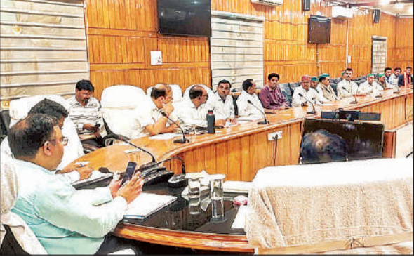
समीक्षा बैठक करते जिलाधिकारी व मौजूद अन्य अधिकारी। अमृत विचार

अमृत विचार। जिले में संचालित योजनाओं के भूमि अर्जन कार्यों की समीक्षा हेतु कलेक्ट्रेट सभागार में आयोजित बैठक की अध्यक्षता करते हुए जिलाधिकारी अक्षय त्रिपाठी ने निर्देश दिया कि बहराइच खलीलाबाद नई रेल लाइन के निर्माण के प्रभावित वृक्षों के नीलामी/कटान रेलवे विभाग द्वारा वननिगम से सम्पर्क कराया जाए और इस कार्य किसी तरह का विलम्ब न हो। उपजिलाधिकारी सदर को निर्देशित किया कि योजना प्रभावित ग्राम समाज के भू-खण्डों के पुर्नग्रहण की कार्यवाही शीघ्र कराई जाए। भारत-नेपाल सीमा पर प्रस्तावित बहुउद्देशीय हब के अर्जन क्षेत्र में प्रभावित परिसम्पत्तियों का मूल्यांकन भूमि अध्यापित अधिकारी को उपलब्ध कराएं, जिससे अधिनिर्णय विलम्बित न हो। जिलाधिकारी ने समीक्षा बैठक में उपजिलाधिकारी कैसरगंज व महसी से अर्जन प्रभावित भूमि स्थलथी स्थिति व प्रभावित कृषकों के मध्य अंश निर्धारण की रिपोर्ट विशेष भूमि अध्यापित अधिकारी को एक सप्ताह में उपलब्ध