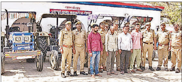
चोरी के ट्रैक्टर के साथ आरोपी।