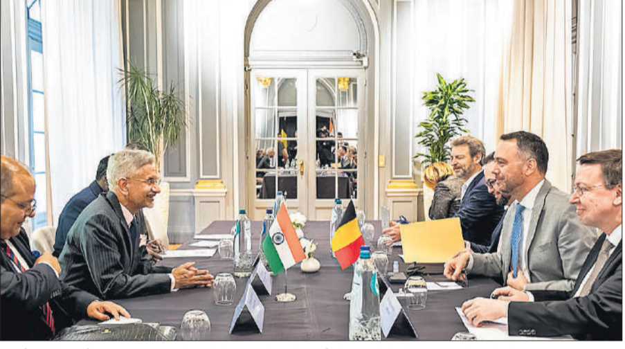
भारतीय विदेश मंत्री एस. जयशंकर ब्रसेल्स में बेलजियम के विदेश मंत्री मैक्सिम प्रेवोट के साथ एक बैठक के दौरान।

मंत्रालय ने कहा कि दक्षिण-पूर्व एशियाई देश फिलीपींस के साथ तरजीही व्यापार समझौते (पीटीए) के लिए बातचीत शुरू होगी, जबकि मालदीव के साथ मुक्त व्यापार समझौते (एफटीए) के लिए बातचीत होगी। पीटीए में दो व्यापारिक साझेदार आपस में व्यापार की जाने वाली वस्तुओं की एक विशिष्ट संख्या पर आयात शुल्क को या तो काफी कम कर देते हैं या समाप्त कर देते हैं। दूसरी ओर, मुक्त व्यापार समझौते (एफटीए) के तहत दो देश आपसी व्यापार में अधिकांश वस्तुओं पर आयात शुल्क को काफी हद तक घटा देते हैं या समाप्त कर देते हैं। इसके साथ ही सेवाओं और निवेश को बढ़ावा देने के लिए नियमों को भी आसान बनाया जाता है।