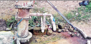
नगर पंचायत जहांगीरगंज में सरकारी हैंडपंपों पर रसूखदारों का अवैध कब्जा ।

अमृत विचार। नगर पंचायत जहांगीरगंज में लगे अधिकांश इंडिया मार्का सरकारी हैंडपंपों पर रसूखदारों का कब्जा होने का मामला सामने आया है। आरोप है कि कुछ लोगों ने इन सरकारी हैंडपंपों में सबमर्सिबल लगाकर पाइप के माध्यम से अपने निजी भवनों में पानी की आपूर्ति शुरू कर दी है, जिससे आम लोगों को पानी भरने और पीने में दिक्कतों का सामना करना पड़ रहा है।