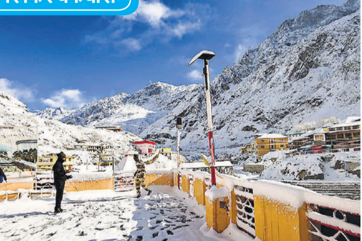
कश्मीर, हिमाचल प्रदेश और उत्तराखंड के पहाड़ ताजा बर्फबारी से बर्फ की सफेद चादर से ढक गए हैं। जहां पर्यटक बर्फबारी के खूबसूरत नजारों का आनंद ले रहे हैं। चमोली के बद्रीनाथ बर्फ से ढकी पहाड़ी।