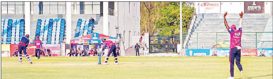
एपीएल टी-20 के रोमांचक मुकाबले में बल्लेबाज की चूक का फायदा उठाते स्टॉमिंग करता विकेट कीपर ।