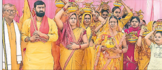
मसौलिया गांव में निकाली गई कलश यात्रा में शामिल महिलाएं व ग्रामीण।