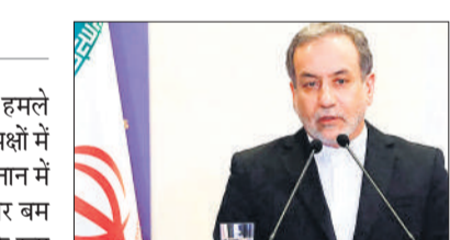
● ब्रिटेन के प्रधानमंत्री बोले- वह पश्चिम एशिया के व्यापक संघर्ष में नहीं शामिल होंगे

ईरान पर अमेरिका-इजराइल के संयुक्त हमले के दो सप्ताह बाद भी सोमवार को दोनों पक्षों में लड़ाई जारी रही। इजराइल ने जहां लेबनान में ईरान समर्थक हिजबुल्ला के ठिकानों पर बम वर्षा की वहीं, ईरान ने जवाबी हमले के रूप में इजराइल के अलावा पड़ोसी देशों में मौजूद अमेरिकी ठिकानों और तेल अवसंरचना को नुकसान पहुंचाने की कोशिश की। ईरान के विदेश मंत्री अब्बास अराघची ने सोमवार को कहा कि होर्मुज मार्ग ईरान के दृष्टिकोण से खुला है, लेकिन उन देशों और उनके सहयोगियों के लिए बंद है जिन्होंने ईरान के खिलाफ कार्रवाईपूर्ण आक्रामकता की है। अराघची ने कहा कि ईरान अपनी रक्षा करने में किसी प्रकार की हिचकिचाहट नहीं रखता और आवश्यकता पड़ने तक युद्ध जारी रखेगा। वहीं, ब्रिटेन के प्रधानमंत्री स्टार्मर ने कहा कि वह ब्रिटेन को प. व्यापक युद्ध में घसीटे जाने की अनुमति नहीं देगा। वह यूरोपीय सहयोगियों से मिलकर खाड़ी को खोलने के लिए एक व्यवहार्य योजना तैयार कर रहे हैं।