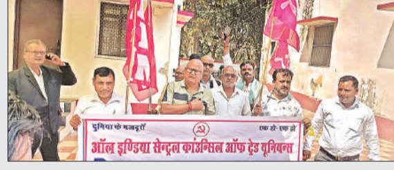
डीएम कार्यालय के सामने प्रदर्शन करते कार्यकर्ता।