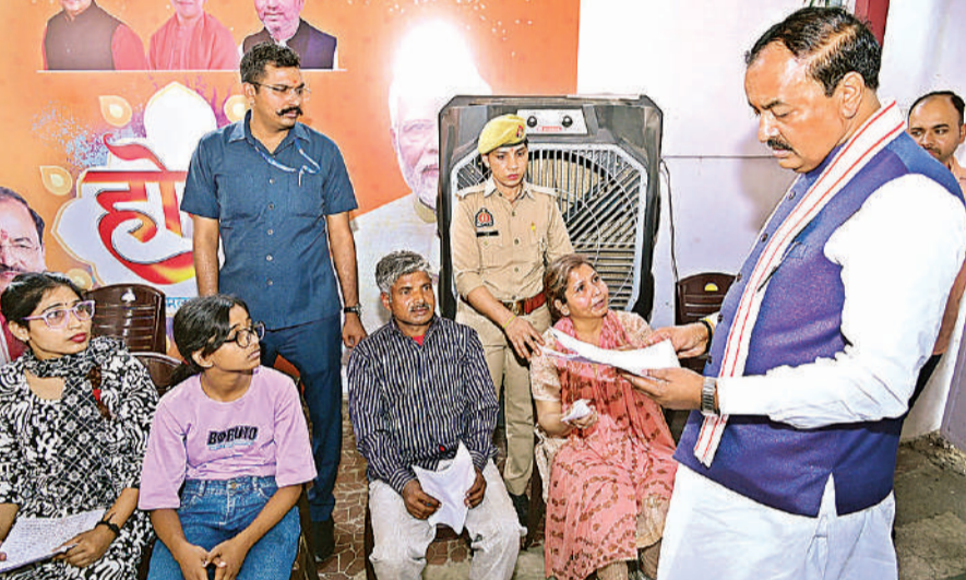
लखनऊ स्थित अपने आवास पर जनता दर्शन कार्यक्रम में फरियादियों की समस्याएं सुनते उप मुख्यमंत्री केशव प्रसाद मौर्य।

सोमवार को पावर कारपोरेशन के प्रवक्ता ने बताया कि बिजली सप्लाई बंद होने के बाद यदि उपभोक्ता बकाए का 50 फीसदी प्रीपेड स्मार्ट मीटर रिचार्ज करता है तो तो कनेक्शन केवल तीन दिनों के लिए पुनः जोड़ दिया जाएगा। प्रवक्ता का कहना है कि यदि इन तीन दिनों के भीतर पूरा बिल नहीं रिचार्ज किया तो दोबारा कनेक्शन कट दिया जाएगा। स्मार्ट मीटरों के प्रमुख लाभों में सटीक बिलिंग, समय से रिचार्ज और मीटर से छेड़छाड़ नहीं करने पर निर्धारित विद्युत टैरिफ पर दो प्रतिशत छूट दी जा रही है।