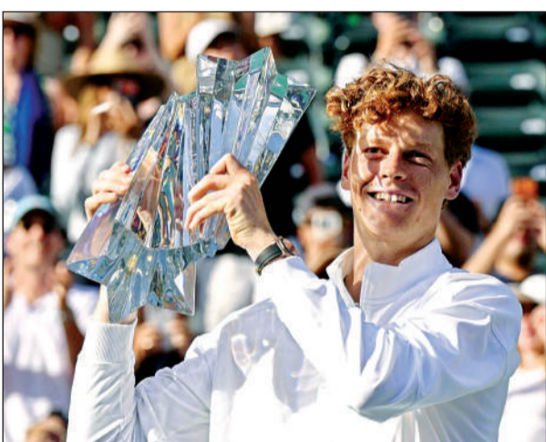
इंडियन वेल्स सिंगल्स खिताब के साथ यानिक सिनर व एरिना सबालेंका।

महिला वर्ग में दुनिया की नंबर एक खिलाड़ी एरिना सबालेंका ने एलेना रिबाकिना को 3-6, 6-3, 7-6 से हराकर खिताब जीता। इससे पहले 2023 और 2025 में उपविजेता रही सबालेंका का यह पहला खिताब है। सिनर ने फेडरर और जोकोविच की बराबरी की : इंडियन वेल्स फाइनल में दानिल मेदवेदेव पर जीत के साथ हार्ड-कोर्ट टूर्नामेंटों का पूरा सेट जीतने वाले सबसे कम उम्र के पुरुष खिलाड़ी बनने के बाद यानिक सिनर ने कहा कि यह मेरे लिए बहुत मायने रखता है। दुनिया के दूसरे नंबर के खिलाड़ी सिनर ने कैलिफोर्निया की तेज गर्मी में, दो घंटे से कुछ कम समय