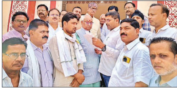
कलेक्ट्रेट में सिटी मजिस्ट्रेट को ज्ञापन सौंपते कांग्रेस जिलाध्यक्ष व अन्य पदाधिकारी।

ज्ञापन के माध्यम से कांग्रेस नेताओं ने प्रदेश में ब्राह्मण समाज के साथ हो रहे कथित भेदभाव और हाल ही में आयोजित यूपी पुलिस भर्ती परीक्षा में पूछे गए विवादित प्रश्न पर कड़ी आपत्ति जताई। साथ ही कहा कि कुछ समय पूर्व प्रयागराज