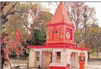
समरथपुर स्थित मां काली मंदिर।