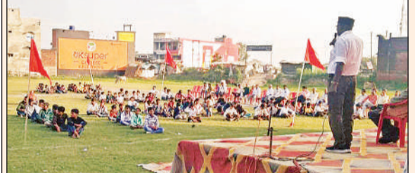
स्वयं सेवकों को संबोधित करते मुख्य अतिथि।