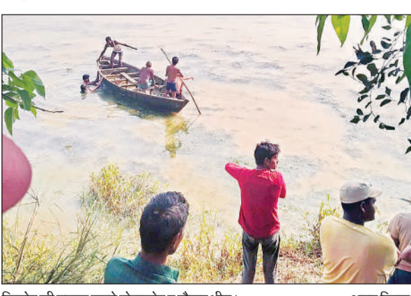
किशोर की तलाश करते गोताखोर व मौजूद भीड़।