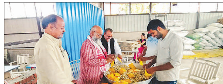
राम मंदिर परिसर स्थित सीता रसोई में तैयार हो रहा प्रसाद।

समारोह में शामिल होने वाले 7000 अतिथि, सुरक्षाकर्मी और कार्यकर्ताओं को विशेष प्रसाद उपलब्ध कराए जाने की तैयारी है। इसके लिए श्रीराम जन्मभूमि तीर्थ क्षेत्र ट्रस्ट सीता रसोई में प्रसाद के 10 हजार डिब्बे बनवा रहा है। इसके अलावा इस दिन मंदिर के दर्शनार्थियों में भी लड्डू और पंजीरी का प्रसाद वितरित किया जाएगा। विश्व हिंदू परिषद के केंद्रीय मंत्री राजेंद्र