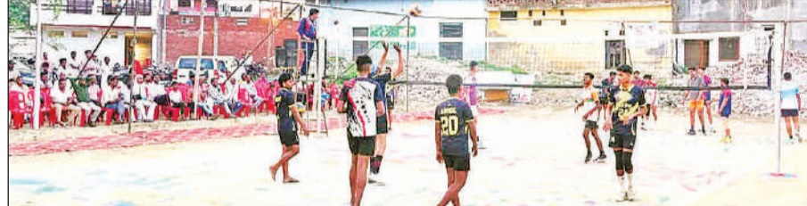
राज्यस्तरीय वॉलीबॉल प्रतियोगिता में खेलते खिलाड़ी ।