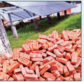
टंकी निर्माण में लगाई जा रही पीली ईट।