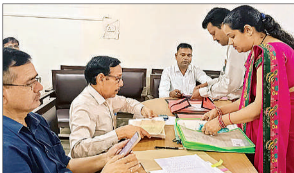
चयनित अभ्यर्थियों के शैक्षिक अभिलेखों की जांच करते खंड शिक्षा अधिकारी।

उच्च प्राथमिक स्कूलों में विज्ञान व गणित विषय के 29334 शिक्षकों की भर्ती के लिए सरकार ने वर्ष 2013 में प्रक्रिया शुरू की थी, लेकिन कई चरणों को काउंसलिंग के बाद भी पद खाली रह गए थे। खाली पदों पर नियुक्ति की मांग को लेकर अभ्यर्थी कानूनी लड़ाई लड़ रहे थे। लंबी कानूनी लड़ाई के बाद सुप्रीम कोर्ट ने 31 दिसंबर 2019 से पहले याचिका दायर करने वाले कटऑफ से अधिक अंक पाने वाले अभ्यर्थियों को 19 मार्च