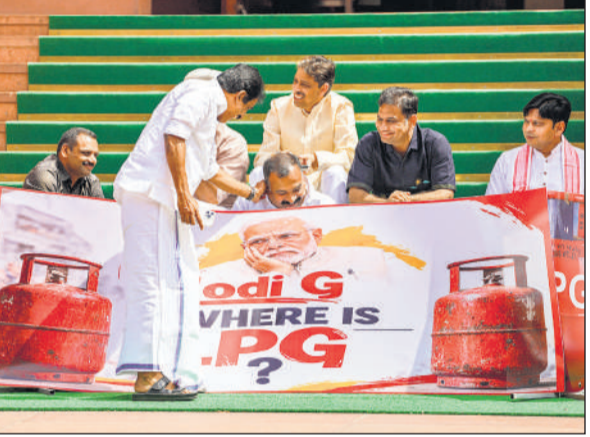
एलपीजी संकट के विरोध में संसद भवन पर विरोध प्रदर्शन करते कांग्रेस सांसद केशी वेणुगोपाल, प्रदर्शन में पार्टी के सांसद हिबी ईडन, प्रशांत पाडोले आदि भी मौजूद थे।

शून्यकाल के दौरान यह मुद्दा उठाते हुए खरगे ने कहा कि पश्चिम एशिया में चल रहे संघर्ष के कारण एलपीजी आपूर्ति पर असर पड़ा है और इसका प्रभाव देशभर में दिखाई दे रहा है। उन्होंने कहा कि इस संकट का सबसे अधिक असर गरीब और कमजोर वर्गों, मध्यम वर्ग, सामान्य परिवारों, रेस्तरां, छात्रावसों तथा व्यावसायिक उपभोक्ताओं पर पड़ रहा है। उन्होंने कहा कि भारत अपनी कुल एलपीजी जरूरत का लगभग 60 प्रतिशत आयात करता है और