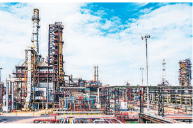
है। इससे साफ है कि देश की रिफाइनिंग जरूरतें अब भी खाड़ी उत्पादक देशों पर काफी हद तक टिकी हुई हैं।

भारत अपनी ऊर्जा जरूरतों के लिए आज भी खाड़ी देशों पर अत्यधिक निर्भर है। मॉर्गन स्टैनली ने आंकड़ों के जरिए इस जोखिम को स्पष्ट किया है। ब्रोकरेज फर्म ने कहा कि भारत की कुल तेल जरूरतों का बड़ा हिस्सा इसी क्षेत्र से होकर आता है। रिपोर्ट के अनुसार, भारत और चीन की 40-50 प्रतिशत तेल जरूरतें होमुंज जलडमरूमध्य के रास्ते पूरी होती हैं। ऐसे में खाड़ी क्षेत्र में किसी भी तरह की रुकावट एशियाई देशों की ऊर्जा आपूर्ति श्रृंखला के लिए खतरा बन सकती है। रिपोर्ट में यह भी बताया गया कि भारत के कुल कच्चे तेल आयात का करीब 46 प्रतिशत हिस्सा पश्चिम एशिया से आता