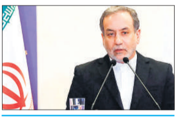
● ब्रिटेन के प्रधानमंत्री बोले- वह पश्चिम एशिया के व्यापक संघर्ष में नहीं शामिल होंगे

ईरान पर अमेरिका-इजराइल के संयुक्त हमले के दो सप्ताह बाद भी सोमवार को दोनों पक्षों में लड़ाई जारी रही। इजराइल ने जहां लेबनान में ईरान समर्थक हिजबुल्ला के ठिकानों पर बम वर्षा की वहीं, ईरान ने जवाबी हमले के रूप में इजराइल के अलावा पड़ोसी देशों में मौजूद अमेरिकी ठिकानों और तेल अवसंरचना को नुकसान पहुंचाने की कोशिश की।