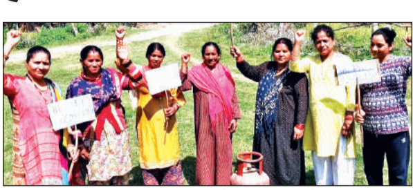
गैस सिलेंडर को लेकर मालधन में प्रदर्शन करती महिला कांग्रेस की सदस्य।

अस इस पर राजनीति भी शुरू हो गई है। सोशल मीडिया के माध्यम से कई जनप्रतिनिधि क्षेत्र में गैस वितरण के लिए वाहन भेजने में अपनी मेहनत का उल्लेख कर रहे हैं, तो कहीं यह बताया जा रहा है कि उनके अधिक प्रयासों से क्षेत्र में घरेलू गैस सिलेंडर वितरण के लिए वाहन भेजा जा रहा