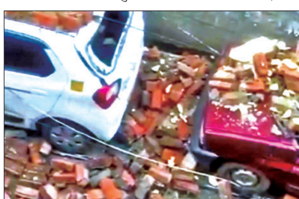
रामनगर में दीवार गिरने से क्षतिग्रस्त कारें। ● अमृत विचार

ग्रामीणों का आरोप है कि घटना के बाद गांव के कुछ लोग सूचना देने के लिए रामनगर स्थित फायर ब्रिगेड कार्यालय पहुंचे, लेकिन वहां मौजूद कर्मचारियों ने संसाधनों की कमी का हवाला देते हुए ग्रामीणों के साथ अश्रद्धा और धक्कापुक्की