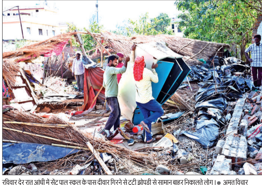
रविवार देर रात आंधी में सेंट पाल स्कूल के पास दीवार गिरने से टूटी झोपड़ी से सामान बाहर निकालते लोग। ● अमृत विचार