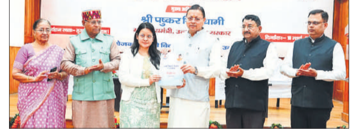
मुख्य सेवक सदन में आयोजित समारोह में नियुक्ति पत्र प्रदान करते मुख्यमंत्री पुष्कर सिंह धामी।

अमृत विचार: मुख्यमंत्री पुष्कर सिंह धामी ने कहा कि प्रदेश के स्थानीय निकाय हमारे शहरों के समग्र विकास के सबसे मजबूत स्तंभ हैं। सफाई निरीक्षक इसकी नींव के पथर हैं।