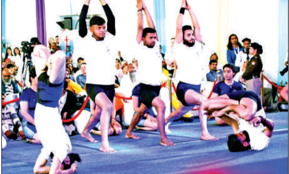
अंतर्राष्ट्रीय योग महोत्सव में योग क्रियाओं का प्रदर्शन करते साधक।