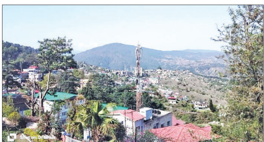
अल्मोड़ा में बारिश के बाद सोमवार को मौसम सुहावना रहा। ● अमृत विचार