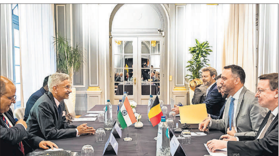
भारतीय विदेश मंत्री एस. जयशंकर ब्रसेल्स में बेलजियम के विदेश मंत्री मैक्सिम प्रेवोट के साथ एक बैठक के दौरान।