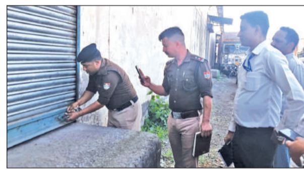
एनसीईआरटी की टीम की मौजूदगी में गोदाम का ताला खोलते पुलिस कर्मी।