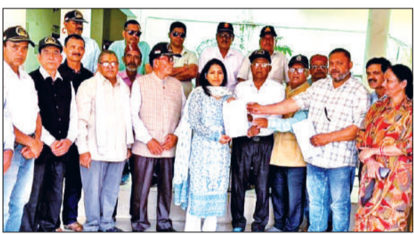
लालकुआं में तहसीलदार को ज्ञापन सौंपते ग्रामीण।