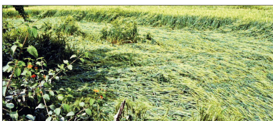
रामपुर रोड स्थित चांदनी चौक गरवाल में रविवार देर रात आए तेज अंधड़ के कारण खेतों में गिरी गेहूं की फसल।

किसानों के अनुसार तेज आंधी के कारण खेतों में खड़ी गेहूं की फसल पूरी तरह बूट गई है। शुरुआती आकलन के मुताबिक गौलापार क्षेत्र में करीब 70 प्रतिशत गेहूं की फसल खराब हो चुकी है। अचानक हुए इस नुकसान से किसानों में भारी निराशा है। आंधी-तूफान का असर फलों की फसलों