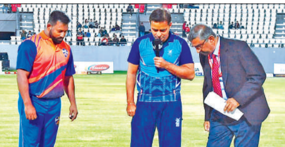
इंडिया कैप्टन्स व सदर्न सुपर स्टार के बीच हुआ छठा मैच।

अमृत विचार: इंदिरा गांधी अंतर्राष्ट्रीय क्रिकेट स्टेडियम में खेले गए लीजेंड्स लीग क्रिकेट (एलएलसी-2026) के छठे मुकामले में सदर्न सुपर स्टार्स ने शानदार प्रदर्शन करते हुए इंडिया कैप्टन्स को आठ विकेट से पराजित कर दिया। अनुशासित गेंदबाजी यमुनोजी, हेमकुंड साहिब और आदि कैलाश यात्रा मार्ग पर निगरानी के लिए उच्चस्तरीय कमेटी गठित करने की मांग की गयी। अदालत ने याचिकाकर्ता को सुझाव को स्वीकार करते हुए गढ़वाल आयुक्त की अगुवाई में कमेटी गठित करने के निर्देश दे दिए।