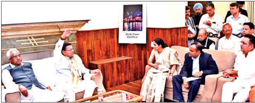
अधिकारियों के साथ कुंभ मेले की तैयारियों की समीक्षा करते मुख्यमंत्री पुष्कर सिंह धामी।

मुख्यमंत्री ने कहा कि कुंभ जैसे विराट आयोजन में किसी भी स्तर पर कोई कमी नहीं रहनी चाहिए। सभी संबंधित विभाग पूरी क्षमता और समन्वय के साथ कार्य करते हुए समयबद्ध तरीके से तैयारियों को पूरा करें। मेला आयोजन से जुड़े सभी हितधारकों, धार्मिक एवं सामाजिक संगठनों तथा साधु-संतों के सहयोग से कुंभ मेले का भव्य और सुव्यवस्थित आयोजन सुनिश्चित किया जाएगा। मुख्यमंत्री ने स्पष्ट किया कि कुंभ से संबंधित कार्यों के लिए धनराशि की कोई