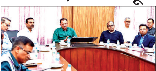
एसआईआर के संबंध में बैठक करते निर्वाचन विभाग के वरिष्ठ अधिकारी।

अमृत विचार: उत्तराखंड में आगामी अप्रैल माह में होने वाले विशेष गहन पुनरीक्षण (एसआईआर) को लेकर मुख्य निर्वाचन अधिकारी डॉ. बीबीआरसी पुरुषोत्तम की पहल पर निर्वाचन विभाग राजस्थान ने उत्तराखंड पहुंचकर अपने अनुभव साझा किए। सोमवार को देहरादून में आयोजित महत्वपूर्ण बैठक में मुख्य निर्वाचन अधिकारी राजस्थान नवीन महाजन ने हाल में ही राजस्थान में सम्पन्न एसआईआर के सम्बंध में विस्तृत प्रस्तुतिकरण