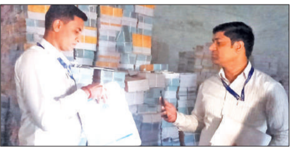
गोदाम में किताबों की जांच करती एनसीईआरटी की टीम।