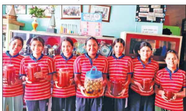
कस्तूरबा गांधी बालिका आवासीय विद्यालय में तैयार किए उत्पाद दिखाती छात्राएं।

अमृत विचार: कस्तूरबा गांधी बालिका आवासीय विद्यालय टनकपुर में फल संरक्षण संस्थान द्वारा छात्राओं के लिए तीन माह का विशेष प्रशिक्षण कार्यक्रम आयोजित किया गया।