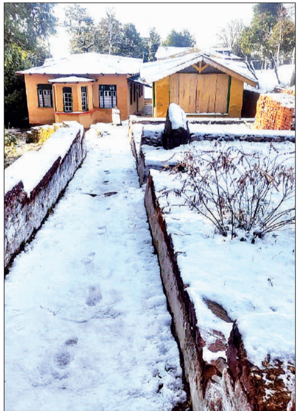
पांडवखोली में गिरी बर्फ का नजारा। ● अमृत विचार

उल्लेखनीय है कि क्षेत्र में शनिवार से ही मौसम बिगड़ने लगा था। रविवार सुबह करीब नौ बजे से रिमडिम बारिश शुरू हो गई थी, जिससे मौसम ठंडा हो गया। रविवार को भी दिनभर रुक-रुक कर बारिश होती रही और शाम को मूसलाधार वर्षा से लोग सकते में आ गए। रात तक बारिश जारी रही और बाद में पांडवखोली क्षेत्र में बर्फबारी शुरू हो गई। पांडवखोली में हुई बर्फबारी से पूरा इलाका बर्फ की चादर में लिपट गया। ठंड बढ़ने के कारण लोगों ने एक बार फिर गर्म कपड़ों का सहारा लेना शुरू कर दिया है।