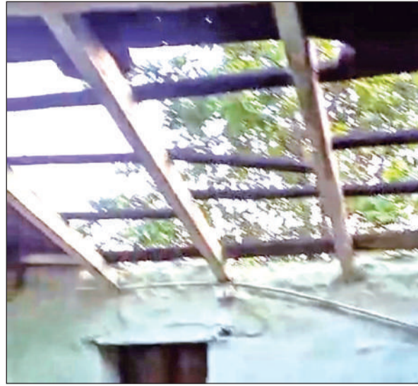
तूफान से चोपड़ा गांव में मकान की उड़ी छत।