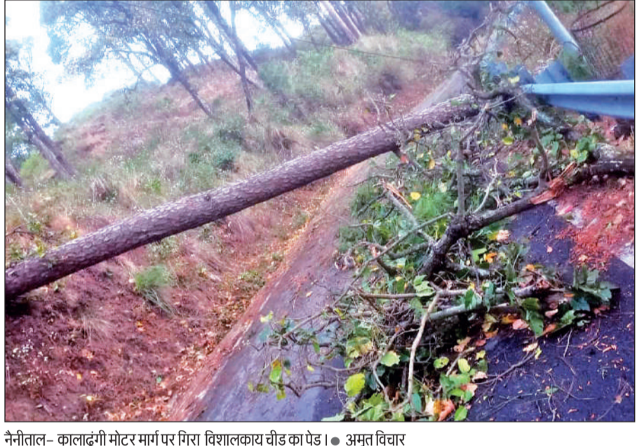
नैनीताल - कालाहूँगी मोटर मार्ग पर गिरा विशालकाय चीड़ का पेड़। ● अमृत विचार

नैनीताल : सरोवर नगरी में बीती रात आंधी तूफान ने जमकर तोंड दिखाया। ओलों की बरसात के साथ पानी भी जमकर बरसा है। तूफान के चलते पेड़ धराशाई हो गए और कई घरों की छतें भी उखड़ गईं। मौसम विभाग के अनुसार अगले दो दिन बाद पुनः आंधी तूफान के साथ मौसम पानी बरसेगा। नगर में बीती रात करीब डेढ़ बजे तेज हवाओं के साथ तूफान शुरू हुआ और करीब 45 मिनट जारी रहा। तूफान की गति करीब 50 प्रति किमी घंटा से अधिक रही। इसके साथ ही बारिश भी शुरू हो गई जो रुक रुक कर सुबह तक जारी रही। इस बीच कई घरों की छतें उखड़ गईं और पेड़ भी धराशाई हो गए। नगर की बत्ती भी गुल हो गई और पूरे दिन गायब रही। दिन में वर्षा तो नहीं हुई लेकिन बादल पूरे दिन डेरा डाले रहे। शाम के समय कुछ देर को धूप के दर्शन हुए। मौसम विभाग देहरादून के मौसम वैज्ञानिक डा रोहित थपलियाल ने बताया कि मंगल को मौसम सामान्य रहेगा, जबकि बुधवार को कुछ क्षेत्रों में हल्की बारिश की संभावना बनी रहेगी। गुरुवार से एक और पश्चिमी विक्षोभ पहुंचने जा रहा है तो आंधी तूफान की आशंका बनी रहेगी। हवा की गति अधिक रहेगी और लाइटनिंग भी होगी। पानी बरसेगा और ओलावृष्टि की संभावना रहेगी। इस विक्षोभ का असर दो दिन बने रहने की संभावना है। नगर में बीती रात 19 मिमी वर्षा रिकार्ड की गई है। मौसम बदलने से ठंड शुरू हो गई है। बरसों में बंद गरम कपड़े निकल आए हैं। जीआईसी मौसम विज्ञान केंद्र के अनुसार अधिकतम तापमान 20 व न्यूनतम 10 डिग्री सेल्सियस रिकार्ड किया गया।