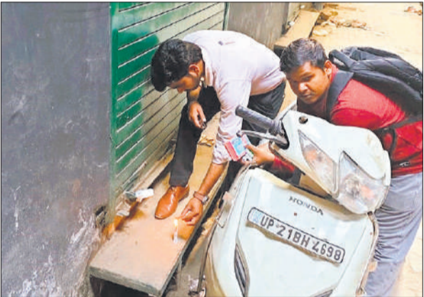
बड़े बकाएदारों के प्रतिष्ठान सील करते नगर निगम कर्मी।