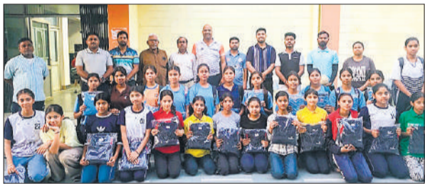
बास्केटबॉल और हैंडबॉल प्रतियोगिता के विजेता व उपविजेता।