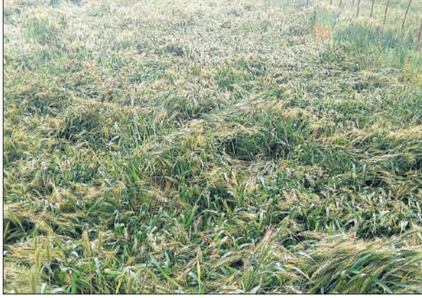
बिलासपुर में आंधी-बारिश से गिरी गेहूं की फसल।

मसवासी, बिलासपुर क्षेत्र सहित जिले के अलग-अलग क्षेत्रों में बीती रात मौसम के बदले मिजाज ने किसानों को चिंता में डाल दिया है। रात्रि करीब एक बजे आई तेज आंधी और बारिश के कारण बिजली व्यवस्था पूरी तरह ठप हो गई, वहीं खेतों में पकने को तैयार खड़ी गेहूं की फसल भी बिस्तर की तरह जमीन पर बिछ गई। फसल की बालियां निकल आने के कारण वजन बढ़ गया था, जिससे तेज हवा