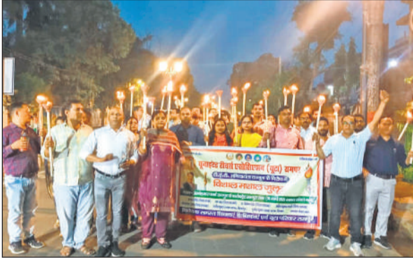
टीईटी अनिवार्यता के खिलाफ मशाल जुलूस निकालते शिक्षक।