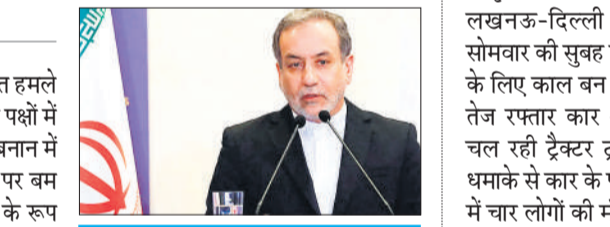
● ब्रिटेन के प्रधानमंत्री बोले- वह पश्चिम एशिया के व्यापक संघर्ष में नहीं शामिल होंगे

ईरान पर अमेरिका-इजराइल के संयुक्त हमले के दो सप्ताह बाद भी सोमवार को दोनों पक्षों में लड़ाई जारी रही। इजराइल ने जहां लेबनान में ईरान समर्थक हिजबुल्ला के ठिकानों पर बम वर्षा की वहीं, ईरान ने जवाबी हमले के रूप में इजराइल के अलावा पड़ोसी देशों में मौजूद अमेरिकी ठिकानों और तेल अवसंरचना को नुकसान पहुंचाने की कोशिश की। ईरान के विदेश मंत्री अब्बास अराघची ने सोमवार को कहा कि होर्मुज मार्ग ईरान के दृष्टिकोण से खुला है, लेकिन उन देशों और उनके सहयोगियों के लिए बंद है जिन्होंने ईरान के खिलाफ कार्रवाईपूर्ण आक्रामकता की है। अराघची ने कहा कि ईरान अपनी रक्षा करने में किसी प्रकार की हिचकिचाहट नहीं रखता और आवश्यकता पड़ने तक युद्ध जारी रखेगा। वहीं, ब्रिटेन के प्रधानमंत्री स्टार्मर ने कहा कि वह ब्रिटेन को प. व्यापक युद्ध में घसीटे जाने की अनुमति नहीं देंगे। वह यूरोपीय सहयोगियों से मिलकर खाड़ी को खोलने के लिए एक व्यवहार्य योजना तैयार कर रहे हैं।