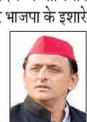
सपा प्रमुख अखिलेश यादव

अमृत विचार, लखनऊ : सपा प्रमुख अखिलेश यादव ने सोमवार को चुनाव आयोग पर भाजपा के इशारे पर काम करने का आरोप लगाया है। उन्होंने जारी बयान में कहा कि भाजपा फर्जी तरीके से प्रिंटेड फार्म-7 और नकली हस्ताक्षरों के जरिए सपा समर्थकों के वोट कटवाने की साजिश कर रही है। पार्टी ने इसकी शिकायत चुनाव आयोग से की, लेकिन अब तक दुनियां पर कोई कार्रवाई नहीं हुई। सपा प्रमुख ने कहा कि जिन राज्यों में भाजपा की सरकार नहीं होती, वहां चुनाव के दौरान डीजीपी और मुख्य सचिव जैसे अधिकारियों को हटा दिया जाता है, जबकि भाजपा शासित राज्यों में ऐसा नहीं होता।