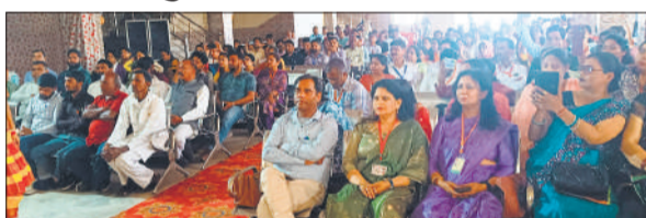
समग्र शिक्षा के तहत संगोष्ठी में शामिल सदस्य।