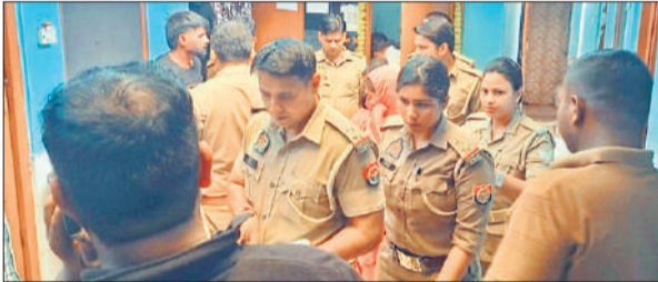
होटल में कार्रवाई के दौरान मौजूद पुलिस।