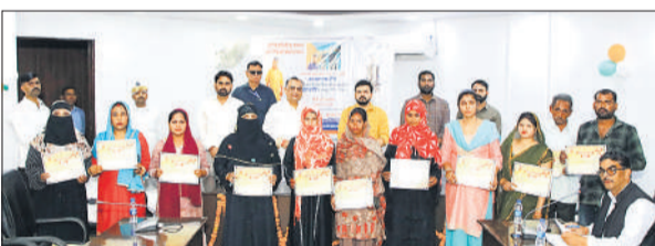
लाभार्थियों को स्वीकृति पत्र देते डीएम और शहर विधायक।