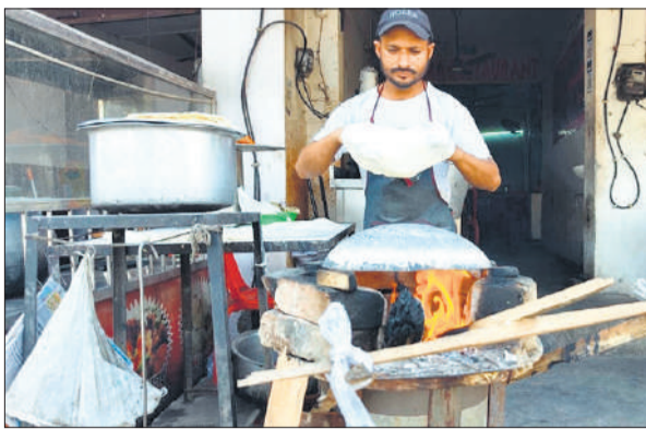
होटल में लकड़ियों के चूल्हे पर रोटी बनाता कारीगर।

गैस के लिए एजेंसियों पर लोगों की भीड़ लगी हुई है। लोगों का कहना है चार-चार दिन में भी गैस नहीं मिल रही है। गैस बुक कराने के