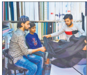
कपड़ा पसंद करते लोग।