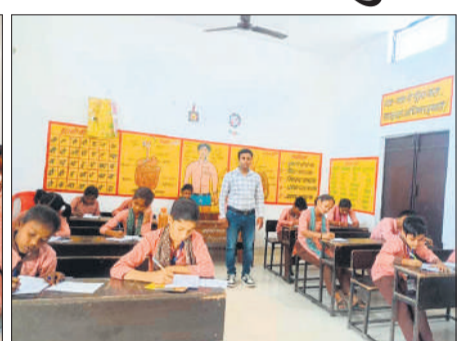
कांट में परीक्षा देते छात्र-छात्राएं।