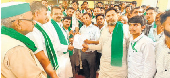
चंदौसी तहसील में तहसीलदार को ज्ञापन देते भाकियू नेता।