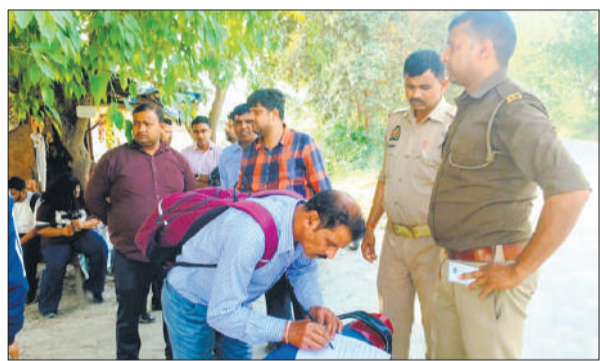
पोस्टमार्टम हाउस पर पुलिस को जानकारी देते मृतक डीएस रावत के परिजन।

हादसे के बाद घटनास्थल के आसपास के लोगों में मनकरा मोड़ पर पहले भी होने वाले हादसों में मरने वालों की दिनभर चर्चा होती रही। लोगों का कहना था कि इस मोड़ पर अब तक हादसे में कई मौते हो चुकी हैं। गांव वालों ने हादसे के बाद जाम लगाकर प्रशासन से कई बार पहले भी यहां सर्विस रोड बनाने की मांग की थी।