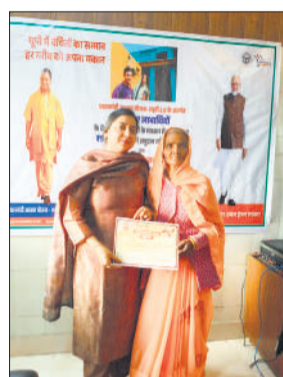
महिला को स्वीकृत पत्र देती ईओ।

सोमवार को पालिका सभागार में प्रधानमंत्री शहरी आवास योजना के तहत प्रदेश के 90 हजार लोगों को अनुदान राशि का अंतरण किया गया। मुख्यमंत्री योगी आदित्यनाथ के क्लिक द्वारा अनुदान राशि की प्रथम किस्त का हस्तांतरण ऑनलाइन मोडिंग के माध्यम से हुआ। इस मौके पर पालिका की अधिशासी अधिकारी ने बिलारी के कुल 247 लाभार्थियों खाते में पहुंची पहली किस्त के प्रमाण