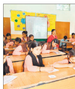
जूनियर हाई स्कूल में वार्षिक परीक्षा देते छात्र-छात्राएं।

कक्षा 1 से 5 तक के विद्यार्थियों की सभी विषयों की मौखिक परीक्षा आयोजित की गई, जबकि कक्षा 6 से 8 तक की परीक्षा दो पालियों में संपन्न हुई। प्रथम पाली में बेसिक क्राफ्ट, संबंधित कला, कृषि तथा गृह शिल्प विषय की परीक्षा आयोजित की गई, जबकि द्वितीय पाली में खेल एवं शारीरिक शिक्षा तथा स्काउटिंग विषय की परीक्षा कराई गई। परीक्षा को सुचारु और निष्पक्ष रूप से संपन्न कराने