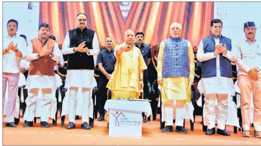
लखनऊ के इंदिरा गांधी प्रतिष्ठान में आयोजित कार्यक्रम में रिमोट दबाकर पीएम आवास योजना के लाभार्थियों के लिए किस्त जारी करते सीएम योगी (साथ में मंत्रिमंडल के उनके सहयोगी)।

अमृत विचार: मुख्यमंत्री योगी आदित्यनाथ ने सोमवार को प्रधानमंत्री आवास योजना-शहरी 2.0 के तहत प्रदेश के 90 हजार लाभार्थियों के खातों में डीबीटी के माध्यम से 900 करोड़ रुपये की पहली किस्त जारी की। इस अवसर पर उन्होंने कहा कि प्रदेश में किसी गरीब को बिना आवास के नहीं रहने दिया जाएगा। जिन माफियाओं ने वर्षों तक गरीबों का हक छीना और जमीनों पर कब्जा किया, अब उन्हीं जमीनों को मुक्त करकर गरीबों के लिए घर बनाए जाएंगे। मुख्यमंत्री ने स्पष्ट किया कि सरकार का लक्ष्य केवल मकान देना नहीं, बल्कि गरीबों को सम्मानजनक जीवन उपलब्ध कराना है।