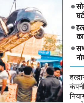
दुर्घटनाग्रस्त कार को क्रेन से हटवाती पुलिस।