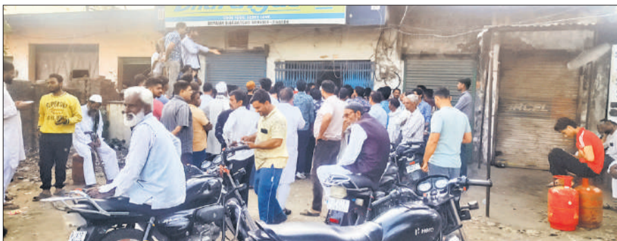
भावना भारत गैस एजेंसी पर सिलेंडर लेने के लिए लगी भीड़।