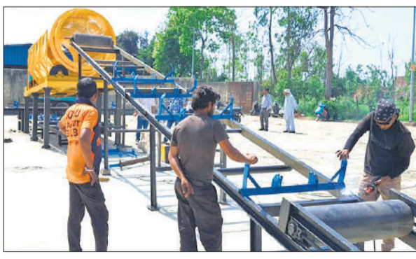
बिलासपुर में कूड़ा निस्तारण की मशीन लगाते मैकेनिक।