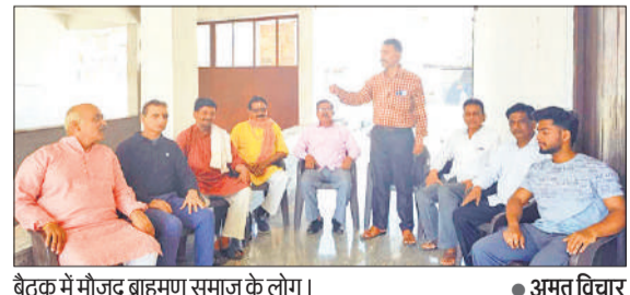
बैठक में मौजूद ब्राह्मण समाज के लोग।