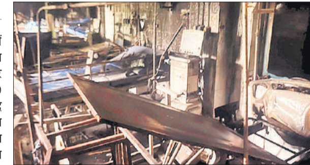
एससीबी मेडिकल कॉलेज एवं अस्पताल के आईसीयू में जला पड़ा सामान।

ओडिशा सरकार द्वारा कटक में संचालित एससीबी मेडिकल कॉलेज एवं अस्पताल के आईसीयू में रविवार देर रात भीषण आग लगने से 10 मरीजों की मौत हो गई। घटना के बाद अस्पताल पहुंचे मुख्यमंत्री मोहन चरण माझी ने बताया कि मरीजों को सुरक्षित बाहर निकालने के दौरान अस्पताल के करीब 11 कर्मचारी झुलस गए। मुख्यमंत्री ने छह सदस्यों की एक जांच टीम बनाई है, जो आग लगने की वजह की जांच करेगी और आज शाम तक अपनी रिपोर्ट देगी।