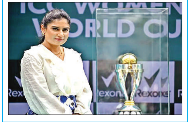
मिताली राज, पूर्व भारतीय महिला क्रिकेट टीम की कप्तान।

खासकर महिला क्रिकेट के कार्यालय का श्रेय बीसीसीआई के पूर्व सचिव और आईसीसी के मौजूदा अध्यक्ष जय शाह को दिया। मैंने महिला क्रिकेट में बदलाव को देखा है और मैं बीसीसीआई और जय सर के सहयोग का जिक्र करना चाहूंगी। पिछले चार पांच साल में भारतीय महिला क्रिकेट में भारी बदलाव आया है और यह एक व्यक्ति के कारण हुआ है। मिताली ने कहा वैश्विक स्तर पर इसके लिये उनका विजन और प्रतिबद्धता। उन्होंने महिला क्रिकेट के विकास के लिये काफी प्रयास किए हैं। बीसीसीआई में शाह के कार्यकाल में महिला और पुरुष क्रिकेटों की समान पैर फीस की शुरुआत हुई और पूरी तरह से पेशेवर महिला प्रीमियर लीग भी शुरू हुई। मिताली ने यह भी कहा कि अपने कैरियर में उन्होंने सचिन तेंदुलकर और द्रविड से काफी प्रेरणा ली। महिला क्रिकेट का अपना सफर रहा है लेकिन हमने पुरुष क्रिकेटों से काफी प्रेरणा ली। मैंने राहुल और सचिन से काफी कुछ सीखा। बीसीसीआई के पूर्व अध्यक्ष और 1983 विश्व कप विजेता टीम के सदस्य रहे बिन्नी ने कहा मैं खुशकिस्मत हूँ कि भारत के लिये खेलने का मौका मिला।