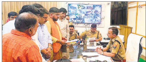
एसएसपी को ज्ञापन देते हिंदुवा के पदाधिकारी व कार्यकर्ता।