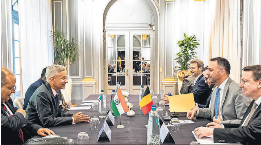
भारतीय विदेश मंत्री एस. जयशंकर ब्रसेल्स में बेलजियम के विदेश मंत्री मैक्सिम प्रेवोट के साथ एक बैठक के दौरान।

दूसरी ओर, मुक्त व्यापार समझौते (एफटीए) के तहत दो देश आपसी व्यापार में अधिकांश वस्तुओं पर आयात शुल्क को काफी हद तक घटा देते हैं या समाप्त कर देते हैं। इसके साथ ही सेवाओं और निवेश को बढ़ावा देने के लिए नियमों को भी आसान बनाया जाता है।