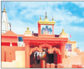
नवरात्र को लेकर काली माता मंदिर पर तैयारी शुरू।