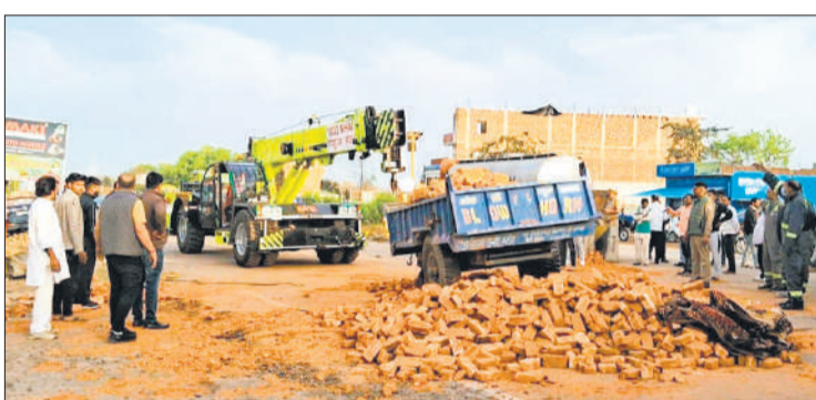
घटनास्थल पर खड़ी ईंट से भरी ट्रैक्टर-ट्रॉली।