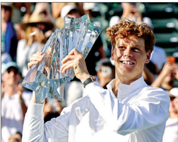
इंडियन वेल्स सिंगल्स खिताब के साथ यानिक सिनर व एरिना सबालेंका।

महिला वर्ग में दुनिया की नंबर एक खिलाड़ी एरिना सबालेंका ने एलेना रिबाकिना को 3-6, 6-3, 7-6 से हराकर खिताब जीता। इससे पहले 2023 और 2025 में उपविजेता रही सबालेंका का यह पहला खिताब है। सिनर ने फेडरर और जोकोविच की बराबरी की: इंडियन वेल्स फाइनल में दानिल मेदवेदेव पर जीत के साथ हार्ड-कोर्ट ट्राफियों का पूरा सेट जीतने वाले सबसे कम उम्र के पुरुष खिलाड़ी बनने के बाद यानिक सिनर ने कहा कि यह मेरे लिए बहुत मायने रखता है। दुनिया के दूसरे नंबर के खिलाड़ी सिनर ने कैलिफोर्निया की तेज गर्मी में, दो घंटे से कुछ कम समय