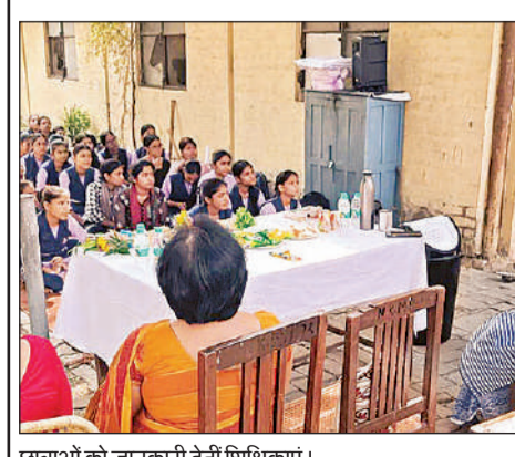
छात्राओं को जानकारी देती शिक्षिकाएं।