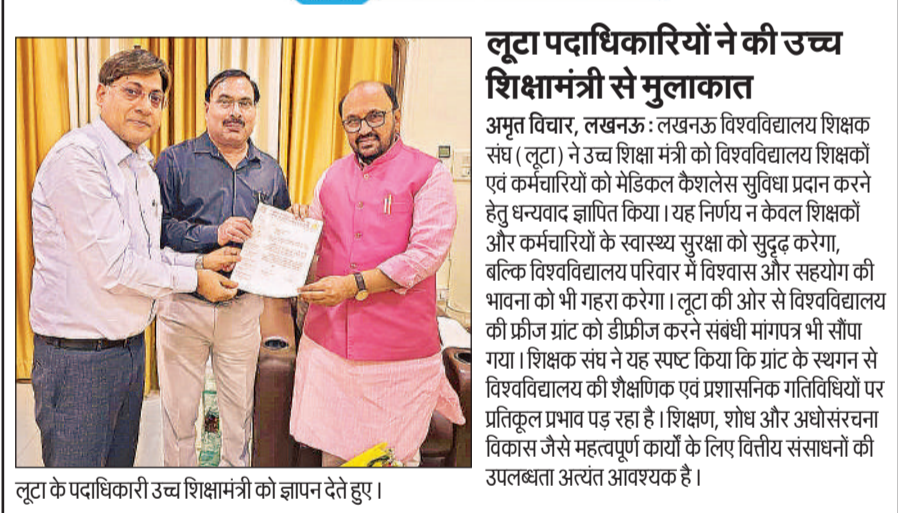
लूटा के पदाधिकारी उच्च शिक्षामंत्री को ज्ञापन देते हुए।