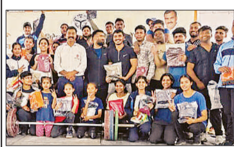
वेदलिटिंग में दमदार प्रदर्शन करने वाले खिलाड़ी।

अमृत विचार, लखनऊ : लखनऊ विश्वविद्यालय शिक्षक संघ (लूटा) ने उच्च शिक्षा मंत्री को विश्वविद्यालय शिक्षकों एवं कर्मचारियों को मेडिकल केशलेस सुविधा प्रदान करने हेतु धन्यवाद ज्ञापित किया। यह गैरिग्य में केवल हासिल और कर्मचारियों के स्वास्थ्य सुरक्षा को सुदृढ़ करेगा, बल्कि विश्वविद्यालय परिवार में विश्वास और सहयोग की भावना को भी गहरा करेगा। लूटा की ये विश्वविद्यालय की प्रीज ग्रंट को डीप्रिज करने संबंधी मांगवर्ष भी सांपा गया। शिक्षक संघ ने यह स्पष्ट किया कि ग्रंट के स्वगन से विश्वविद्यालय की शैक्षणिक एवं प्रशासनिक गतिविधियों पर प्रतिकूल प्रभाव पड़ रहा है। शिक्षण, शोध और अधोसंरचना विकास जैसे महत्वपूर्ण कार्यों के लिए वित्तीय संसाधनों की उपलब्धता अत्यंत आवश्यक है।