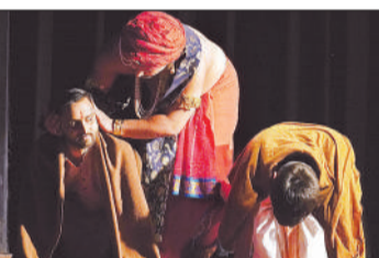
नाटक का मंचन करते कलाकार।