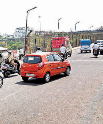
निशातगंज चौराहे पर सीधे निकालने के बजाय वाहनों को घुमाकर निकाला जा रहा

● निशातगंज चौराहे पर सिक्करबाग की ओर से आने वाले वाहनों से होता टकराव