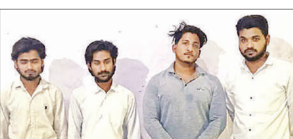
पुलिस की गिरफ्त मरीजों की दलाली करने वाले।