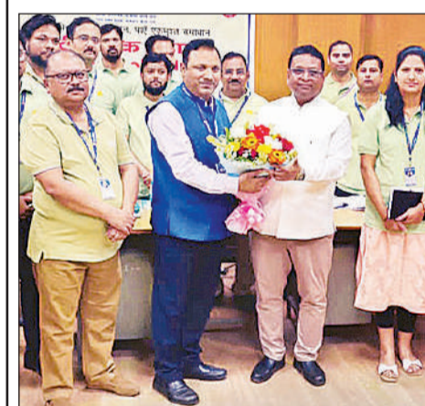
बैंक अधिकारी को गुलदस्ता देते कर्मचारी।