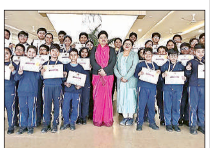
पदक और गोल्ड जीतने वाले सीएमएस छात्र।