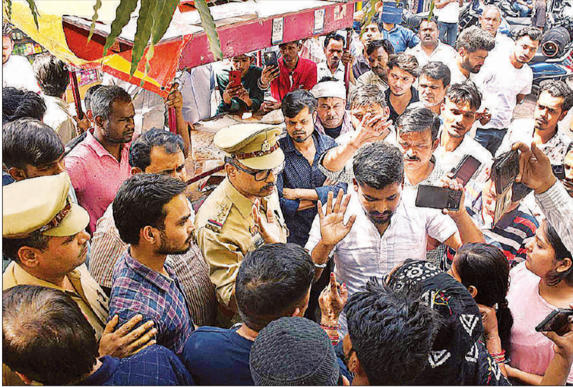
गोमती नगर विराम खंड के देवा पैलेस स्थित गोमती भारतगैस एजेंसी के बाहर हंगामा करने उपभोक्ताओं को समझाते पुलिसकर्मी।