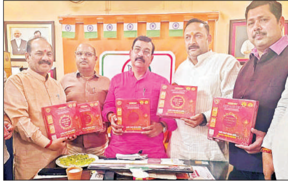
नववर्ष किट के साथ भारतीय नववर्ष महोत्सव समिति के पदाधिकारी।