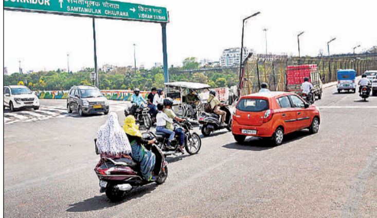
निशातगंज चौराहे इस तरह निकलते हैं ग्रीन कॉरिडोर से आने वाले वाहन।

● हनुमान सेतु चौराहे पर सीधे निकालने के बजाय वाहनों को घुमाकर निकाला जा रहा