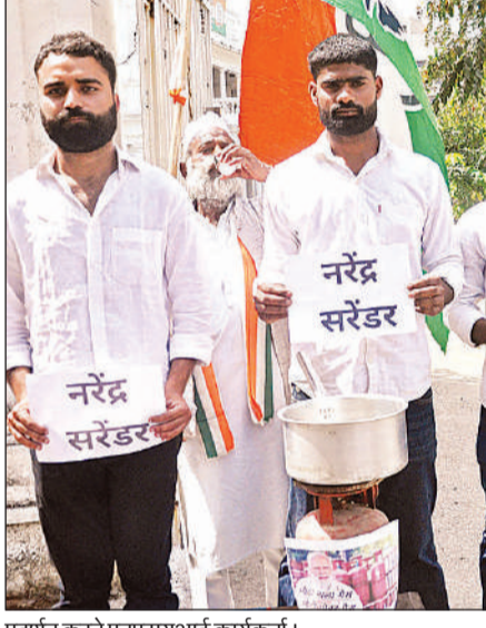
प्रदर्शन करते एनएसयूआई कार्यकर्ता।

अमृत विचार, लखनऊ : देशभर में चल रही एलपीजी गैस सिलेंडर की कमी और कालाबाजारी के विरोध में भारतीय राष्ट्रीय छात्र संगठन ने कांग्रेस प्रदेश मुख्यालय पर प्रदर्शन किया। इस दौरान उन्होंने नाली से गैस बनाने का नाटक कर विरोध प्रदर्शन किया। साथ ही गैस सिलेंडर नहीं मिलने को लेकर सहकारी को दोषी बताया। साथ ही लोगों को हो रही परेशानी पर भी गंभीर चिंता व्यक्त की।