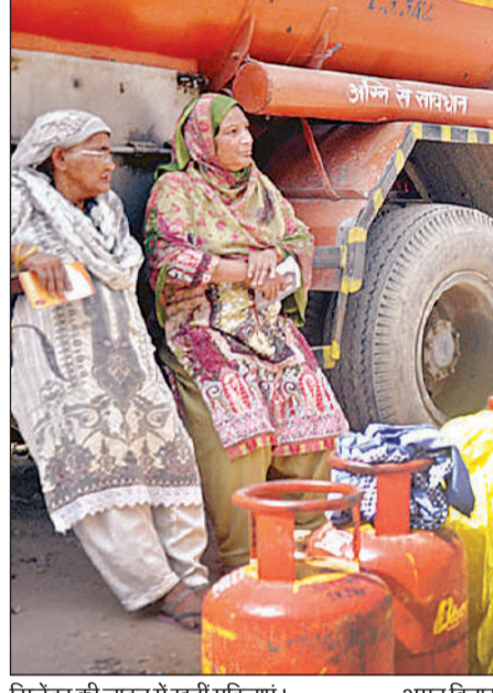
सिलेंडर की लाइन में खड़ी महिलाएं।