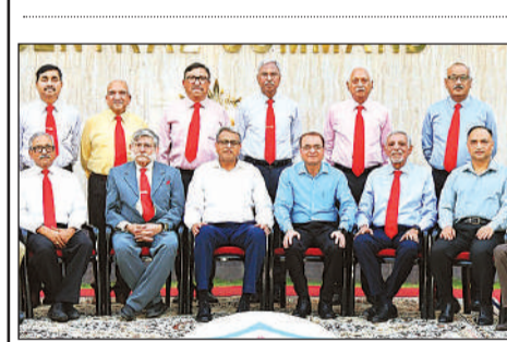
कार्यक्रम के दौरान उपस्थित सेना के उच्च अधिकारी।