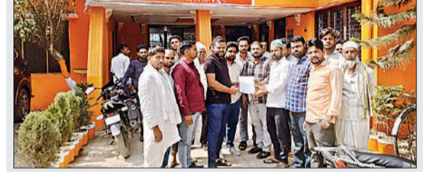
अधिशासी अधिकारी को ज्ञापन सौंपते किसान युनियन के पदाधिकारी व कार्यकर्ता।

कूला पर कब्जे के विरोध में किसानों का प्रदर्शन