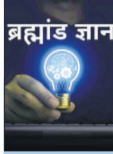
ब्रह्मांड ज्ञान ब्लॉगर

इसके पीछे का असली विज्ञान हमारे दिमाग के 'कंडीशनिंग' पैटर्न में छिपा है। जब किसी व्यक्ति के अतीत में खुशी के ठीक बाद कोई दुःख घटना घटी होती है, तो उसका मस्तिष्क खुशी और दर्द के बीच एक गलत संबंध बना लेता है। दिमाग को लगने लगता है कि खुशी दरअसल आने वाली किसी मुसीबत का संकेत है। मनोवैज्ञानिक इसे एक सुरक्षा तंत्र की तरह देखते हैं, जहां इंसान खुद को आने वाले संभावित दुःख से बचाने के लिए खुश होने से ही कतारने लगता है।