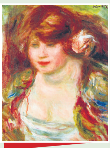
प्रकाश और छाया के मिश्रण

यह कलाकृति, प्रसिद्ध इंप्रेशनिस्ट चित्रकार पियरे-अगस्त रेनॉयर ने 1919 में बनाई थी। यह कैनवस पर तैल रंगों से बना एक चित्र है, जो इंप्रेशनिस्ट आंदोलन की विशिष्ट तकनीकों और सौंदर्यशास्त्र को दर्शाता है। वर्तमान में, यह पेंटिंग एक निजी संग्रह में रखी हुई है। यह कलाकृति एक महिला का जीवंत और अंतरंग चित्रण है, उसके रंग-रूप को गैम और चमकदार रंगों के मिश्रण से उकेरा गया है, जो इंप्रेशनिज्म की खासियत-को बखूबी पकड़ता है। उसकी नजर थोड़ी हटकर है, जो आत्म-चिंतन के एक गहन क्षण को दर्शाती है। उसके बालों में एक गुलाब सजा है, जिसे बड़ी कलात्मकता से लगाया गया है। ब्रश स्ट्रोक डीला और अभिव्यंजक हैं, जिससे रंग सीधे कैनवस पर ही आपस में घुल-मिल जाते हैं।