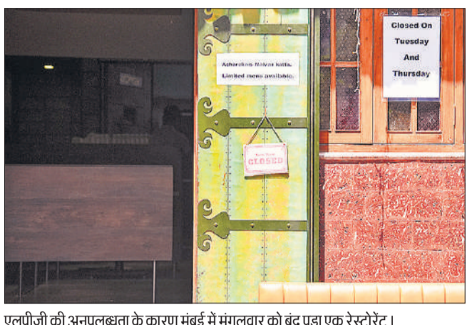
एलपीजी की अनुपलब्धता के कारण मुंबई में मंगलवार को बंद पड़ा एक रेस्टोरेंट।

नई दिल्ली, एजेंसी पश्चिम एशिया में युद्ध के कारण आपूर्ति बाधित होने से देश में रसोई गैस (एलपीजी) की खपत मार्च के पहले पखवाड़े में 17.7 प्रतिशत घट गई। प्रारंभिक उद्योग आंकड़ों के अनुसार मार्च के पहले पंद्रह दिन में एलपीजी खपत घटकर 11.47 लाख टन रह गई जो पिछले वर्ष की समान अवधि के 13.87 लाख टन के मुकाबले 17.3 प्रतिशत कम है। यह फरवरी के पहले पखवाड़े की 15.57 लाख टन मांग से 26.3 प्रतिशत कम है।