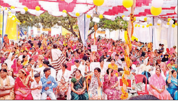
आयोजित कार्यक्रम में मौजूद महिलाएं।

विशेषज्ञों की टीम ने 350 मरीजों को इंटरनल मेडिकल ओपीडी तथा 240 सामान्य मेडिकल ओपीडी में जांच की। इसके अलावा 42 किशोर-किशोरियों का स्वास्थ्य परीक्षण भी किया गया। स्वास्थ्य मेले में 43 पुरुषों को परिवार नियोजन पर विशेष परामर्श दिया गया, जबकि महिला और पुरुष मिलाकर 50 लाभार्थियों को परिवार नियोजन साधनों के प्राथ परामर्श उपलब्ध कराया गया। पात्र लाभार्थियों के 33 आयुष्मान गोल्डन कार्ड भी बनाए गए। मेले में राष्ट्रीय ग्रामीण आजीविका मिशन की स्वयं सहायता समूह की महिलाओं, समूह सखी और स्वास्थ्य सखियों ने बढ़-चढ़कर भाग लिया।