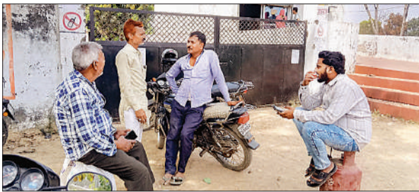
गैस एजेंसी पर सिलेंडर मिलने का इंतजार करते उपभोक्ता।

शिवांग इंडियन गैस एजेंसी पर सिलेंडर की किल्लत