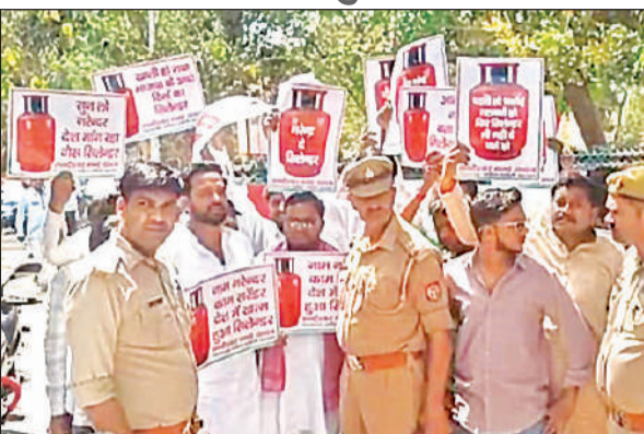
सिलेंडर की किल्लत को लेकर प्रदर्शन करते सपा कार्यकर्ता।