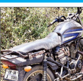
हादसे के बाद शक्तिप्रस्त बाइक।

अनियंत्रित होकर पेड़ से टकरा गई। हादसे में दोनों गम्भीर रूप से घायल हो गए। सूचना पर पहुंची पुलिस जब तक उन्हें इलाज के लिए अस्पताल भेजती उनकी मौत हो चुकी थी। वहीं हादसे की सूचना के बाद परिजनों में कोहराम मचा हुआ है।