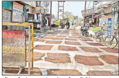
सीएचसी सोहावल को जाने वाली नवनिर्मित सड़क।