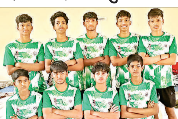
प्रतियोगिता के लिए चयनित खिलाड़ी।

अमृत विचार। राज्यस्तरीय फुटबॉल प्रतियोगिता के लिए मंडलीय टीम में बहराइच जनपद के आठ जूनियर खिलाड़ियों का चयन किया गया है ये खिलाड़ी खेल निदेशालय उत्तर प्रदेश एवं प्रदेश फुटबॉल संघ के तत्वधान में आयोजित राज्य स्तरीय समन्वय जूनियर बालक फुटबॉल प्रतियोगिता में प्रतिभाग करेंगे। इस प्रतियोगिता का आयोजन प्रयागराज के मदन मोहन मालवीय स्टेडियम में 17 मार्च से 24 मार्च तक किया जा रहा है। इस प्रतियोगिता में प्रदेश भर से 18 मंडलों की चयनित टीमें प्रतिभाग करेंगी। खेले इंडिया फुटबॉल के कोच विनोद कुमार ने बताया कि राज्य स्तरीय फुटबॉल प्रतियोगिता के लिए जनपद के खेले इंडिया कैम्प में प्रशिक्षण प्राप्त कर रहे आठ खिलाड़ियों का चयन मंडलीय टीम में किया गया है। ये सभी खिलाड़ी प्रयागराज के मदन