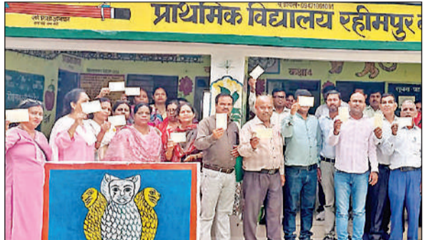
प्राथमिक विद्यालय में टीईटी को लेकर प्रदर्शन करते आक्रोशित शिक्षक।