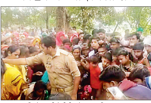
बालक का शव मिलने पर ग्रामीणों की भीड़ को समझता पुलिस का जवान।