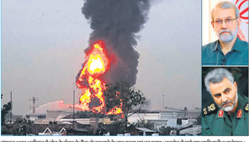
संयुक्त अरब अमीरात में ड्रोन के इंधन के टैंक से टकराने के बाद उड़ता धुं का गुबार। इनसेट में मारे गए लारीजानी व सुलेमान।

चीन की बड़ी पहल ईरान, लेबनान व पड़ोसी देशों को इमरजेंसी मानवीय मदद की घोषणा इजराइली सेना ने ईरान के कई शहरों पर किए हमले