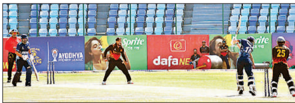
एपीएल टी-20 के रोमांचक लीग मुकाबले में यमुना सुपर किंग्स के बल्लेबाज को बॉल्ड मारता बेतवा ब्लास्टर का गेंदबाज।