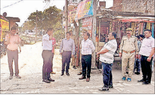
चैत्र नवरात्र मेले की फुल ड्रेस तैयारी रिहर्सल का जायजा लेते डीएम और अन्य।

अमृत विचार : 19 मार्च से प्रारंभ हो रहे चैत्र नवरात्र मेले की तैयारियों को अंतिम रूप देने के लिए जिलाधिकारी विपिन कुमार जैन ने मंगलवार को तुलसीपुर स्थित आदिशक्ति मां पाटेश्वरी शक्तिपीठ देवीपाटन मंदिर परिसर में फुल ड्रेस रिहर्सल कर व्यवस्थाओं का जायजा लिया। इस दौरान उन्होंने मेला क्षेत्र का भ्रमण करते हुए सुरक्षा, यातायात, साफ-सफाई और श्रद्धालुओं की सुविधाओं से जुड़ी व्यवस्थाओं की विस्तृत समीक्षा की।