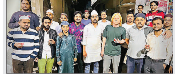
शब-ए- कद्र पर अमन चैन और सलामती की दुआ करते लोग।