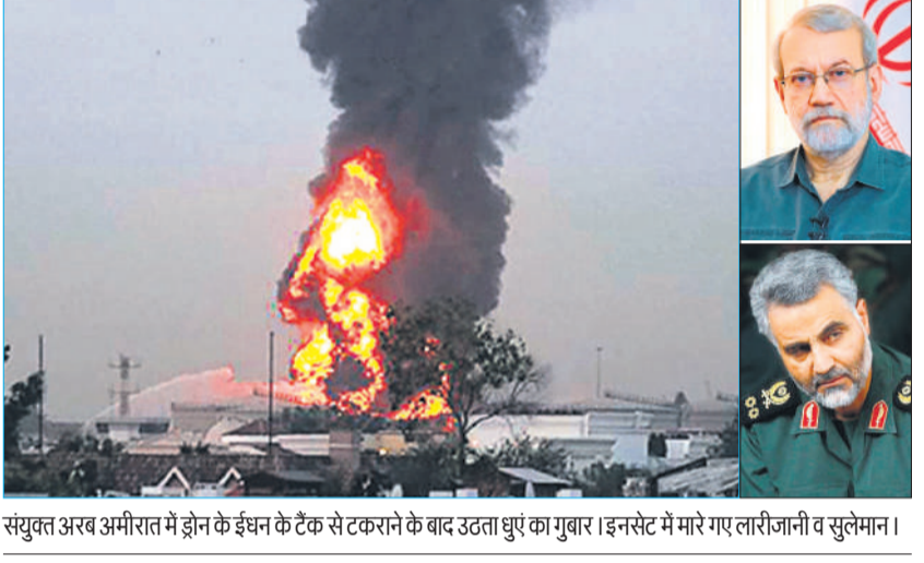
संयुक्त अरब अमीरात में द्रोण के ईंधन के टैंक से टकराने के बाद उड़ता धुं का गुबार। इनसेट में मारे गए लारीजानी व सुलेमान।

चीन की बड़ी पहल ● ईरान, लेबनान व पड़ोसी देशों को इमरजेंसी मानवीय मदद की घोषणा ● इजराइली सेना ने ईरान के कई शहरों पर किए हमले यरुशलम/दुबई/बीजिंग, एजेंसी