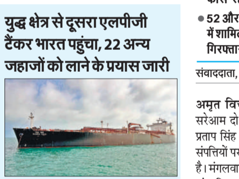
युद्ध क्षेत्र से दूसरा एलपीजी टैंकर भारत पहुंचा, 22 अन्य जहाजों को लाने के प्रयास जारी