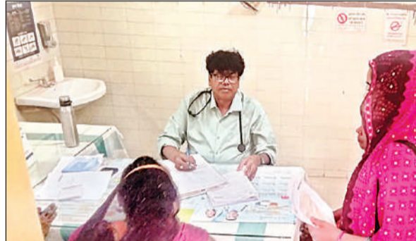
बिना एनेन ड्रेस के महिला मरीज का उपचार करते चिकित्सक।