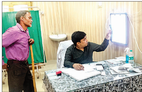
जिला अस्पताल में बिना एनेन पहने मरीजों को परामर्श देते चिकित्सक।

संवाददाता, रायबरेली अमृत विचार। जिला पुरुष चिकित्सालय जहां हर गरीब और जरूरतमंद अपनी आखिरी उम्मीद लेकर पहुंचता है। लेकिन जब यहां पर उसी उम्मीद का गला घोट दिया जाए, तो यह सिर्फ लापरवाही नहीं, बल्कि संवेदनहीनता की पराकाष्ठा बन जाती है। मौजूदा हालात यही बयान कर रहे हैं कि सीएमएस की सूस्त और कमजोर कार्यशैली ने पूरे सिस्टम को बेलगाम कर दिया है। यहां अब नियम नहीं, बल्कि कदम-कदम पर मनमानी चल रही है। जिसका खामियाजा यहां आने वाले मरीजों और तीमारदारों को भुगतना पड़ रहा है। जिला अस्पताल में चार्ज संभालने के बाद से अब तक सीएमएस न तो डॉक्टरों को एनेन पहनाने में सफल हो पाए हैं, और न ही बेलगाम हो चुके डीटी स्वास्थ्य कर्मियों पर लगाम कस सके हैं। नतीजा यह है कि जिला अस्पताल में अनुशासन मजबूत बन चुका है। अमृत विचार की पड़ताल में मंगलवार को जिला अस्पताल में डॉक्टर अपनी कुर्सी पर एनेन टांगकर मरीजों को परामर्श देते नजर आए। यह दृश्य सिर्फ अव्यवस्था नहीं, बल्कि उस जिम्मेदारी का अपमान है जिसे निभाने की शपथ ली गई है। सबसे ज्यादा दर्दनाक तस्वीर उन मरीजों की है जो घंटों लाइन में खड़े रहते हैं। अंततः यह मुश्किल डगर पार करने के बाद जब उनका नंबर आता है तो हट्टी रोग विशेषज्ञ