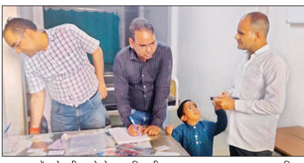
अस्पताल में छापेमारी करते नोडल अधिकारी।

बताते चलें कि कस्बे सहित समूचे कटियारी इलाके में अवैध रूप से संचालित तमाम मेडिकल