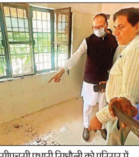
सीएचसी प्रभारी सिधौली को परिसर में पसरी गंदगी को दिखाते उप मुख्यमंत्री।