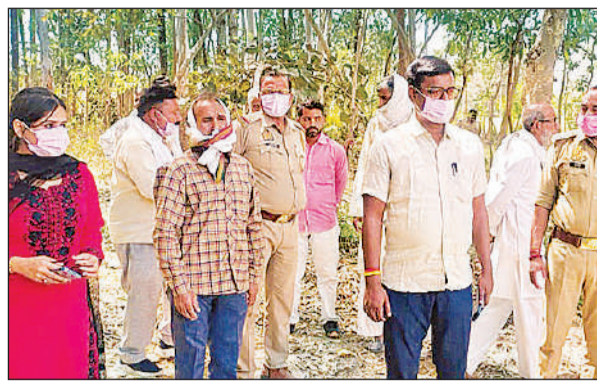
शुक्लापुर गांव में शव निकलवाते नायब तहसीलदार व पुलिस टीम।