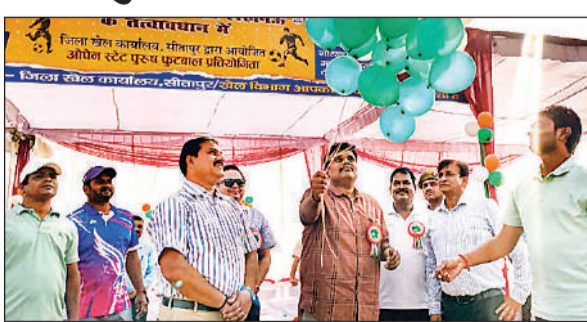
कार्यालय संवाददाता, सीतापुर।