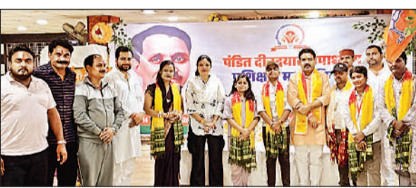
कार्यक्रम के दौरान उपस्थित जिलाध्यक्ष व अन्य।