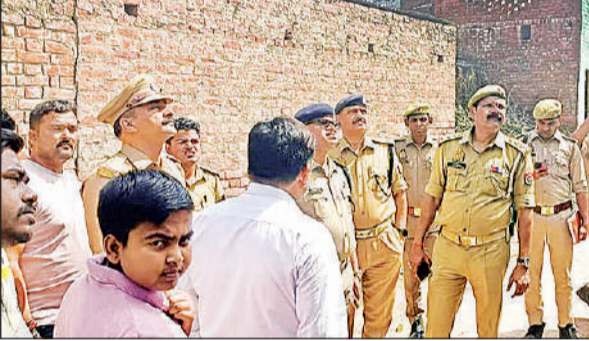
मौके पर मामले की जांच करती पुलिस।