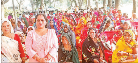
कार्यक्रम में उपस्थित ग्रामीण।