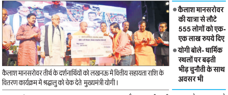
कैलाश मानसरोवर तीर्थ के दर्शनार्थियों को लखनऊ में वित्तीय सहायता राशि के वितरण कार्यक्रम में श्रद्धालु को चेक देते मुख्यमंत्री योगी।

ईयू नहीं देगा अमेरिका के साथ, कहा- ये हमारी लड़ाई नहीं, ट्रंप नाराज वॉशिंगटन। अमेरिकी राष्ट्रपति ट्रंप ने अपने सहयोगी देशों की आलोचना करते हुए कहा है कि हॉर्मुज स्ट्रेट मार्ग को सुरक्षित करने के लिए उन्होंने जिस गठबंधन का प्रस्ताव रखा है, उसके प्रति सहयोगियों में उत्साह की कमी है। ट्रंप ने सोमवार देर रात ओवल ऑफिस में कहा कि ईरान के साथ संघर्ष जल्द ही खत्म हो सकता है। उन्होंने यह भी चेतावनी दी कि इस हफ्ते किसी समाधान की संभावना कम है। उन्होंने इस सैन्य अभियान का बचाव करते हुए कहा कि ईरान को परमाणु हथियार हासिल करने से रोकने के लिए यह जरूरी था। ट्रंप ने कहा, यह अभियान जल्द ही खत्म हो जाएगा। हमारी दुनिया कहीं ज्यादा सुरक्षित होगी। यूरोपीय यूनियन की विदेश नीति प्रमुख काजा कालास ने कहा कि यूरोप के देशों में हॉर्मुज स्ट्रेट में युद्धोत्त भेजे जाने का तैयार नहीं है। कोई भी अपनी जनता को खतरों में डालना नहीं चाहता।