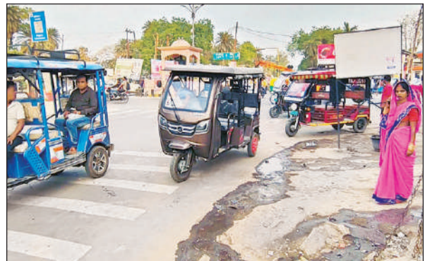
बस स्टॉप वीरहरे पर यात्रियों के इंतजार में खड़े ऑटो चालक।

नहीं पड़ता है। रायबरेली शहर पांच किलोमीटर के क्षेत्र में बसा हुआ है। ऑटो चालक अगर 20 रुपये भी ले रहे हैं तो यह किराया चार रुपये प्रति किलोमीटर हुआ। जबकि लखनऊ और कानपुर जैसे शहरों में ऑटो का किराया एक रुपये प्रति किलोमीटर के लगभग है। पांच