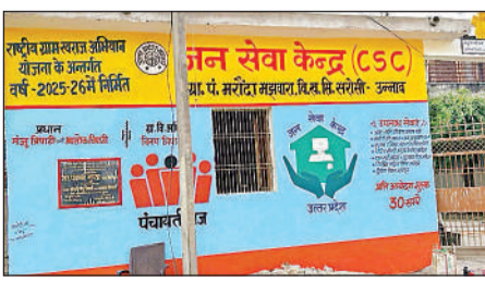
तेयार जनसेवा केंद्र।

परियर उन्नाव, अमृत विचार। विकासखंड सिंकंदरपुर सरासी के गांव मरौंदा मझवारा में जनसेवा केंद्र बनकर तैयार हो गया है। इससे ग्रामीणों में खुशी की लहर है। अब ग्रामीणों को सरकारी सेवाओं जैसे दस्तावेज सत्यापन, बैंकिंग व अन्य ऑनलाइन कार्यों के लिए शहर या तहसील के चक्कर नहीं घाटने पड़ेंगे। गांव में पंचायत भवन में जनसेवा केंद्र खुलने से लोगों को घर के पास ही सभी सरकारी सेवाओं का लाभ मिल सकेगा। यहां आधार अपडेशन, राशन कार्ड, वोटर आईकार्ड, पैनकार्ड, जाति, आय व निवास प्रमाण पत्र, विद्युत बिल