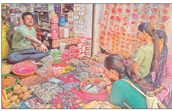
नवरात्र में पूजन सामग्री खरीदती महिलाएं।