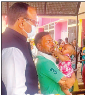
पर्चा काउंटर पर लाइन में खड़े डिप्टी सीएम।