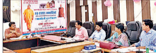
योजनाओं की समीक्षा करते जिलाधिकारी डॉ. राजा गणपति आर.।

जिला पोषण समिति की बैठक में डीएम ने बाल विकास एवं पुष्टाहार विभाग की योजनाओं की गहन समीक्षा की। प्रधानमंत्री मातृ वंदना योजना की धीमी प्रगति पर नाराजगी जताते हुए उन्होंने स्वास्थ्य विभाग से समन्वय कर ब्लॉकवार लक्ष्य को तत्काल पूरा करने को कहा।