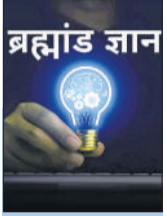
ब्रह्मांड ज्ञान ब्लॉगर

क्या आपको कभी ऐसा महसूस हुआ है कि किसी बहुत अच्छी खबर के मिलते ही मन में एक अजीब सा डर बैठ गया हो? जैसे ही आप खुलकर हंसते हैं, वैसे ही अचानक ख्याल आता है कि कहीं अब कुछ बुरा न हो जाए। विज्ञान की दुनिया में इस स्थिति को 'चेरोफेबिया' कहा जाता है। यह कोई साधारण वहम नहीं, बल्कि एक गहरा मनोवैज्ञानिक डर है।