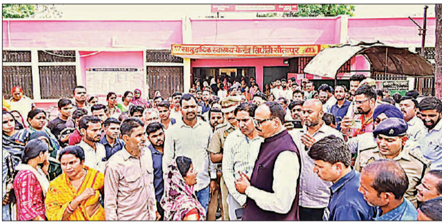
परिसर में आमजन और तीमारदारों से दवाओं की उपलब्धता की जानकारी लेते डिप्टी सीएम। अमृत विचार

बेतुका उत्तर सुन डिप्टी सीएम ने सीएचसी प्रभारी के विरुद्ध तत्काल कार्रवाई के निर्देश दिए। परिसर में पसरी गंदगी को लेकर कहा कि जब तक सफाई नहीं हो जाती, स्टाफ नहीं जाएगा। सवा घंटे के औचक निरीक्षण में दवाओं की उपलब्धता, एक्सरे कक्ष सहित वार्डों का निरीक्षण भी किया गया।