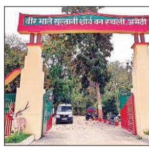
वीर भाले सुल्तानी शौर्य वन स्थली।

अतिक्रमण पर नियंत्रण रखा जा सकेगा। साथ ही पर्यटकों के लिए सुरक्षित और आकर्षक वातावरण तैयार करने के लिए इको कौंटेज, इको कैफेटेरिया, वॉच टॉवर और व्यूइंग डेक का निर्माण किया जाएगा। इसके अलावा ट्रैकबैक पैदल पुल और वॉकिंग ट्रैक भी बनाए जाएंगे, ताकि लोग प्राकृतिक