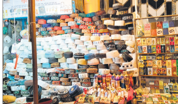
बाजार में इत्र और टोपियों की बेरायटी मौजूद।

अमृत विचार : ईद-उल-फितर नजदीक आते ही शहर के बाजारों में रौनक बढ़ने लगी है। सुबह से ही बाजारों में खरीदारी के लिए लोगों की भीड़ उमड़ने लगी, जबकि शाम ढलते ही कपड़ों, टोपी, इत्र और सेवई की दुकानों पर ग्राहकों की अच्छी-खासी भीड़ दिखाई दी। बाजारों में चहल-पहल बढ़ने से कारोबारियों के चेहरे भी खिल उठे हैं।