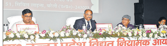
बिजली विभाग की जनसुनवाई में मंवासीन अफसर।