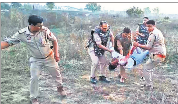
इनकाउंटर के बाद अफसर को उठाकर अस्पताल ले जाते पुलिस कर्मी।