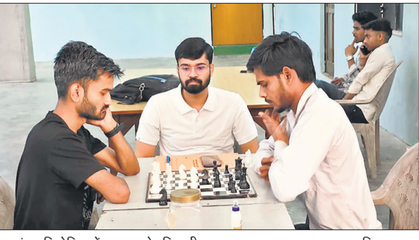
शतरंज प्रतियोगिता में चाल चलते प्रतिभागी।