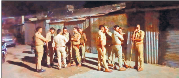
आजम नगर में हंगामे के बाद तैनात पुलिस फॉर्स।

इंद का त्योहार नजदीक है। ऐसे में रोजा इफ्तार के बाद देर रात तक मुस्लिम इलाकों में खरीदारी से लेकर खान-पान की रौनक रहती है। शहर कोतवाली क्षेत्र के आजम