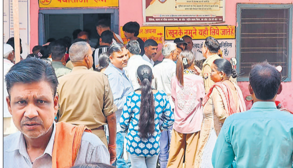
जिला अस्पताल की ओपीडी के बाहर हुए हंगामा करते लोग।

जिला अस्पताल की पैथोलॉजी में मंगलवार को दोपहर के समय मरीजों की भीड़ अधिक थी। इसी दौरान एक युवक रक्त जांच कराने के लिए अंदर चला गया। इस पर स्टाफ ने उसे रोकने का प्रयास किया, जिसको लेकर दोनों पक्षों में कहासुनी शुरू हो गई। आरोप है कि बहस के दौरान स्टाफ ने युवक