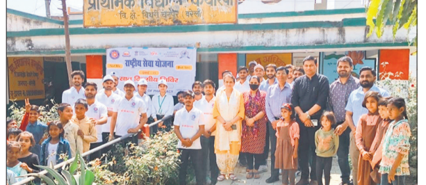
जागरूकता अभियान के तहत स्कूल में मौजूद एनएसएस इकाई-1 की टीम।