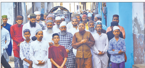
मां-बेटे के जनाजे को दफनाने ले जाते ग्रामीण। ● अमृत विचार