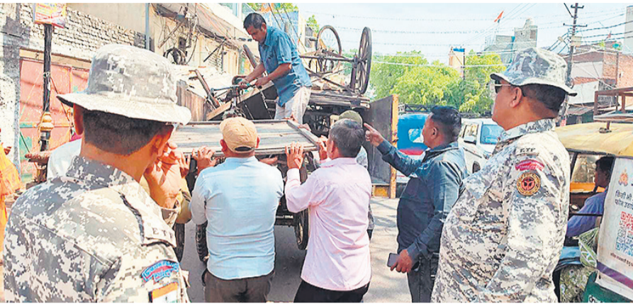
अभियान के दौरान सामान जल करती नगर निगम की टीम।

उधर, बरेली कॉलेज में नैक मूल्यांकन को लेकर तैयारियां अपने