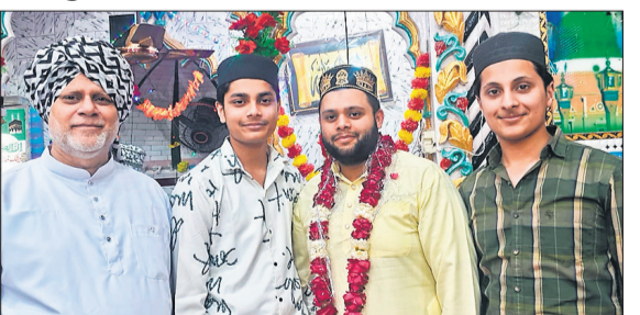
मस्जिद दुलिया बी में कुरआन मुकम्मल के बाद दस्तारबंदी की।