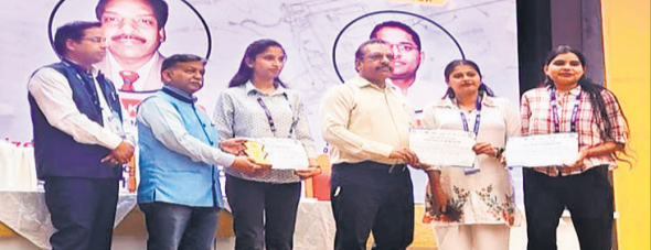
पोस्टर प्रस्तुतिकरण में बीआईयू की छात्राओं को सम्मानित करते अतिथि।

अमृत विचार : बरेली इंटरनेशनल यूनिवर्सिटी के फॉरेन्सिक साइंसेज फैकल्टी के छात्रों ने बुंदेलखंड विश्वविद्यालय में आयोजित दो दिवसीय राष्ट्रीय सेमिनार "डिजिटल फोरेंसिक्स इन फॉरेन्सिक साइंस इन डॉक्ट्रिन क्राइम इन्वेस्टिगेशन (डीडीएफएसएमसी-2026)" में सक्रिय सहभागिता की। इस सेमिनार का मुख्य उद्देश्य फॉरेन्सिक विज्ञान की नवीनतम तकनीकों एवं आधुनिक अपराध