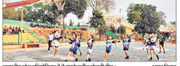
जनपदीय खेल प्रतियोगिताओं में बास्केटबॉल खेलती टीम।