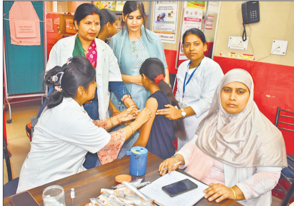
जिला महिला अस्पताल में टीका लगवाती किशोरी।