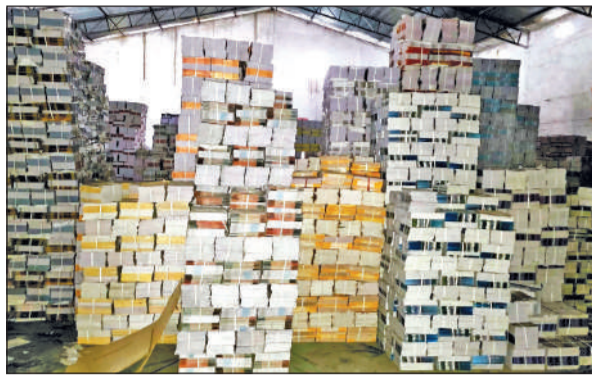
गोदाम में रखा नकली एनसीईआरटी किताबों का जखीरा।