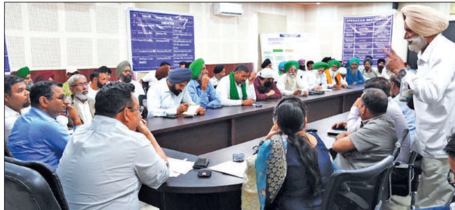
अधिकारियों के समक्ष समस्या रखते किसान। ● अमृत विचार