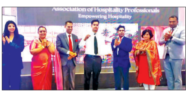
मेडल प्राप्त करते विद्यालय के छात्र।