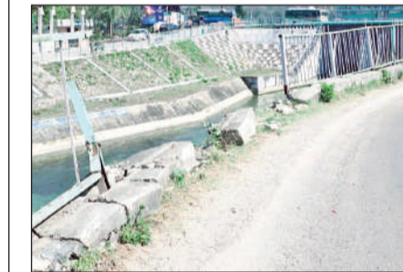
रामनगर में पुल के पास क्षतिग्रस्त रेलिंग।