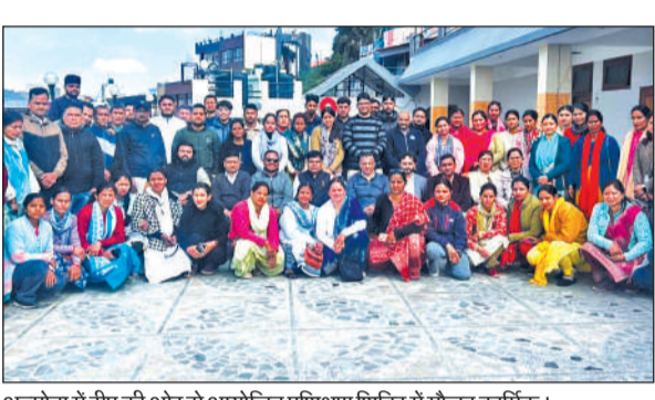
अल्मोड़ा में रीप की ओर से आयोजित प्रशिक्षण शिविर में मौजूद कार्मिक।