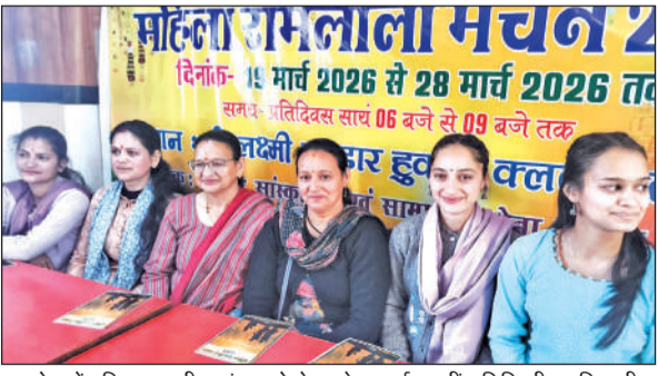
अल्मोड़ा में महिला रामलीला मंचन को लेकर प्रेस वार्ता करती समिति की पदाधिकारी।