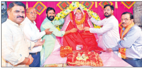
ब्रह्मलीन माता की प्रतिमा पर माल्यार्पण करते अनुयायी।