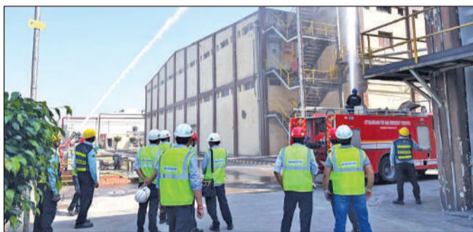
आईजीएल में गैस के रिसाव को नियंत्रण करती आपदा टीम। ● अमृत विचार

जनपद के अलग-अलग क्षेत्रों में विशिष्ट आपदा स्थितियों का सिमुलेशन (यथार्थपरक अनुभव) किया गया। किच्छा के दरउ क्षेत्र में टिड्डी दल से फसलों की सुरक्षा का अभ्यास हुआ,