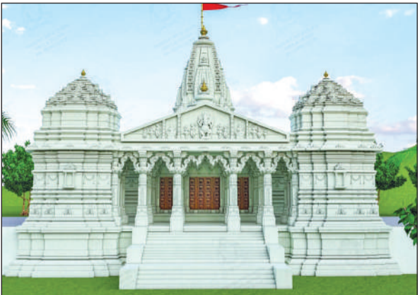
देवीधुरा में मां वाराही के प्रस्तावित मंदिर स्थल का दृश्य।

अमृत विचार: देश के प्रमुख शक्तिपीठों में शामिल देवीधुरा स्थित प्रसिद्ध वाराही धाम में मां ब्रज वाराही का भव्य मंदिर बनने जा रहा है। सदियों पुराने बंगाल मेले के लिए विख्यात इस धाम में मंदिर निर्माण के लिए 20 मार्च को भूमि पूजन किया जाएगा। कार्यक्रम में मुख्यमंत्री पुष्कर सिंह धामी समेत कई बड़ी हस्तियों के शामिल होने की संभावना है। आयोजन को ऐतिहासिक बनाने के लिए व्यापक तैयारियां शुरू कर दी गई हैं।