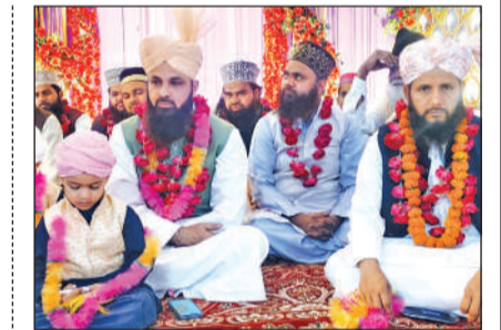
जामा मस्जिद में कार्यक्रम के दौरान मौजूद लोग।