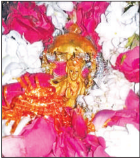
मां बाल सुंदरी माता की प्रतिमा।

नगर जिले के काशीपुर में कुंडेश्वरी मार्ग पर स्थित मां बाल सुंदरी मंदिर 52 शक्तिपीठों में से एक है। माता का यह नाम उनके द्वारा बाल रूप में की गई लीलाओं की वजह से पड़ा है। इसे पूर्व में उज्जैनी एवं उनकी शक्तिपीठ के नाम से भी जाना जाता था। यहां प्रतिवर्ष चैत्र मास की नवरात्रि में चैती मेला लगता है। धार्मिक एवं पौराणिक काल में इसे गोविंदा नाम से भी जाना