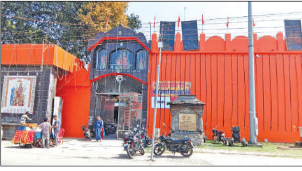
काशीपुर के चैती मैदान में स्थित मां बाल सुंदरी देवी का मंदिर।

महाभारत काल का इतिहास समेटे काशीपुर में मुगल शासक औरंगजेब जैसे मूर्तिभंजक शासक को भी नतमस्मक होना पड़ा था। यहां उज्जैनी शक्तिपीठ के नाम से प्रसिद्ध मां भगवती