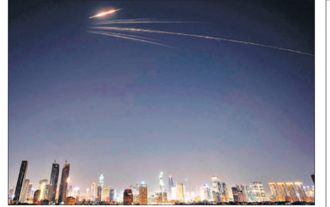
ईरान से दागी गई मिसाइलें बुधवार को मध्य इजराइल के आसमान में तेजी से गुजरीं।

दुबई, एजेंसी ईरान के दो शीर्ष अधिकारी अली लुबारीजानी और जनरल गुलाम रजा सुलेमानी के मारे जाने के बाद बुधवार को पश्चिम एशिया में घमासान और तेज नजर आया। ईरान ने लुबारीजानी की हत्या का बदला लेने के लिए बुधवार को दोनों की मौत की पुष्टि के साथ जवाबी कार्रवाई करते हुए इजराइल पर मिसाइलों की बारिश की, इसमें तेल अवीव के पास दो लोग मारे गए। इसके अलावा, ईरान ने यूएई में ऑस्ट्रेलियाई एयरबेस को भी निशाना बनाया।