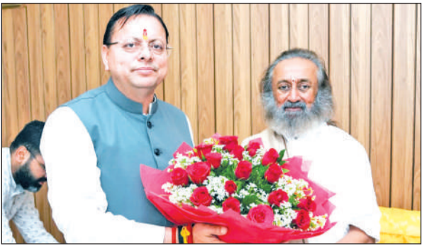
ऋषिकेश में श्री श्री रविशंकर से भेंट करते मुख्यमंत्री पुष्कर सिंह धामी।

हासिल करने के लिए प्रार्थना पत्र लगाया और न ही किसी तरीके से भारत देश की नागरिकता हासिल की और अवैध तरीके से यहां के अवैध दस्तावेज बनाकर सरकारी योजनाओं का लाभ लिया जा रहा है। याचिका के अनुसार, इन लोगों ने वोटर लिस्ट, पैन व आधार कार्ड बनवाकर वोटर लिस्ट में नाम दर्ज करवाकर पानी-बिजली के कनेक्शन भी हासिल कर लिए। इस संबंध में कई बार इसकी शिकायत जिला प्रशासन एवं शासन स्तर पर की गई लेकिन उच्च अधिकारियों द्वारा शिकायत का कोई निराकरण नहीं