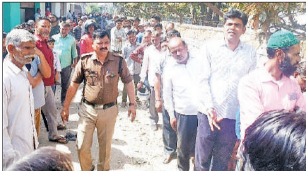
जसपुर में गैस सिलेंडर के लिए लाइन में लगे उपभोक्ता। ● अमृत विचार

लोगों का कहना है कि प्रशासन से लेकर शासन तक रोजाना यही कहा जा रहा है कि कहीं भी गैस