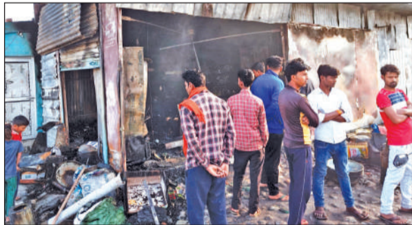
सितारगंज में आग से नष्ट हुआ दुकान का सामान।