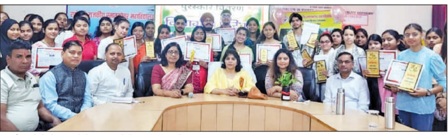
काशीपुर में विजेता छात्रों के साथ अतिथि।