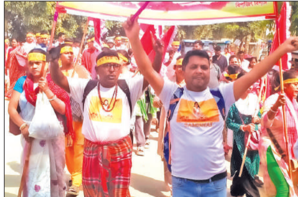
दिनेशपुर में तीन दिवसीय मतुआ महामेला के समापन के बाद पर लौटते अनुयायी।