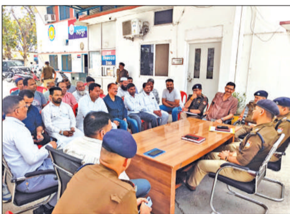
कोतवाली में अमन चैन कमेटी की बैठक में मौजूद अधिकारी व मुस्लिम नेता।

अमृत विचार: खेड़ा बस्ती स्थित इंदगाह पर ईद की नमाज पढ़ने के प्रस्ताव को एक बार फिर अमन चैन कमेटी की बैठक में पुलिस और जिला प्रशासन ने ठुकरा दिया है। उन्होंने कहा कि सरकारी काबिज भूमि पर नमाज पढ़ने की अनुमति नहीं दी जाएगी। जिसको लेकर पहली बार कांग्रेस के जिलाध्यक्ष भी आग बबूला हो गए और उन्होंने अपनी तीखी प्रतिक्रिया भी दी।