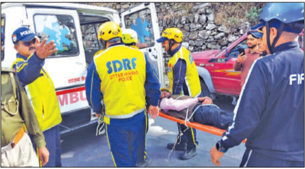
माँक ड्रिल के दौरान एसडीआरएफ कर्मी एक कथित घायल को ले जाते।