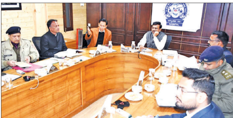
नैनीताल जिले की प्रमुख परियोजनाओं की समीक्षा करते राज्य के मुख्य सचिव आनंद बर्द्धन।

निर्देश दिए कि सभी विभाग मासिक लक्ष्य निर्धारित करें। लॉबि टेंडर, स्वीकृतियों और तकनीकी अनुमोदनों को शीघ्र पूरा करें। डीएम व सीडीओ परियोजनाओं एवं विकास कार्यों की नियमित समीक्षा करें। योजनाओं की प्रगति बढ़ेगी तो राज्य के विकास कार्यों को गति मिलेगी और जनसुविधाओं में भी सुधार होगा। सीएस ने अधिकारियों