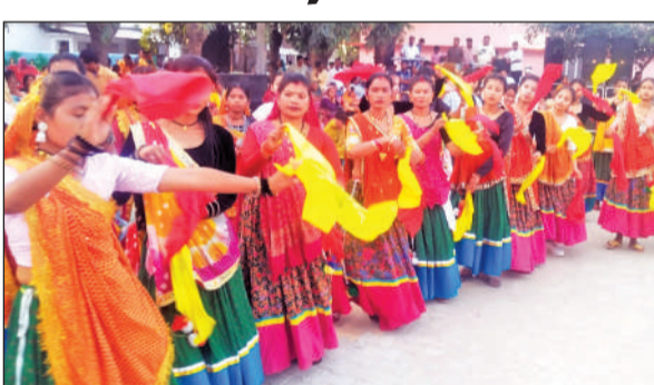
खटीमा में आयोजित होली महा महोत्सव में कार्यक्रम प्रस्तुत करतीं टीमों।

अमृत विचार: थारु होली महा महोत्सव में थारु समाज की परंपरागत होली की धूम रही। जिसमें खटीमा के अलावा नानकमत्ता, सितारगंज क्षेत्र की 70 टीमों ने प्रतिभाग किया। होत्यारों ने राम, कृष्ण, शिव पार्वती एवं विलुप्त टिठोरी होली का ढोल की थाप पर मस्ती के साथ गायन किया। ब्लॉक परिसर में आयोजित समारोह में थारु जनजाति की महिलाओं ने " बिरज में होली मची है खेलत है नन्द लाल...", " केवट की नैय्या आथी रही-धोरे चलिगो गंगा", " दही मथे यशोदा मां- कहैया झूले पालना " आदि बोलों पर परंपरागत