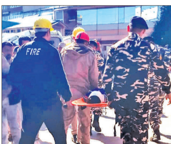
रानीखेत में मॉक ड्रिल के दौरान घायलों को उपचार के लिए ले जाते अग्निशमन कर्मी।

अमृत विचार: हिमालयी क्षेत्र की संवेदनशीलता और संभावित आपदाओं को देखते हुए उत्तराखण्ड सरकार ने भूकंपीय निगरानी तंत्र को मजबूत करने का निर्णय लिया है। इसी क्रम में जनपद अल्मोड़ा में मॉक ड्रिल का आयोजन किया गया। जिलाधिकारी अल्मोड़ा, वरिष्ठ पुलिस अधीक्षक और मुख्य अग्निशमन अधिकारी के निर्देश पर आयोजित इस मॉक ड्रिल के तहत विभिन्न आपदा परिदृश्यों का अभ्यास किया गया। तहसील रानीखेत के नवाब कॉम्प्लेक्स में भूकंप के कारण