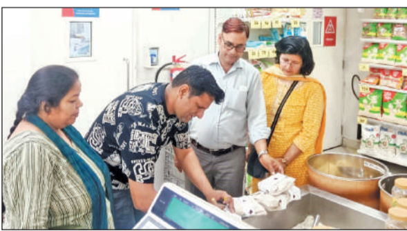
काशीपुर में एक दुकान पर खाद्य पदार्थों का सैंपल लेती टीम।