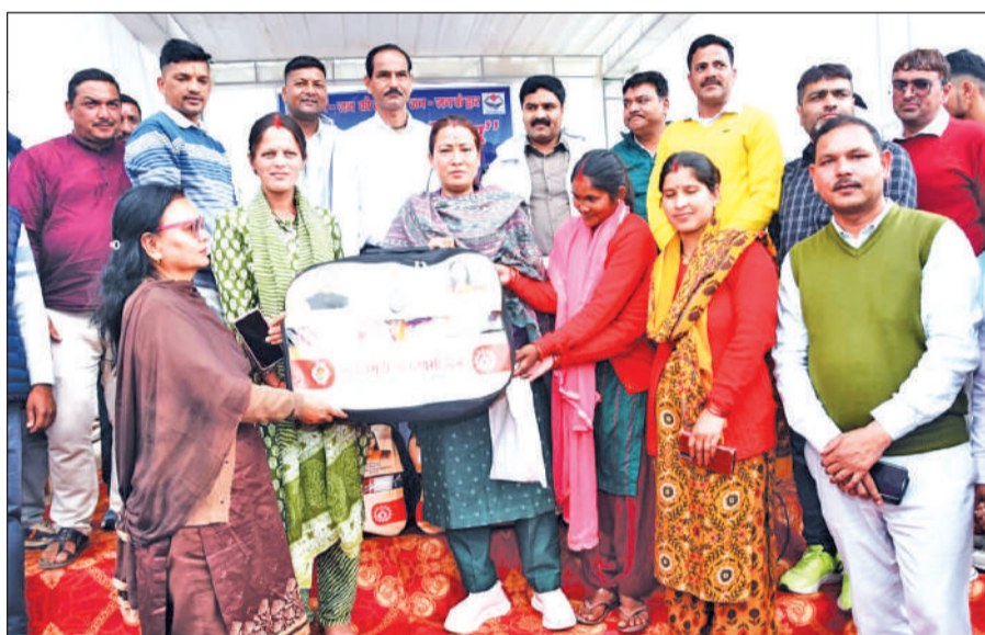
सोमेश्वर में आयोजित शिविर में लाभार्थियों को बांटती मंत्री रेखा आर्या।

शिविर के दौरान कैबिनेट मंत्री ने कहा कि सरकार का उद्देश्य योजनाओं का लाभ अंतिम व्यक्ति तक पहुंचाना है, जिसके लिए इस प्रकार के शिविर प्रभावी माध्यम बन रहे हैं। कहा कि जनता इन शिविरों में अपनी समस्याओं को अधिकारियों व जनप्रतिनिधियों के समक्ष आसानी से रख सकते हैं। कहा कि जनहित और विकास कार्यों से जुड़ी समस्याओं का समाधान करना अधिकारियों का दायित्व है। कहा कि अधिकारी लोगों की समस्याओं को गंभीरता से लें और उनका समाधान करें।