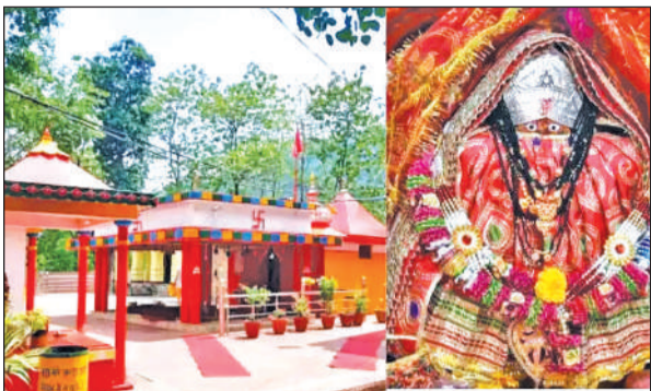
काठगोदाम स्थित शीतला माता मंदिर।

अमृत विचार: चैत्र नवरात्रि के दौरान हल्द्वानी के रानीबाग स्थित शीतला देवी मंदिर आस्था का प्रमुख केंद्र बन जाता है। हर वर्ष नवरात्र में हजारों श्रद्धालु माता के दर्शन के लिए यहां पहुंचते हैं। मान्यता है कि जो भी भक्त सच्चे मन से माता से मुराद मांगता है, उसकी सभी मनोकामनाएं पूर्ण होती हैं। शीतला माता को मां दुर्गा का अवतार माना जाता है और यह मंदिर क्षेत्र का प्रमुख शक्तिपीठ है। खास बात यह है कि माता शीतला को चर्म रोगों से मुक्ति दिलाने वाली देवी के रूप में भी पूजा जाता है। इसी आस्था के चलते स्थानीय लोगों के साथ-साथ दूर-दराज से भी श्रद्धालु बड़ी