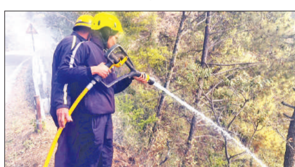
शैल से सटे जंगल में घघकी आग पर फायर सर्विस की टीम ने काबू पाया।