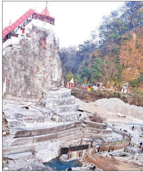
मंदिर के टीले की सुरक्षा के लिए चल रहा निर्माण कार्य। ● अमृत विचार

करोड़ रुपये से अधिक हो गई है। इस संशोधित प्रस्ताव को प्रशासन की मंजूरी मिल चुकी है और उसी के अनुसार कार्य आगे बढ़ाया जा रहा है। कहा कि निर्माण कार्य में पूरी सावधानी बरती जा रही है।