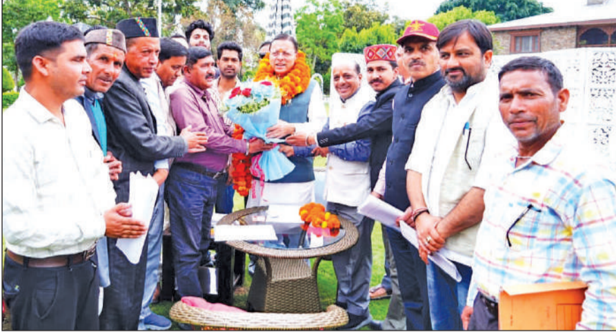
मुख्यमंत्री पुष्कर सिंह धामी का अभिनंदन कर आभार जताते प्रतिनिधि मंडल के सदस्य।

मुख्यमंत्री ने इस अवसर पर कहा कि प्रदेश के सभी क्षेत्रों का विकास हमारा उद्देश्य है। प्रदेश के हर क्षेत्र के गांवों तक सड़क सुविधाओं के साथ अन्य मूलभूत सुविधाओं का विकास किया जा रहा है। उन्होंने क्षेत्रीय जनप्रतिनिधियों से क्षेत्र में विकास योजनाओं के क्रियान्वयन में सक्रिय भागीदारी निभाने की भी अपेक्षा की। इस अवसर पर पूर्व मंडल अध्यक्ष चैन सिंह महर,