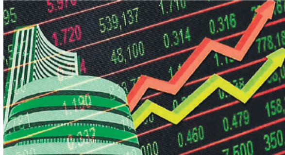
● कच्चे तेल में हल्की नरमी और वैश्विक बाजारों में मजबूती के रुझान से लगातार तीसरे दिन शेयर बाजार में रही तेजी

दूसरी तरफ, नुकसान में रहने वाले शेयर में एनटीपीसी, हिंदुस्तान यूनिटिवर, सन फार्मा और एचडीएफसी बैंक शामिल हैं। जियोजीत इन्वेस्टमेंट्स लि. के शोध प्रमुख विनाय नायर ने कहा कि हाल