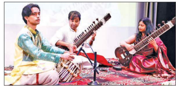
संगीत कार्यक्रम में प्रस्तुति देते कलाकार।

है। जिस कारण नगर के अधिकांश छोटे बड़े होटलों ने डोसा और सांभर जैसे पकवान मेन्यू से हटा दिए हैं और तला हुआ पराठा और भटूरे जैसे व्यंजन भी हटा दिए हैं।