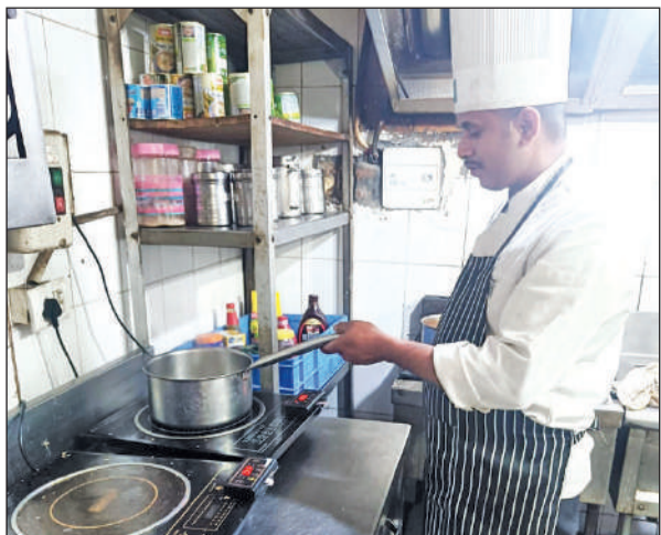
होटल शेरवानी में इंडकेशन पर चयन बनाता कुक।

वर्तमान में नगर में 500 से अधिक होटल और गेस्ट हाउस हैं, जबकि रेस्टोरेंट की संख्या भी 150