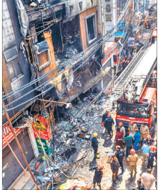
नई दिल्ली के पालम इलाके में बहुमंजिला आवासीय इमारत में लगी आग को कई घंटों की मशकत के बाद बुझाया जा सका।

चैत्र कृष्ण पक्ष अमावस्या 06:53 उपरांत प्रतिपदा विक्रम संवत् 2083