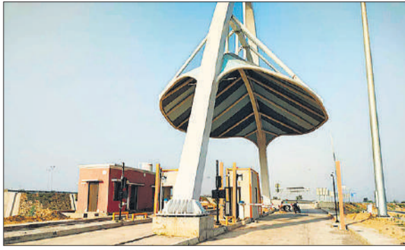
बदायूं के बनकोटा के पास बना पते नुमा आकार का टोल प्लाजा।