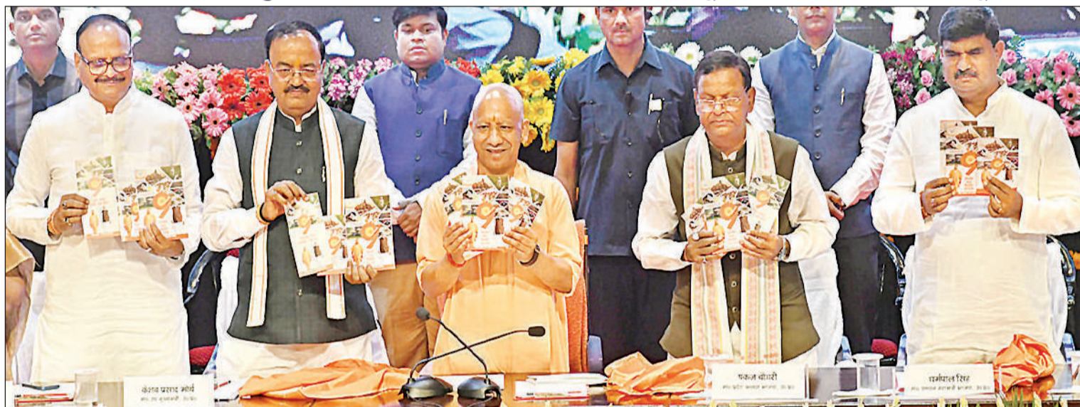
लोक भवन में 'उत्तर प्रदेश में अभूतपूर्व विकास एवं सतत समृद्धि के 9 वर्ष' पर वार्षिक पुस्तक का विमोचन करते मुख्यमंत्री योगी आदित्यनाथ, भाजपा प्रदेश अध्यक्ष पंकज चौधरी, उप मुख्यमंत्री केशव मौर्य और ब्रजेश पाठक व अन्य।

2017 से पहले भ्रष्टाचार व तुष्टिकरण का था दौर, डबल इंजन सरकार ने यूपी को 'बॉटलनेक' से 'ब्रेकथू' में बदला