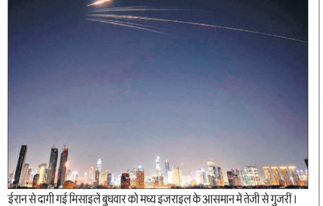
ईरान से दागी गई मिसाइलें बुधवार को मध्य इजराइल के आसमान में तेजी से गुजरतीं।

दुबई, एजेंसी ईरान के दो शीर्ष अधिकारी अली लारीजानी और जनरल गुलाम रजा सुलेमानी के मारे जाने के बाद बुधवार को पश्चिम एशिया में घमासान और तेज नजर आया। ईरान ने लारीजानी की हत्या का बदला लेने के लिए बुधवार को दोनों की मौत की पुष्टि के साथ जवाबी कार्रवाई करते हुए इजराइल पर मिसाइलों की बारिश की, इसमें तेल अवीव के पास दो लोग मारे गए। इसके अलावा, ईरान ने यूएई में ऑस्ट्रेलियाई एयरबेस को भी निशाना बनाया।