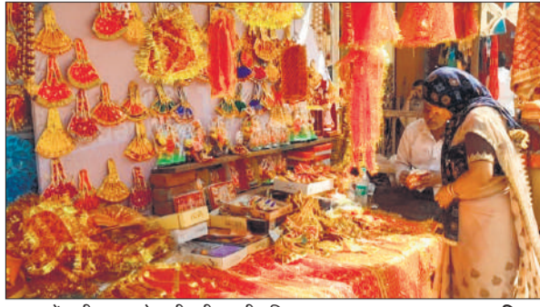
बाजार में लगी दुकान से खरीदारी करती महिला