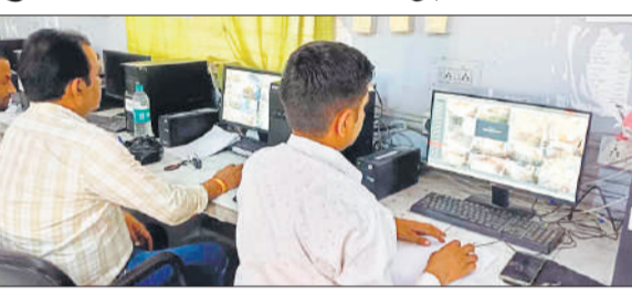
बोर्ड परीक्षा की उत्तर पुस्तिकाओं के मूल्यांकन कार्य की मॉनिटरिंग करते कर्मचारी।