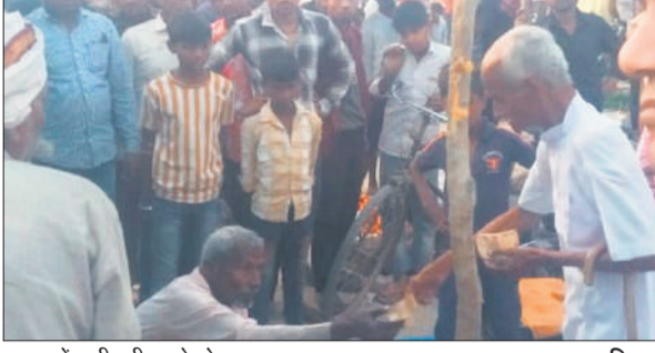
बाजार में खरीदारी करते लोग।