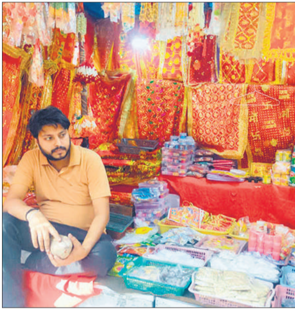
मुख्य बाजार में सजी पूजन सामग्री की दुकान।

अमृत विचार : नवरात्र का पहला दिन आज है। घरों और मंदिरों में घट स्थापना के साथ मां दुर्गा अपने दरबार में विराजेंगी। नौ दिनों तक मां के विभिन्न स्वरूपों की विधिविधान से पूजा की जाएगी। नवरात्र भर मंदिरों में भक्तिमयी कार्यक्रम होंगे। पूर्व संध्या पर मां के स्वागत में देवी मंदिरों में भव्य सजावट की गई और तैयारियों को अंतिम रूप दिया गया। मंदिरों को बिजली झालरों और फूलों से सजाया गया। बहादुरगंज बाजार में देर रात तक रौनक रही और पूजा के सामान की खरीदारी करती महिलाओं की भीड़ देखी गई। पूजन सामग्री, मूर्तियों और फलों की दुकानों पर खूब भीड़ रही। शहर के देवी मंदिरों में नौ दिनों तक माता की पूजा-अर्चना के लिए हर रोज हजारों श्रद्धालु पहुंचेंगे और इस दौरान विशेष हवन आदि आयोजन किए जाएंगे। इसके लिए मंदिरों में साफ-सफाई