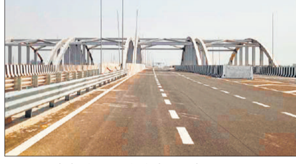
बदायूं जनपद की सीमा में गंगा एक्सप्रेस वे की खूबसूरती