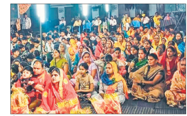
श्री राम कथा सुनते श्रद्धालु

कथा वाचक ने भगवान श्रीराम द्वारा अहिल्या का उद्धार, गंगा महिमा और गंगा जी का अवतरण, महर्षि विश्वामित्र द्वारा श्रीराम और लक्ष्मण को जनकपुरी ले जाने, राजा जनक द्वारा श्रीराम के प्रथम दर्शन, श्रीराम और लक्ष्मण के जनकपुरी भ्रमण तथा पुष्यवाटिका में माता सीता और भगवान श्रीराम के प्रथम मिलन का सुंदर प्रसंग सुनाया। माता सीता द्वारा माता पार्वती का पूजन आदि प्रसंग के बाद उन्होंने कहा कि धनुष यज्ञ