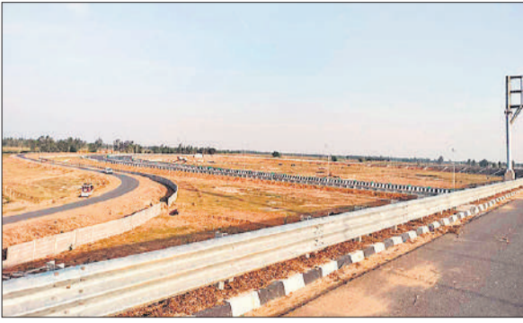
बदायूं जनपद की सीमा में गंगा एक्सप्रेस वे की खूबसूरती ● अमृत विचार

शाहजहांपुर में गंगा एक्सप्रेस वे जलालाबाद क्षेत्र से होकर गुजर रहा है, जिससे स्थानीय लोगों को सीधा लाभ मिलेगा। विकास द्वार बनने से क्षेत्र की कनेक्टिविटी में सुधार होगा और मध्य प्रदेश व राजस्थान तक पहुंच आसान हो जाएगी। इसके अलावा दिल्ली, हरियाणा और उत्तराखंड की पहुंच भी आसान हो जाएगी। जलालाबाद क्षेत्र से गुजरने के कारण स्थानीय लोगों को सीधे आवागमन का लाभ मिलेगा। विकास द्वार बनने से कस्बाई और ग्रामीण क्षेत्रों के लोग भी आसानी से एक्सप्रेस वे से जुड़ सकेंगे और यात्रा में समय की बचत होगी। शाहजहांपुर से अभी तक प्रयागराज पहुंचने में सात घंटे का समय लगता है, जो बहुत कम हो जाएगा। समय और इंधन दोनों की बचत होगी।