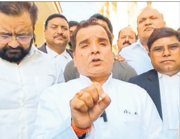
पत्रकारों से बात करते सपा के मुख्य सचेतक व आजमगढ़ सांसद धर्मेन्द्र यादव।