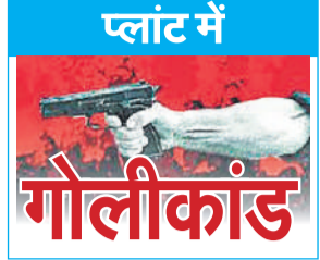
प्लांट में गौलीकांड