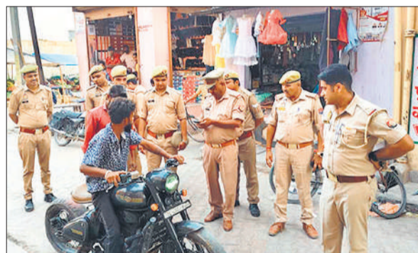
चेकिंग के दौरान बुलेट सीज करते पुलिसकर्मी।