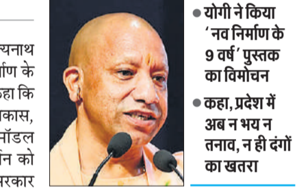
योगी ने किया 'नव निर्माण के 9 वर्ष' पुस्तक का विमोचन

अमृत विचार: मुख्यमंत्री योगी आदित्यनाथ ने बुधवार को लोक भवन में 'नव निर्माण के 9 वर्ष' पुस्तक का विमोचन करते हुए कहा कि बीते नौ वर्षों में उत्तर प्रदेश ने सुरक्षा, विकास, रोजगार और सुशासन का नया मॉडल स्थापित किया है। उन्होंने इस परिवर्तन को प्रधानमंत्री नरेंद्र मोदी के मार्गदर्शन, सरकार की नीतियों, जनप्रतिनिधियों की प्रतिबद्धता और जनता के सहयोग का परिणाम बताया।