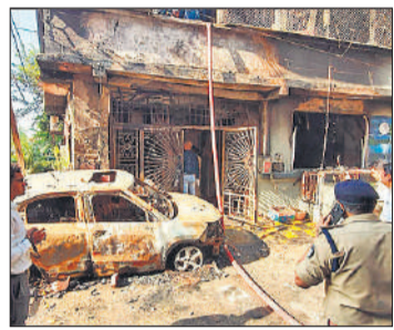
इंदौर में घटनास्थल पर मौजूद बचावकर्मी।

नई दिल्ली/इंदौर, एजेंसी दिल्ली और इंदौर की आवासीय इमारतों में हुए भीषण अग्निकांड में 17 लोगों की मौत हो गई। दिल्ली के पालम इलाके में बुधवार सुबह बहुमंजिला इमारत में लगी आग में एक बुजुर्ग महिला और उनकी तीन पोतियों समेत एक ही परिवार के नौ लोगों की मौत हो गई। इंदौर में तीन मंजिला मकान में तड़के इलेक्ट्रिक वाहन को चार्ज करते वक्त धमाके के बाद आग लग गई। यहां भी एक ही परिवार के दो बच्चों और तीन महिलाओं समेत आठ की जान चली गई। दिल्ली के पालम मेट्रो स्टेशन के पास राम चौक मार्केट में स्थित इमारत के बेसमेंट, भूतल