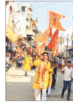
कलश यात्रा निकालते पीत वस्त्र धारी।