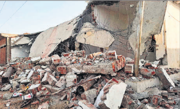
मंगलवार को दुकानें तोड़े जाने के बाद पड़ा मलबा।