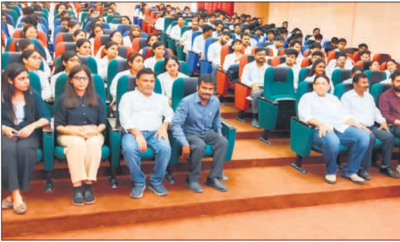
ध्यान कार्यशाला में शामिल प्रतिभागी।

अमृत विचार: वरुण अर्जुन मेडिकल कॉलेज एवं रोहिलखंड हास्पिटल के मिनी ऑडिटोरियम में अपने वास्तविक सामर्थ्य को जागृत करें ध्यान के माध्यम से विषय पर कार्यशाला आयोजित की गई।