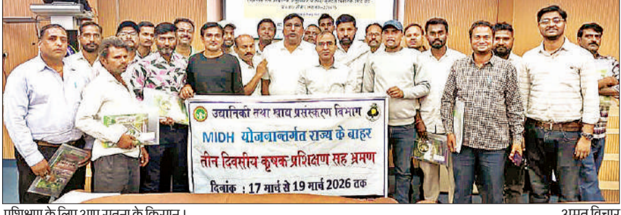
प्रशिक्षण के लिए आए सतना के किसान।

अमृत विचार: सीएसआईआर-सीएमप में मध्यप्रदेश के सतना जिले के किसानों का प्रशिक्षण किया गया। एक दिवसीय जागरूकता एवं प्रशिक्षण कार्यक्रम में किसानों ने एरोमा मिशन और प्लेनरीकल्चर के तहत वैज्ञानिक खेती और मूल्य संवर्धन के गुर सीखे। यह कार्यक्रम सतना के उद्यानिकी एवं खाद्य प्रसंस्करण विभाग के सहयोग से आयोजित किया गया, जिसमें जिले के सात ब्लॉकों के किसान शामिल हुए। किसानों को टिकाऊ कृषि पद्धतियों को बढ़ावा देने, फसलों का विविधीकरण और उच्च मूल्य वाली औषधीय, सुगंधित एवं पुष्प फसलों के माध्यम से आय में वृद्धि करने का प्रशिक्षण दिया गया। प्रशिक्षण