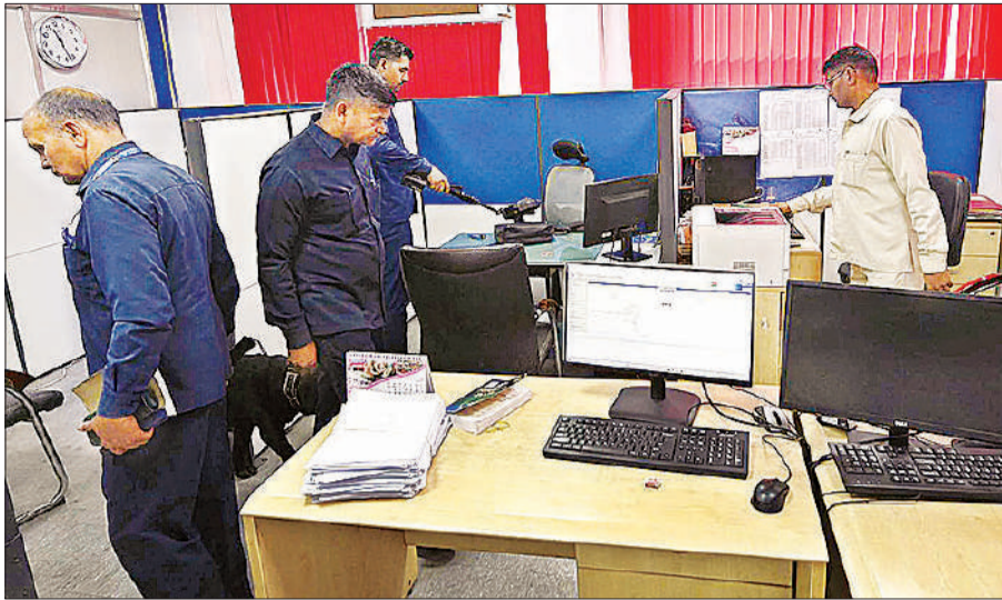
पासपोर्ट कार्यालय के अंदर कंप्यूटर रूम की जांच करते अधिकारी।

इसके साथ ही डॉग स्ववायड और बीडीएस टीम ने वाहनों और नर्सरी में भी पड़ताल की। हालांकि कोई भी संदिग्ध वस्तु पुलिस व बीडीएस टीम को नहीं मिली। इंस्पेक्टर ने बताया कि मेल सुबह 7:41 मिनट पर रीजनल पासपोर्ट अफसर की अधिकारिक मेल