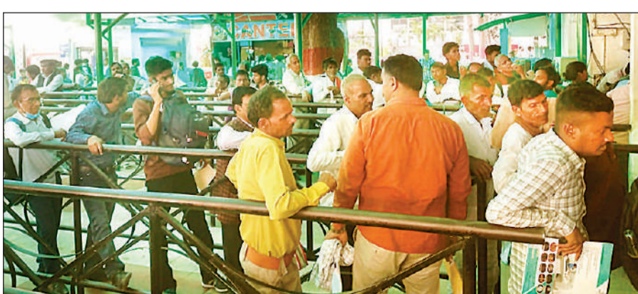
लॉरी कॉर्डियोलॉजी में पंजीकरण की लाइन में लगे तीमारदार।