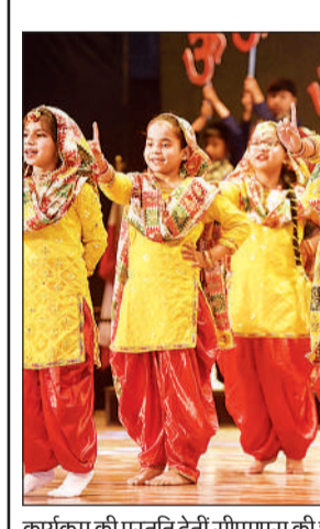
कार्यक्रम की प्रस्तुति देती सीएमएस की छात्राएं।