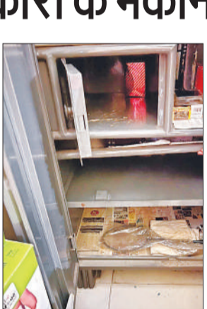
चोरी के बाद खुली हुई आलमारी।

अमृत विचार: तालकटोरा के राजाजीपुरम ए-ब्लॉक में चोरों ने आवास विकास की रिटायर्ड अनुभाग अधिकारी महिला के बंद मकान को निशाना बनाया। ग्लिल काटकर घर में दाखिल हुए चोरों ने करीब एक करोड़ के जेवर, नकदी, एफडी, प्रॉपर्टी के पेपर समेत अन्य माल चोरी कर लिया। यही नहीं चोरों ने घर में रखा खाने-पीने का सामान खाय। उसके बाद कमरे में ही शौच कर दी। बुधवार सुबह चोरी की जानकारी मिलने पर पीड़िता भतीजे के साथ घर पहुंची। पुलिस ने फॉरेंसिक टीम की मदद से घर में छानबीन की। पुलिस आसपास के सीसीटीवी कैमरों के फुटेज खंगाल रही है।