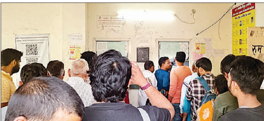
बिजली काटने के विरोध में कॉल सेंटर पर हंगामा करने वाले उपभोक्ताओं की भीड़।

अमृत विचार: बिजली विभाग की लापरवाही से बुधवार को शहर के 13,221 प्रोपेड मीटर धारकों की बिजली ऑनलाइन काट दी गई। इससे आक्रोशित 150 से अधिक उपभोक्ताओं ने हुसैनगंज स्थित कॉल सेंटर पर धावा बोलकर हंगामा शुरू करने के साथ तोड़फोड़ कर दी। पुलिस के पहुंचने से पहले हंगामा कर रहे लोग भाग निकले। हंगामे के कारण करीब एक घंटे तक कॉल सेंटर में कामकाज ठप रहा। जानकीपुरम, गोमतीनगर और अमौसी जौन के हजारों उपभोक्ताओं ने भी उपकेंद्रों पर जाकर अचानक बिजली काटने पर नाराजगी जताई। इन उपभोक्ताओं की भी अधिकारियों और कर्मचारियों से तीखी नोकझोंक हुई। जानकीपुरम जौन में एक महिला उपभोक्ता ने मुख्य अभियंता वीपी सिंह के कक्ष में पहुंचकर जमकर नाराजगी जताई। महिला का आरोप था कि स्मार्ट मीटर लगाते समय उसे प्रोपेड में न बदलने का आश्वासन दिया गया था। बावजूद उसके मीटर को आनन-फानन में बदल दिया गया। इस संबंध में सेंट्रल जौन के मुख्य अभियंता रवि कुमार अग्रवाल ने बताया कि निगेटिव बैलेंस वाले 43 हजार के करीब उपभोक्ता हैं। इन्हीं उपभोक्ताओं की बिजली काटी जा रही है। कुछ अराजक तत्व बिजली इन्फ्रेमाल करते थे, लेकिन विल नहीं भरते थे। वही लोग उपद्रव करने में शामिल थे। सीसीटीवी फुटेज से इन उपद्रवियों की पहचान कर आगे सुनिश्चित कराई जाएगी। सेंट्रल जौन के अधिशासी अभियंता (रेड) सुशील कुमार ने बताया कि बुधवार सुबह चेकिंग के दौरान 61 कटे कनेक्शनों की जांच हुई। इसमें 42 में बिजली बंद मिली, वहीं 3 उपभोक्ता चोरी से बिजली जलाते पकड़े गए। इन सभी के खिलाफ एफआरआई दर्ज की जा रही है।