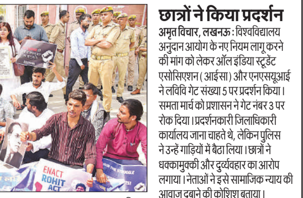
छात्रों ने किया प्रदर्शन अमृत विचार, लखनऊ : विश्वविद्यालय अनुदान आयोग के नए नियम लागू करने की मांग को लेकर ऑल इंडिया स्टूडेंट एसोसिएशन (आईसा) और एनएसयूआई ने लविवि गेट संख्या 5 पर प्रदर्शन किया।