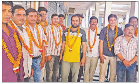
जेहटा इकाई के पदाधिकारी व अन्य।