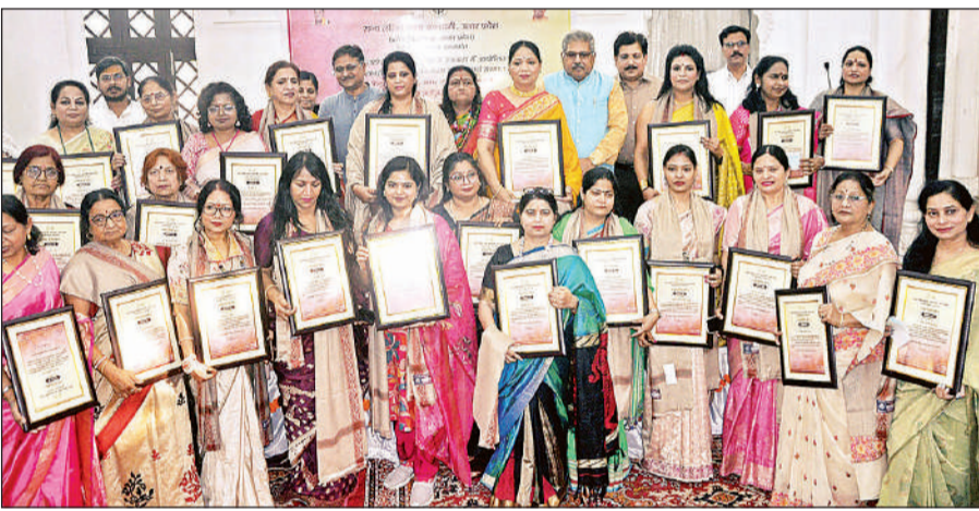
राज्य ललित कला अकादमी में प्रशस्ति पत्र के साथ सम्मानित की गई महिला कलाकार, साथ में अतिथि और आयोजक।