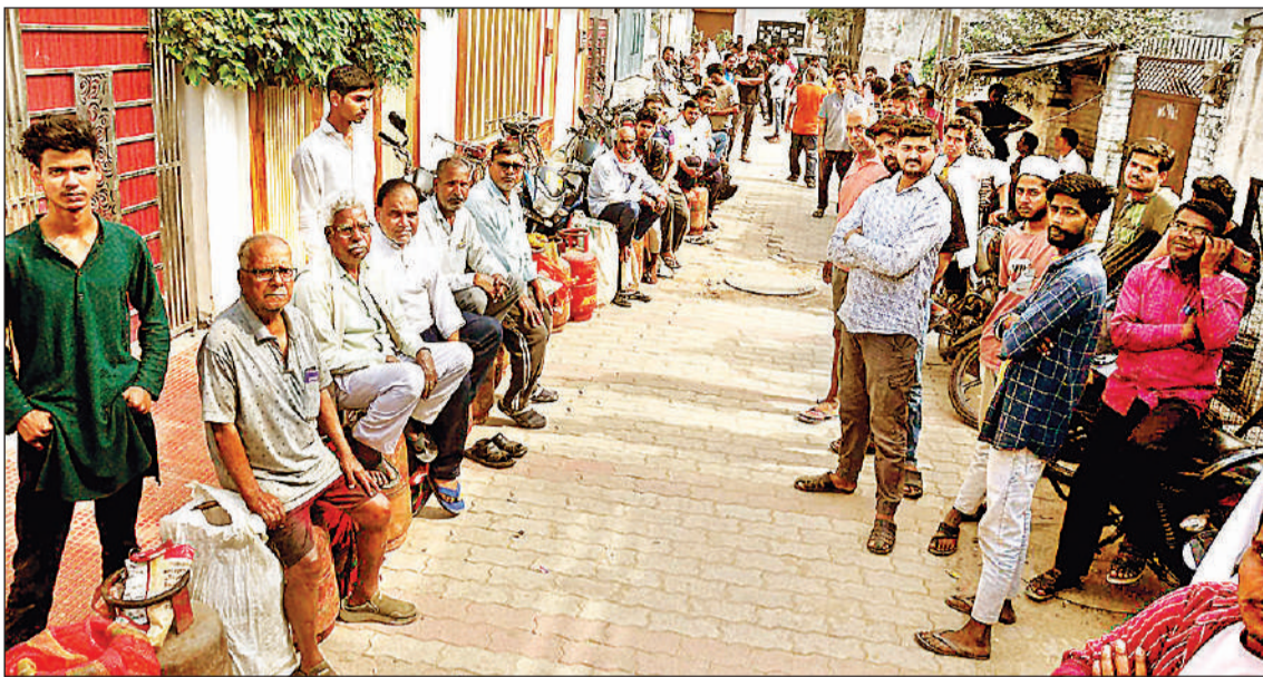
कुर्सी रोड फूलबाग कॉलोनी स्थित भारत कंपनी की अशोक गैस एजेंसी के गोदाम पर रसोई गैस सिलेंडर लेने के लिए लगी लाइन।