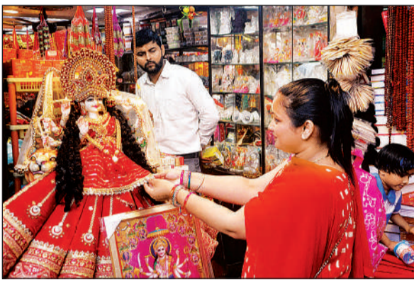
अमीनाबाद बाजार में देवी की मूर्ति देखती महिला।

शास्त्रीनगर स्थित दुर्गा मंदिर शास्त्रीनगर में इस बार नवरात्र के दौरान पांच विशेष सूत्रों पर कार्य किया जा रहा है। इसमें जम्भू की ज्वालादेवी मंदिर से ज्योति लाकर श्रद्धालुओं को तिलक करने की योजना है। साथ ही हिंदू नववर्ष 2083 के अवसर पर ध्वजा विरण भी किया जाएगा। नौ दिनों तक भजन, पूजा और माता के अलग-अलग श्रृंगार किए जाएंगे। 27 मार्च को भगवान राम का प्रकटोत्सव मनाया जाएगा और विश्व शांति के लिए विशेष यज्ञ आयोजित किया जाएगा, जिसमें ईरान और अमेरिका सहित वैश्विक संघर्षों की शांति की कामना की जाएगी।