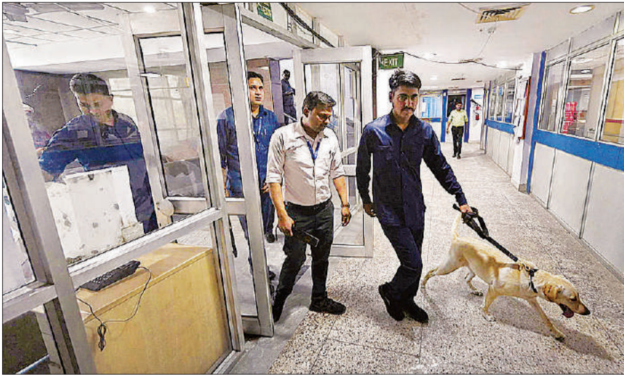
गोमती नगर स्थित पासपोर्ट कार्यालय को बम से उड़ाने की धमकी मिलने के बाद जांच करती डग स्ववायड टीम।