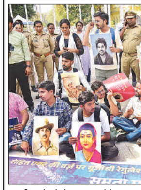
अपनी मांगों को लेकर धरना देते छात्र।