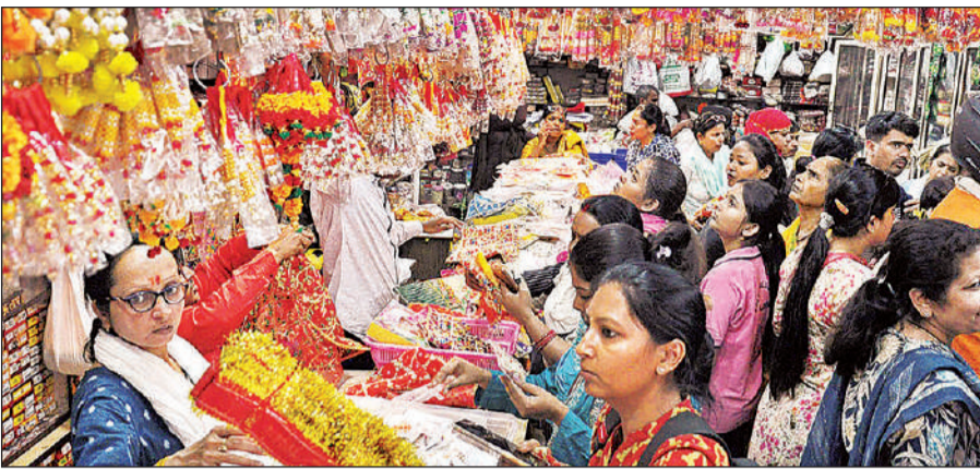
अमीनाबाद स्थित दुकान में चैत्र नवरात्र के लिए चुनरी और अन्य पूजन सामग्री खरीदती महिलाएं।

पूजन और व्रत की सामग्री खरीदने के लिए बुधवार को बाजारों में भीड़ रही। घट के अलावा धूपबत्ती, कपूर, घी, लौंग, हवन सामग्री, नारियल, कलश, आम के पत्ते, चुनरी, चूड़ियां और फूल माला की खरीदारी की गई। मांग बढ़ने से फल और फूलों की कीमतों में उछाल देखा गया। सेब 120 रुपये से बढ़कर 150 रुपये प्रति किलो और केला 50 रुपये दर्जन से 70 रुपये दर्जन तक पहुंच गया है।