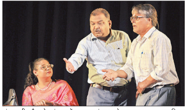
अंतरराष्ट्रीय बौद्ध शोध संस्थान में नाटक का मंचन करते कलाकार। अमृत विचार

अमृत विचार: सांस्कृतिक, शैक्षिक और सामाजिक संस्था अनादि और उत्तर प्रदेश संस्कृत संस्थान के संयुक्त तत्वावधान में बुधवार को अंतरराष्ट्रीय बौद्ध शोध संस्थान में नाटक अधुना अलम् अतिभाषणेन् भो: का मंचन किया गया। विद्यालय की पृष्ठभूमि पर नाटक स्कूल वंदना या कुन्दन्तु तुषार हार धवला से प्रारम्भ होता है। स्कूल के सभी अध्यापक आकर पंक्ति में खड़े हो जाते हैं। इसके बाद सभी अध्यापक स्टाफ रूम में बैठ जाते हैं। स्कूल के प्रधानाचार्य स्टाफ रूम में आकर बताते हैं कि नियमानुसार