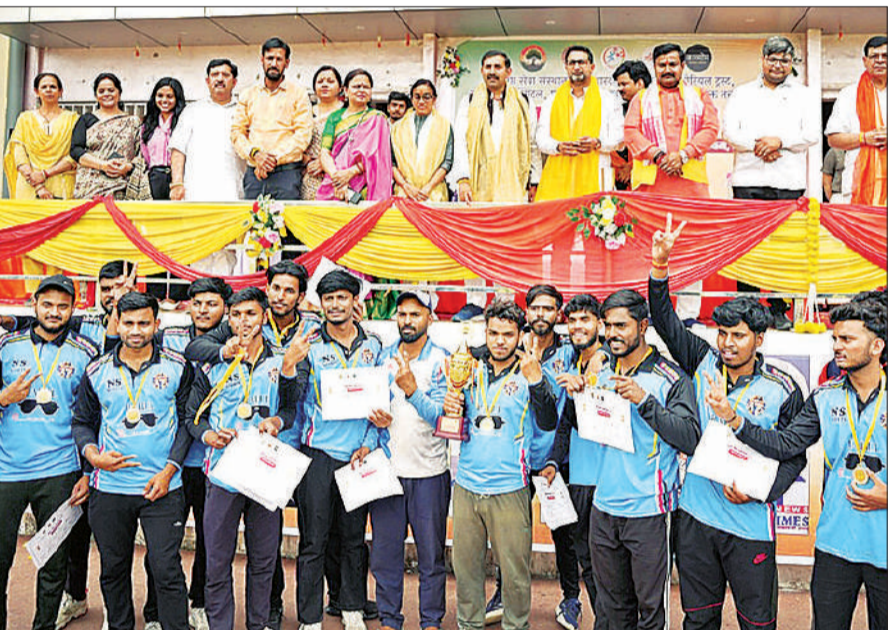
मुख्य अतिथि के साथ मेडल, प्रशस्ति पत्र के साथ खिलाड़ी।