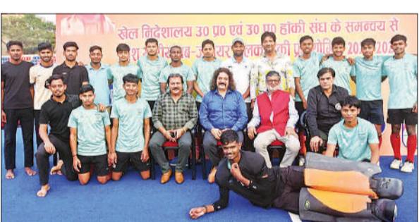
सब जूनियर हॉकी प्रतियोगिता में स्पोर्ट्स हॉस्टल की विजेता टीम।