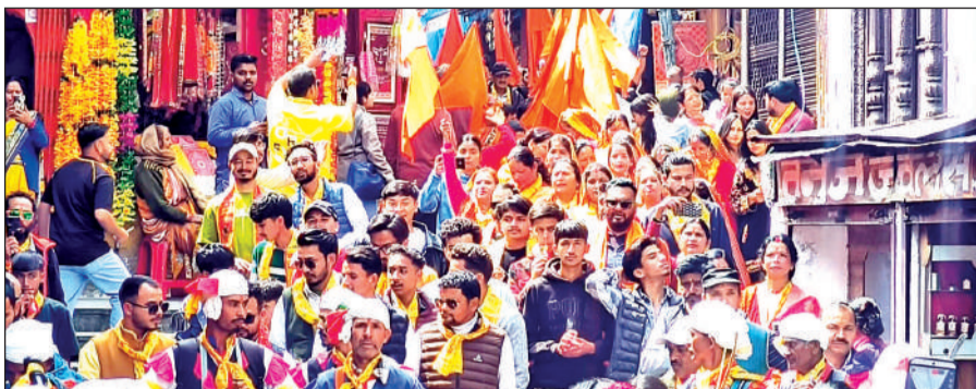
अल्मोड़ा में भव्य सांस्कृतिक शोभा यात्रा निकालते हिन्दू सेवा समिति के सदस्य। ● अमृत विचार

सांस्कृतिक शोभा यात्रा पलटन बाजार स्थित सिद्ध नौला से शुरू हुई। शोभा यात्रा थाना बाजार, गंगोला मोहल्ला, जौहरी बाजार, हुक्का क्लब, रघुनाथ मंदिर, कहचरी बाजार, लोहाशेर बाजार,