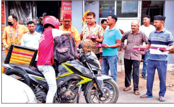
हिंदू नववर्ष पर मिष्ठान वितरण करते श्री रामलीला कमेटी ब्लॉक के उपाधिकारी।