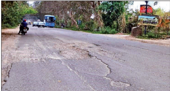
काशीपुर में रामनगर रोड पर उखड़ी पड़ी सड़क। ● अमृत विचार

दरअसल रामनगर रोड पर वर्तमान में गांव धनौरी से मुरादाबाद के लिये बाईपास का निर्माण चल रहा है। साथ ही इस मार्ग पर रामनगर स्थित काबेट पार्क भी