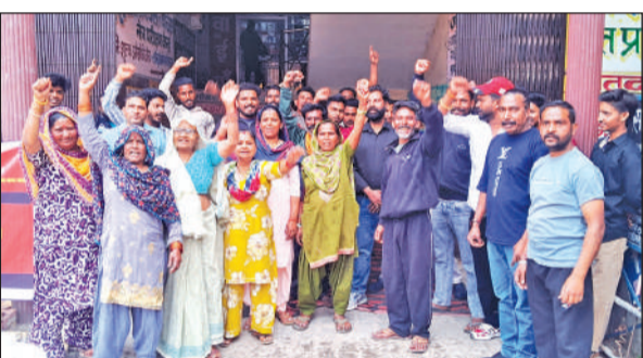
नगर पालिका गेट पर धरना-प्रदर्शन करते वाल्मीकि समाज के लोग।