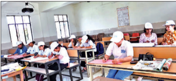
महाविद्यालय में गंगा स्वच्छता को लेकर चित्र बनाते विद्यार्थी। ● अमृत विचार