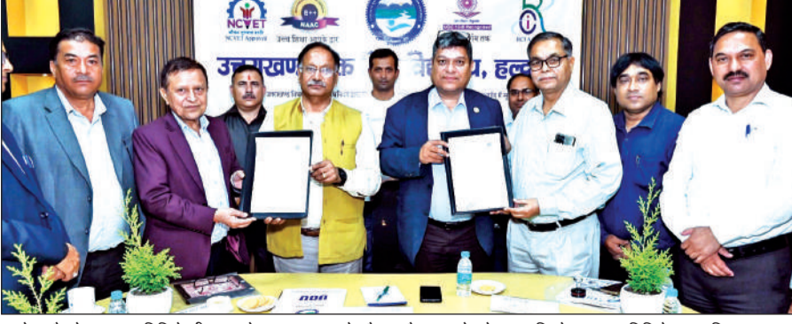
यूओयू और नेपाल मुक्त विवि के बीच एमओयू पर हस्ताक्षर के दौरान मौजूद यूओयू के कुलपति, नेपाल मुक्त विवि के कुलपति व अन्य।

अमृत विचार: उत्तराखंड मुक्त विश्वविद्यालय ने नेपाल के फार वेस्टर्न यूनिवर्सिटी के साथ अकादमिक व रिसर्च सहयोग को मजबूत करने के उद्देश्य से एमओयू पर हस्ताक्षर किए हैं। यह एमओयू दोनों विश्वविद्यालयों के बीच नॉलेज एक्सचेंज, रिसर्च व नवाचार को बढ़ावा देने के साथ-साथ भारत और नेपाल की साझा सांस्कृतिक विरासत को संरक्षित करने की दिशा में अहम कदम माना जा रहा है। इसके तहत दोनों संस्थान अकादमिक गतिविधियों के आदान-प्रदान, संयुक्त रिसर्च