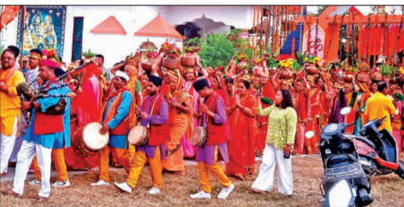
शांतिपुरी में कलश यात्रा निकालती महिलाएं।

अमृत विचार: शांतिपुरी नंबर 4 स्थित ऐतिहासिक प्राचीन बट वृक्ष देवी मंदिर के पुनर्निर्माण के बाद गुरुवार को क्षेत्र में अभूतपूर्व उत्साह और श्रद्धा का माहौल रहा। नवनिर्मित मंदिर में देवी प्रतिमा की प्राण प्रतिष्ठा के अवसर पर एक भव्य कलश यात्रा निकाली गई। पारंपरिक वाद्य यंत्रों की गूंज के साथ सुबह 10 बजे मंदिर परिसर से शुरू हुई यह यात्रा गांव के प्रमुख मार्गों से होकर गुजरी। महिलाओं ने सिर पर कलश धारण कर भक्तिभाव के साथ हिस्सा लिया, वहीं देवी की नवीन मूर्ति का नगर भ्रमण कराया गया। ग्रामीणों ने जगह-जगह पुष्प