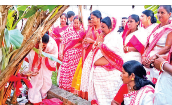
दिनेशपुर में वृक्ष की पूजा- अर्चना करती महिलाएं।

अमृत विचार: चैत्र नवरात्र पर होने वाली बसंती पूजा की तैयारी जोरों पर है। महिलाओं ने नगर में शोभायात्रा निकालकर कदली छेदन कार्यक्रम किया गया। इस दौरान मां बसंती के जयकारों से नगर गूंज उठा।