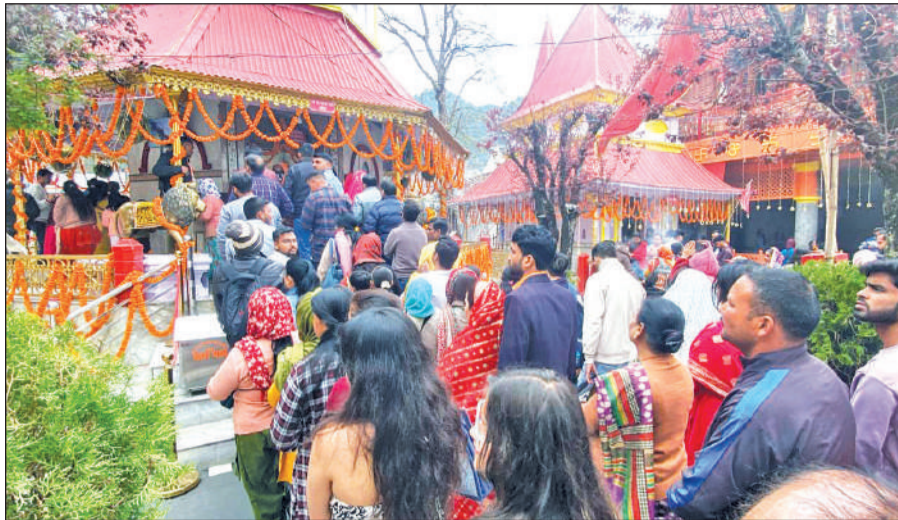
नैनीताल में नवरात्र के पहले दिन गुरुवार को मां नयना देवी के मंदिर में उमड़ी भक्तों की भीड़।

मान्यता है कि देवी सती की आंख यहां गिरी थी, जिसके बाद यहां मां नयना देवी की स्थापना हुई। पौराणिक कथाओं के अनुसार, देवी पार्वती (सती) का पार्थिव शरीर खंडित होने पर उनकी बाईं आंख यहां गिरी थी। पुराणों में वर्णित है कि देवी पार्वती के पिता दक्ष प्रजापति ने एक विशाल यज्ञ का आयोजन किया, लेकिन उसमें भगवान शिव को आमंत्रित नहीं किया। अपने पिता के यहां हो रहे यज्ञ में माता सती बिना निमंत्रण के पहुंच गईं। वहां उन्होंने देखा कि सभी देवी-देवताओं के बैठने की व्यवस्था है, लेकिन उनके पति भगवान शिव के