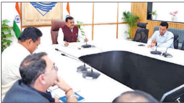
सचिवालय में अधिकारियों के साथ बैठक करते मुख्य सचिव आनंद बर्द्धन।

मंदिर के भव्य नवनिर्माण कार्य का विधिवत शिलान्यास करेंगे। मंदिर परिसर में आयोजित इस शिलान्यास कार्यक्रम के बाद मुख्यमंत्री अपराह्न 3 बजे देवीधुरा से जनपद नैनीताल के हल्द्वानी के लिए प्रस्थान कर जाएंगे।