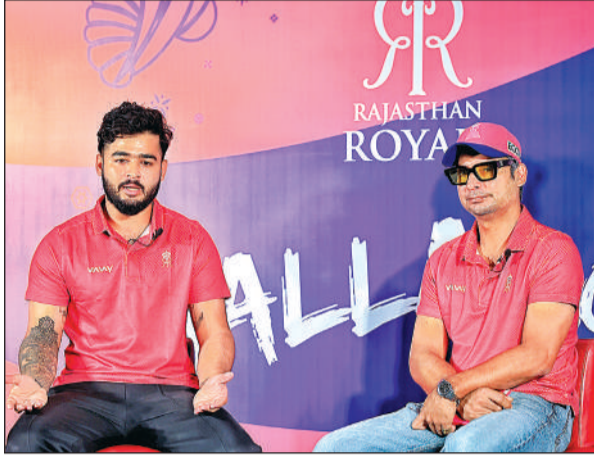
जयपुर में प्रेसवार्ता के दौरान राजस्थान रॉयल्स के कप्तान रियान पराग (बाएं) और टीम के मुख्य कोच कुमार संगकारा।

उन्होंने हाल में टी20 विश्व कप में अच्छा प्रदर्शन करके टूर्नामेंट के सर्वश्रेष्ठ खिलाड़ी का पुरस्कार हासिल किया था। पराग ने कहा कि पिछले सत्र के आखिर में उनकी टीम का प्रदर्शन अच्छा नहीं रहा