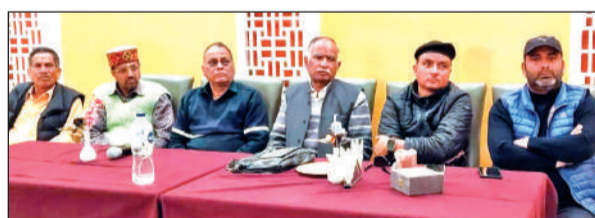
अल्मोड़ा में गुरुवार को आयोजित बैठक में मंचासीन पत्रकार।