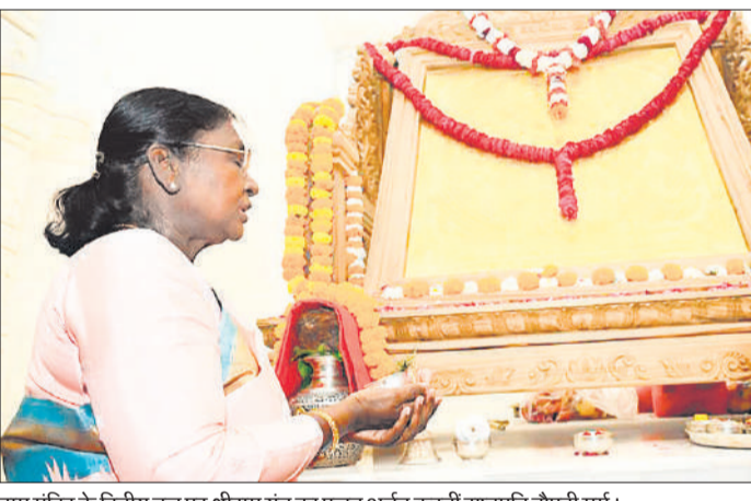
राम मंदिर के द्वितीय तल पर श्रीराम यंत्र का पूजन अर्चन करती राष्ट्रपति द्रौपदी मुर्मू।

अयोध्या कार्यालय अमृत विचार : राष्ट्रपति द्रौपदी मुर्मू ने गुरुवार को हिंदू नववर्ष के आगमन व चैत्र नवरात्र के पहले दिन श्रीराम जन्मभूमि मंदिर में श्रीराम यंत्र की प्रतिष्ठापना की। उन्होंने राज्यपाल आनंदी बेन पटेल व मुख्यमंत्री योगी के साथ रामलला के चरणों में शीश झुकाकर व आरती उतारकर श्रद्धा निवेदित की। मंदिर परिसर में सभी देवों के समक्ष शीश झुकाया। दर्शन-पूजन के बाद राष्ट्रपति ने भावुक होकर कहा, श्रीराम की मेरे ऊपर बहुत कृपा है। आज अयोध्या में होना मेरे जीवन का कृतार्थ करने वाला पल है। उन्होंने प्रभु राम से देश की समृद्धि, शांति और नागरिकों की भलाई की प्रार्थना की। श्रीराम जन्मभूमि मंदिर के द्वितीय तल पर श्रीरामयंत्र की विधिवत प्रतिष्ठापना की। श्रीराम यंत्र दो वर्ष पूर्व जगद्गुरु शंकराचार्य विजयेंद्र सरस्वती महाराज द्वारा शोभायात्रा के माध्यम से अयोध्या भेजा गया था। वैदिक गणित और ज्योतिषीय आकृतियों पर आधारित यह यंत्र देवताओं का निवास माना जाता है, जो सकारात्मक ऊर्जा आकर्षित करने की क्षमता रखता है। दक्षिण भारत, काशी, अयोध्या के आचार्यों द्वारा मंदिर में श्रीराम यंत्र के लिए अर्चनाओं द्वारा मंदिर में श्रीराम यंत्र के लिए अर्चनाएं की गईं।