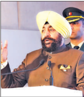
संबोधित करते राज्यपाल।