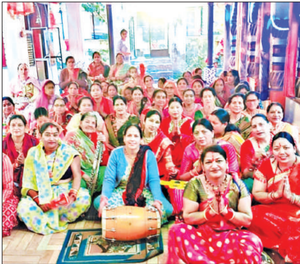
रामनगर के भरतपुरी मंदिर में भजन-कीर्तन करती महिलाएं। ● अमृत विचार

रामनगर: चैत्र नवरात्रि के अवसर पर नगर एवं देहात क्षेत्र में स्थित दुर्गा मंदिरों में श्रद्धालुओं का तांता लगा रहा। सभी ने विधि-विधान से मां भगवती का पूजन किया और परिवार, समाज, देश व प्रदेश की सुख-समृद्धि की कामना की। सभी दुर्गा मंदिरों में भजन-कीर्तन भी शुरू हो गए हैं। नवरात्र के प्रथम दिन लोगों ने व्रत धारण कर प्रथम शक्ति शैलपुत्री की धरो एवं मंदिरों में