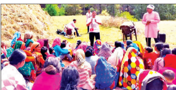
अल्मोड़ा में जागरूकता अभियान चलाते दू हंस फाउंडेशन के सदस्य। ● अमृत विचार

हंस फाउंडेशन की ओर से जिले के ग्राम पंचायत बीना, हड़ोली, भैसोड़ी, पाटिया, कोटयुड़ा, पिल्खा, बिरोड़ा, टाटिक, सिराड, कटारमल, तिलोरा, सकनियाकोट, रैत, चनोली और बड़गांव में जागरूकता अभियान चलाया गया। अभियान के तहत ग्रामीणों को जंगलों में लगने वाली आग के कारणों, उससे होने वाले नुकसान