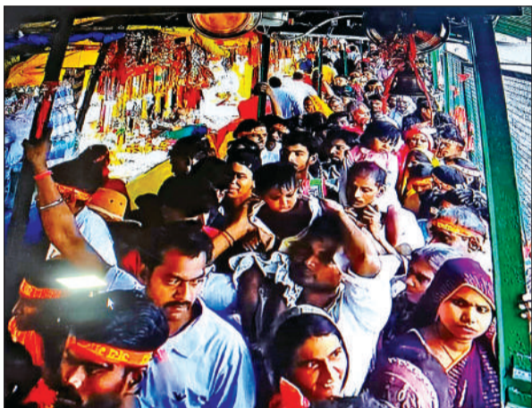
मां पूर्णागिरि धाम के पास दर्शन की प्रतीक्षा में कतार में खड़े श्रद्धालु। ● अमृत विचार

बुधवार की रात से ही श्रद्धालु टनकपुर पहुंचने लगे थे। अधिकांश श्रद्धालु रात में ही पैदल पूर्णागिरि की ओर रवाना हो गए। गुरुवार को पहले नवरात्र पर सुबह चार बजे से ही शारदा घाट में पवित्र स्नान के बाद पूर्णागिरि धाम जाने का सिलसिला शुरू हो गया। भीड़ इतनी अधिक थी कि पाकिंग स्थल भी वाहनों से ठसाठस भरे रहे। दर्शन करने में कोई दिक्कत न हो इसके लिए पुलिस ने काली