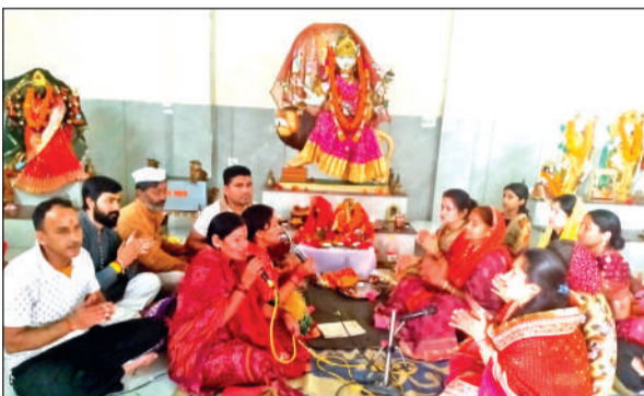
दिनेशपुर के श्री दुर्गा मंदिर हरिपुरा में भजन- कीर्तन करते श्रद्धालु। ● अमृत विचार