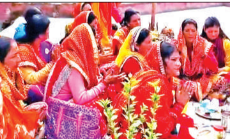
रानीखेत में नवरात्र पर मंदिर परिसर में कीर्तन भजन करती महिलाएं।

कर सुख-समृद्धि की कामना की। मंदिरों और घरों में भजन, कीर्तन का आयोजन किया गया। वहीं, नव संवत्सर पर लोगों ने घरों में भी धार्मिक अनुष्ठान कराए। बड़ी संख्या में विशेषकर महिलाओं ने मां की पूजा अर्चना की।