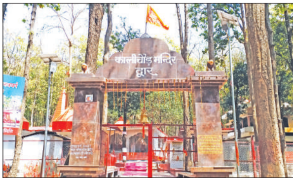
गौलापार में जंगलों के बीच बना कालीचौड़ मंदिर। ● अमृत विचार

नवरात्र के दिनों में मंदिर परिसर में विशेष पूजा-अर्चना और भक्ति का माहौल बना रहता