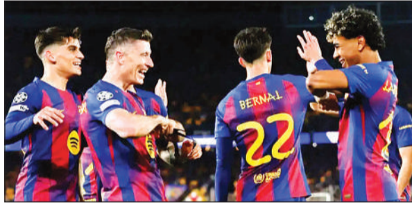
जश्न मनाती बार्सिलोना की टीम।

चैंपियंस लीग में एक बार फिर गोल की बरसात हुई। बार्सिलोना ने रोमांचक मुकाबले में न्यूकैसल को दूसरे हाफ में बुरी तरह से हरा दिया और 7-2 से जीत हासिल की। न्यूकैसल में खेले गए पहले चरण में 1-1 से बराबरी पर रहने