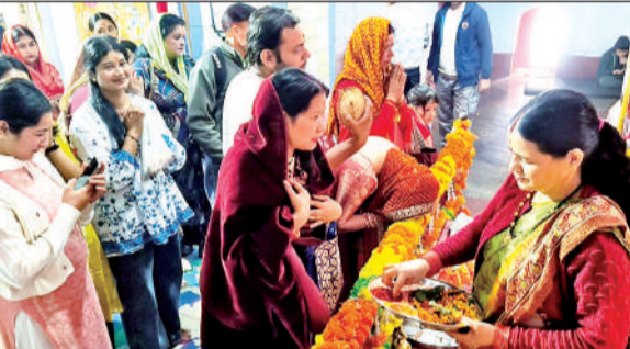
अल्मोड़ा में नंदादेवी मंदिर में पूजा-अर्चना करते श्रद्धालु।

गुरुवार को नंदादेवी और चितई मंदिर में दर्शन के लिए श्रद्धालुओं की कतार लगी रही। वहीं, लोगों ने घरों में कलश की स्थापना की। मौसम साफ रहने से मंदिरों में श्रद्धालुओं की काफी भीड़ रही। सुबह से ही श्रद्धालुओं का पूजा के लिए नगर के प्रसिद्ध नंदादेवी मंदिर, त्रिपुरा सुंदरी, उल्का देवी मंदिर, कसारदेवी मंदिर, स्याही