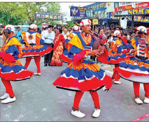
चैती मेले में छोलिया नृत्य प्रस्तुत करते कलाकार। ● अमृत विचार