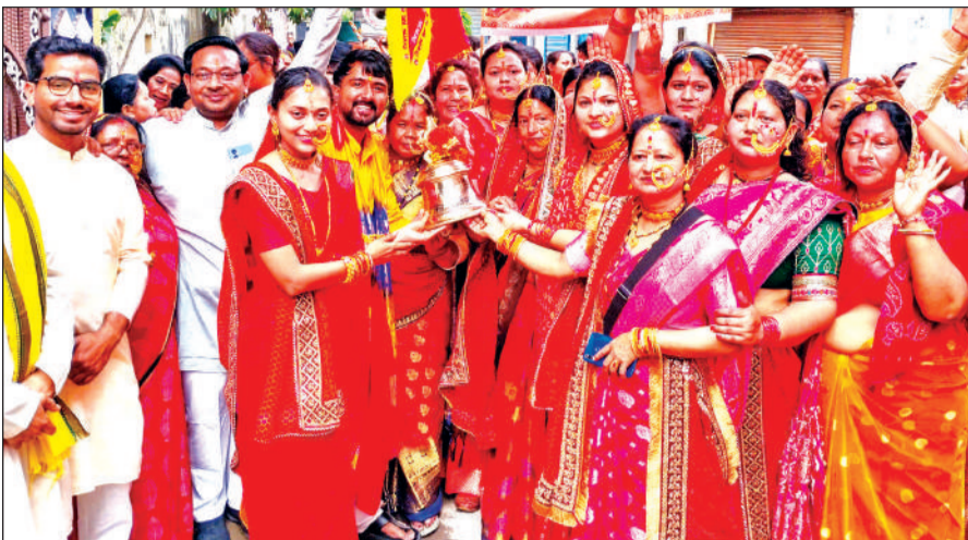
शक्तिफार्म में शोभायात्रा निकालती पर्वतीय शक्ति कीर्तन मंडली की महिलाएं।