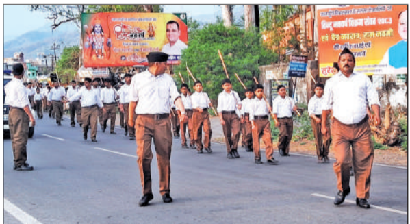
कालाढूंगी नगर में पथसंचलन करते स्वयंसेवक।