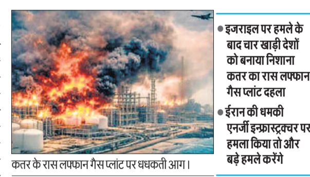
कतर के रास लफान गैस प्लांट पर घघकती आग।