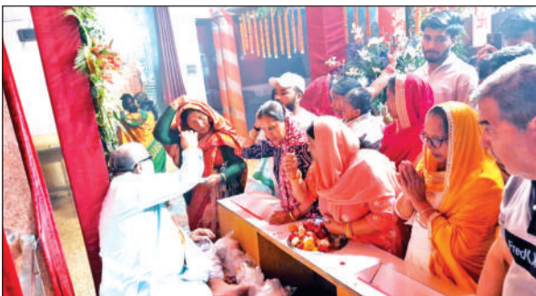
रुद्रपुर के पांच मंदिर में पूजा अर्चना करते श्रद्धालु।

गुरुवार तड़के से ही घरों में साफ-सफाई और स्नान के बाद लोग मंदिरों की ओर रुख करने लगे। लक्ष्मी नारायण मंदिर, अटरिया देवी मंदिर, मनकामेश्वर और वैष्णो देवी मंदिर समेत सभी प्रमुख देवालयां में घंटों और भजनों की गूंज सुनाई दी। नगर निगम और मंदिर समितियों द्वारा की गई विशेष व्यवस्था के कारण मंदिरों को आकर्षक रोशनी और फूलों से सजाया गया है। दिनभर चले भजन-कीर्तन और 'जय माता दी' के जयकारों ने वातावरण को पूरी तरह आध्यात्मिक बना दिया। प्रशासन और नगर निगम की सक्रियता से सफाई और सुरक्षा के कड़े इंतजाम भी देखने को मिले। बाजपुर में हल्द्वानी बस अड्डा स्थित प्राचीन शिव मंदिर, रामराज रोड के तीन मूर्ति मंदिर और मंडी समिति परिसर सहित विभिन्न देवालयां में दिनभर तांता लगा रहा। घरों में कलश स्थापना के साथ नौ दिवसीय व्रत का संकल्प लिया गया। बाजारों में भी दुकानों पर भारी रौनक देखी गई।