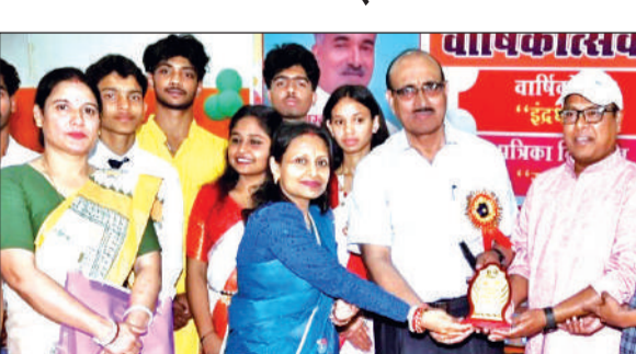
दिनेशपुर में विजेताओं को सम्मानित करते अतिथि।