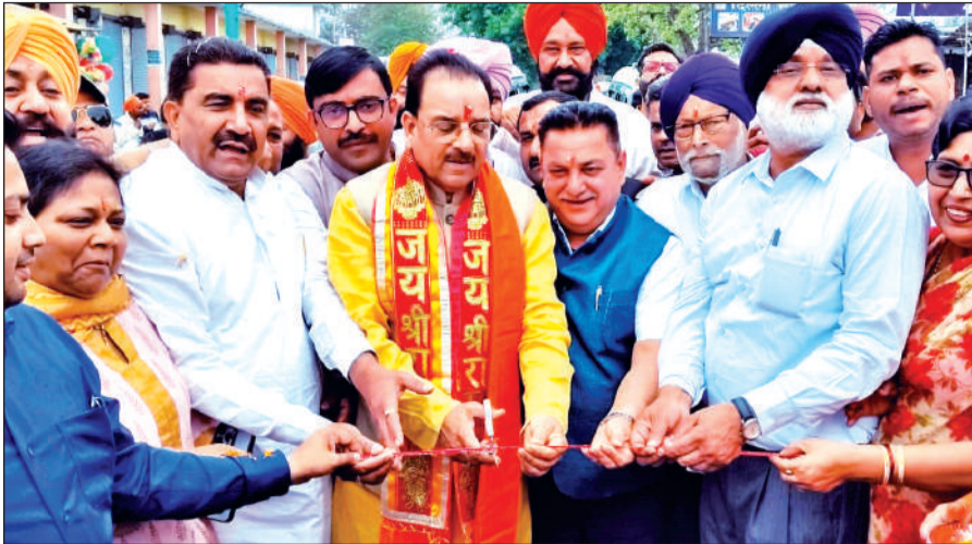
काशीपुर में चैती मेले का फीता काटकर शुभारंभ करते सांसद अजय भट्ट व अन्य अतिथि।

सांसद अजय भट्ट ने कहा कि मां दुर्गा के नौ अवतार सभी जनमानस को नौ दिव्य गुणों का आशीर्वाद दें और लोगों के जीवन की सभी समस्याओं से रक्षा करें। उन्होंने जनता से आह्वान किया कि अधिक से अधिक संख्या में मेले में पहुंचकर मेले का आनंद उठाएं और माता का आशीर्वाद प्राप्त करें।