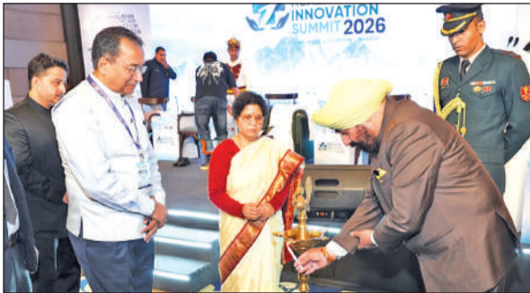
हिमालयन हेल्थकेयर इनोवेशन समिट का शुभारंभ करते राज्यपाल गुरमीत सिंह।