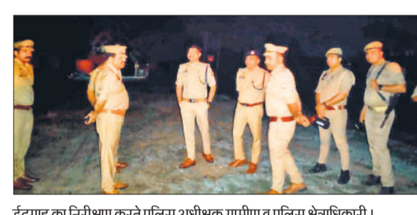
ईदगाह का निरीक्षण करते पुलिस अधीक्षक ग्रामीण पुलिस क्षेत्राधिकारी।

अधिकारियों ने नगर की विभिन्न ईदगाहों और संवेदनशील स्थलों का दौरा कर सुरक्षा व्यवस्थाओं का जायजा लिया। इस दौरान उन्होंने संबंधित थाना प्रभारियों को आवश्यक दिशा-निर्देश भी दिए, ताकि त्योहार के दौरान किसी भी प्रकार की अव्यवस्था उत्पन्न न हो सके। निरीक्षण के दौरान साफ-सफाई, प्रकाश व्यवस्था और सुरक्षा के पुख्ता इंतजाम सुनिश्चित करने पर विशेष जोर दिया गया।