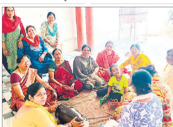
साई मंदिर में भजन कीर्तन करती महिलाएं।