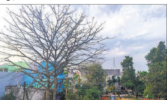
दिन भर छाए रहे बादल।