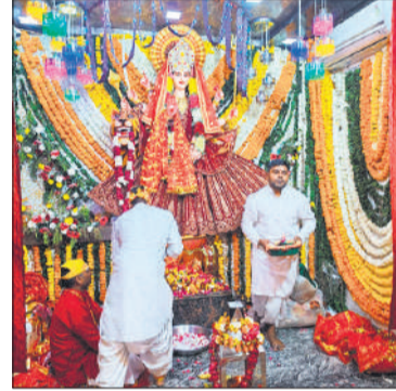
चामुंडा मंदिर में सजा माता का दरबार।

इस दौरान श्रद्धालुओं ने मां ज्वाला देवी दरबार से आई दिव्य ज्योत के दर्शन किए। बड़ी संख्या में भक्त नौ दिनों के लिए अखंड ज्योत अपने घर भी लेकर गए। मंगला आरती के बाद मंदिर के कपाट खोले गए, जिसके बाद दर्शन-पूजन का सिलसिला शुरू हुआ। कोतवाली क्षेत्र के हल्लू सराय स्थित चामुंडा देवी मंदिर के अलावा बहजोई कस्बे के मां भगवंतपुर वाली देवी मंदिर, मां