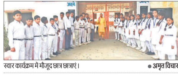
स्वार कार्यक्रम में मौजूद छात्र छात्राएं।