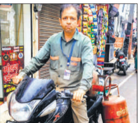
सिलेंडर ले जाता डिलीवरी मैन।

नहीं आ रहा है। गैस सिलेंडरों की कालाबाजारी व अवैध भंडारण रोकने के लिए की जा रही छापेमारी से कई गैस एजेंसी संचालक इन दिनों दोहरी मुश्किल में हैं। कुछ एजेंसी संचालकों का कहना है कि वह एक तरफ तो उपभोक्तों का दबाव दिन भर झेल रहे हैं ऊपर से पूर्ण विभाग व प्रशासन की अन्य टीमों के पहुंचने पर रिकॉर्ड दिखाने में काफी समय बीत रहा है। समय से सिलेंडर की