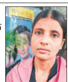
गैस सिलेंडर नहीं मिल रहा है जिसके कारण काफी परेशानी हो रही है। गैस के लिए कई-कई दिन बाद मिले सिलेंडरों को किया सीज

घरेलू गैस के लिए तमाम एजेंसियों पर लोगों की भीड़ लगी हुई है। लोगों का कहना है कई-कई