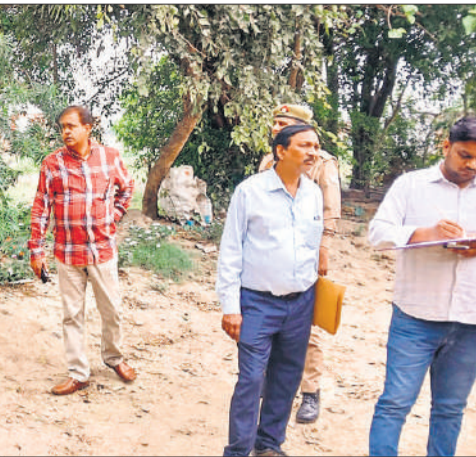
भोट में कार्रवाई करती टीम।