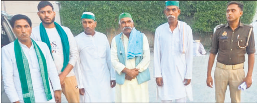
पुलिस गिरफ्तार में भाकियू असली के पदाधिकारी।