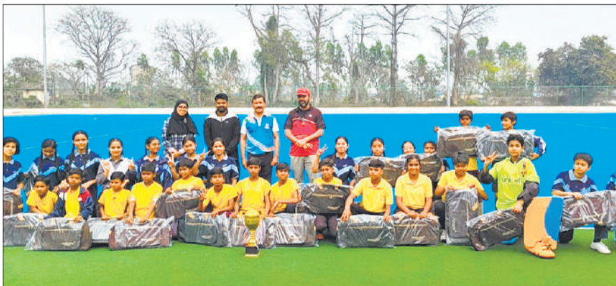
नवाब जुल्फिकार अली खां स्टेडियम पर विजेता और उप विजेता टीमें।