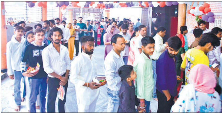
प्राचीन काली माता मंदिर पर दर्शन के लिए लाइन में लगे श्रद्धालु।

भक्तों ने घरों में शुभ मुहूर्त में घट स्थापना की। कलश स्थापना के साथ मां दुर्गा का आह्वान किया गया। दुर्गा सप्तशती का पाठ कर परिवार की सुख-समृद्धि की कामना की। नवरात्र के पहले दिन महानगर के लालबाग स्थित प्राचीन काली मंदिर, कोट रोड स्थित दुर्गा मंदिर, मनोकामना मंदिर और बुधबाजार के दुर्गा मंदिर सहित शहर के सभी