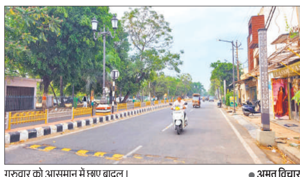
गुरुवार को आसमान में छाए बादल।

गुरुवार को पूरे दिन आसमान में बादल छाए रहे हालांकि बारिश नहीं हुई। जबकि बुधवार-गुरुवार की मध्यरात्रि हल्की बूंदाबांदी हुई। बूंदाबांदी होने से मौसम ठंडा हो गया। मौसम ठंडा होने से रोजेदारों को काफी राहत मिली। हालांकि कुछ देर बारिश होने के बाद थम गई लेकिन, गुरुवार सुबह से आसमान में बादल छाए रहे।