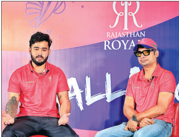
जयपुर में प्रेसवार्ता के दौरान राजस्थान रॉयल्स के कप्तान रियान पराग (बाएं) और टीम के मुख्य कोच कुमार संगकारा।

उन्होंने हाल में टी20 विश्व कप में अच्छा प्रदर्शन करके टूर्नामेंट के सर्वश्रेष्ठ खिलाड़ी का पुरस्कार हासिल किया था। पराग ने कहा कि पिछले सत्र के आखिर में उनकी टीम का प्रदर्शन अच्छा नहीं रहा