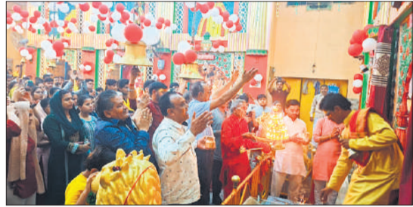
चंदौसी के रामबाग धाम में देवी की आराधना करते श्रद्धालु।

चंदौसी, अमृत विचार : चैत्र नवरात्र के प्रथम दिन रामबाग धाम पर सुबह से श्रद्धालुओं का तांता लगा रहा और दिनभर दर्शन-पूजन का सिलसिला चलता रहा। लोगों ने मां भगवती के दर्शन कर सुख-समृद्धि की कामना की। शाम 7 बजे आयोजित महाआरती में सैकड़ों श्रद्धालु शामिल हुए। इस दौरान पूरा वातावरण भक्तिमय हो गया और मां के जयकारों से क्षेत्र