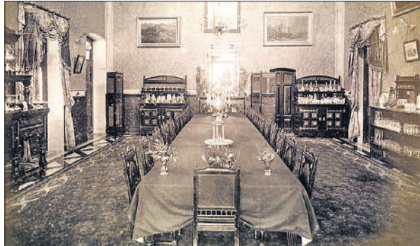
इसी दस्तरखान पर सजते थे लजीज पकवान।

हैं कि ईद का चांद दिखने के बाद जश्न शुरू हो जाता था। ईद के दिन दस्तरखान हर खासों आम के लिए खुला रहता था। हामिद मंजिल में