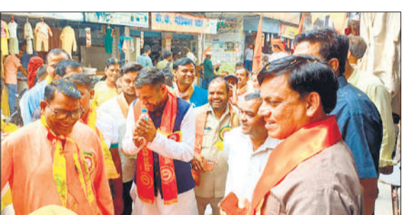
नवरात्र व नव वर्ष के उपलक्ष्य में आर्य समाज की शोभायात्रा में शामिल लोग।

गुरुवार को बुध बाजार स्थित आर्य समाज मंदिर से शोभायात्रा का शुभारंभ हुआ, जिसमें स्वामी दयानंद सरस्वती, झांसी की रानी सहित विभिन्न देवी-देवताओं एवं महापुरुषों की आकर्षक झांकियों शामिल रहीं। शोभायात्रा नगर के प्रमुख मार्गों मस्जिद कुरैशियान, गंज बाजार, राजीव मार्केट, छीपियान मस्जिद, मछली बाजार, धीमरो वाली मस्जिद, इमली वाली जियारत, बाल्मीकि बस्ती, जाटवान, हाईवे अंबेडकर पार्क, छहरायान, पटाणों वाली