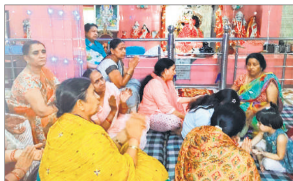
ठाकुरद्वारा में दुर्गा मंदिर में भजन कीर्तन करती महिलाएं।

ठाकुरद्वारा में चैत्र नवरात्र के पावन पर्व की शुरुआत गुरुवार को मां दुर्गा के प्रथम स्वरूप मां शैलपुत्री की विधि-विधान के साथ पूजा-अर्चना एवं आराधना से हुई। नगर सहित ग्रामीण क्षेत्रों के मंदिरों में सुबह से ही श्रद्धालुओं की लंबी कतारें लग गईं और पूरा वातावरण