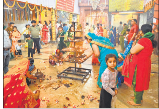
चामुंडा मंदिर में पूजा अर्चना अनुष्ठान करते श्रद्धालु।