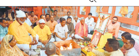
नव संवत्सर पर पूजन हवन के दौरान मौजूद श्रद्धालु और अन्य लोग।