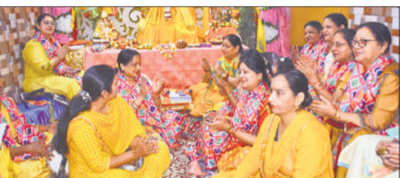
लाजपत नगर में भजन संध्या में शामिल महिलाएं।