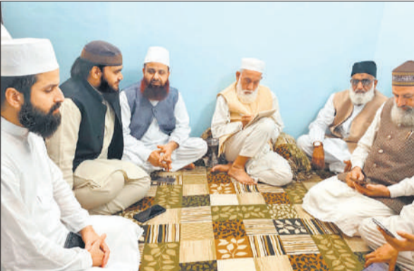
ईद के चांद को लेकर शहर की जामा मस्जिद में मंत्रणा करते उलमा।