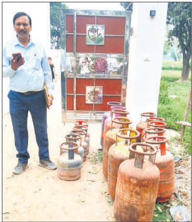
भोट में बरामद सिलेंडर।

छापेमारी के दौरान संबंधित परिसर को खुलावाकर गहन निरीक्षण किया गया, जिसमें बड़ी संख्या में घरेलू, व्यावसायिक एवं 5 किग्रा. वाले गैस सिलेंडरों का अनाधिकृत भंडारण पाया गया। मौके से कुल 6 व्यावसायिक बड़े सिलेंडर, जिनमें 4 भारत गैस के थे, 5 घरेलू बड़े सिलेंडर, जिनमें 4 इंडेन एवं एक एचपी गैस के हैं। इसके अलावा 4 व्यावसायिक 5 किग्रा के सिलेंडर तथा 1 घरेलू 5 किग्रा का सिलेंडर बरामद किया गया। बरामद सभी