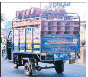
गैस सिलेंडर से भरा ट्रेपो।

घरेलू रसोई गैस व कमर्शियल गैस सिलेंडर की नियमित आपूर्ति न होने से घरों के साथ ही होटल, रेस्टोरेंट संचालक वैकल्पिक उपाय करने में लगे हैं। सरकार के द्वारा घरेलू गैस उपभोक्तों के सिलेंडर बुकिंग की तिथि 25 दिन करने से वह परेशान है। अचानक गैस खत्म होने पर भोजन पकाने के वैकल्पिक उपाय घरों में किए गए हैं। वहीं अस्कार के द्वारा नये कनेक्शन और डीबीसी पर रोक का फंडा भी काम