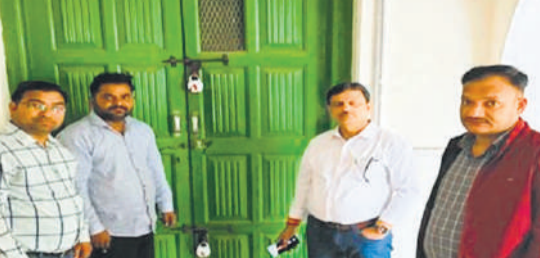
बकाएदारों के प्रतिष्ठान सील करते नगर निगम के कर्मी।