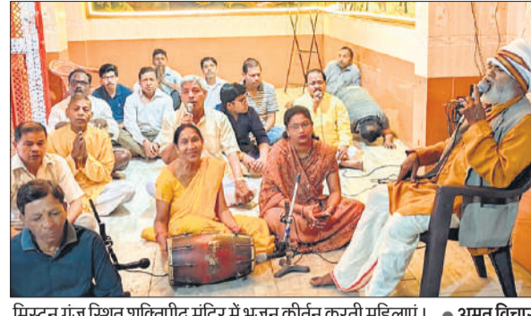
मिस्टन गंज स्थित शक्तिपीठ मंदिर में भजन कीर्तन करती महिलाएं।