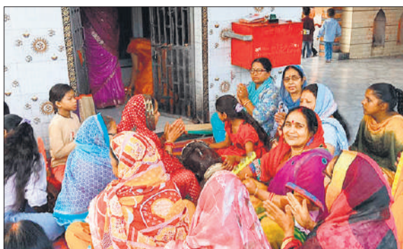
माता का गुणगान करती श्रद्धालु।

बृहस्पतिवार से चैत्र नवरात्रों का प्रारंभ हो गया है। नागरिकों ने धूमधाम के साथ अपने अपने घरों में कलश स्थापना, उपवास आदि कर मां शैलपुत्री का गुणगान किया। नवरात्र के अवसर पर नगर के प्रसिद्ध माता का थान मंदिर, श्री रामलीला मंदिर, रविदास मंदिर, वाल्मीकि मंदिर, पट्टीवाला शिव मंदिर, वैश्य विश्वनोई शिव मंदिर, मोहिनी मंदिर आदि मंदिरों पर प्रातः काल से ही श्रद्धालुओं का ताँता लगा रहा। नगर के सभी मुख्य मंदिरों पर प्रातःकाल से ही रौनक दिखाई दी। मंदिरों पर महिलाओं ने भजन गीता गाकर मां दुर्गा का गुणगान किया। नवरात्रों के चलते बाजार