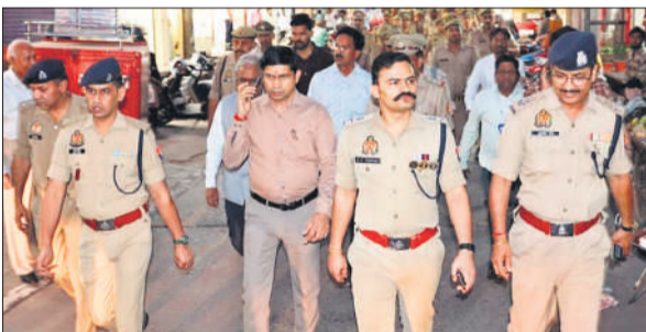
पुलिस बल के साथ पैदल मार्च करते डीएम व एसपी।

पैदल मार्च के दौरान डीएम और एसपी ने विभिन्न प्रमुख स्थानों पर रुककर स्थानीय लोगों, व्यापारियों और संभ्रंत नागरिकों से बातचीत की। उन्होंने स्पष्ट संदेश दिया कि त्योहार के दौरान किसी भी