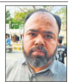
गैस लेने के लिए एजेंसी के कई बार चक्कर लगा चुके हैं। एजेंसी वाले केवाईसी कराने की बात कहकर टाल रहे हैं।