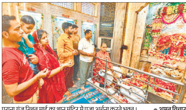
पुराना गंज स्थित माई का थान मंदिर में पूजा अर्चना करते भक्त।