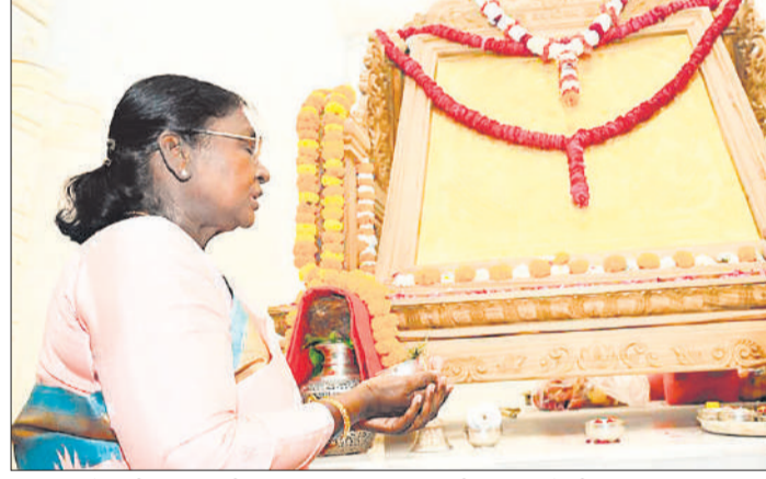
राम मंदिर के द्वितीय तल पर श्रीराम यंत्र का पूजन अर्चन करती राष्ट्रपति द्रौपदी मुर्मू।

अमृत विचार : राष्ट्रपति द्रौपदी मुर्मू ने गुरुवार को हिंदू नववर्ष के आगमन व चैत्र नवरात्र के पहले दिन श्रीराम जन्मभूमि मंदिर में श्रीराम यंत्र की प्रतिष्ठापना की। उन्होंने राज्यपाल आनंदी बेन पटेल व मुख्यमंत्री योगी के साथ रामलला के चरणों में शीश झुकाकर व आरती उतारकर श्रद्धा निवेदित की। मंदिर परिसर में सभी देवों के समक्ष शीश झुकाया। दर्शन-पूजन के बाद राष्ट्रपति ने भावुक होकर कहा, श्रीराम की मेरे ऊपर बहुत कृपा है। आज अयोध्या में होना मेरे जीवन का कृतार्थ करने वाला पल है। उन्होंने प्रभु राम से देश की समृद्धि, शांति और नागरिकों की भलाई की प्रार्थना की। श्रीराम जन्मभूमि मंदिर के द्वितीय तल पर श्रीरामयंत्र की विधिवत प्रतिष्ठापना की। श्रीराम यंत्र दो वर्ष पूर्व जगदगुरु शंकराचार्य विजयेंद्र सरस्वती महाराज द्वारा शोभायात्रा के माध्यम से अयोध्या भेजा गया था। वैदिक गणित और ज्यामितीय आकृतियों पर आधारित यह यंत्र देवताओं का निवास माना जाता है, जो सकारात्मक ऊर्जा आकर्षित करने की क्षमता रखता है। दक्षिण भारत, काशी, अयोध्या के आचार्यों द्वारा मंदिर में श्रीराम यंत्र के लिए नए दिवसीय वैदिक अनुष्ठान पहले से ही शुरू हो चुका था। राष्ट्रपति ने राम परिवार की मध्याह्न आरती में भी भाग लिया। मंदिर परिसर का