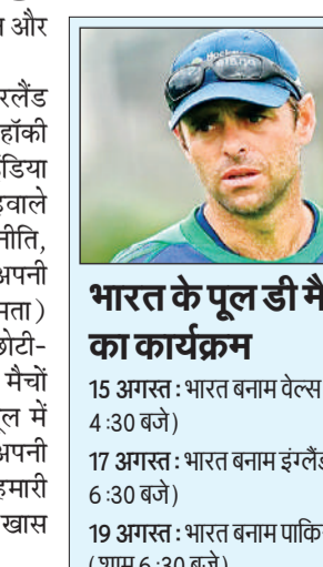
भारत के पूल डी मैचों का कार्यक्रम

अगले कुछ महीने हमारे लिए सबसे अहम हैं क्योंकि हमें ठीक सही समय पर अपनी बेहतरीन फॉर्म में आना है।