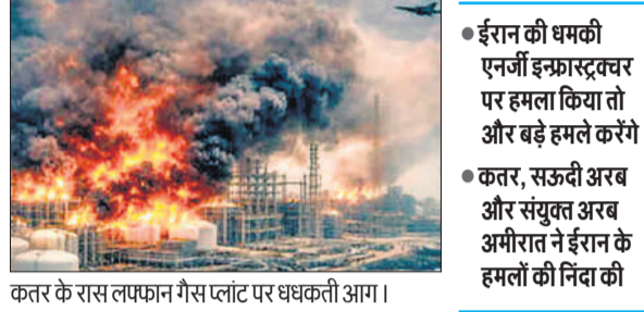
कतर के रास लफान गैस प्लांट पर धकती आग।

ईरान ने अपने एक प्रमुख गैस फील्ड पर इजराइल के हमलों के जवाब में गुरुवार को चार से अधिक खाड़ी देशों में तेल और गैस के प्रतिष्ठानों पर हमले किए। ईरान के इस वार से वैश्विक अर्थव्यवस्था प्रभावित होने लगी है। इन हमलों के बाद ईरान के दामों में तेजी से वृद्धि हुई और ईरान के पड़ोसी अरब देशों के सीधे संघर्ष के दायरे में आने का खतरा बढ़ गया है। ईरान ने कतर के रास लफान गैस प्लांट पर हमले किए। होर्मुज में ईरान के अवरोधों के कारण पहले से दबाव में बनी हुई वैश्विक आपूर्ति ईरान के इन हमलों से और अधिक दबाव में आ रही है। इस क्षेत्र में संयुक्त अरब अमीरात के तट के पास एक जहाज में आग लगा दी गई और कतर के पास एक अन्य जहाज क्षतिग्रस्त हो गया। एक ईरानी ड्रोन से लाल सागर में स्थित सऊदी अरब की एक रिफाइनरी को निशाना बनाया गया। इजराइल और अमेरिका द्वारा 28 फरवरी को ईरान पर हमलों के साथ युद्ध शुरू होने के बाद से अंतर्राष्ट्रीय बाजारों में कच्चे तेल की कीमत 116 डॉलर प्रति बैरल