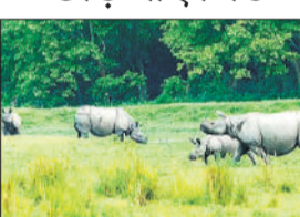
पलिया कलां, अमृत विचार: दुधवा टाइगर रिजर्व के दक्षिण सोनारीपुर रेंज स्थित 27 वर्ग किलोमीटर क्षेत्रफल की ऊर्जा बाड़ में रह रहे एक सींग वाले करीब छह गैंडों को 21 मार्च से खुले जंगल में छोड़े जाने की तैयारी शुरू हो गई है। अवमुक्त करने से पहले विशेषज्ञ पशु चिकित्सा टीम द्वारा गैंडों को ट्रैक्यूलाइज कर उनका स्वास्थ्य परीक्षण किया जाएगा और उनकी निगरानी के लिए रेडियो कॉलर लगाए जाएंगे।

वर्ष 1984 में असम और नेपाल से लाए गए आठ गैंडों से शुरू हुई गैंडा पुनर्वासन योजना अब सफल साबित हो रही है। वर्तमान में गैंडों की संख्या बढ़कर करीब 51 हो चुकी है। इसी क्रम में सलुकापुर क्षेत्र में फेज-1 और बेलरायां के छंगा नाला परिक्षेत्र में फेज-2 योजना संचालित की जा रही है।