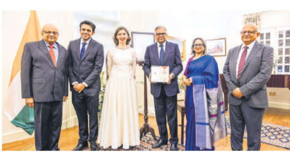
टाटा ग्रुप के चेयरमैन एन. चंद्रशेखरन, भारत में ब्रिटिश हाई कमिश्नर लींडी कैमरून और अन्य लोगों के साथ, नई दिल्ली में 'केबीई' का प्रतीक चिह्न प्रारंभ करने के बाद।

भारतीय रिजर्व बैंक (आरबीआई) ने बृहस्पतिवार को कहा कि बैंक के आचरण या शासन के संबंध में कोई बड़ी चिंता की बात नहीं है। कहा कि एचडीएफसी बैंक एक घरेलू प्रणालीगत रूप से महत्वपूर्ण बैंक (डी-एसआईबी) है जिसके पास मजबूत वित्तीय स्थिति, पेशेवर तरीके से संचालित बोर्ड और सक्षम प्रबंधन दल है। हमारे समय-समय पर किए गए आकलन के आधार पर, इसके आचरण या शासन के संबंध में कोई बड़ी चिंता नहीं है। बयान में जोर दिया गया कि बैंक के पास पर्याप्त पूंजी है और उसकी वित्तीय स्थिति संतोषजनक बनी हुई है।