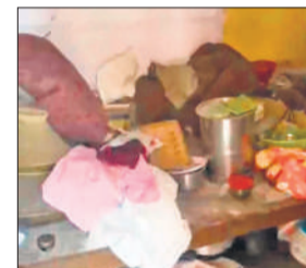
चोरी के बाद बिखरा सामान।

अमृत विचार: थाना क्षेत्र के गांव पहुंचा बुजुर्ग में बुधवार/गुरुवार की रात अज्ञात चोरों ने एक घर को निशाना बनाया। चोर लाखों रुपये के जेवरों और नकदी लेकर फरार हो गए। पुलिस ने मामला दर्ज कर जांच शुरू कर दी है।