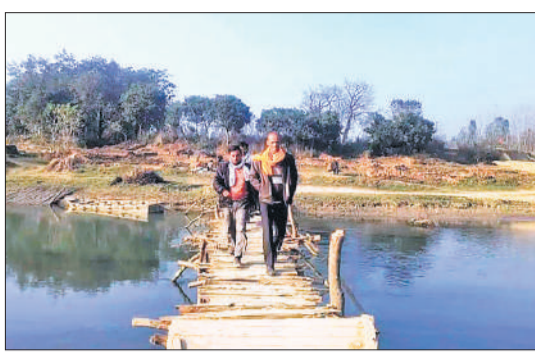
भाखड़ा नदी पर पुल बनने से लोगों को मिलेगी राहत।