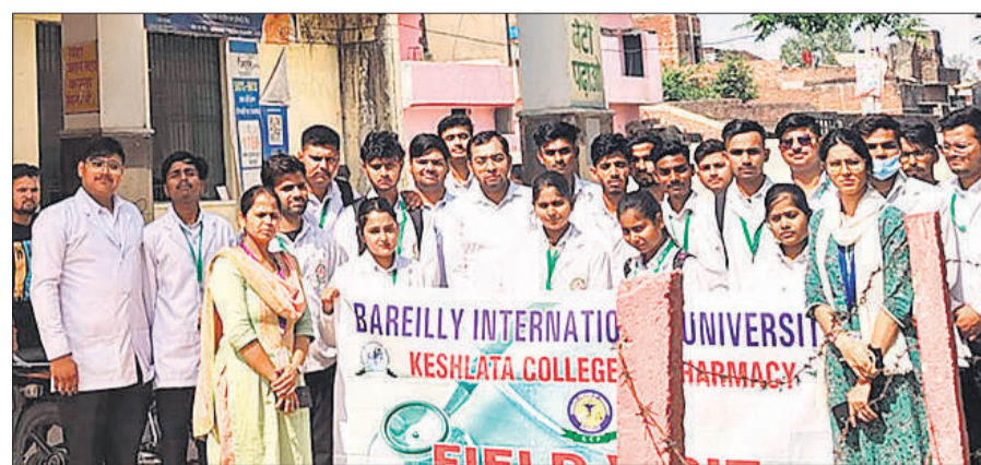
केशलता कॉलेज ऑफ फार्मेसी विभाग के डीफार्मा के छात्रों ने बिथरीचैनपुर सीएचसी में व्यवस्थाएं देखने को भ्रमण किया।