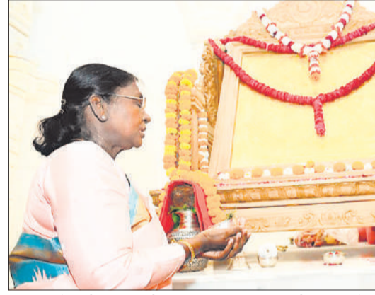
राम मंदिर के द्वितीय तल पर श्रीराम यंत्र का पूजन अर्चन करती राष्ट्रपति द्रौपदी मुर्मू।

अयोध्या कार्यालय अमृत विचार : राष्ट्रपति द्रौपदी मुर्मू ने गुरुवार को हिंदू नववर्ष के आगमन व चैत्र नवरात्र के पहले दिन श्रीराम जन्मभूमि मंदिर में श्रीराम यंत्र की प्रतिष्ठापना की। उन्होंने राज्यपाल आनंदी बेन पटेल व मुख्यमंत्री योगी के साथ रामलला के चरणों में शीश झुकाकर व आरती उतारकर श्रद्धा निवेदित की। मंदिर परिसर में सभी देवों के समक्ष शीश झुकाया। दर्शन-पूजन के बाद राष्ट्रपति ने भावुक होकर कहा, श्रीराम की मेरे ऊपर बहुत कृपा है। आज अयोध्या में होना मेरे जीवन का कृतार्थ करने वाला पल है। उन्होंने प्रभु राम से देश की समृद्धि, शांति और नागरिकों की भलाई की प्रार्थना की। श्रीराम जन्मभूमि मंदिर के द्वितीय तल पर श्रीरामयंत्र की विधिवत प्रतिष्ठापना की। श्रीराम यंत्र दो वर्ष पूर्व जगद्गुरु शंकराचार्य विजयेंद्र सरस्वती महाराज द्वारा शोभायात्रा के माध्यम से अयोध्या भेजा गया था। वैदिक गणित और ज्योतिषीय आकृतियों पर आधारित यह यंत्र