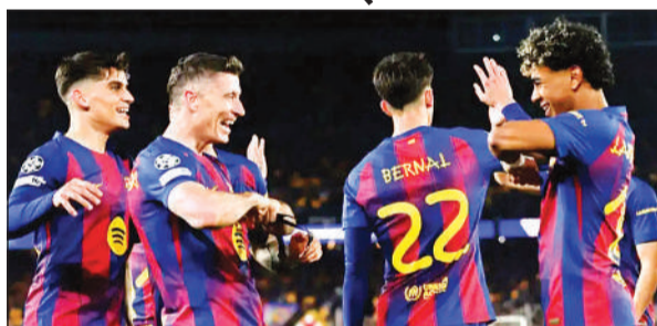
जर्शन मनाती बार्सिलोना की टीम।

बार्सिलोना ने सात गोल किए और लिवरपूल ने चार गोल करके बुधवार को चैंपियंस लीग फुटबॉल टूर्नामेंट में बड़ी जीत दर्ज करके क्वार्टर फाइनल में जगह बनाई। एटलेटिको मैड्रिड ने टोटनहम के पलटवार का का अच्छी तरह से सामना करते दूसरे चरण में 2-3 से हार के बावजूद 7-5 से जीत दर्ज करके अंतिम आठ में अपनी जगह सुरक्षित की। बायर्न म्यूनिख के लिए क्वार्टर फाइनल में पहुंचना सबसे आसान रहा। उसने बुधवार को अटलांटा को 4-1 से और कुल मिलाकर 10-2 से हराकर रियाल मैड्रिड के खिलाफ रोमांचक क्वार्टर फाइनल की नींव रखी। चैंपियंस लीग में एक बार फिर गोल की बरसात हुई। बार्सिलोना ने रोमांचक मुकाबले में न्यूकैसल को दूसरे हाफ में बुरी तरह से हरा दिया और 7-2 से जीत हासिल की। न्यूकैसल में खेले गए पहले चरण में 1-1 से बराबरी पर रहने