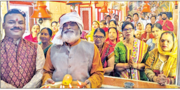
मंदिर में मां ब्रह्मचारिणी की आरती करते भक्त।