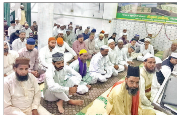
बिलासपुर की अमलताश वाली मस्जिद में नमाज में मौजूद रोजेदार।