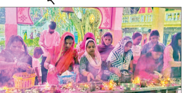
पूजा अर्चना करती महिलाएं।

अमृत विचार: नवरात्रों के द्वितीय दिन देवी मंदिरों में प्रातः से ही भक्तों की भीड़ लगनी शुरू हो गई। वहीं भक्तों द्वारा मां ब्रह्मचारिणी की विधि विधान के साथ पूजा अर्चना कर आशीर्वाद प्राप्त किया। मंदिरों पर सुरक्षा व्यवस्था के मध्य नजर पुलिस बल तैनात रहा, वहीं पालिका द्वारा भी मंदिरों पर विशेष सफाई अभियान चलाया गया था। शुक्रवार को नगर की शक्तिपीठ मां चामुंडा मंदिर पर चौत्र नवरात्र के द्वितीय दिन मां दुर्गा के द्वितीय स्वरूप मां ब्रह्मचारिणी की भक्तों द्वारा विधि विधान से पूजा अर्चना कर माता रानी से आशीर्वाद प्राप्त किया गया। चामुंडा मंदिर