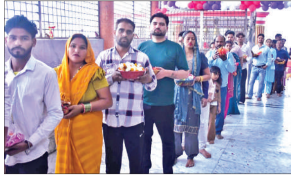
प्राचीन काली माता मंदिर पर दर्शन के लिए लाइन में लगे भक्त। ● अमृत विचार

बारिश में कभी लोग इधर उधर रुक जाते लेकिन जैसे ही बारिश कम होती सभी फिर लाइन में लग कर मंदिर में मातारानी के दर्शन पूजन के लिए आगे बढ़ते रहे। इसके अलावा कोर्ट रोड स्थित मां दुर्गा मंदिर, हरथला, आशियाना फेज एक सहित मंदिरों में भी भक्तों ने पूजा अर्चना कर परिवार के सुख समृद्धि व कल्याण की प्रार्थना की। वहीं अन्य देवालियों में भी पूजा अर्चना का क्रम चलता रहा। शाम को मंदिर में महिला भक्तों ने देवी गीत गाए। भजन मंडली ने