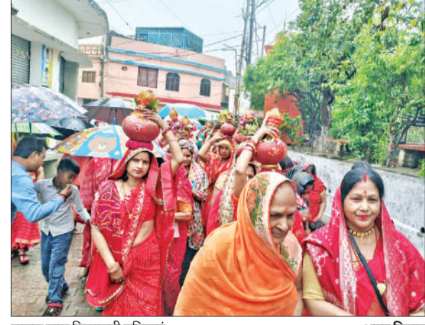
कलश यात्रा निकालती महिलाएं