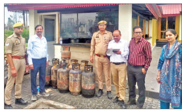
कोयला ढाबा पर जब्त सिलेंडरों के साथ पूर्ति विभाग की टीम।