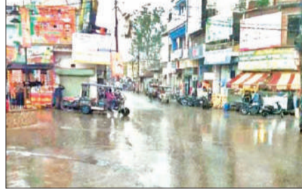
राज्य ब्यूरो, लखनऊ