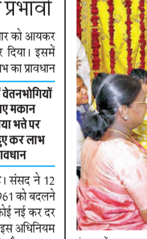
वृंदावन में ब्रज प्रवास के दूसरे दिन शुक्रवार को राष्ट्रपति द्रौपदी मुर्मु ने संत प्रेमानंद जी महाराज से राधा केली कुंज आश्रम में 27 मिनट तक बातचीत की। इस दौरान आध्यात्म और समाज से जुड़े विषयों पर चर्चा हुई। प्रेमानंद महाराज ने उन्हें नाम जप को जीवन का मार्ग बताया।