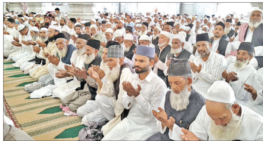
नमाज के बाद मुल्को-कौम की तरक्की के लिए दुआ करते नमाजी।

कोयले वाली मस्जिद, पटरो वाली मस्जिद, लाल मस्जिद, राजद्वारा मस्जिद, मस्जिद नवाब गेट, एक मीनार वाली मस्जिद, कचहरी वाली मस्जिद, मीना बाजार, रेलवे स्टेशन, ज्वालानगर, सिविल लाइंस, शीशम वाली मस्जिद, अजीतपुर आदि मस्जिदों अलविदा जुमे को नमाजियों से भर गई। नमाज के बाद मुल्को कौम की तरक्की के लिए दुआ की गई।