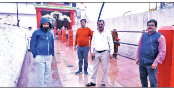
लालबाग स्थित काली मंदिर परिसर का निरीक्षण करते नगर आयुक्त दिव्यांशु पटेल।

नगर आयुक्त ने नवरात्रि के दूसरे दिन हो रही बारिश के दौरान लोगों को असुविधा न हो इसके लिए लालबाग स्थित काली मंदिर परिसर व आसपास के क्षेत्रों का भ्रमण किया। क्षेत्रीय सफाई निरीक्षक व सफाई सुपरवाइजर को जलभराव न होने देने और नालियों की सफाई कराने के साथ ही सड़क पर कूड़ा करकट न पड़ा होना सुनिश्चित करने का निर्देश