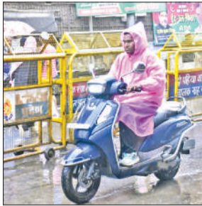
रेनकोट पहन कर जाता चालक।