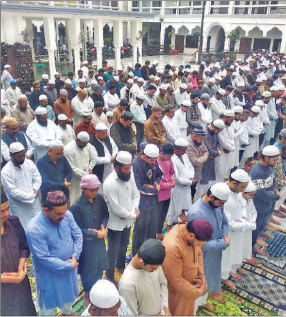
शहर की जामा मस्जिद में नमाज अदा करते लोग।

शुक्रवार की सुबह से जारी बारिश के कारण शहर और कस्बों की सड़कों पर जलभराव और कीचड़ की स्थिति बनी रही। इसके बावजूद नमाजी तमाम मुश्किलों को पार करते हुए मस्जिदों तक पहुंचे। नमाज के बाद अल्लाह की बारगाह में मुल्क में अमन-चौन, खुशहाली और कौम की तरक्की के लिए हाथ उठाकर दुआ मांगी गई। इस बार चांद के हिसाब से रमजान के पूरे 30 रोजे होने के कारण शुक्रवार को पड़ा जुमे को