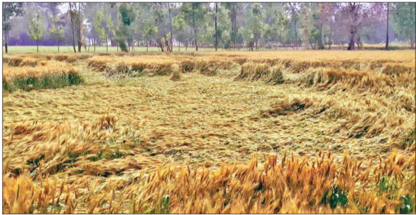
अमरौहा में बारिश से गिरी गेहूँ की फसल।

सर्दी, जुकाम, छींक और बुखार से लोग परेशान हैं। बारिश से बाजारों में चहल पहल कम रही। दुकानदारों ने पानी से सामान न भीगे इसके लिए बाहर पालीथीन लगाकर ढका। मौसम विभाग के अनुसार अभी शनिवार को भी बारिश का अनुमान है। रविवार को मौसम सामान्य हो सकता है।