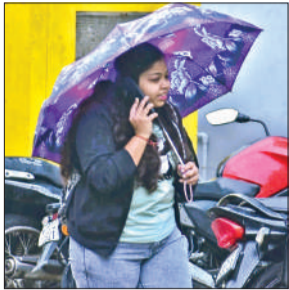
बारिश में छाता लगा कर जाती युवती।

पिछले कुछ दिनों की तेज धूप के बाद बुधवार से तापमान में कमी आने लगी। ठंडी हवा के झोंके के बीच गुरुवार को कई बार रुक-रुक कर बूदाबांदी होती रही। लेकिन शुक्रवार की भोर से बारिश का क्रम दिन में भी जारी रहा। कई बार बारिश थमी लेकिन कुछ देर बाद फिर होने लगी। पूरे दिन सूर्यदेव के दर्शन नहीं हुए। बारिश व हवा से ठंड फिर से लौट आई। गर्मी का मौसम मानकर स्वेटर जैकेट रखने वालों को उसे फिर से निकालने की नौबत आई। शुक्रवार को लोग स्वेटर, जैकेट पहनकर निकले। बारिश के चलते अधिकतम और न्यूनतम तापमान