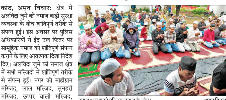
नमाज अदा करते मुस्लिम समाज के लोग।