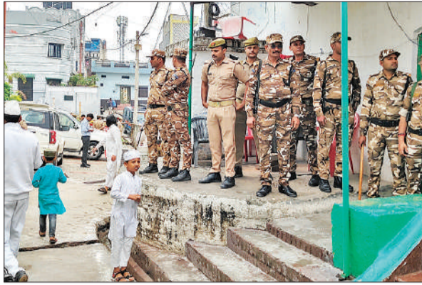
संभल में जामा मस्जिद गेट पर मुस्तेद आरआरएफ के जवान।

चौकी पर बनाए गए सीसीटीवी कंट्रोल रूम से जामा मस्जिद क्षेत्र समेत शहर के संवेदनशील इलाकों पर लगातार नजर रखी गई। अपर पुलिस अधीक्षक स्वयं कैप कर व्यवस्थाओं की मॉनिटरिंग करते रहे। नमाज के दौरान किसी भी प्रकार की अव्यवस्था न हो, इसके लिए मस्जिद कमेटी ने भी व्यापक इंतजाम किए थे। चार्लेटियर तैनात कर नमाजियों को व्यवस्थित तरीके से अंदर प्रवेश और बाहर निकलने में सहयोग दिया गया।