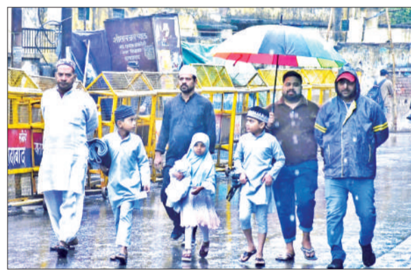
नमाज के बाद बारिश में घर लौटते नमाजी। ● अमृत विचार

का विशेष महत्व होता है, जिससे लेकर लोगों में खास उत्साह नजर आया। सुरक्षा व्यवस्था को लेकर प्रशासन सतर्क रहा। जामा मस्जिद समेत प्रमुख स्थानों पर भारी पुलिस बल तैनात किया गया था। वरिष्ठ अधिकारी मौके पर मौजूद रहे और लगातार हालात की मॉनीटरिंग करते रहे। जिससे पूरे आयोजन के दौरान शांति और व्यवस्था बनी रही।