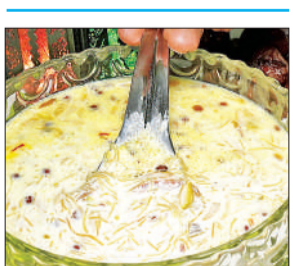
ईद पर तैयार होगा शीर कोरमा।

भगत के लिए ईद पर तरह-तरह के व्यंजन बनाए जाने की तैयारी है। शीर खुरमा और शीर कोरमा के अलावा शाही टुकड़े, काबुली पुलाव, चिकन कबाब, मटन बिरयानी, दही बड़े, दही फुलकिया आमतौर पर तैयार होते हैं।