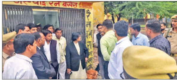
भवन का निरीक्षण करती जनपद न्यायाधीश।

शुक्रवार को जिला जज डॉ. विदुषी सिंह ने प्रस्तावित अस्थाई कोर्ट रूम का निरीक्षण किया। निरीक्षण के दौरान उन्होंने संबंधित अधिकारियों को निर्देश दिए कि मरम्मत एवं व्यवस्थागत कार्यों को शीघ्र पूर्ण किया जाए, ताकि न्यायिक कार्यों बिना किसी बाधा