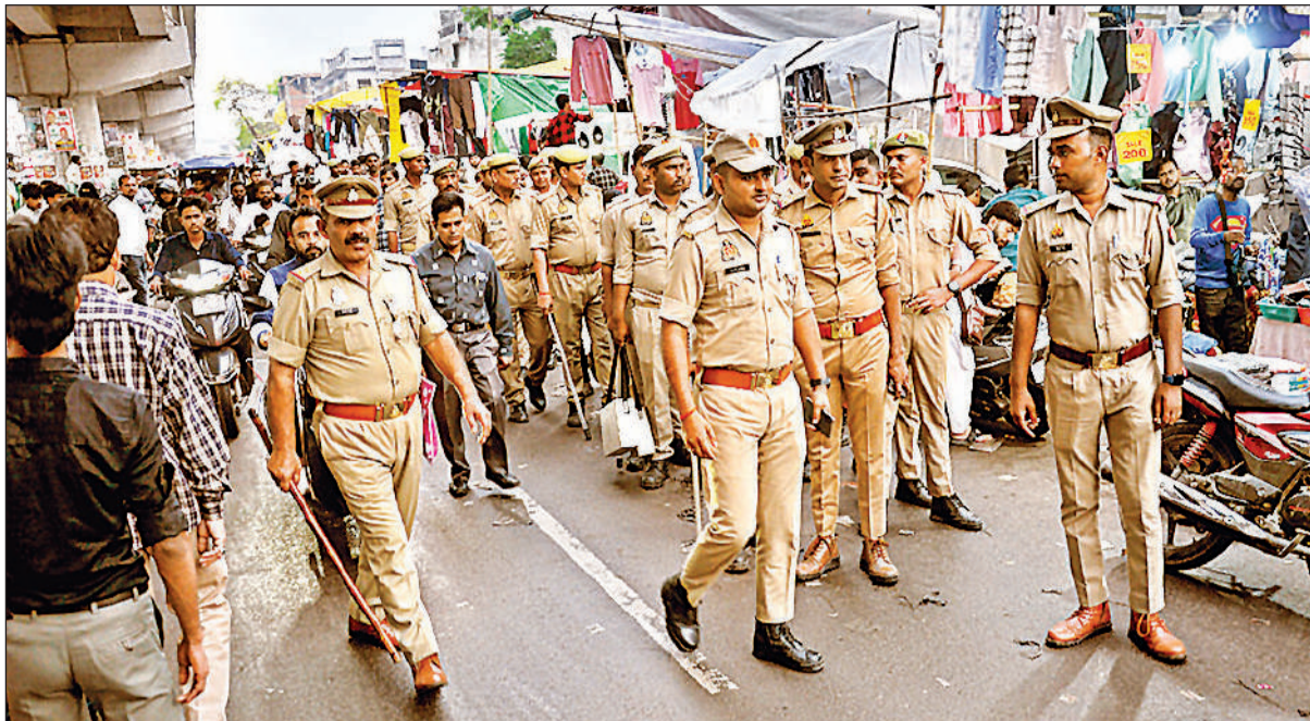
ईद-उल-फ़ितर के अवसर पर सुरक्षा को लेकर पुराने लखनऊ के नवखास क्षेत्र में मार्च करती पुलिस टीम।

अमृत विचार, लखनऊ : कृषि क्षेत्रीय सम्मेलन का आयोजन लखनऊ में 17 अप्रैल को किया जाएगा। इस आयोजन में यूपी के मुख्यमंत्री और कृषि मंत्री के साथ ही हरियाणा, हिमाचल प्रदेश, पंजाब, उत्तराखंड, दिल्ली, चंडीगढ़, जम्मू-कश्मीर और लद्दाख राज्यों के कृषि मंत्री और वरिष्ठ अधिकारी शामिल होंगे। कृषि विभाग ने इसकी तैयारियां तैयार कर दी हैं। प्रदेश के कृषि मंत्री सूरी प्रताप शाही ने बताया कि केंद्र सरकार के कृषि एवं किसान कल्याण मंत्रालय द्वारा क्षेत्रीय सम्मेलन का आयोजन किया जा रहा है। उन्होंने बताया कि इस सम्मेलन में कृषि और संबद्ध क्षेत्रों से जुड़े प्रमुख ग्रुपों पर विचार-विमर्श करने के साथ ही महत्वपूर्ण योजनाओं की समीक्षा भी होगी। सम्मेलन का स्थान जल्द ही तय किया जाएगा।