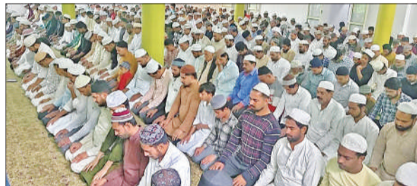
नमाज अदा करते लोग।