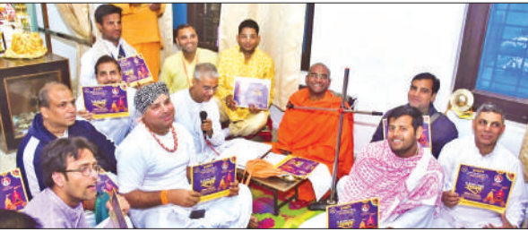
रथ यात्रा के बारे में जानकारी देते पदाधिकारी।

इसकी जानकारी शुक्रवार को इस्कॉन केंद्र आशियाना पर पत्रकारों को पदाधिकारियों ने जानकारी दी। बताया कि शोभायात्रा में चार अलग-अलग रॉक बैंड, आठ सुंदर झंझियां ऊंट घोड़े आदि रहेंगे। इसमें दिल्ली, गाजियाबाद, पिलखुआ, हापुड, काशीपुर, रामनगर, बरेली, अफजलगढ़, बिजनौर रामपुर,