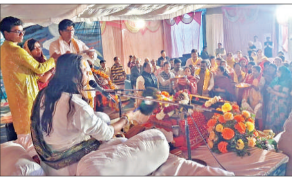
आदर्श कॉलोनी श्री हरिहर मंदिर में श्रीमद्भागवत कथा में मौजूद श्रद्धालु।

उन्होंने कहा कि मां की उपासना समर्पित करने से सब कुछ प्राप्त होता है। जिस प्रकार बेलपत्र पर लाल चंदन शहद लगाकर भगवान शिव को अर्पित करने से महादेव प्रसन्न होकर सब कुछ दे देते हैं। वैसे ही मां प्रसन्न होकर भक्तों को सब कुछ दे देती है। नवदुर्गा में मां की उपासना कई गुना फल दायक बन जाती है। व्यास जी ने कहा कि जब भक्ति घर में उतरती है तो घर मंदिर बन जाता है जल में उतरती है तो चरणामृत और जब