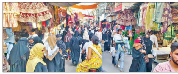
ईद पर बाजार सफ़दरगंज में खरीदारों की भीड़।