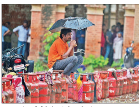
प्रयागराज में एलपीजी सिलेंडर के लिए बारिश में इंतजार करना मुश्किल।

ईरान युद्ध के कारण होम्सुर्ज जलडमरूमध्य बंद हो गया है, जो एक महत्वपूर्ण समुद्री मार्ग है। इसके जरिए भारत अपने आयात का 60 प्रतिशत प्राप्त करता है। इतनी बड़ी मात्रा में आपूर्ति अचानक बंद होने से सरकार ने घरेलू रसोई के लिए आपूर्ति को प्राथमिकता दी है। व्यावसायिक प्रतिष्ठानों को आपूर्ति शुरू में पूरी तरह रोक दी गई थी लेकिन बाद में उनकी जरूरत का पांचवां हिस्सा बहाल किया गया। इससे घरेलू उपभोक्ताओं में घबराहट में सिलेंडर बुक करवाना शुरू कर दिया क्योंकि उन्हें इसकी उपलब्धता सीमित होने का डर था।