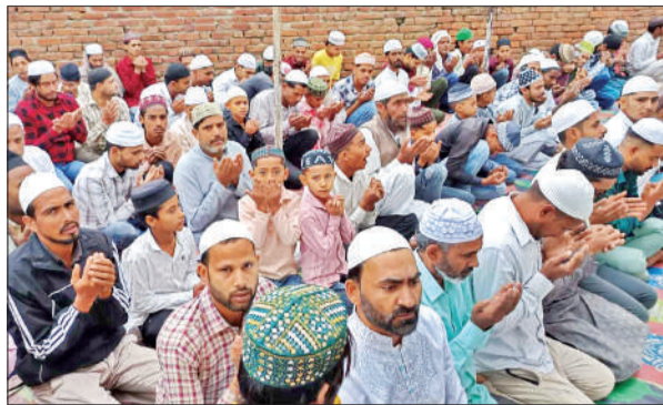
नमाज के बाद दुआ मांगते रोजेदार।