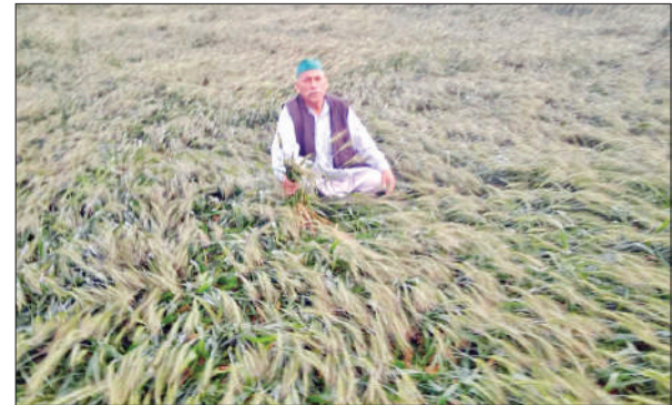
ठाकुरद्वारा के गांव चमरा में गिरी फसल को निहारता किसान।