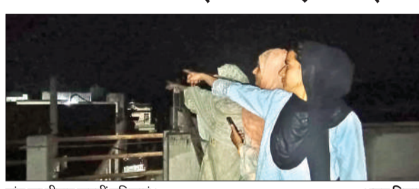
चांद का दीदार करती महिलाएं।