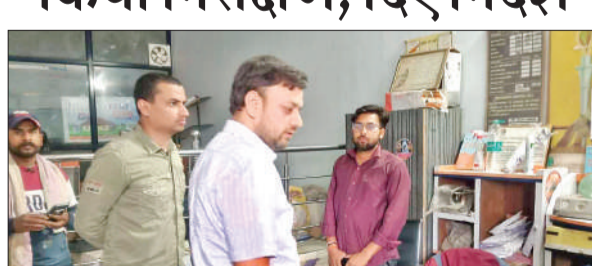
गैस एजेंसी का निरीक्षण करते उप जिलाधिकारी।