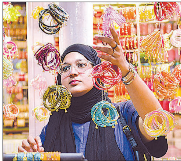
रंग-बिरंगे कंगन मोह रहे महिलाओं का मन।