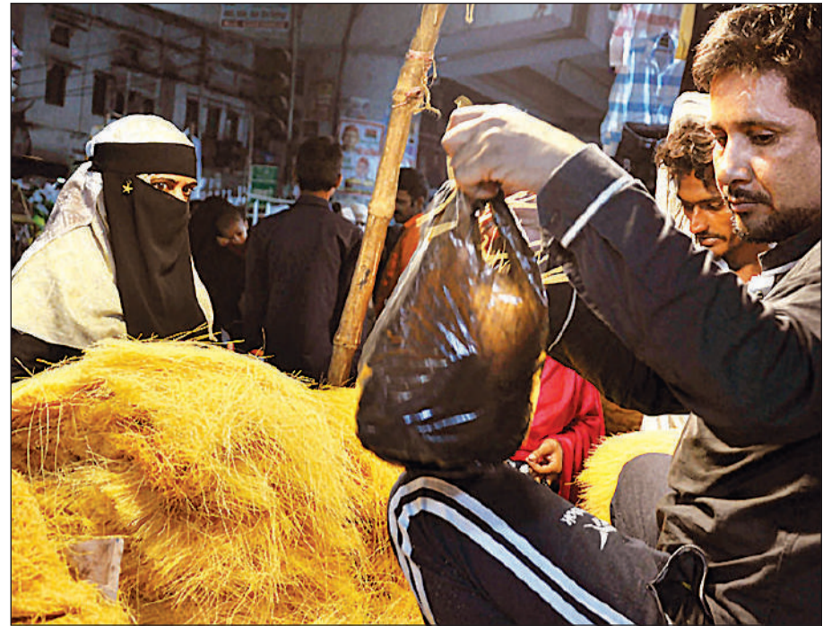
ईद को लेकर सेवई खरीदती मुस्लिम महिला।