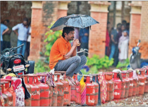
प्रयागराज में एलपीजी सिलेंडर के लिए बारिश में इंतजार करती युवक।

करता है। इतनी बड़ी मात्रा में आपूर्ति अचानक बंद होने से सरकार ने घरेलू रसोई के लिए आपूर्ति को प्राथमिकता दी है। व्यावसायिक प्रतिष्ठानों को आपूर्ति शुरू में पूरी तरह रोक दी गई थी लेकिन बाद में उनकी जरूरत का पांचवां हिस्सा बहाल किया गया। इससे घरेलू उपभोक्ताओं में घबराहट में सिलेंडर बुक करवाना शुरू कर दिया क्योंकि उन्हें इसकी उपलब्धता सीमित होने का डर था।