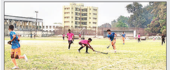
जिला स्टेडियम में खेला गया फाइनल मुकाबला।