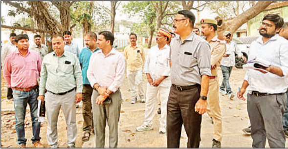
नाथनगर ब्लॉक मुख्यालय में निर्माणाधीन बीडीओ कक्ष का निरीक्षण करते जिलाधिकारी आलोक कुमार व अन्य अधिकारी। अमृत विचार

डीएम आलोक कुमार ने ब्लॉक परिसर में चल रही विकास योजनाओं की अभिलेखीय समीक्षा की और उनके क्रियान्वयन पर संतोष जताते हुए बीडीओ की सराहना की। इसके बाद उन्होंने निर्माणाधीन बीडीओ कक्ष का निरीक्षण किया, जहां दीवार टेढ़ी पाई गई और प्रयुक्त ईंटों की गुणवत्ता भी मानक के अनुरूप नहीं मिली। इस पर डीएम ने लोक निर्माण विभाग से सामग्री की गुणवत्ता की जांच कराने के निर्देश दिए। निरीक्षण के दौरान ब्लॉक कार्यालय में रखी जर्जर आलमारियों को हटाकर नए संसाधन क्रय करने, परिसर की साफ-सफाई व्यवस्था दुरुस्त करने के निर्देश भी दिए गए। वहीं, सीडीपीओ कार्यालय के निरीक्षण में अधिकारी के अनुपस्थित मिलने पर उन्होंने नाराजगी जताई। वहीं, परिसर में बेतरतीब पड़े जर्जर बेल्टे