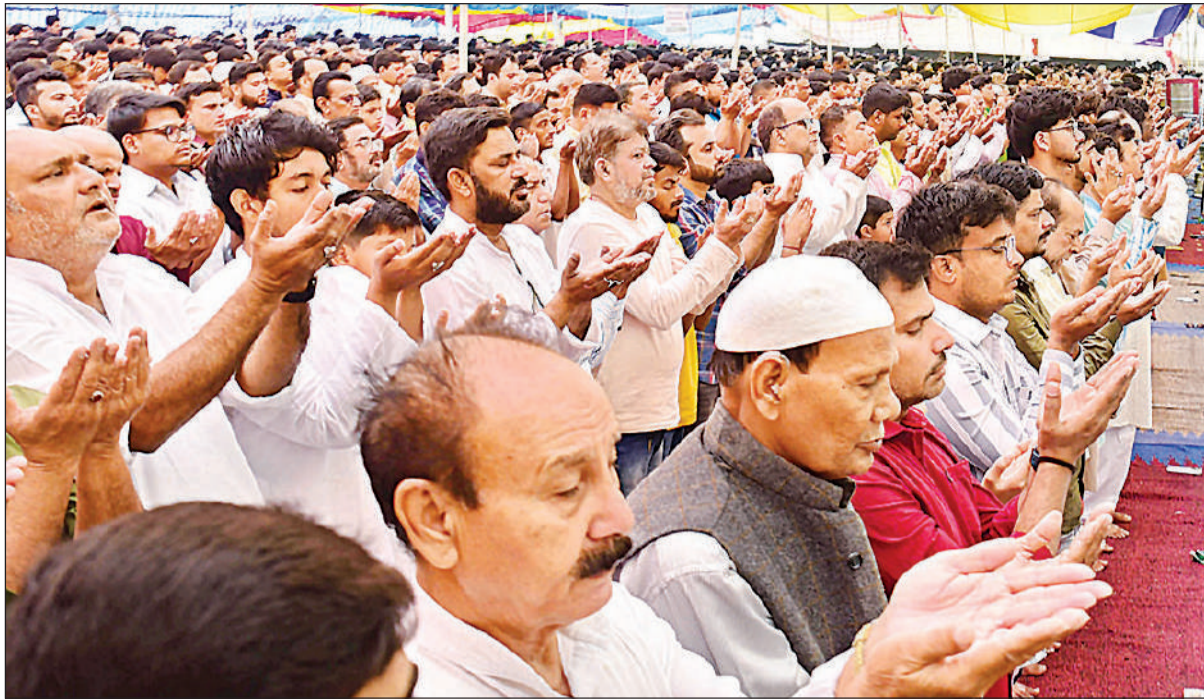
बड़ा इमामबाड़ा पर अलविदा की नमाज अदा करते मुस्लिम समुदाय के लोग।

अमृत विचार: काकोरी क्षेत्र में अवैध कर्मों के खिलाफ प्रशासन ने बड़ी कार्रवाई करते हुए नरीना स्थित दारिकापुरी कालोनी में नगर निगम की खसरा संख्या 517 पर बने पक्के अवैध निर्माण को बालडोजर से ध्वस्त कर दिया। शनिवार तड़के भारी पुलिस बल और राजस्व टीम की मौजूदगी में पूरी कार्रवाई की गई, जिससे इलाके में हड़कंध मच गया।