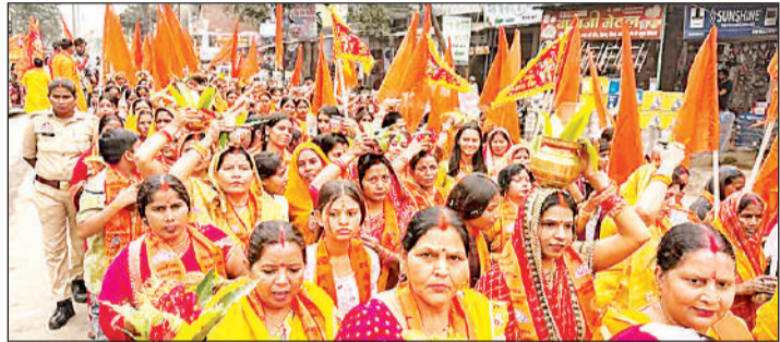
नगर में कलश यात्रा निकालती महिलाएं।

अयोध्या कार्यालय, अमृत विचार। प्री-वेडिंग शूट के बहाने युवती को कोलकाता बुलाकर उसे नशीला पदार्थ खिलाकर दुष्कर्म करने का और आरोपी शादी करने के लिए 25 लाख नकद व थार वाहन की मांग करने का आरोप है। पीड़ित पक्ष ने एसएसपी से इसकी शिकायत की है। थाना महाराजगंज अंतर्गत एक गांव में रहने वाले पीड़ित परिवार के अनुसार आरोपी युवक के साथ युवती की शादी तय हुई थी। इस दौरान उसने प्री-वेडिंग शूट कराने के बहाने युवती को कोलकाता बुलाया। वहां उसे नशीला पदार्थ देकर उसके साथ दुष्कर्म किया। घटना के बाद युवती की हालत बिगड़ गई। परिवारजिन उसे वापस अयोध्या लाए, जहां एक निजी अस्पताल में उसका इलाज चल रहा है। आरोप है कि जब उन्होंने आरोपी पक्ष से संपर्क किया तो शादी के बदले थार गाड़ी और 25 लाख रुपये की मांग की। मांग पूरी न होने पर आरोपी ने शादी से इनकार कर दिया।