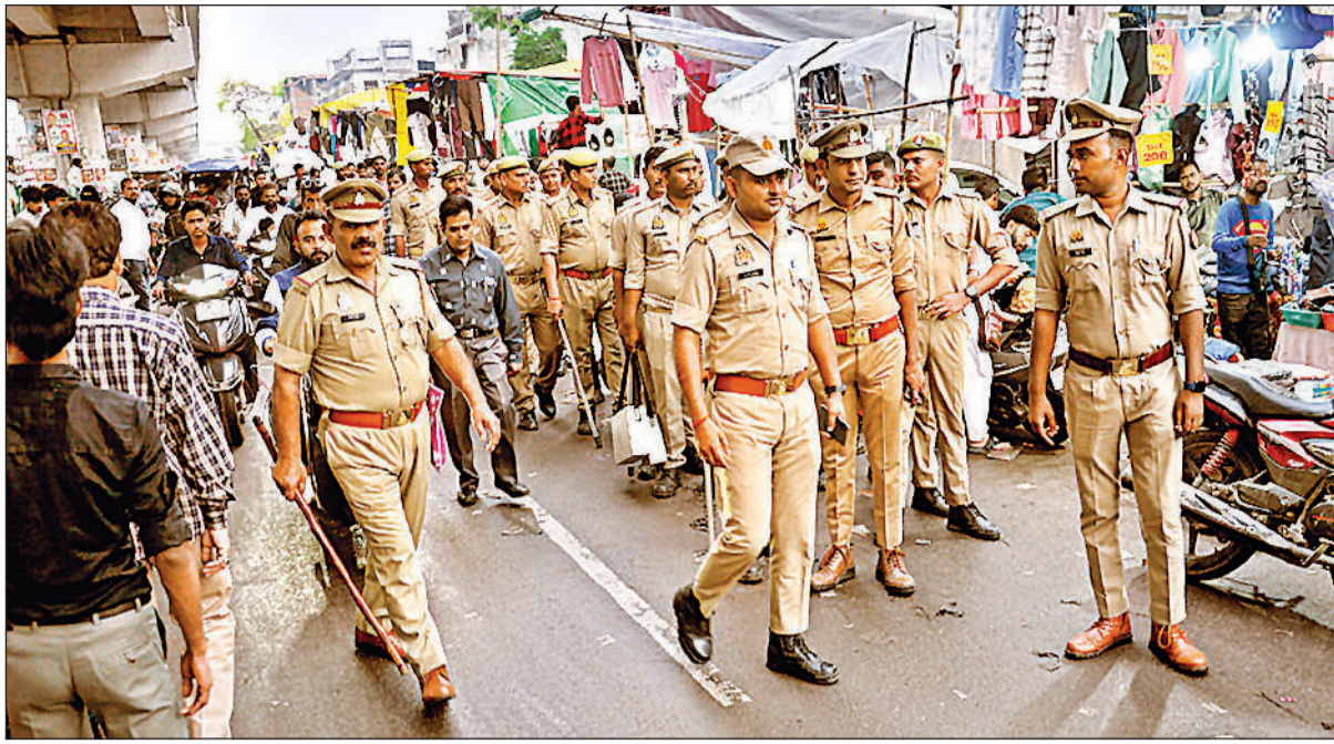
ईद-उल-फ़ितर के अवसर पर सुरक्षा को लेकर पुराने लखनऊ के नक्खास क्षेत्र में मार्च करती पुलिस टीम।

मुख्यमंत्री योगी आदित्यनाथ के नेतृत्व में रिफॉर्म, परफॉर्म और ट्रांसफॉर्म के मॉडल ने प्रदेश