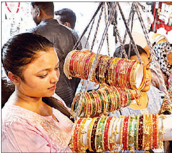
अमीनाबाद में दुकान पर कंगन देखती युवती।