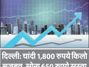
दिल्ली: चांदी 1,800 रुपये किलो मजबूत, सोना 650 रुपये सरस्ता

नई दिल्ली। अखिल भारतीय सर्रोफा सघ के मुताबिक चांदी की कीमत 1,800 रुपये बढ़कर सभी करों सहित 2,40,500 रुपये प्रति किलोग्राम हो गई। बृहस्पतिवार को यह 2,38,700 रुपये थी। हालांकि, 99.9 प्रतिशत शुद्धता वाले सोने में लगातार तीसरे दिन गिरावट जारी रही। यह 650 रुपये टूटकर सभी करों सहित 1,52,650 रुपये प्रति 10 ग्राम रहा। पिछले सत्र में सोना 1,53,300 रुपये पर बंद हुआ था।