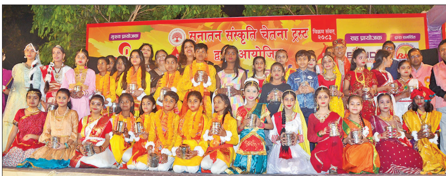
सनातन संस्कृति मेले में प्रतिभागियों को सम्मानित किया गया।