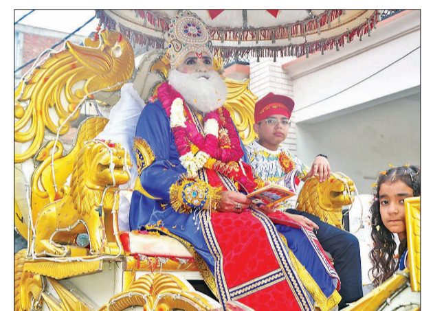
शोभायात्रा में शामिल झांकी।

जानकी मंदिर, शील चौराहा, बांके बिहारी मंदिर होते हुए डेलापीर स्थित झुलेलाल द्वार पर संपन्न हुई। यात्रा के बाद पवित्र अखंड ज्योत का नकटिया नदी में विसर्जन किया गया। शहर के विभिन्न स्थानों पर शोभायात्रा का स्वागत किया गया। उत्तर प्रदेश उद्योग व्यापार