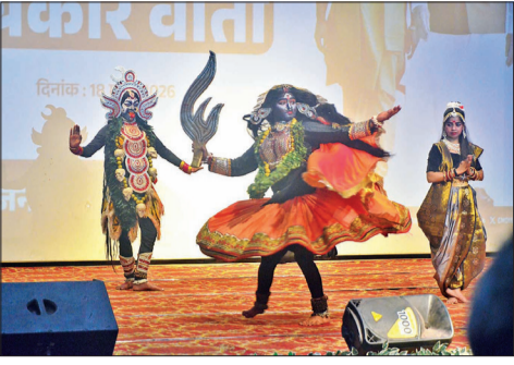
काली मां की झांकी प्रस्तुत करते कलाकार।