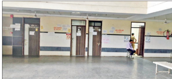
300 बेड अस्पताल में समय से पहले ओपीडी हुई बंद और लटके ताले।