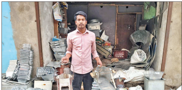
कोयले की भट्टी के बारे में जानकारी देता दुकानदार।

अमृत विचार : गैस किल्लत से रसोइयों का बजट गड़बड़ा गया है। लोग पारंपरिक विकल्पों की तरफ रुख कर रहे हैं। यही वजह है कि जो कोयले की भट्टियां पहले एक हजार से 15 सौ रुपये में मिल जाती थीं। अब उनके दाम बढ़ गए हैं। बाजार में औसतन एक इंडकेशन चूल्हे की कीमत करीब तीन हजार रुपये है। इतने ही दाम में कोयले की भट्टी बेची जा रही है। बांस मंडी में इन दिनों युद्ध स्तर पर