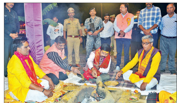
हवन में आहुति देते मंत्री नंद गोपाल नंदी व पदाधिकारी।

ने भी लोगों का ध्यान खींचा। इस दौरान लोग उत्साहित नजर आए। ट्रस्ट पदाधिकारियों ने बताया कि इस आयोजन का उद्देश्य सनातन संस्कृति