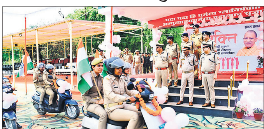
पुलिस लाइन में रैली को रवाना करते एडीजी, डीआईजी व एसएसपी।