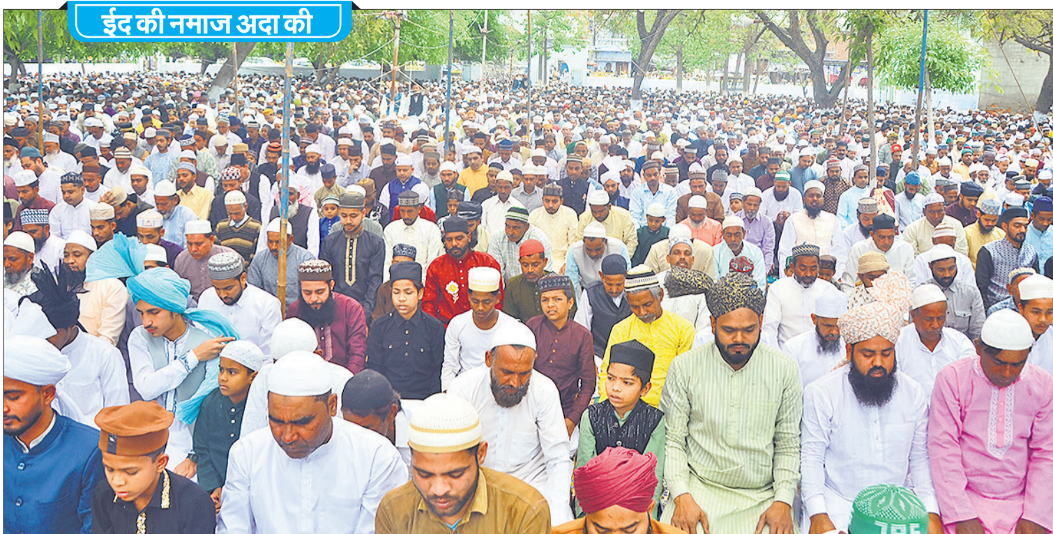
बाकरगंज ईदगाह में ईद की नमाज अदा करते लोग। (संबंधित खबर पेज 11 पर)।