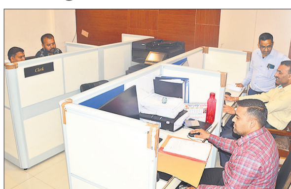
नगर निगम में ईद के दिन भी टैक्स ऑफिस खुला रहा।

अमृत विचार : यूपी के स्मार्ट शहरों में शुमार बरेलीवासियों ने इस बार नगर निगम के खजाने को भरने में न केवल तत्परता दिखाई है, बल्कि डिजिटल इंडिया के सपने को धरातल पर उतारने में भी अग्रणी भूमिका निभाई है। आंकड़ों के अनुसार, चालू वित्तीय वर्ष 2025-26 में 20 मार्च तक वसूली का आंकड़ा 100.40 करोड़ के पार पहुंच गया है। विभाग से मिले आंकड़ों में सबसे चौकाने वाला और सुखद पहलू डिजिटल भुगतान के प्रति जनता का बढ़ता रुझान है। बरेली नगर निगम के इतिहास में पहली बार ऐसा हुआ है जब