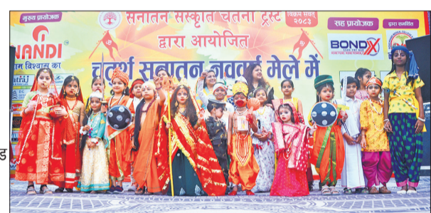
सनातन संस्कृति चेतना ट्रस्ट द्वारा आयोजित 'वर्षा सनातन नववर्ष मेले में' का कार्यक्रम।