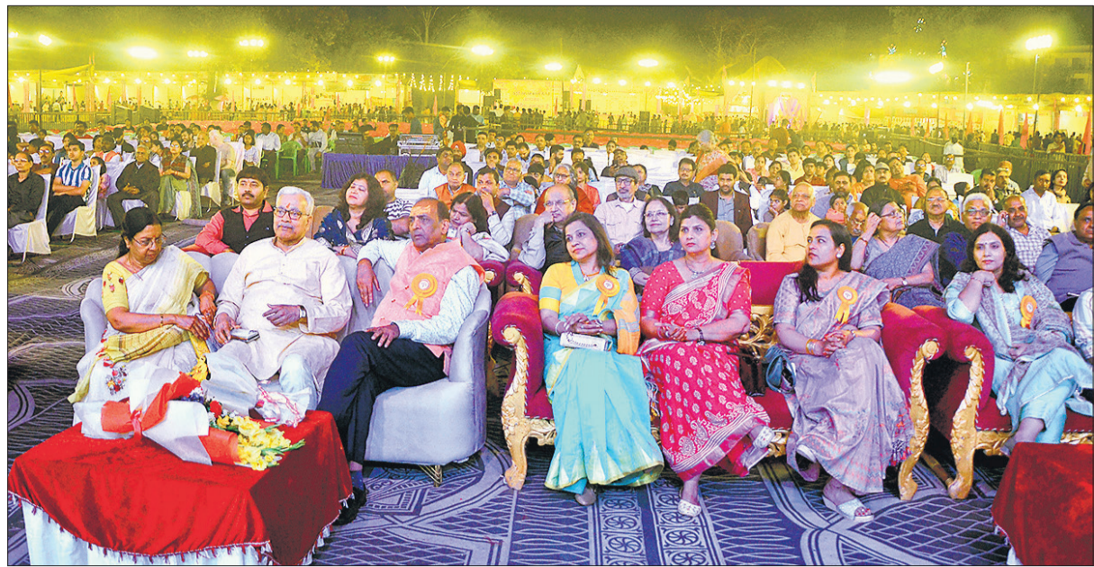
कवि सम्मेलन में मौजूद श्रोतागण।