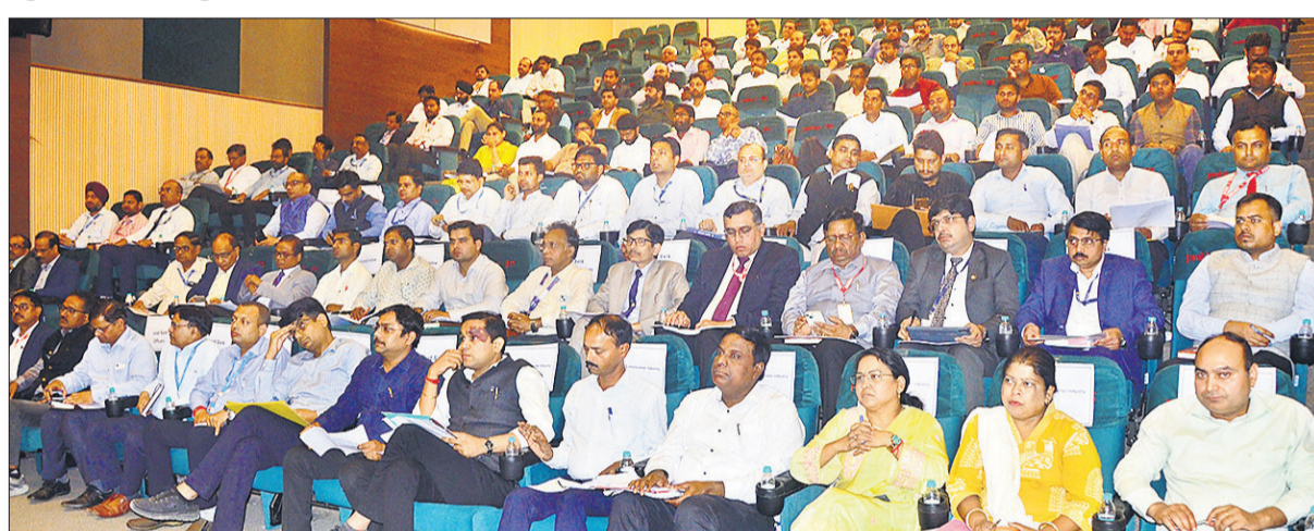
अर्बन हाट में आयोजित समीक्षा बैठक में विभिन्न बैंकों के अफसरों ने भाग लिया।

जब पांच लाख के छोटे लोन की बात आती है, जिससे गरीब युवा का घर चलना है तो वे हाथ पीछे खींच लेते हैं। सरकार इसे बेहद गंभीरता से ले रही है। सचान ने विधानसभा के सत्र का जिक्र करते हुए कहा कि केवल