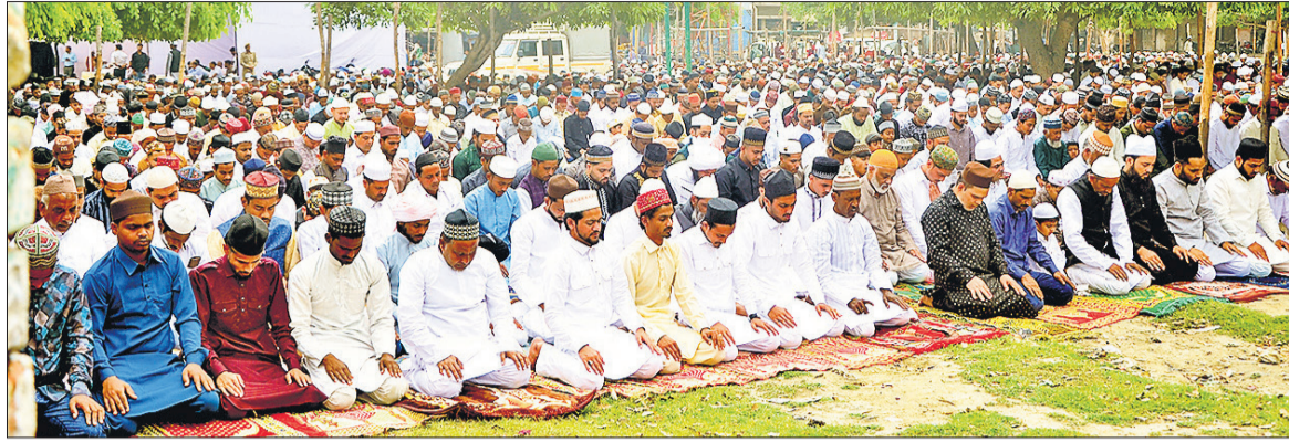
बाकरगंज ईदगाह में बड़ी संख्या में लोगों ने ईद की नमाज अदा की।

सबसे पहले बाजार संदल खान स्थित दरगाह वली मियां में नमाज अदा की गई। इसके बाद दरगाह ताजुशशरिया, दरगाह शराफत मियां, दरगाह बशीर मियां, खानकाह-ए-वामिकिया, खानकाह-ए-नियामिया, दरगाह शाहदाना वली, दरगाह रफीक-उल-औलिया, जामा मस्जिद, दरगाह नासिर मियां (नौमहला मस्जिद), मस्जिद बीबी जी, पीराशाह मस्जिद, हबिबिया