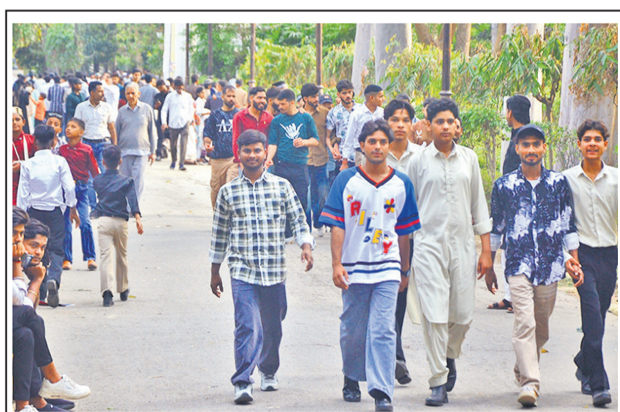
ईद के दिन गांधी उद्यान में लोगों की भारी भीड़ दिखी।

जाए। बैठक में मुख्य अभियंता, अधीक्षण अभियंता सहित जिले के आला अधिकारी मौजूद रहे, जिन्हें ग्रीष्मकालीन तैयारियों को समय से पूरा करने की अंतिम समय-सीमा दी गई।