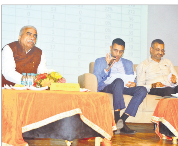
समीक्षा बैठक में मौजूद मंत्री राकेश सचान व अन्य।

अमृत विचार : प्रदेश सरकार युवाओं को उद्यमी बनाने के लिए 'मुख्यमंत्री युवा उद्यमी विकास अभियान' पर जबरदस्त तरीके से फोकस है, लेकिन बैंक इस महत्वाकांक्षी योजना को बड़ा लगा रहे हैं। अर्बन हाट में आगरा, अलीगढ़ और बरेली मंडल की समीक्षा बैठक के दौरान एमएसएमई मंत्री राकेश सचान ने बैंक अधिकारियों के दुर्लभ रवैये को लेकर तलख शब्दों में बैंक से सवाल किया कि जब योजना की 100 प्रतिशत गारंटी और ब्याज सरकार दे रही है तो फिर युवाओं को चक्कर क्यों लगवाए जा रहे हैं। उन्होंने चेतावनी भरे लहजे में कहा कि बैंक अपनी कार्यप्रणाली नहीं सुधारते हैं तो उनका नाम सरकारी योजनाओं के पोर्टल से हटावा दिया जाएगा। अर्बन हाट में शनिवार को बैठक में जब आंकड़े सामने आए तो मंत्री सचान का पारा चढ़ गया। समीक्षा में पाया गया कि प्राइवेट बैंकों ने मुख्यमंत्री युवा उद्यमी योजना के तहत आए 90 प्रतिशत आवेदनों को बिना किसी ठोस कारण के निरस्त कर दिया है। सरकारी बैंकों की स्थिति भी चिंताजनक है, जहां 60 प्रतिशत फॉर्म खारिज किए जा चुके हैं। मंत्री ने सख्त लहजे में कहा प्राइवेट बैंक बड़े लोन फौरन दे देते हैं, लेकिन