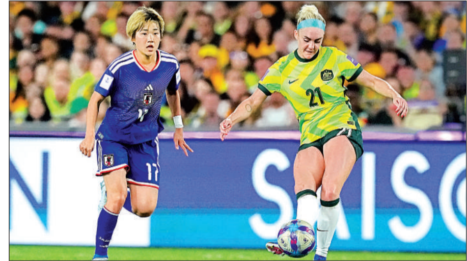
जापान की माइका हमानो के खिलाफ फुटबॉल पर नियंत्रण करने की कोशिश करती ऑस्ट्रेलिया की एली कारपेंटर।