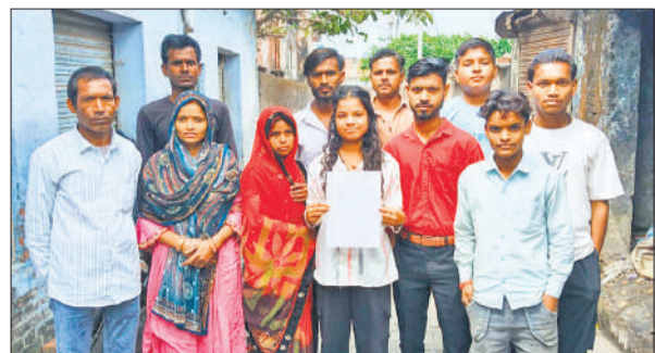
तहरीर लेकर थाने पहुंचे पीड़ित।