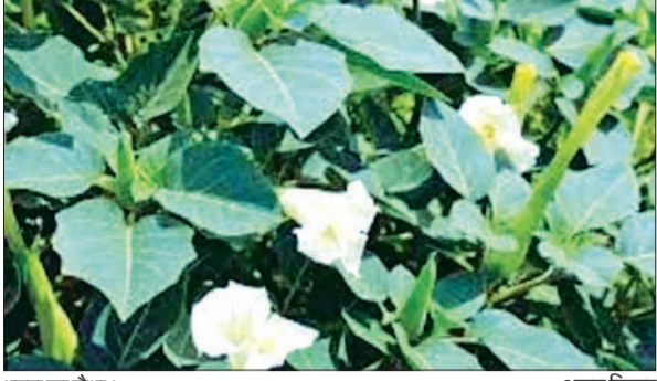
धतूरा का पौधा।