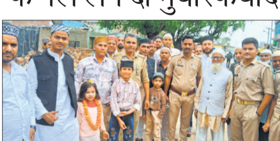
नमाज के दौरान क्षेत्र में तैनात पुलिस बल।