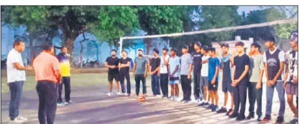
वॉलीबॉल संघ की शोकसभा में मौजूद पदाधिकारी व सदस्य।