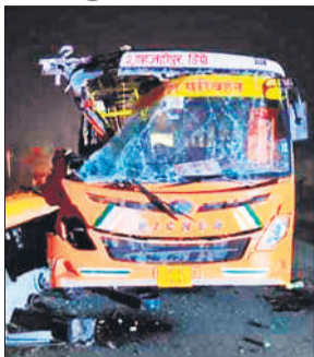
क्षतिग्रस्त निगम के बस।