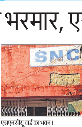
एसएनसीयू वार्ड का भवन।

मैडिकल कॉलेज से नहीं मिल रहे डॉक्टर, सीएमओ की ओर सिकिया जा रहा संचालन