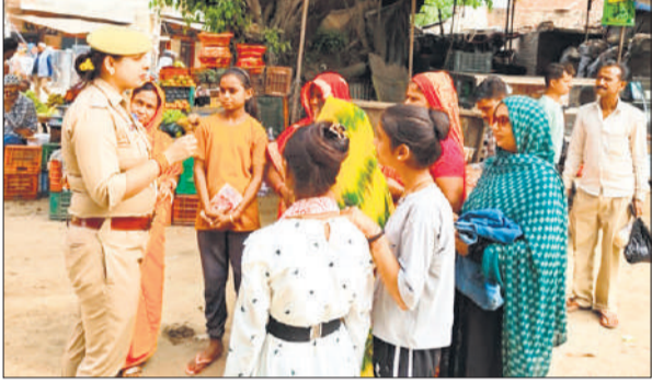
महिलाओं और बालिकाओं को जागरूक करती महिला पुलिसकर्मी। ● अमृत विचार

महिलाओं व बालिकाओं के सुरक्षाथ व स्वावलंबन के लिए चलाए जा रहे मिशन शक्ति अभियान के अंतर्गत महिला पुलिसकर्मियों ने अभियान चलाया। अपने-अपने थाना क्षेत्र के अंतर्गत जागरूकता कार्यक्रम किए। महिला संबंधित समस्याओं के निस्तारण के लिए चौपाल का आयोजन किया गया। महिलाओं व बालिकाओं के साथ जुड़कर उन्हें सशक्त और सुरक्षित वातावरण देने का प्रयास किया गया। इसके अलावा प्रमुख बाजारों, कस्बा, चौराहों, स्कूलों-कॉलेजों, धार्मिक स्थलों और