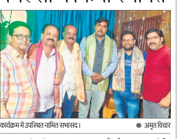
कार्यक्रम में उपस्थित नामित सभासद।