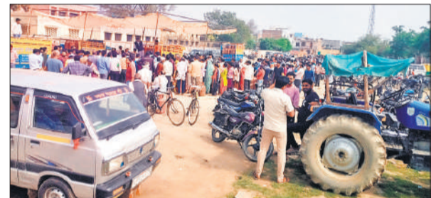
कॉलेज खेल मैदान में गैस सिलेंडर के लिए लाइन में खड़े उपभोक्ता। बुकिंग के बाद भी नहीं मिल रहे सिलेंडर, दुकानदारों को ब्लैक में सलाई के आरोप। ● अमृत विचार

अमृत विचार: कस्बे में घरेलू गैस सिलेंडरों की ब्लैकिंग और अव्यवस्था से उपभोक्ता परेशान हैं। हालात यह हैं कि गैस गोदाम के बाहर लंबी लाइन में खड़े रहने के बावजूद उपभोक्ताओं को समय पर सिलेंडर नहीं मिल पा रहे हैं, जबकि व्यवसायिक उपयोग करने वाले दुकानदारों को गैस की कोई कमी नहीं हो रही है। जानकारी के अनुसार सिलेंडर की बुकिंग के बाद डिलीवरी का मैट्रिज भी आ जाता है, लेकिन एक सप्ताह बीतने के बाद भी उपभोक्ताओं को गैस नहीं मिलती। इससे यह सवाल उठ रहा है कि भरे हुए सिलेंडर आखिर कहाँ जा रहे हैं, जिसका जवाब एजेंसी संचालक नहीं दे पा रहे हैं। गैस एजेंसी से जुड़े कर्मचारी शाम के समय चाट, पकौड़ी, कचौड़ी, समोसा और मिठाई बेचने