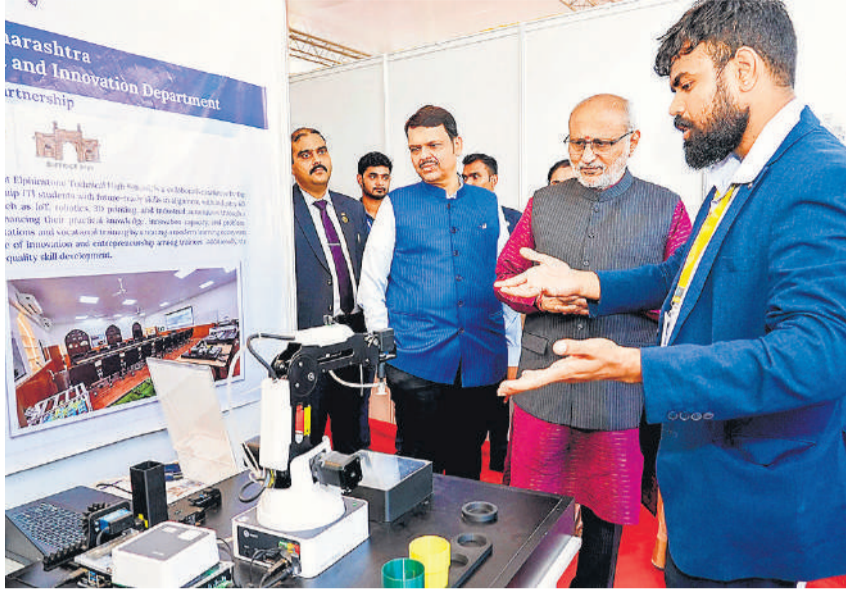
मुंबई के लोक भवन स्थित स्वर्गीय जयंत सहस्रबुद्धे हॉल में आयोजित एक प्रदर्शनी में उपराष्ट्रपति पी.सी. राधाकृष्णन, महाराष्ट्र के मुख्यमंत्री देवेंद्र फडणवीस के साथ।