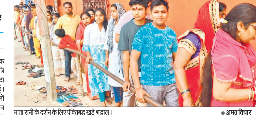
माता रानी के दर्शन के लिए पवित्रबद्ध खड़े श्रद्धालु।

अमृत विचार: जिले में वासंतिक नवरात्रि की धूम मची हुई है। नवरात्रि के तीसरे दिन मां दुर्गा के चंद्रघंटा स्वरूप की पूजा-अर्चना की गई। मंदिरों में सुबह से ही श्रद्धालु मंदिरों में जुटने लगे। शहर के नजदीक गांव नागला स्थित प्रसिद्ध मां काली का मंदिर में श्रद्धालुओं की अपार भीड़ से सराबोर रहा। श्रद्धालुओं ने माता की पूजा अर्चना कर आशीर्वाद प्राप्त किया। मां चंद्रघंटा का स्वरूप शांति, साहस और करुणा का प्रतीक माना जाता है। भक्त मानते हैं कि मां के इस स्वरूप की आराधना से जीवन