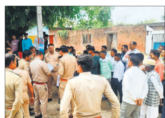
मामले की जांच करते पुलिस कर्मी।