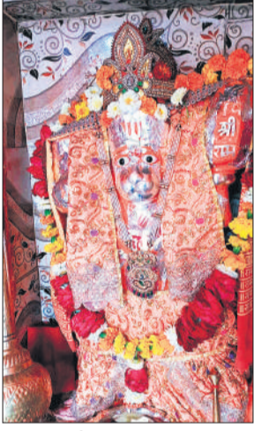
सजा बाला जी दरबार।