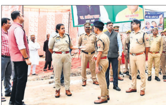
ईदगाह के बाहर स्थिति का जायजा लेते डीएम एसएसपी।

सभी जगहों पर थानाध्यक्षों के साथ-साथ क्षेत्राधिकारी भी भ्रमण करते रहे। संवेदनशील इलाकों में भारी संख्या में पुलिस बल तैनात किया गया था। साथ ही स्टेटिक मजिस्ट्रेट की तैनाती की गई थी। उपद्रव की संभावना को देखते हुए ड्रोन से भी निगरानी की गई।