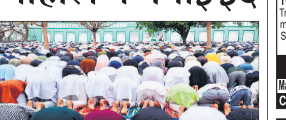
ईदगाह में नमाज अदा करते लोग।

अमृत विचार: रमजान के पवित्र महीने के समापन पर शनिवार को कस्बा सहित देहात क्षेत्रों में ईद का त्योहार हर्षोल्लास के साथ मनाया गया। नमाज के बाद मोमिनों ने एक दूसरे के गले मिलकर ईद की शुभकामनाएं दीं। शनिवार को सबसे पहले साढ़े सात बजे बिसौली की जामा मस्जिद में लोगों ने सजदा किया, उसके बाद सराए मोहल्ले की मस्जिद कलां (बड़ी मस्जिद), छोटी मस्जिद व नफीस मस्जिद, के