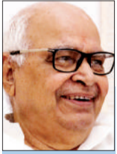
हृदय नारायण दीक्षित पूर्व विधानसभा अध्यक्ष उत्तर प्रदेश

ऋग्वेद में वाणी देवी हैं। वे कहती हैं, "मैं रुद्र, वसु, आदित्य और विश्व देवों के रूप में विचरण करती हूँ। मैं मित्र वरुण इंद्र, अग्नि और अश्विनी कुमारी को धारण करती हूँ। मैं सृष्टि के सभी प्रपंचों रूपों भावों में स्थित हूँ। मेरी सहायता से ही प्राणी अन्न खाते हैं। देखते हैं। सांस लेते हैं। सुनते हैं। मैं जिसे चाहती हूँ, उसे शक्तिशाली स्तोता, ऋषि और बुद्धिमान बनती हूँ। मेरा निवास जल में