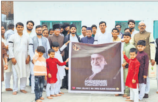
ईरान के सुप्रीम लीडर खामेनेई का पोस्टर लेकर गम जताते शिया समुदाय।

अमृत विचार: थाना फैजगंज बेहटा क्षेत्र के ग्रामीण इलाकों में शनिवार को ईद-उल-फितर का त्योहार बेहद शांतिपूर्ण और सौहार्दपूर्ण माहौल में संपन्न हुआ। पुलिस प्रशासन की कड़ी निगरानी के बीच क्षेत्र के गांवों में सुरक्षा के पुख्ता इंतजाम रहे। शनिवार सुबह से ही थाना क्षेत्र के ग्राम सिसरका, ओरछी, पिंपरिया, धनिया वाली, पाठकपुर और फैजगंज बेहटा सहित तमाम गांवों में ईद की नमाज को लेकर उत्साह देखा गया। शांति व्यवस्था बनाए रखने के लिए पुलिस बल सुबह से ही मस्जिदों के बाहर मुस्लिम नजर आया। नमाज के बाद लोगों ने एक-दूसरे के गले मिलकर ईद की मुबारकबाद दी। इस दौरान सुरक्षा व्यवस्था को लेकर पुलिस बल तैनात रहा।