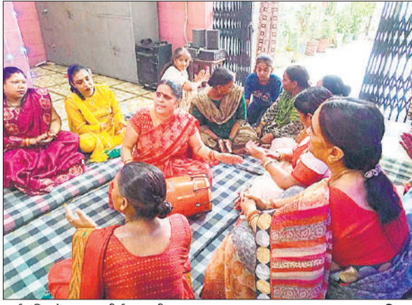
दुर्गा मंदिर में भजन-कीर्तन करती श्रद्धालु।

नगर के प्रमुख मंदिरों दुर्गा मंदिर, खाकेश्वर मंदिर, श्री शिव धाम पंचशील मंदिर (पीपल टोला), होली चौराहा स्थित शिव