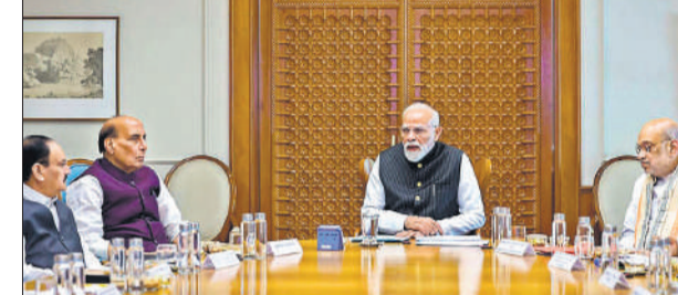
पश्चिम एशिया की बदलती स्थिति के मद्देनजर समीक्षा बैठक करते प्रधानमंत्री मोदी।