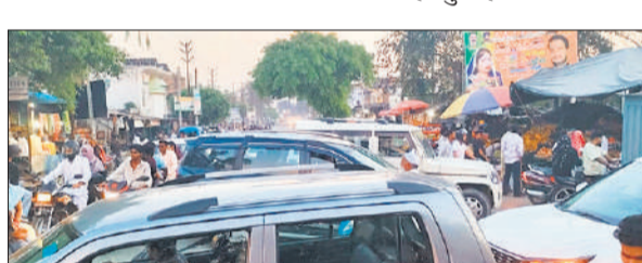
खौद चौराहे पर घंटों लगे जाम में फंसे वाहन।

इस दौरान लोगों को काफी परेशानियों का सामना करना पड़ा। जाम के कारण से धीरे धीरे करके