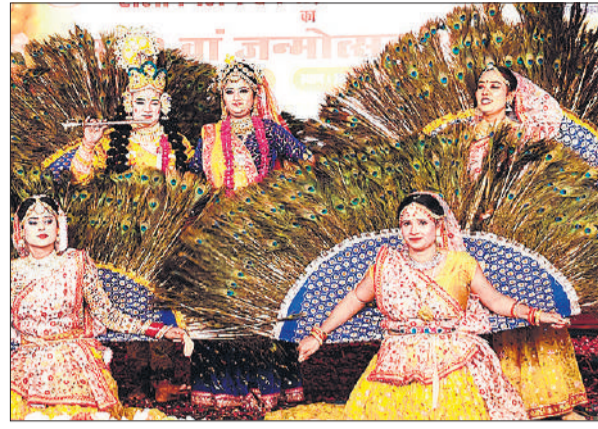
वृंदावन की महिला कलाकारों की मनमोहक झांकी।