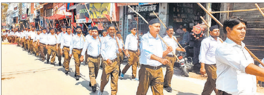
बिलासपुर में पथ संचलन करते आरएसएस स्वयं सेवक।