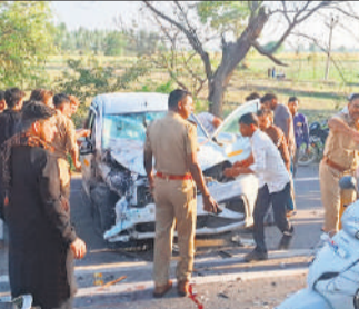
लोगों की मदद से कार को सड़क से हटवाती पुलिस।