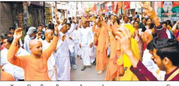
इस्कॉन द्वारा निकाली जा रही रथ यात्रा में नृत्य करते श्रद्धालु।

पूरा वातावरण भक्तिमय हो उठा। रंग-बिरंगी झांकियों, रॉक बैंड और पारंपरिक वाद्य यंत्रों के साथ निकली इस शोभायात्रा ने शहर को आध्यात्मिक रंग में रंग दिया। बड़ी संख्या में स्थानीय एवं बाहरी भक्तों की भागीदारी ने आयोजन को और भव्य बना दिया। इन राहों से गुजरती यात्रा: शोभायात्रा का शुभारंभ दोपहर दो बजे गवर्नमेंट इंटर कॉलेज से हुआ। इसके बाद वह यात्रा मंडी चौक, अमरोहा गेट, टाउन हाल,