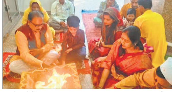
हवन में आहुति देते भक्त।

अमृत विचार : शहर के मुख्य बाजार मिस्टन गंज स्थित शक्ति दरबार में रविवार को चैत्र नवरात्र पर पीले वस्त्र और पीले फूल से चौथी देवी कूष्मांडा की आराधना की गई। पूजा अर्चना करते हुए यज्ञ में आहुतियां देकर सैकड़ों लोगों ने सप्तशती पाठ कवच पाठ किया। जिले भर के मंदिरों में गणेश वंदना, दुर्गा चालीसा पाठ और भजन कीर्तन हुआ।