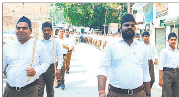
शाहबाद में आरएसएस के पथ संचलन में शामिल स्वयंसेवक।