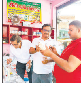
दुकान में जांच करती टीम।

अमृत विचार : नवरात्रि में मिलावटी व अधोमानक खाद्य पदार्थों की बिक्री व प्रयोग को रोकने के लिए रविवार को खाद्य सुरक्षा विभाग की टीमों ने कई क्षेत्रों में दुकानों और शांफिंग मार्ट में जांच कर नमूने लिए। वहीं खुले में कुट्टू के आटे व प्रतिबंधित ब्रांड के कुट्टू की भी दुकानों पर चेकिंग की जा रही है। सहायक आयुक्त खाद्य सुरक्षा ने बताया कि अभियान के दौरान कटरा नाज में 12 दुकानों के निरीक्षण में किसी दुकान पर कुट्टू का आटा नहीं मिला। अभी जांच चल रही है। अधिकारियों ने कहा कि मिलावटी व अधोमानक खाद्य पदार्थों की बिक्री कर जन स्वास्थ्य को नुकसान पहुंचाने वालों के खिलाफ कार्रवाई की जाएगी।