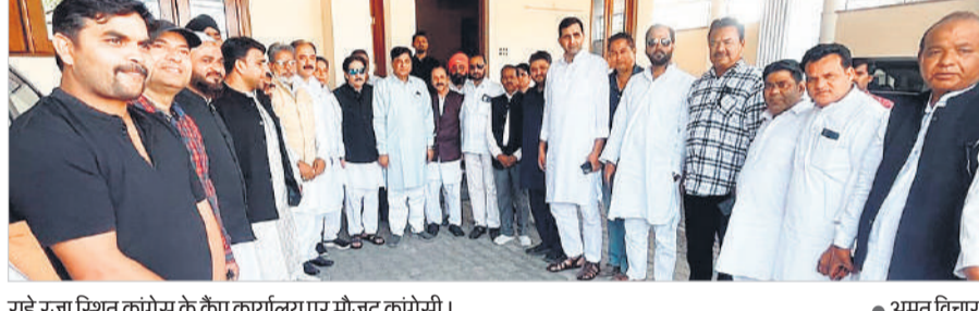
राहे रजा स्थित कांग्रेस के कैप कार्यालय पर मौजूद कांग्रेसी।