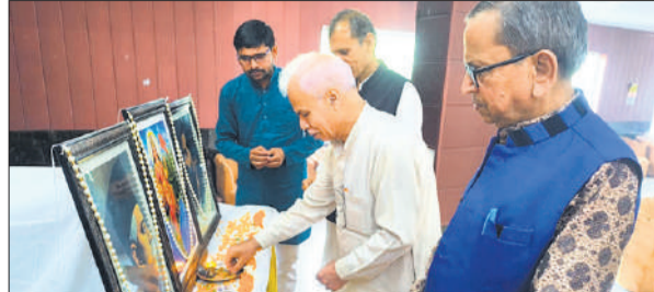
बबराला में गोष्ठी आरंभ करते अतिथि।