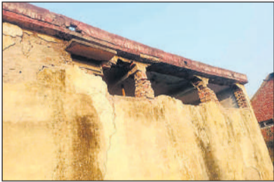
मंडी समिति में जर्जर बिल्डिंग से हादसे का खतरा।

कांठ, अमृत विचार : नगर स्थित मंडी समिति में प्रतिदिन लाखों रुपये का व्यापार होता है। अब यह स्थान शराबियों का अड्डा बनना जा रहा है। साथ ही मंडी की बिल्डिंग जर्जर हालत में खड़ी है, जिससे कभी भी बड़ा हादसा हो सकता है। मंडी समिति में सज्जा का बड़ा व्यापार होता है और सीजन के दौरान गेहूं व धान की सरकारी खरीद के लिए केंद्र भी स्थापित किए जाते हैं। इसके बावजूद अधिकारियों की लापरवाही साफ नजर आ रही है। लोगों का कहना है कि मंडी समिति इंचार्ज शायद ही कभी पहुंचते हों। यहां होमगार्ड की ड्यूटी लगाई जाती है, लेकिन मौके पर कोई नजर नहीं आता। मंडी समिति शराबियों का अड्डा बनती जा रही है। मंडी की बिल्डिंग की स्थिति भी बेहद खराब हो चुकी है। पूर्व में संबंधित अधिकारियों को कई बार इसकी मरम्मत के लिए पत्र लिखे जा चुके हैं, लेकिन बजट के अभाव में कोई कार्य नहीं हो सका।