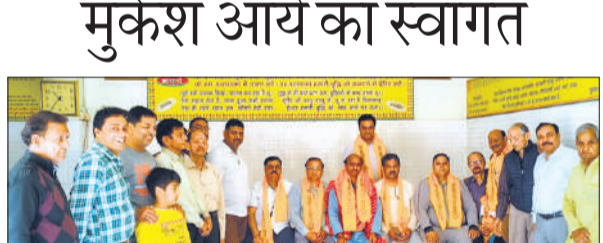
आर्य समाज मंदिर में नामित सदस्य का स्वागत करते कार्यकारिणी के पदाधिकारी।