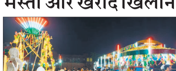
ईद मेले में घूमते बच्चे और बड़े।