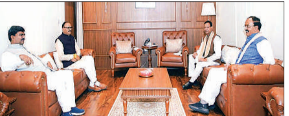
डिप्टी सीएम ब्रजेश पाठक के आवास पर संगठनात्मक चर्चा करते प्रदेश अध्यक्ष पंकज चौधरी, उप मुख्यमंत्री केशव प्रसाद मौर्य और सांठन महामंत्री धर्मपाल सिंह।

अमृत विचार: पंचायत और विधानसभा चुनाव से पहले भाजपा संगठन को मजबूत करने में जुटी है और जिला इकाइयों के गठन को लेकर तेजी से मंथन चल रहा है। पार्टी नए चेहरों को अवसर देने के साथ जातीय समीकरण साधने पर विशेष ध्यान दे रही है, लेकिन कई जिलों में मतभेदों के कारण अंतिम सहमति बनने में देरी हो रही है। प्रदेश मुख्यालय पर पिछले दो दिनों में विभिन्न क्षेत्रों की जिला टीमों को लेकर व्यापक चर्चा हुई। शनिवार को कानपुर और काशी क्षेत्र, जबकि रविवार को अवध क्षेत्र