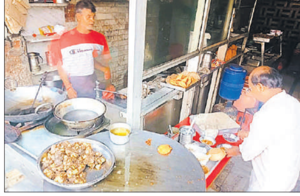
बुधबाजार में एक दुकान में प्रतिवियों के लिए कुट्टू की पकौड़ी और आलू टिक्की तैयार।

अमृत विचार : नवरात्र के दौरान व्रत रखने वालों के बीच एक दिलचस्प ट्रेंड देखने को मिल रहा है। जहां एक ओर घर में बना पारंपरिक फलाहार लोगों को शुद्धता और विश्वास देता है, वहीं दूसरी ओर बाजार में मिलने वाले तैयार फलाहार की सुविधा भी लोगों को आकर्षित कर रही है। शहर में इन दिनों घर का स्वाद बनाम बाजार का फलाहार की तस्वीर साफ नजर आ रही है।