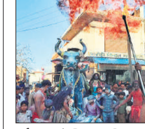
सौंधन में निकाली भव्य शोभायात्रा