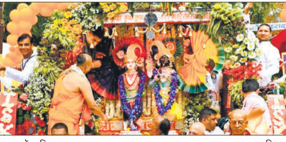
रथ यात्रा में शामिल श्रद्धालु।