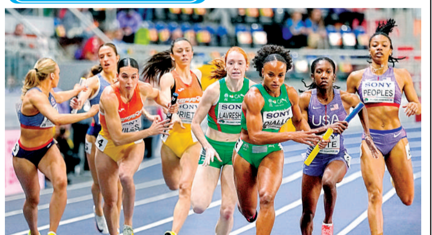
पोलैंड के टोरुन में वर्ल्ड एथलेटिक्स इनडोर चैंपियनशिप में महिलाओं की 4 गुणा 400 मीटर रिले हीट में पुर्तगाल की फातोमाता बिटा डियालो सबसे आगे जीत के करीब पहुंचीं।