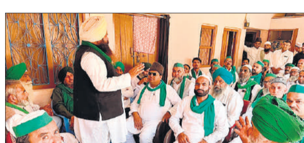
टांडा में भाकियू टिकैत की बैठक में मौजूद किसान।