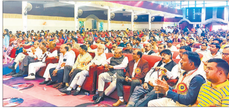
उत्सव पैलेस में आयोजित कार्यक्रम में मौजूद समाज के लोग।