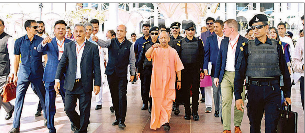
नोएडा इंटरनेशनल एयरपोर्ट के लोकार्पण कार्यक्रम की तैयारी का निरीक्षण करते मुख्यमंत्री योगी, साथ में अन्य।

उल्लेखनीय है कि प्रधानमंत्री नरेंद्र मोदी 28 मार्च को नोएडा इंटरनेशनल एयरपोर्ट और कार्गो टर्मिनल का लोकार्पण करेंगे, साथ ही मेटेनेस, रिपेयर एंड ओवरहॉल (एमआरओ) परियोजना का शिलान्यास भी करेंगे। निरीक्षण के दौरान मुख्यमंत्री ने प्रधानमंत्री के संभावित भ्रमण मार्ग, पैसेंजर टर्मिनल, कार्गो टर्मिनल, हेलीपैड, पार्किंग और रैली स्थल का अवलोकन कर तैयारियों की विस्तृत जानकारी ली। उन्होंने अधिकारियों को निर्देश दिया कि सभी कार्य समयसीमा के भीतर