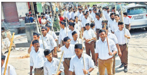
नगर में पथ संचलन निकालते राष्ट्रीय स्वयंसेवक संघ स्वयंसेवक।