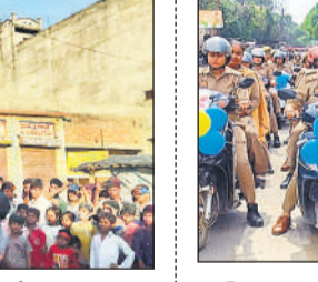
महिला सुरक्षा के संदेश के साथ निकाली स्कूटी रैली