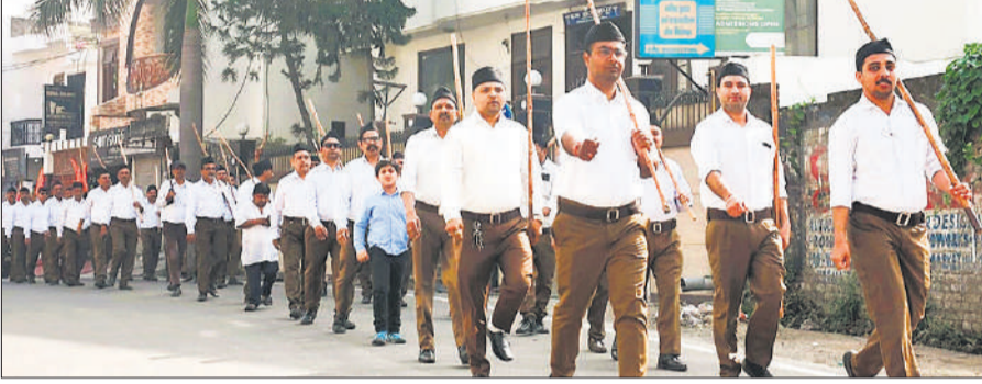
दीनदयाल नगर में पथ संचलन में शामिल स्वयंसेवक।