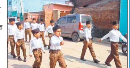
पथ संचलन निकालते स्वयंसेवक।