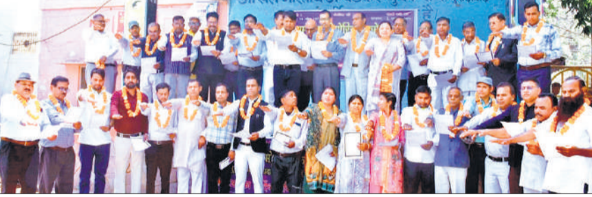
अंबेडकर पार्क में शपथ लेते अंबेडकर मेमोरियल कमेटी के पदाधिकारी।