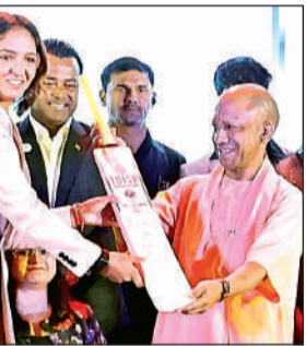
क्रिकेटर मिताली राज को सम्मानित करते मुख्यमंत्री।