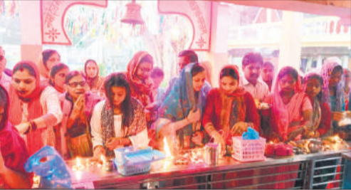
हसनपुर में मां चामुंडा मंदिर पर पूजा अर्चना करती महिलाएं।

नवरात्र के चौथे दिन शहर के प्रमुख देवी मंदिरों में तड़के से ही पूजा-पाठ का दौर शुरू हो गया। महिलाओं ने मंदिरों में एकत्र होकर भजन-कीर्तन गए, जिससे वातावरण पूरी तरह भक्तिमय हो उठा। हवन-पूजन भी आयोजित किया गया। मंदिरों में भक्तों की सुविधा को ध्यान में रखते हुए विशेष व्यवस्थाएं की गई थीं। श्रद्धालुओं को प्रसाद वितरण किया गया, जिसमें बड़ी संख्या में लोगों ने भाग लिया। बच्चों से लेकर बुजुर्गों तक सभी में उत्साह देखने