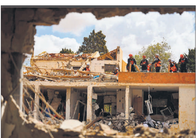
डिमोना में ईरानी मिसाइल हमले से प्रभावित स्थल का सर्वेक्षण करते इजराइली सुरक्षा बल।

अमेरिका ने दावा किया है कि इन हमलों में उसने ईरान के कई टॉप लीडर्स का सफाया कर दिया है। सोशल मीडिया प्लेटफॉर्म एक्स पर वीडिया साझा करते हुए अमेरिकी मिलिट्री नाम के अकाउंट से दावा किया गया है कि इन हमलों में ईरान के टॉप लीडर्स को मौत के घाट उतारा गया। इन घटनाक्रमों से संकेत मिलता है कि युद्ध अपने चौथे सप्ताह की शुरुआत में एक खतरनाक नए चरण में प्रवेश कर रहा है। तेल की बढ़ती कीमतों के बीच देश में दबाव का सामना कर रहे ट्रंप ने फ्लोरिडा स्थित अपने घर से सोशल मीडिया पर यह चेतावनी दी। उन्होंने कहा कि ईरान को 48 घंटे में इस महत्वपूर्ण जलमार्ग को खोलना होगा, अन्यथा अमेरिका उसके