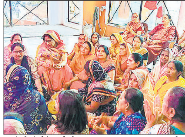
कांठ में मंदिर में कीर्तन करती महिलाएं।

मंदिरों में श्रद्धालुओं ने श्रद्धा भाव से पूजा-अर्चना कर सुख-समृद्धि की कामना की। शाम के समय मंदिरों में भजन-कीर्तन का विशेष आयोजन किया गया। महिलाओं ने बड़-चढ़कर भाग लेते हुए मां के भजनों से माहौल को और अधिक भक्तिमय बना दिया। ढोल-नगाड़ों और घंटियों की ध्वनि के बीच