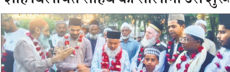
मजार शरीफ में परचम कुशाई के मौके पर नात पेश करते नातख्वां।