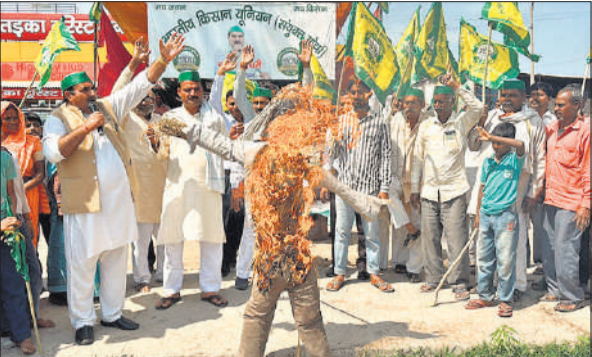
पुतला फूंकते किसान।