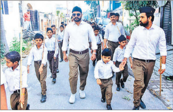
रामगंगा विहार से निकले पथ संचालक में शामिल नवसेवक।