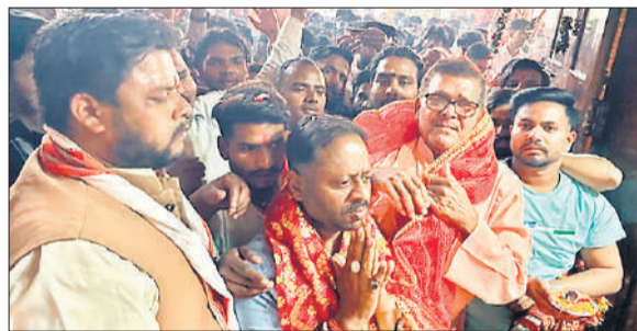
आरती में शामिल हिंदू परिषद व राष्ट्रीय बजरंग दल के पदाधिकारी व अन्य।

अमृत विचार : चैत्र नवरात्र के चौथे दिन मां दुर्गा के कूष्मांडा स्वरूप की पूजा-अर्चना श्रद्धा और उल्लास के साथ की गई। रविवार सुबह से ही मंदिरों में श्रद्धालुओं की भीड़ उमड़ पड़ी, वहीं घर-घर में भक्तों ने व्रत रखकर विधि-विधान से मां की आराधना की। मां कूष्मांडा को सृष्टि की रचयिता माना जाता है, इसलिए इस दिन का विशेष धार्मिक महत्व है। प्राचीन काली माता मंदिर, गंगा मंदिर, दुर्गा मंदिर, मनोकामना मंदिर समेत शहर के प्रमुख देवी मंदिरों में सुबह से ही लंबी कतारें लगी रहीं। श्रद्धालु नारियल, फल-फूल और प्रसाद लेकर पहुंचे। मंदिरों में श्रद्धालु डोलक-झांझ की धुन पर भक्तों में लीन नजर आए। घरों में महिलाओं ने कलश स्थापना के साथ चौथे दिन मां को मालपुआ, हलवा और फल का भोग लगाया।