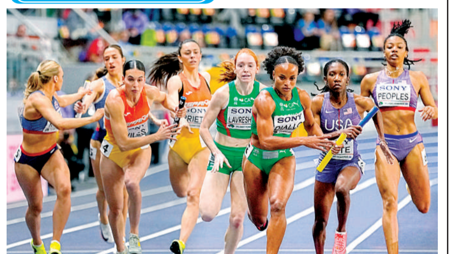
पोलैंड के टोरुन में वर्ल्ड एथलेटिक्स इनडोर चैंपियनशिप में महिलाओं की 4 गुणा 400 मीटर रिले हीट में पुर्तगाल की फातोमाता बिटा डियालो सबसे आगे जीत के करीब पहुंचीं।