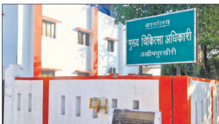
मुख्य चिकित्साधिकारी कार्यालय।

जिला मुख्यालय स्थित सीएमओ कार्यालय के सभागार में लखनऊ से आए मास्टर ट्रेनर