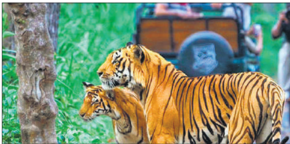
पीटीआर में बाघों का दीदार करते सैलानी।

अमृत विचार : पीलीभीत टाइगर रिजर्व के तीसरे नए बराही पर्यटन गेट को खोलने से पूर्व माना जा रहा है कि टाइगर रिजर्व में आने वाले सैलानियों की संख्या में खासा इजाफा होगा, मगर इसका कोई खास असर देखने को नहीं मिल रहा है। पर्यटन सत्र के शुरूआती चार माह की बात करें तो मुस्ताफाबाद गेट सैलानियों को अपनी ओर खींचने में नंबर वन साबित रहा है। इस गेट के माध्यम से चार माह में 16716 सैलानी टाइगर रिजर्व में आ चुके हैं। जबकि नया बराही गेट से बीते चार माह में महज 2244 सैलानी ही टाइगर रिजर्व पहुंचे हैं। यह दीर्घ बात है कि टाइगर रिजर्व प्रशासन को इस नए पर्यटन गेट को संचालित करने के लिए अन्य पर्यटन गेटों के बराबर ही संसाधन जुटाने पड़ रहे हैं।