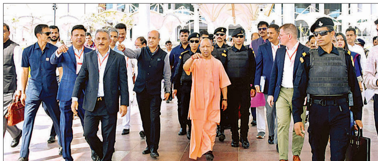
नोएडा इंटरनेशनल एयरपोर्ट के लोकार्पण कार्यक्रम की तैयारी का निरीक्षण करते मुख्यमंत्री योगी, साथ में अन्य।

उल्लेखनीय है कि प्रधानमंत्री नरेंद्र मोदी 28 मार्च को नोएडा इंटरनेशनल एयरपोर्ट और कार्गो टर्मिनल का लोकार्पण करेंगे, साथ ही मेटेनेस, रिपेयर एंड ओवरहॉल (एमआरओ) परियोजना का शिलान्यास भी करेंगे। निरीक्षण के दौरान मुख्यमंत्री ने प्रधानमंत्री के संभावित भ्रमण मार्ग, पैसेंजर टर्मिनल, कार्गो टर्मिनल, हेलीपैड, पार्किंग और रैली स्थल का अवलोकन कर तैयारियों की विस्तृत जानकारी ली। उन्होंने अधिकारियों को निर्देश दिया कि सभी कार्य समयसीमा के भीतर