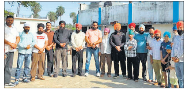
हरियाणा के लिए रवाना होने के लिए एकत्र हुए किसान नेता।

जनआक्रोश रैली में शामिल होने रवाना हुए किसान नेता