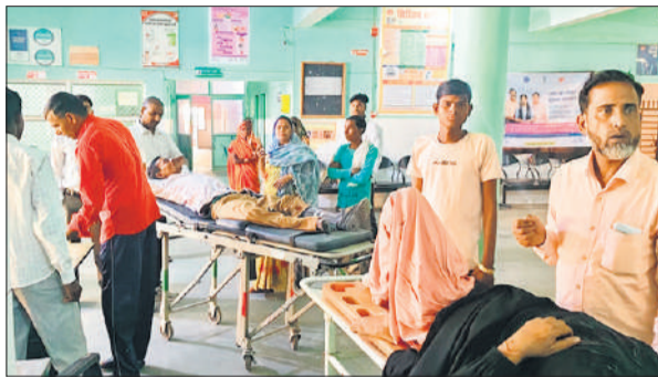
घायलों को स्ट्रेचर पर ले जाते लोग।