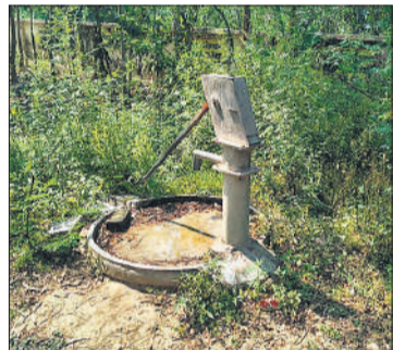
पीएचसी दौलतपुर में नल के पास जमा गंदगी का डेर।