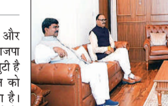
डिप्टी सीएम ब्रजेश पाठक के आवास पर संगठनात्मक चर्चा करते प्रदेश अध्यक्ष पंकज चौधरी, उप मुख्यमंत्री केशव प्रसाद मौर्य और सांठन महामंत्री धर्मपाल सिंह।

के जिलों पर विचार-विमर्श किया गया। अब तक पांच क्षेत्रों के 82 संगठनात्मक जिलों पर चर्चा पूरी हो चुकी है, लेकिन 17 जिलों में अभी भी पेंच फंसा हुआ है। सूत्रों के अनुसार, जिन जिलों में नए जिलाध्यक्ष बनाए जाने हैं,