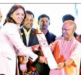
क्रिकेटर मिताली राज को सम्मानित करते मुख्यमंत्री।