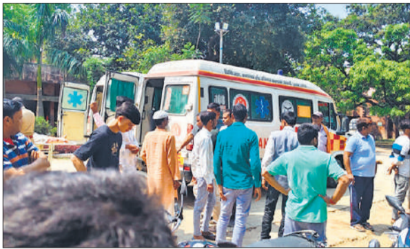
घायलों को लेकर सीएचसी पहुंची एंबुलेंस।

हादसा दोपहर करीब 12 बजे नीमगांव थाना क्षेत्र के गांव गोहरपुर के पास दोपहर हुआ। रोडवेज बस और दो बाइकों के बीच आमने-सामने जबरदस्त भिड़ंत हो गई। टक्कर इतनी भयावह थी कि एक बाइक बस के अगले हिस्से में फंस गई और करीब 20 मीटर तक सड़क पर घिसटती चली गई। प्रत्यक्षदर्शियों के मुताबिक, टक्कर के बाद बस चालक नियंत्रण खो बैठा और बस स्तरीय जांच की मांग की। कहा कि यदि प्रशासन ने समस्याओं की अनदेखी जारी रखी तो बड़ा आंदोलन किया जाएगा।