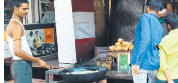
अशोक चौराहा पर एक होटल में भट्टी पर समोसे तलता कारीगर।