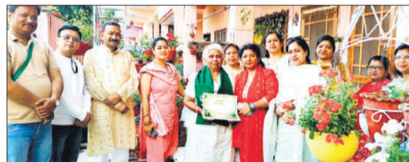
हरियाली मित्र सम्मान प्राप्त करते पर्यावरण संरक्षण के सहयोगी।