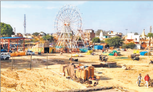
गोला के मेला मैदान में लग रही विभिन्न दुकानें, झूले।