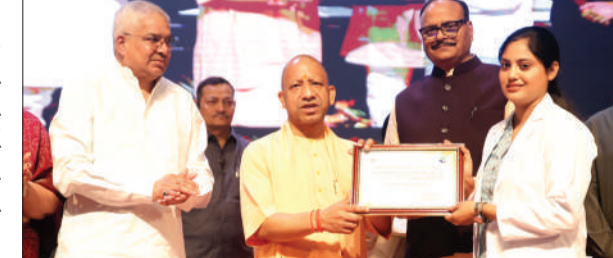
लखनऊ: लोकभवन में 1,228 नर्सिंग अधिकारियों के नियुक्ति पत्र वितरण कार्यक्रम में नव चयनित महिला अभ्यर्थी को नियुक्ति पत्र सौंपते मुख्यमंत्री योगी आदित्यनाथ।

अमृत विचार: मुख्यमंत्री योगी ने नवरात्र के पावन अवसर पर रविवार को लोकभवन में 1,228 नवचयनित नर्सिंग अधिकारियों को नियुक्ति पत्र वितरित करते हुए इसे महिला सशक्तीकरण का प्रतीक बताया। उन्होंने कहा कि बड़ी संख्या में बेटियों को रोजगार मिलना समाज में सकारात्मक बदलाव का संकेत है। मुख्यमंत्री ने स्पष्ट किया कि प्रदेश में भर्ती प्रक्रिया पूरी तरह पारदर्शी और निष्पक्ष है, जहां बिना किसी सिफारिश या लेन-देन के योग्य अभ्यर्थियों को अवसर मिल रहा है। जबकि वर्ष 2017 के पहले प्रत्येक