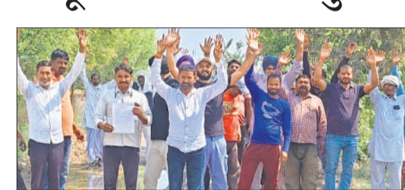
तालाब में तब्दील मार्ग पर प्रदर्शन करते ग्रामीण।

ग्रामीणों का कहना है कि यह सड़क कई गांवों को जोड़ने वाला प्रमुख संपर्क मार्ग है, जहां से रोजाना सैकड़ों लोग गुजरते हैं। इसके बावजूद जिम्मेदार विभाग