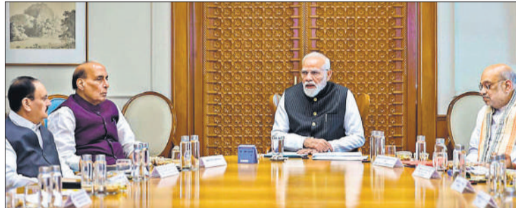
पश्चिम एशिया की बदलती स्थिति के मद्देनजर समीक्षा बैठक करते प्रधानमंत्री नरेंद्र मोदी।