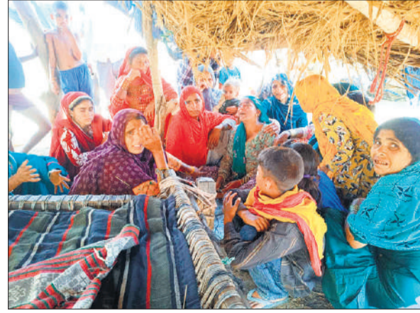
बिलखते बच्ची के परिजान।