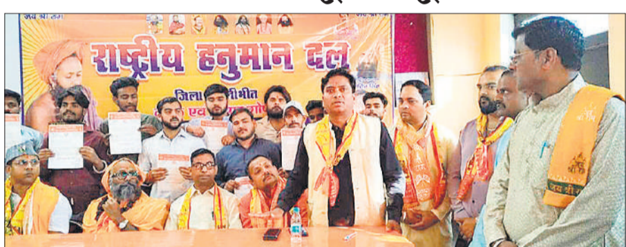
कार्यक्रम में मौजूद राष्ट्रीय हनुमान दल के पदाधिकारी।