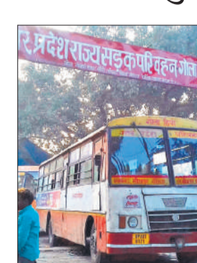
गोला डिपो में खड़ी रोडवेज की बसें।

अमृत विचार: उत्तराखंड राज्य के चंपावत जिले में स्थित मां पूर्णागिरि धाम के लिए नगर, ग्रामीण क्षेत्र से काफी श्रद्धालु मां के दर्शन को जाते हैं। डिपो से रोडवेज की बसें हर समय उपलब्ध होने से श्रद्धालुओं के लिए यात्रा सुविधाजनक हो गई है। उत्तराखंड में प्रसिद्ध मां पूर्णागिरि धाम चंपावत जिले में टनकपुर के पास अन्नपूर्णा शिखर पर स्थित एक पवित्र शक्तिपीठ है, जहां चैत्र नवरात्रि के दौरान काफी भीड़ उमड़ती है। नगर, व दूर दराज क्षेत्र से प्रतिदिन काफी श्रद्धालुओं के दर्शन के लिए आते हैं। चैत्र नवरात्र के चलते इन दिनों रोडवेज बसअड्डा, रेलवे