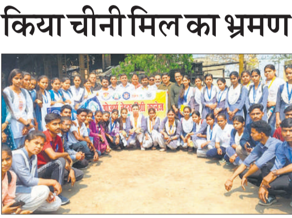
गोली की बजाज चीनी मिल में मौजूद पनएसएस के स्वयंसेवक।