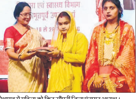
प्रेक्षागृह में महिला को किट सौंपती जिला पंचायत अध्यक्ष।