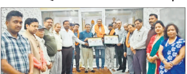
कार्यक्रम में सम्मानित किए गए विकास और नितिन।