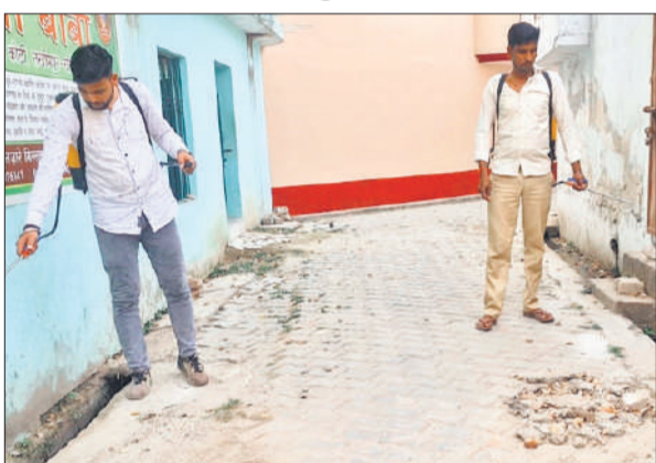
मोहल्ला शाहपुरा में दवा का छिड़काव करती जिला मलेरिया कार्यालय की टीम।

गर्मियां शुरू होते ही मच्छर हमलावर हो गए हैं। इनसे डेंगू एवं मलेरिया रोग के होने की संभावना बनने लगी है। मच्छरजनित बीमारियों की रोकथाम के लिए स्वास्थ्य विभाग की ओर से विशेष संचारी रोग नियंत्रण अभियान अप्रैल में चलाया जाता है। पहले चरण में एक से 15 अप्रैल तक