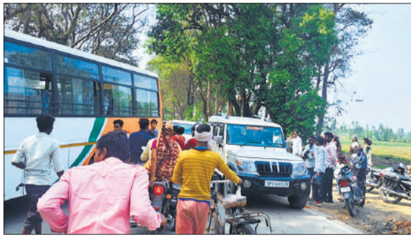
घटना स्थल पर लगी वाहनों की लंबी कतार।

हादसे के बाद मार्ग पर दोनों तरह भीषण जाम लग गया। वाहनों की लंबी कतार लगने से रास्ता पूरी तरह से अवरुद्ध हो गया। घायलों को अस्पताल भेजने के बाद पुलिस ने कड़ी मशकत कर यातायात बहाल कराया और क्षतिग्रस्त वाहनों को हटवाया। पुलिस की प्रारंभिक जांच में हादसे की वजह बस और बाइक दोनों की तेज रफ्तार व लापरवाही मानी जा रही है। बताया जा रहा है कि सड़क संकरे होने और ओवरटेक के प्रयास ने भी दुर्घटना को और भयावह बना दिया। फिलहाल पुलिस ने मामला दर्ज कर लिया है और पूरे घटनाक्रम की गहन जांच की जा रही है। घटना के बाद ग्रामीणों में भारी नाराजगी देखी गई। लोगों का कहना है कि इस मार्ग पर आए दिन तेज रफ्तार वाहन दौड़ते हैं, लेकिन न तो प्रशासन की सख्ती दिखती है और न ही कोई प्रभावी यातायात व्यवस्था।