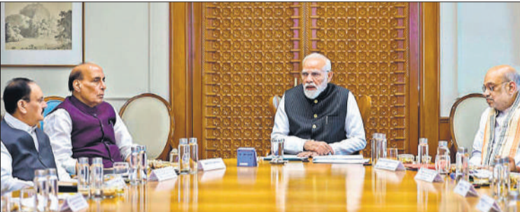
पश्चिम एशिया की बदलती स्थिति के मद्देनजर समीक्षा बैठक करते प्रधानमंत्री नरेंद्र मोदी।

के खतरे में हैं। कम से कम 64 लोगों को अस्पताल ले जाया गया। डिमोना, परमाणु अनुसंधान केंद्र से लगभग 20 किलोमीटर पश्चिम में है, जबकि अरद उससे करीब 35 किलोमीटर उत्तर में स्थित है। माना जाता है कि इजराइल पश्चिम एशिया का एकमात्र देश है जिसके पास परमाणु हथियार हैं, हालांकि उसने कभी इसकी पुष्टि या खंडन नहीं किया।