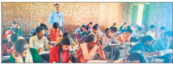
बीडीएन 155-प्रतियोगिता में हिस्सा लेते छात्र छात्रएं ● अमृत विचार