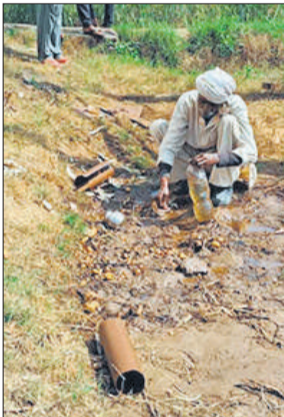
ट्रांसफार्मर का तेल बटोरने का प्रयास।

में हुआ है। सुनसान इलाका होने के कारण चोरों ने इत्मीनान से वारदात को अंजाम दिया। अनुमान लगाया जा रहा है कि दोनों ट्रांसफार्मर से लगभग एक लाख रुपये का माल चोरी हुआ है। पीड़ित किसानों ने थाने में शिकायती पत्र देकर कार्रवाई की गुहार लगाई है। किसानों का