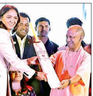
क्रिकेटर मिताली राज को सम्मानित करते मुख्यमंत्री।