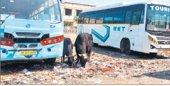
बसों के बीच पड़ी गंदगी में घूमते छुट्टा गोवंश

नगर पालिका की जमीन पर प्राइवेट बस स्टैंड है। बस स्टैंड पर करीब दो सौ मीटर के दायरे में एक हाल नुमा बना दिया गया है जिसमें यात्रियों को बैठने को कोई सुविधा नहीं है। इस हाल में न तो सफाई की जाती है और न ही बैठने को बेंच