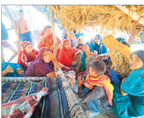
खिलखते बच्ची के परिजन।

अमृत विचार : गांव रामनगर संडा खास में अचानक झोपड़ी की कच्ची दीवार गिर गयी। इसमें पांच साल की बच्ची और छोटा भाई मलवे में दबकर घायल हो गए। गांव वाले फौजर मौके पर पहुंचे और मलवा को हटाया। दोनों घायलों को सीएचसी पर ले गए। यहां डॉक्टर ने बच्ची को मृत घोषित कर दिया।