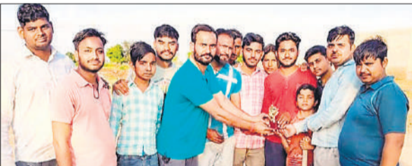
विजेता टीम को शिल्ड देते आयोजक