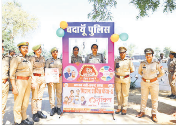
एसएसपी के साथ सेल्फी लेती महिला पुलिसकर्मी।

प्रदेश सरकार की ओर से महिलाओं व बालिकाओं की सुरक्षा, सम्मान, स्वावलंबन को सुदृढ़ करने के उद्देश्य से संचालित मिशन शक्ति