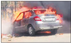
कूड़े के ढेर में सुलगती आग से कार में लगी आग।

अमृत विचार : लोधीपुर में कूड़े के ढेर के पास खड़ी कार में अचानक आग लग गई। देखते-देखते आग ने विकराल रूप धारण कर लिया। लोगों ने आग बुझाने का प्रयास किया। दमकल वाहन ने पहुंचकर आग पर काबू पाया। कूड़े के ढेर में आग सुलग गई थी, जिससे कार में आग लग गई है। कार पूरी तरह जल गई।