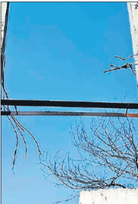
खंभे से गायब ट्रांसफार्मर।

से खेत पर पहुंचे तो होश उड़ गए। चोरों ने खंभों पर रखे भारी-भरकम ट्रांसफार्मर को नीचे गिरा दिया था। उसके भीतर से तांबे की वाइडिंग समेत अन्य सामान और तेल निकाल लिया था। मौके पर सिर्फ लोहे के खाली खोखे पड़े मिले। यह घटनाक्रम रेलवे लाइन के पास घने जंगल