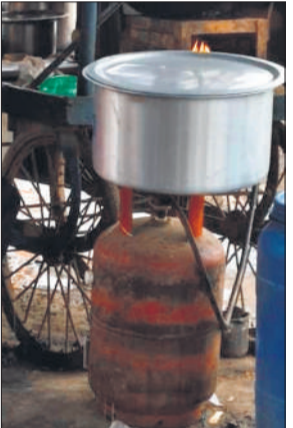
टेले पर घरेलू सिलेंडर का इस्तेमाल

रसोई गैस की किल्लत देहात क्षेत्र में बनी हुई है। एजेंसियों पर सिलेंडर के लिए रोजाना हजारों की संख्या में लोग जुट रहे हैं। घंटों लाइन में लगने के बाद भी