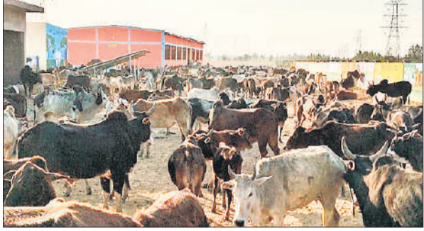
निर्माणाधीन गोशाला में बंद गोवंश।

अमृत विचार: क्षेत्र के लाइपूर और थारपुर गांव के ग्रामीण छुट्टा पशुओं से हो रहे फसल नुकसान से नाराज होकर रविवार को एकजुट हो गए। ग्रामीणों ने छुट्टा गोवंश को खदेड़कर बरुआ रोड स्थित निर्माणाधीन गोशाला में बंद कर दिया और लाठी-डंडों के साथ पहरा देने लगे ताकि पशु बाहर न निकल सकें। ग्रामीणों को बंद कर दिया कि क्षेत्र में गोशाला न होने के कारण छुट्टा पशु लगातार खेतों में घुसकर फसल को नुकसान पहुंचा रहे हैं, जिससे किसानों को रातभर जागकर रखवाली करनी पड़ रही है। समस्या के समाधान के लिए करीब एक साल पहले गोशाला का निर्माण शुरू कराया गया था, लेकिन अब तक काम पूरा नहीं हो सका, जिससे किसानों में आक्रोश है। ग्रामीणों ने बताया कि बेसहारा पशुओं के कारण आए दिन हादसे भी हो रहे हैं और कई लोगों की जान जा चुकी है। इसके बावजूद खेतों और सड़कों पर