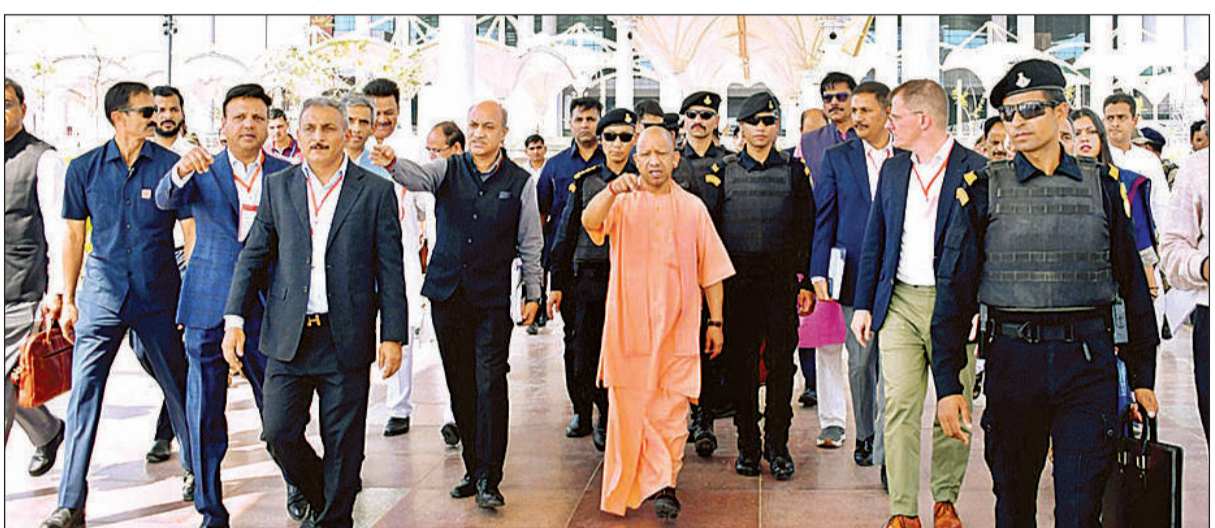
नोएडा इंटरनेशनल एयरपोर्ट के लोकार्पण कार्यक्रम की तैयारी का निरीक्षण करते मुख्यमंत्री योगी, साथ में अन्य।

अमृत विचार: नोएडा इंटरनेशनल एयरपोर्ट, जेवर के प्रस्तावित लोकार्पण कार्यक्रम को लेकर तैयारियां तेज हो गई हैं। मुख्यमंत्री योगी आदित्यनाथ ने रविवार को स्थलीय निरीक्षण कर व्यवस्थाओं का जायजा लिया और अधिकारियों के साथ समीक्षा बैठक कर कार्यक्रम को भव्य व व्यवस्थित ढंग से संपन्न कराने के निर्देश दिए। उल्लेखनीय है कि प्रधानमंत्री नरेंद्र मोदी 28 मार्च को नोएडा इंटरनेशनल एयरपोर्ट और कार्गो टर्मिनल का लोकार्पण करेंगे, साथ ही मेटेनेस, रिपेयर एंड ओवरहॉल (एमआरओ) परियोजना का शिलान्यास भी करेंगे। निरीक्षण के दौरान मुख्यमंत्री ने प्रधानमंत्री के संभावित भ्रमण मार्ग, पैसेंजर टर्मिनल, कार्गो टर्मिनल, हेलीपैड, पार्किंग और रैली स्थल का अवलोकन कर तैयारियों की विस्तृत जानकारी ली। उन्होंने अधिकारियों को निर्देश दिया कि सभी कार्य समयसीमा के भीतर