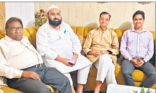
ईद मिलन काव्य गोष्ठी में काव्य पाठ करते कवि।