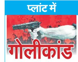
कार्यालय संवाददाता, बदायूं