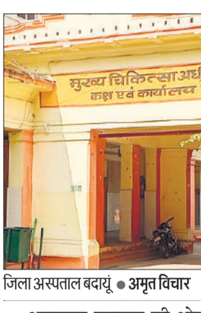
जिला अस्पताल बदायूं ● अमृत विचार

अमृत विचार : करीब पचास लाख रूपए खर्च कर बनायी गयी नई पैथोलॉजी लैब का अभी तक विस्तारीकरण नहीं किया गया है। नई बिल्डिंग में मात्र वहीं एक पुरानी मशीन से ब्लड की जांच की जा रही है जिससे मरीजों को दो से तीन दिन बाद जांच रिपोर्ट मिल पा रही है।