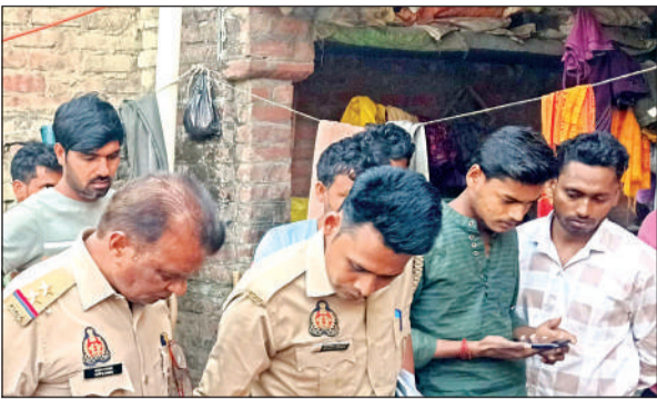
जांच पड़ताल करती पुलिस।