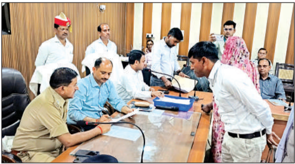
फरियादियों की शिकायतें सुनते डीएम व एसपी

संबंधित अधिकारियों को कड़े निर्देश दिए कि सभी शिकायतों का पारदर्शी, समयबद्ध और संतोषजनक समाधान सुनिश्चित किया जाए। जनसुनवाई में जिलाधिकारी ने साफ कहा कि चकमार्ग, विद्युत आपूर्ति, नाली-खड्डा निर्माण जैसी किसी भी समस्या में लापरवाही बर्दाश्त नहीं होगी। सभी अधिकारियों को सुबह 10 बजे तक कार्यालय में उपस्थित रहकर जनसमस्याएं सुनने और उनका समयबद्ध निस्तारण करने का आदेश दिया। संपूर्ण समाधान दिवस की शिकायतों का एक सप्ताह में अनिवार्य निस्तारण सुनिश्चित करने