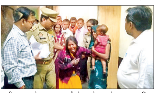
तहसील सभागार से समझाकर फूलमती को बाहर ले जाता दरोगा। अमृत विचार

कार्यालय संवाददाता, कन्नौज अमृत विचार। तहसील व थाना में संपूर्ण समाधान दिवस इसलिए आयोजित होते हैं कि पीड़ितों को राहत मिल सके, लेकिन सोमवार को सदर तहसील में आयोजित समाधान दिवस में महिला अपने नाती को दिलाने की समस्या को लेकर खूब रोईं। परिसर में ही वह लेट गईं। चूड़ियां भी तोड़ दीं। यह दृश्य देखकर वहाँ भीड़ लग गई। घटनाक्रम करीब 30 मिनट तक चला। बिहार के भगवा के थाना भगवानपुर इलाके के मसई गांव