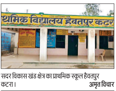
सदर विकास खंड क्षेत्र का प्राथमिक स्कूल हैतपुर कटरा।