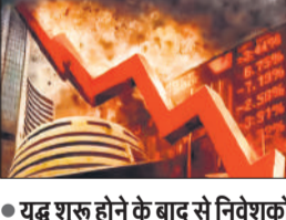
● युद्ध शुरू होने के बाद से निवेशकों के 48.29 लाख करोड़ डूबे

शेयर बाजार में सोमवार को भारी गिरावट आई और बीएसई सेंसेक्स 1,837 अंक का गोता लगा गया, जबकि एनएसई निफ्टी 602 अंक लुढ़क गया। पश्चिम एशिया युद्ध अब चौथे सप्ताह में पहुंच गया है। इसके कारण कच्चे तेल की बढ़ती कीमतों, विदेशी संस्थान निवेशकों की निरंतर पूंजी निकासी व रुपये की विनिमय दर में गिरावट को देखते हुए निवेशक जोखिम लेने से बच रहे हैं। सेंसेक्स 1,836.57