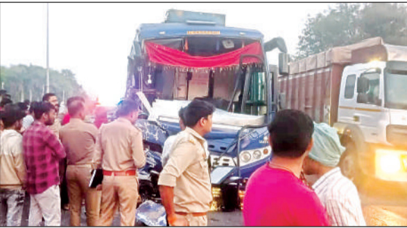
क्षतिग्रस्त खड़ी बस व मौजूद पुलिस फोर्स

अमृत विचार । आगरा-कानपुर नेशनल हाईवे पर सोमवार सुबह तड़के गांव मनियांमऊ के पास ओवरटेक करने के चक्कर में अनियंत्रित स्लीपर बस आगे चल रहे कंटेनर में जा घुसी। इससे यात्रियों में चीख-पुकार मच गई। हादसे में बस चालक की मौत हो गई जबकि चार यात्री गंभीर रूप से घायल हो गए। सभी घायलों को जिला अस्पताल में भर्ती कराया गया, यहां एक यात्री को गंभीर हालत में सैफर्ड रेफर कर दिया गया। स्लीपर बस दिल्ली से कानपुर जा रही थी तभी इकदिल इलाके के गांव मनियांमऊ के पास पहुंचने पर ओवरटेक करते समय आगे चल रहे कंटेनर में पीछे से घुस गई। टक्कर इतनी जबरदस्त थी कि बस के परखचे उड़ गए, और बस में बैठे यात्री एक दूसरे के ऊपर जा गिरे। राहगीरों की सूचना पर पहुंची पुलिस