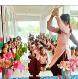
कार्यक्रम प्रस्तुत करती छात्रा।