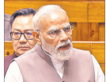
● पश्चिम एशिया संकट पर लोकसभा में मोदी ने दिया वक्तव्य, कहा- कूटनीति से ही युद्ध का समाधान संभव

उन्होंने होर्मुज स्ट्रेट के रुकावट और व्यावसायिक जहाजों पर हमलों को अस्वीकार्य बताते हुए कहा कि इस समस्या का समाधान कूटनीति और बातचीत से ही संभव है तथा भारत तनाव को कम करने व संघर्ष समाप्त करने के लिए हरसंभव प्रयास कर रहा है। उन्होंने कहा कि पिछले एक दशक में ऊर्जा क्षेत्र में सरकार की तैयारियों के कारण आज हालात से निपटने में मदद मिल रही है। प्रधानमंत्री ने सरकार के