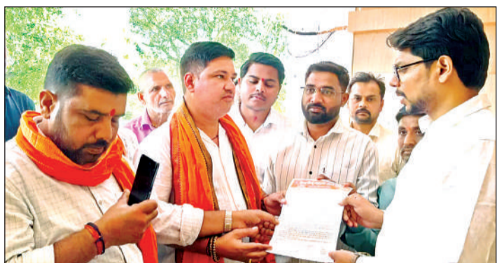
अतिरिक्त एसडीएम को ज्ञापन सौंपते महासंघ के पदाधिकारी।