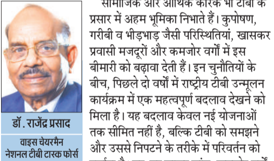
डॉ. राजेंद्र प्रसाद गाइड वेयरमैन नेशनल टीबी टारक कोर्स

ट्यूबरकुलोसिस (टीबी) आज भी समाज और स्वास्थ्य व्यवस्था के सामने एक गंभीर चुनौती बनी हुई है। सरकार लगातार नए इन्वेंशन, दवा रेजिमेन और प्रोटोकॉल के जरिए ज्यादा से ज्यादा संक्रमित लोगों तक बेहतर इलाज पहुंचाने की कोशिश कर रही है। इसके बावजूद, वर्ष 2030 के टीबी मुक्त भारत के लक्ष्य को ध्यान में रखते हुए उत्तर प्रदेश जैसे बड़े राज्य को कई स्तरों पर कठिनाइयों का सामना करना पड़ रहा है। 100 दिवसीय सघन टीबी अभियान को दोबारा शुरू किए जाने के बाद भी सिस्टमिक और सामाजिक बाधाएं बनी हुई हैं, खासकर 2025 के लक्ष्य से पीछे रह जाने के बाद। ज्यादा मरीजों वाले जिलों में व्यापक स्क्रीनिंग की आवश्यकता साफ दिखाई देती है। दूर-दराज के इलाकों में स्वास्थ्य सेवाओं की सीमित पहुंच के कारण डायग्नोसिस में देरी होती है, जिससे संक्रमण का फैलाव बढ़ता है। वहीं, प्राइवेट सेक्टर में कम रिपोर्टिंग भी एक बड़ी समस्या है, क्योंकि कई मरीज सार्वजनिक स्वास्थ्य प्रणाली के दायरे में आ ही नहीं पाते।