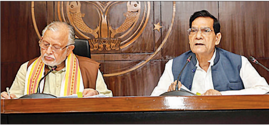
कैबिनेट के फैसलों की जानकारी देते वित्त एवं संसदीय कार्य मंत्री सुरेश खन्ना और नगर विकास व ऊर्जा मंत्री एके शर्मा।

परिवर्तन की प्रक्रिया को बेहद सरल बना दिया गया है। अब इन क्षेत्रों में अलग से लैंड यूज बदलवाने की आवश्यकता नहीं होगी। यदि किसी भूखंड का नक्शा प्राधिकरण द्वारा पास हो जाता है, तो उसी को भूमि उपयोग परिवर्तन माना जाएगा। इससे पहले लोगों को दोहरी प्रक्रिया (पहले लैंड यूज परिवर्तन और फिर नक्शा पास