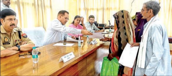
शिकायतें सुनते डीएम व एसएसपी । अमृत विचार

सम्पूर्ण समाधान दिवस में उन्होंने अधिकारियों को निर्देश दिये कि प्रकरणों की गंभीरता से जांच की जाये साथ ही जवाबदेह लोगों के विरुद्ध कार्यवाही की जाये। उन्होंने कहा कि जब भी अधिकारीगण गांवों के भ्रमण पर जायें अपने विभाग से संबंधित योजनाओं का मौके पर सत्यापन करें तथा लाभाधियों का फीडबैक भी लें। तहसील ताखा में विभिन्न संदर्भों से संबंधित कुल 13 प्रार्थना पत्र प्राप्त हुये, जिसमें मौके पर 2 शिकायतों का