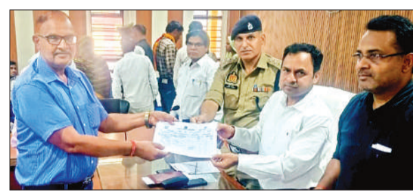
किसान को खतौनी देते एसडीएम व तहसीलदार।