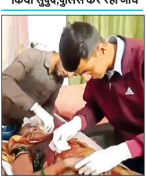
महिला का उपचार करते चिकित्सक।