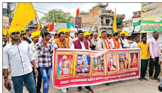
शोभा यात्रा में शामिल समाज के लोग।

शोभायात्रा राजकीय मकुंदलाल इंटर कालेज तिवारी के सामने से प्रारम्भ हुई, जो सुभाष चौकी, हिस्सा लिया। तमाम लोग सिर पर पीली पगड़ी बांधे हुए चल रहे