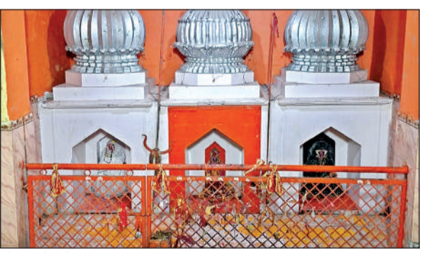
श्री आनंदी देवी मंदिर

कालपी जालौन। महान धार्मिक नगर कालपी धाम में वैसे तो अनेक ऐतिहासिक पौराणिक धार्मिक स्थल हैं। उन्हीं में से एक है श्री आनंदी देवी मंदिर। नगर के मोहल्ला राम बबूतरा मिर्जा मंडी और भट्टीपुरा तिराहे पर विराजी मां लक्ष्मी स्वरूपा मां आनंदी के दारु मां सरस्वती और बाई और मां काली विराजमान हैं, जिसके चलते इस दरबार को वैष्णों देवी दरबार की मान्यता प्राप्त है। यह दरबार यूं ही प्रसिद्ध नहीं पाए हैं बल्कि इसके कई चमत्कारी किस्से बताए जाते हैं। व्यक्ति कितना भी निराश हो दुखी हो विता ग्रस्त हो अगर वह मां आनंदी देवी के दरबार में आंख बंद करके मां का ध्यान भर कर ले तो ऐसा चमत्कार होता है कि व्यक्ति की शिका बाधा को मां पल भर में हर लेती है और याचक का मन प्रसन्न और आनंदित हो जाता है। यहां प्रतिदिन भारी संख्या में माताएं बहने व पुरुष नियमित दर्शन के लिए आते हैं। नवरात्रि में मां का नौ दिनों तक विशेष श्रृंगार, आरती, भजन, कीर्तन व पूजन होता है। सुंदर भवन में विराजी मां के सेवक उन पर अटूट श्रद्धा विश्वास रखते हैं और मां आनंदी भी अपने भक्तों की हर मनोकामना पूर्ण करती हैं।