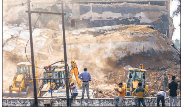
प्रयागराज के फाफामऊ थाना क्षेत्र में कोल्ड स्टोरेज की गिरी छत।