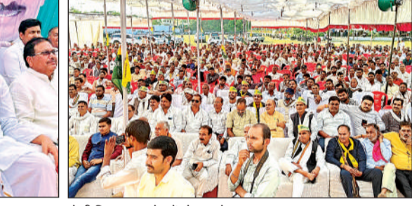
होली मिलन समारोह में मौजूद लोग