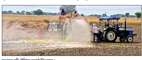
फसल की श्रैसिंग करते किसान।

सोमवार को शाम के समय अचानक बादलों का डेरा जमा हो जाने से किसानों की धड़कनें बढ़ी हुई हैं। किसान कटी पड़ी फसलों को समेटकर घर लाने की काव्यद में जुटा हुआ है।