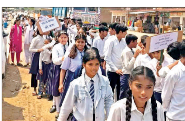
पद यात्रा निकालते स्कूली छात्र। अमृत विचार

भगतसिंह और उनके साथियों ने 1928 में सांडर्स को मौत के घाट उतारकर महान देशभक्त लाला लाजपत राय की मौत का बदला लिया था। ये तीनों युवा उस समय लगभग 23-24 वर्ष के थे। भगतसिंह और उनके साथियों ने 8 अप्रैल 1929 को असेम्बली में बम