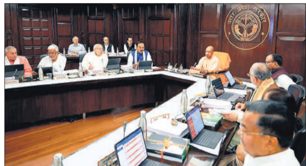
लखनऊ: मंत्रिमंडल के सहयोगियों के साथ लोक भवन में बैठक करते मुख्यमंत्री योगी।

अमृत विचार: मुख्यमंत्री योगी आदित्यनाथ की अध्यक्षता में सोमवार को लोकभवन में हुई कैबिनेट बैठक में 37 प्रस्तावों पर विचार के बाद चीनी उद्योग और लखीमपुर खीरी पुल विस्तार योजना को स्थगित करते हुए 35 प्रस्तावों को मंजूरी दे दी गई। बैठक में सबसे अधिक फोकस किसानों पर रहा, जबकि ऊर्जा, निवेश, पर्यटन और इंफ्रास्ट्रक्चर को गति देने के लिए भी कई महत्वपूर्ण फैसले लिए गए।