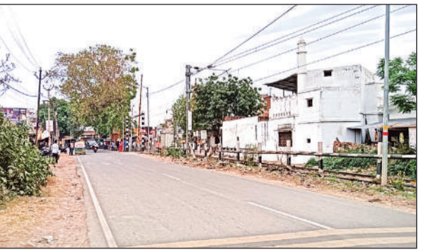
सोमवार की शाम चार बजे के करीब बादलों से घिरा आसमान। अमृत विचार

कार्यालय संवाददाता कन्नौज अमृत विचार। मौसम में पल पल का बदलाव जारी है। एक दिन खुलने के बाद फिर से बदल गया और आसमान में दिन भर बादलों का डेरा बना रहा। हालांकि बीच-बीच में धूप के भी दर्शन होते रहे। कहीं-कहीं हल्की बूँदाबाँदी भी हुई और सर्द हवाएं भी चलती रहीं। बादलों के रहने से तापमान में कोई खास असर नहीं पड़ा। सोमवार को एक बार फिर से मौसम का मिजाज बदल गया। सुबह से ही हल्के बादल छाए रहे। कुछ देर बाद सूरज की किरणें नजर आईं लेकिन पल भर में ओझल हो गईं। यह क्रम लगभग दिन भर चलता रहा। बादल इतने घने रहे कि कई बार लगा कि बारिश हो ही जाएगी लेकिन हवा चलने से बादल