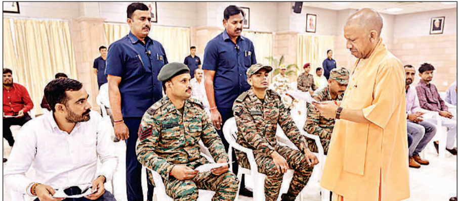
जनता दर्शन में आए सैनिकों की समस्याएं सुनते मुख्यमंत्री योगी आदित्यनाथ।

जनता दर्शन में विभिन्न जनपदों से आए सैनिकों ने अपनी समस्याएं मुख्यमंत्री के सामने रखीं, जिनमें कई मामलों में जमीनी विवाद से जुड़े थे। सीएम योगी ने संबंधित प्रार्थना पत्र लेते हुए अधिकारियों को निर्देश