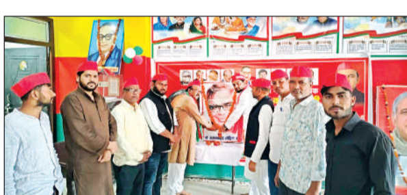
राममनोहर लोहिया की जयंती मनाते सपाईं।