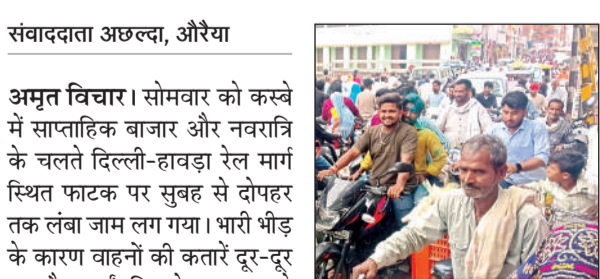
जाम में फंसी पहुंचले।

अमृत विचार। सोमवार को कस्बे में साप्ताहिक बाजार और नवरात्रि के चलते दिल्ली-हावाड़ा रेल मार्ग स्थित फाटक पर सुबह से दोपहर तक लंबा जाम लग गया। भारी भीड़ के कारण वाहनों की कतारें दूर-दूर तक फैल गईं, जिससे आमजन को काफी परेशानी हुई। जाम सुबह करीब 10:25 बजे रेलवे फाटक पर लगना शुरू हुआ। धीरे-धीरे भीड़ बढ़ती गई और लगभग 11:10 बजे तक जाम हरीगंज बाजार की ओर और दूसरी तरफ नहर बाजार तक फैल गया। दोपहर करीब 2:26 बजे तक फाटक के दोनों ओर वाहनों की लंबी कतारें लग चुकी थीं, जिससे स्थिति और गंभीर हो गई। इस