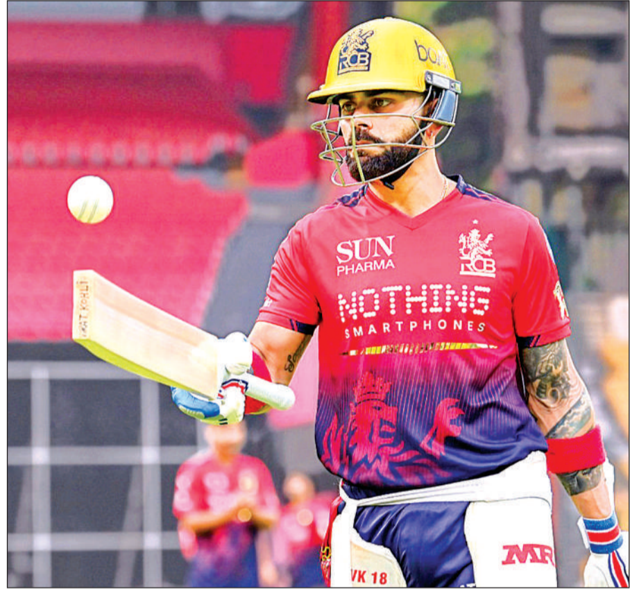
बेंगलुरु स्थित एन.विन्नास्वामी स्टेडियम में अभ्यास करते रॉयल चैलेंजर्स बेंगलुरु के विराट कोहली।

नई दिल्ली। श्रीलंका के टी20 अंतरराष्ट्रीय कप्तान दासुन शनाका को सोमवार को आईपीएल के लिए इंग्लैंड के चोटिल ऑलराउंडर सैम कुरेन के स्थान पर राजस्थान रॉयल्स टीम में शामिल किए जाने की पुष्टि की गई। शनाका दो करोड़ रुपये में राजस्थान रॉयल्स से जुड़े हैं। शनाका ने श्रीलंका के लिए छह टेस्ट, 71 वनडे और 131 टी20 अंतरराष्ट्रीय मैच खेले हैं और अंतरराष्ट्रीय क्रिकेट में उनके नाम 3350 से अधिक रन और 86 विकेट हैं। इस 34 साल के खिलाड़ी ने 2023 में गुजरात टाइटन्स के लिए आईपीएल में तीन मैच खेले हैं। राजस्थान रॉयल्स के मुख्य कोच और टीम निदेशक कुमार संगकारा ने खुशी जताई।