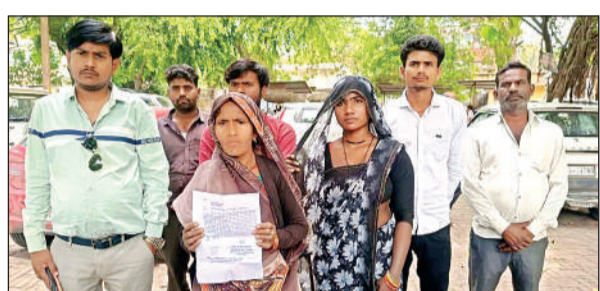
एडीएम को ज्ञापन देने जाते अल कछवा के कार्डधारक।