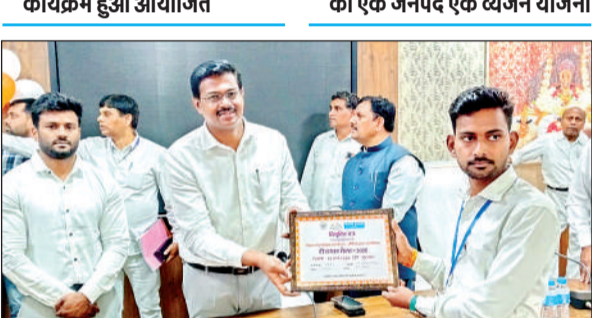
बच्चों को प्रमाण पत्र देते मंडल आयुक्त।