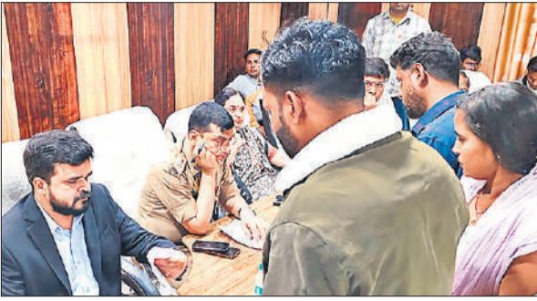
शाहबाद तहसील में संपूर्ण समाधान दिवस में जन समस्या सुनते डीएम व एसपी।