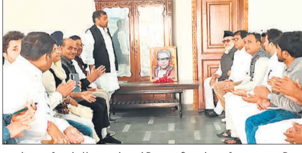
सपा कैम्प कार्यालय में डॉ. राम मनोहर लोहिया जयंती मनाते सपाईं।