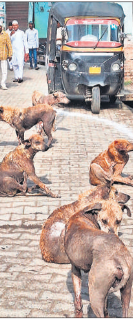
बिलासपुर के मोहल्ला शरीर मियां में बैठा कुत्तों का झुंड।

● मोहल्ला शरीर मियां में बच्चों, महिलाओं और राहगीरों को बना रहे निशाना