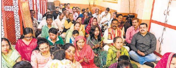
मंदिर में भजन कीर्तन करते भक्त।