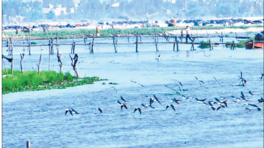
रामगंगा नदी पर अठखेलियां करते प्रवासी पंछी।

और दोबारा आसमान की ओर रुख करता दिखा। मौसम में बदलाव के साथ अब ये प्रवासी पंछी अपने मूल स्थानों की ओर लौटने लगे हैं। वन विभाग के अधिकारियों के अनुसार पिछले कुछ महीनों से नदी किनारे डेरा डाले इन पक्षियों की अब वापसी शुरू हो गई है।