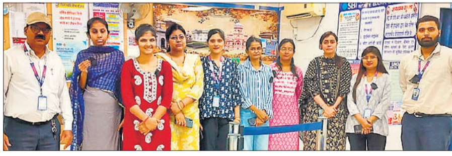
एसबीआई की मुख्य शाखा में काली पट्टी बांधे कर्मचारी।