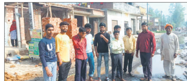
जलभराव को लेकर विरोध जताते लोग।