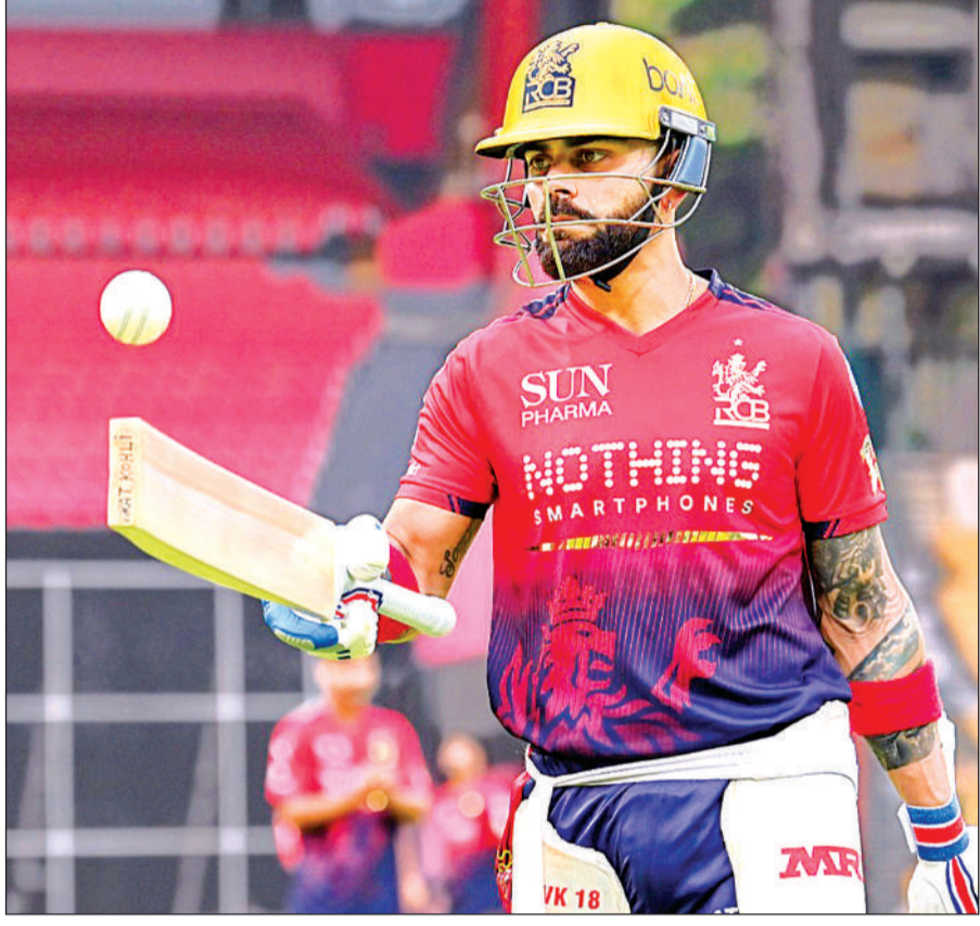
बेंगलुरु स्थित एमिन्नास्वामी स्टेडियम में अभ्यास करते रॉयल चैलेंजर्स बेंगलुरु के विराट कोहली।

नई दिल्ली। श्रीलंका के टी20 अंतरराष्ट्रीय कप्तान दासुन शनाका को सोमवार को आईपीएल के लिए इंग्लैंड के चोटिल ऑलराउंडर सैम कुरेन के स्थान पर राजस्थान रॉयल्स टीम में शामिल किए जाने की पुष्टि की गई। शनाका दो करोड़ रुपये में राजस्थान रॉयल्स से जुड़े हैं। शनाका ने श्रीलंका के लिए छह टेस्ट, 71 वनडे और 131 टी20 अंतरराष्ट्रीय मैच खेले हैं और अंतरराष्ट्रीय क्रिकेट में उनके नाम 3350 से अधिक रन और 86 विकेट हैं। इस 34 साल के खिलाड़ी ने 2023 में गुजरात टाइटन्स के लिए आईपीएल में तीन मैच खेले हैं। राजस्थान रॉयल्स के मुख्य कोच और टीम निदेशक कुमार संगकारा ने खुशी जताई।