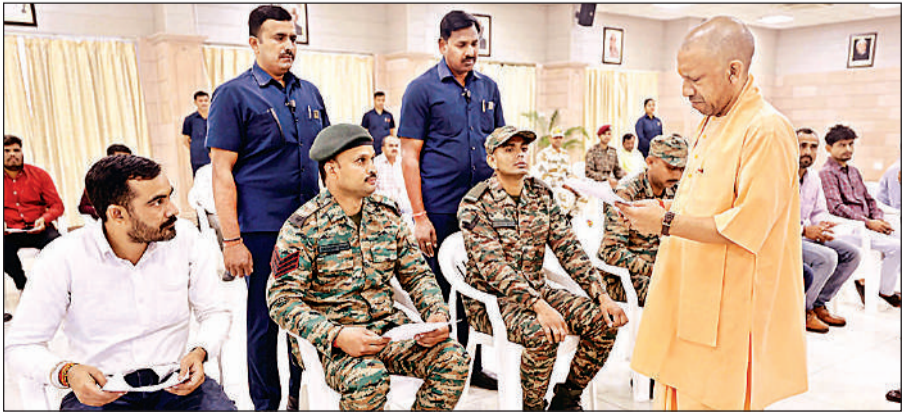
जनता दर्शन में आए सैनिकों की समस्याएं सुनते मुख्यमंत्री योगी आदित्यनाथ।

जनता दर्शन में विभिन्न जनपदों से आए सैनिकों ने अपनी समस्याएं मुख्यमंत्री के सामने रखीं, जिनमें कई मामलों में जमीनी विवाद से जुड़े थे। सीएम योगी ने संबंधित प्रार्थना पत्र लेते हुए अधिकारियों को निर्देश