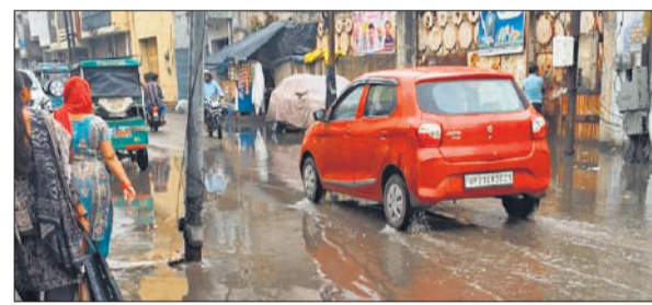
जल बराव में गुजरते वाहन।

प्रभात मार्केट स्थित कैप कार्यालय के सामने सड़क पर जलभराव हो गया था। यह जलभराव की समस्या का समाधान सोमवार तक नहीं हो पाया। सोमवार को भी लोग जलभराव और गंदगी के बीच से गुजरते नजर आए।