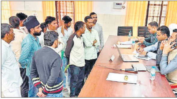
समाधान दिवस में पत्र देते ग्रामीण।