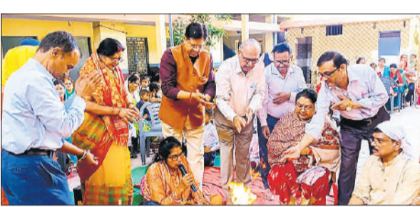
सरस्वती शिशु मंदिर में हवन में आहुति देते श्रद्धालु