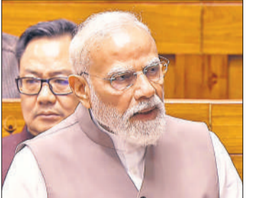
● पश्चिम एशिया संकट पर लोकसभा में मोदी ने दिया वक्तव्य, कहा- कूटनीति से ही युद्ध का समाधान संभव

उन्होंने होर्मुज स्ट्रेट के रुकावट और व्यावसायिक जहाजों पर हमलों को अस्वीकार्य बताया है और कहा कि इस समस्या का समाधान कूटनीति और बातचीत से ही संभव है तथा भारत तनाव को कम करने व संघर्ष समाप्त करने के लिए हरसंभव प्रयास कर रहा है। उन्होंने कहा कि पिछले एक दशक में ऊर्जा क्षेत्र में सरकार की तैयारियों के कारण आज हालात से निपटने में मदद मिल रही है। प्रधानमंत्री ने सरकार के