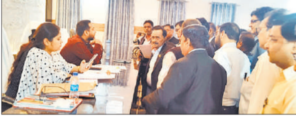
मिलक तहसील सभागार में उपजिलाधिकारी को ज्ञापन सौंपते अधिवक्ता।