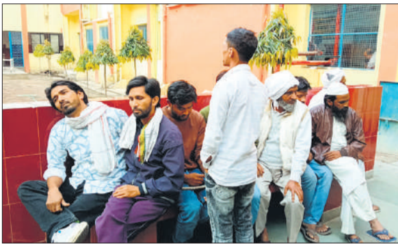
जिला अस्पताल में मेडिकल करवाने पहुंचे आरोपी।

● कोतवाली मैनाठेर में घुसकर की तोड़फोड़, सरकारी वाहनों में लगाई थी आग