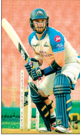
अहमदाबाद में आईपीएल 2026 सीजन से पहले अभ्यास सत्र के दौरान टाइम-कॉन्स के रोलिंग फिलिंग्स।

मुंबई। भारतीय क्रिकेट कंट्रोल बोर्ड (बीसीसीआई) द्वारा अभ्यास सत्र के लिए जारी किये गये नए दिशा-निर्देशों के तहत मैच के दिनों में कोई भी प्रैक्टिस सेशन करने की इजाजत नहीं होगी। बीसीसीआई के एक नोट के अनुसार टीम मैनेजर्स को हाल ही में ये अतिरिक्त गाइडलाइंस भेजी गई हैं - टीमों को प्रैक्टिस एरिया में 2 नेट और मुख्य पिच के पास के विकेटों में से 1 विकेट 'रेज हिटिंग' (जोरदार शॉट लगाने की प्रैक्टिस) के लिए मिलेगा। मुंबई के वेन्यू के लिए, अगर दोनों टीमों एक ही समय पर प्रैक्टिस कर रही हैं, तो हर टीम को 2-2 विकेट मिलेंगे।