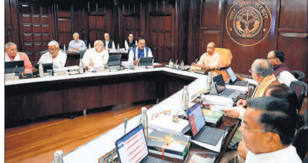
लखनऊ: मंत्रिमंडल के सहयोगियों के साथ लोक भवन में बैठक करते मुख्यमंत्री योगी।

अमृत विचार: मुख्यमंत्री योगी आदिट्ठनाथ की अध्यक्षता में सोमवार को लोकभवन में हुई कैबिनेट बैठक में 37 प्रस्तावों पर विचार के बाद चीनी उद्योग और लखीमपुर खीरी पुल विस्तार योजना को स्थगित करते हुए 35 प्रस्तावों को मंजूरी दे दी गई। बैठक में सबसे अधिक फोकस किसानों पर रहा, जबकि ऊर्जा, निवेश, पर्यटन और इंफ्रास्ट्रक्चर को गति देने के लिए भी कई महत्वपूर्ण फैसले लिए गए।