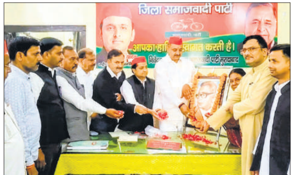
डॉ राम मनोहर लोहिया के चित्र पर माल्यार्पण करते सभा नेता।