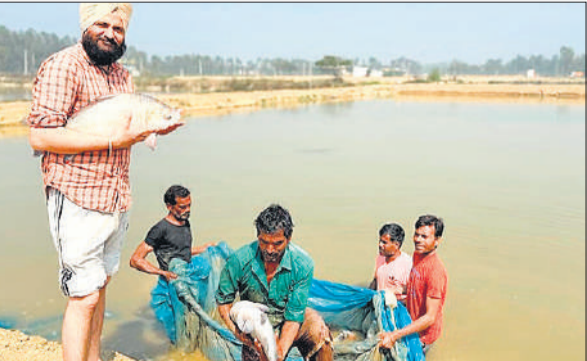
रामपुर में तालाब से पकड़ी मछली दिखाते मछली पालक।

जनपद में तहसील मिलक में 40 हैचरियों में मछली का बीज तैयार कराया जा रहा है। जबकि स्वार और बिलासपुर में भी मछली का बीज तैयार हो रहा है। इसके अलावा बड़े पैमाने पर जिले में 1015 तालाबों में मत्स्य पालन किया जा रहा है। सहायक निदेशक ने बताया कि 416 हेक्टेयर रकबे के तालाबों का पट्टा किया जा चुका है ताकि, मत्स्य पालन को और बढ़ावा मिल सके।