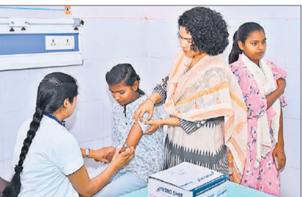
किशोरी को टीका लगावती डीएम।

टीकाकरण जिला महिला अस्पताल एवं सभी सामुदायिक स्वास्थ्य केंद्रों में निर्धारित गाइड लाइन के अनुसार किया जाएगा। सभी तैयारियां पूरी कर ली गई हैं और स्वास्थ्य कर्मियों को प्रशिक्षित किया गया है। अभियान के तहत 14 से 15 वर्ष की आयु वर्ग की किशोरियों को निःशुल्क वैक्सीन लगाई जाएगी।