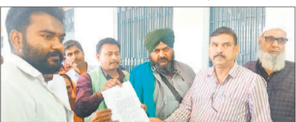
नायब तहसीलदार को ज्ञापन देते कार्यकर्ता।