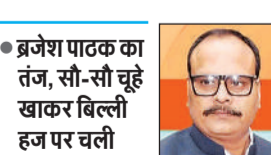
ब्रजेश पाठक का तंज, सौ-सौ चूहे खाकर बिल्ली हज पर चली