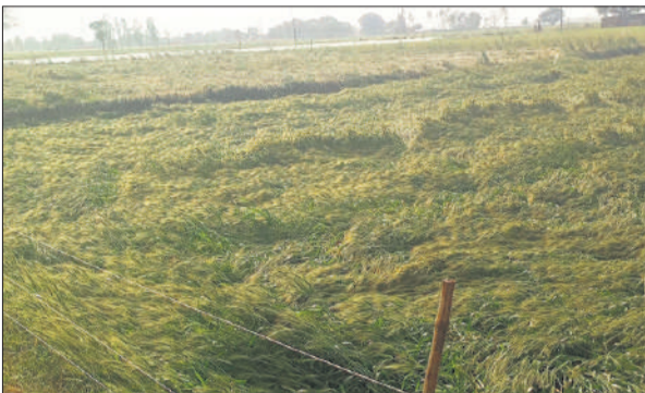
तेज हवा के कारण खेत में गिरी गेहूं की फसल।