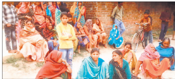
गांव सलावतनगर में रौती बिलखती परिवार की महिलाएं।