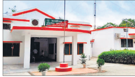
पीलीभीत टाइगर रिजर्व मुख्यालय।

अमृत विचार : पीलीभीत टाइगर रिजर्व में वन एवं वन्यजीवों की सुरक्षा में लगे 240 वन वॉचरों एवं अन्य दैनिक वेतनभोगी कर्मचारियों को पिछले सात माह से मानदेय नहीं मिल सका है। इससे उन्हें आर्थिक तंगी का सामना करना पड़ रहा है। ऐसे में टाइगर रिजर्व प्रशासन ने बजट मिलता न देख अब टाइगर कंजर्वेशन फाउंडेशन से इन सभी दैनिक भोगी कर्मचारियों को मानदेय देने का निर्णय लिया है। डिप्टी डायरेक्टर ने उच्चाधिकारियों से मिले दिशा निर्देश के बाद फाउंडेशन से इन सभी को मानदेय देने को हरी झंडी दे दी है।