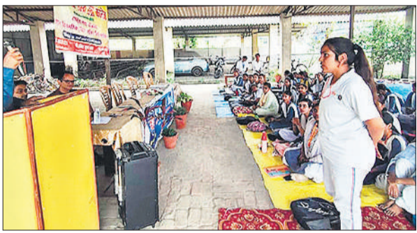
शिविर में प्राध्यपक से पुलिस धाराओं की जानकारी लेती स्वयंसेविका।

अमृत विचार: केन प्रोअर्स नेहरू पीजी में राष्ट्रीय सेवा योजना के सात दिवसीय विशेष शिविर के षष्ठम दिवस स्वयंसेवकों और स्वयंसेविकाओं को नागरिक सुरक्षा, महिला सुरक्षा के प्रति जागरूक कर देश के बलिदानियों का स्मरण कराया गया।