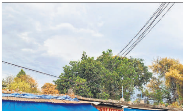
लखीमपुर शहर में दोपहर बाद छाए बादल।

हालांकि, पिछले कुछ दिनों में धूप निकलने पर हल्की गर्मी महसूस हुई थी, लेकिन रात के समय ठंड बनी रही। वहीं बूटाबांटी, ओलावृष्टि और तेज हवाओं के कारण सरसों और गेहूं की फसल