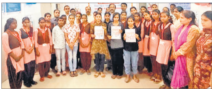
टीकाकरण के बाद किशोरियां।

सकते हैं। उन्होंने अभिभावकों से आह्वान किया कि वे बिना किसी झिझक के अपनी 14 से 15 वर्ष आयु वर्ग की बेटियों का समय पर टीकाकरण कराएं और इस अभियान को जन-जन तक पहुंचाने में सहयोग करें। विधायक योगेश वर्मा ने कहा कि बेटियां समाज की शक्ति हैं। उनकी सुरक्षा और स्वास्थ्य को लेकर किसी प्रकार की लापरवाही नहीं होनी चाहिए। भाजपा जिलाध्यक्ष अरविंद गुप्ता ने पीएम की पहल का उल्लेख करते हुए कहा कि देश के नेतृत्व ने