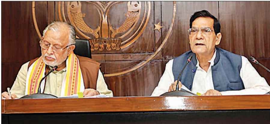
कैबिनेट के फैसलों की जानकारी देते वित्त एवं संसदीय कार्य मंत्री सुरेश खन्ना और नगर विकास व ऊर्जा मंत्री एके शर्मा।

मुख्यमंत्री योगी आदित्यनाथ की अध्यक्षता में हुई कैबिनेट की बैठक में उप्र. राजस्व संहिता, 2006 की धारा-80 में संशोधन के लिए अध्यादेश 2026 को मंजूरी दे दी गई। इस अहम फैसले के तहत विकास प्राधिकरणों, औद्योगिक विकास प्राधिकरणों, विनियमित क्षेत्रों तथा उत्तर प्रदेश आवास एवं विकास परिषद के अधीन क्षेत्रों में गैर-कृषि उपयोग (लैंड यूज) परिवर्तन की प्रक्रिया को बेहद सरल बना दिया गया है। अब इन क्षेत्रों में अलग से लैंड यूज बदलवाने की आवश्यकता नहीं होगी। यदि किसी भूखंड का नक्शा प्राधिकरण द्वारा पास हो जाता है, तो उसी को भूमि उपयोग परिवर्तन माना जाएगा। इससे पहले लोगों को दोहरी प्रक्रिया (पहले लैंड यूज परिवर्तन और फिर नक्शा पास