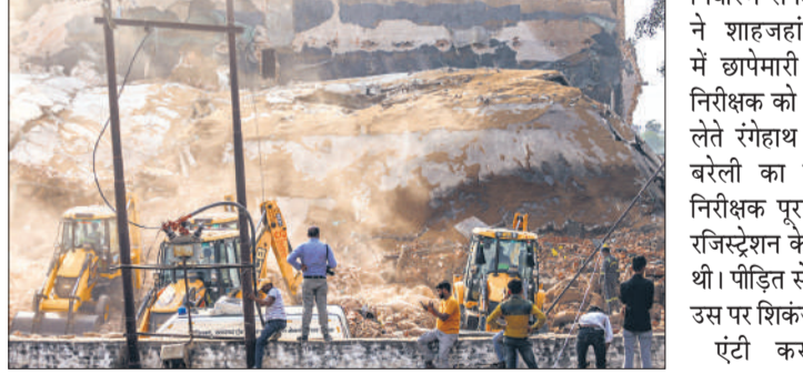
प्रयागराज के फाफामऊ थाना क्षेत्र में कोल्ड स्टोरेज की गिरी छत।