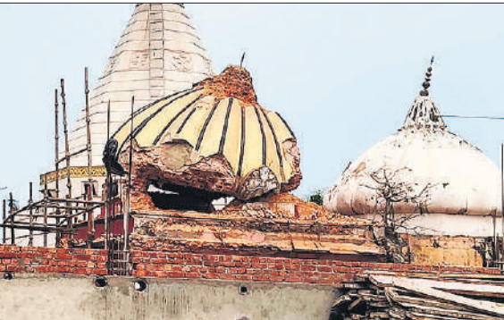
गोला में पौराणिक शिव मंदिर के पीछे हटाया जा रहा काल भैरव बाबा का मंदिर।