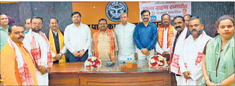
पूरनपुर में हुए शपथ ग्रहण कार्यक्रम में विधायक, चेयरमैन, एसडीएम व अन्य।

नगर पालिका और नगर पंचायतों में आयोजित किया शपथ ग्रहण कार्यक्रम, प्रशासनिक अधिकारियों ने दिलाई शपथ, जनप्रतिनिधि भी रहे शामिल