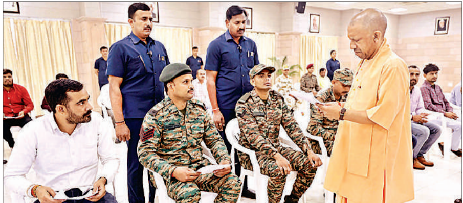
जनता दर्शन में आए सैनिकों की समस्याएं सुनते मुख्यमंत्री योगी आदित्यनाथ। अमृत विचार

अमृत विचार: मुख्यमंत्री योगी आदित्यनाथ ने सोमवार को आयोजित 'जनता दर्शन' में आए सैनिकों को भरोसा दिलाते हुए कहा कि आप वैफिक होकर देशसेवा कीजिए, आपके परिवार की सुरक्षा, सम्मान और देखभाल सरकार की जिम्मेदारी है।