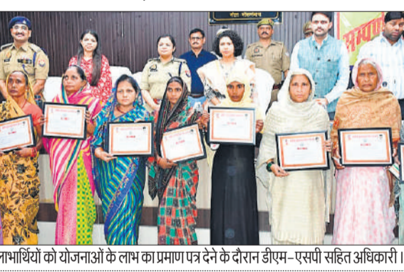
लाभार्थियों को योजनाओं के लाभ का प्रमाण पत्र देने के दौरान डीएम-एसपी सहित अधिकारी।

अमृत विचार: तहसील सभागार में आयोजित संपूर्ण समाधान दिवस में जिलाधिकारी, पुलिस अधीक्षक ने जनसुनवाई की। इस दौरान विभिन्न विभागों से संबंधित 47 मामलों में से केवल तीन शिकायतों का ही मौके पर निस्तारण हो सका। अन्य के लिए संबंधित अधिकारियों को निर्देशित किया गया।