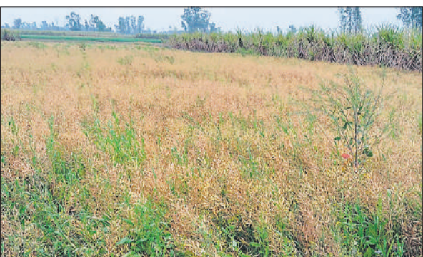
खेत में खड़ी सरसों की फसल।

में न्यूनतम तापमान भी सामान्य से नीचे पहुंच जाने, नमी की प्रचुरता एवं वायुमंडलीय स्थिरता