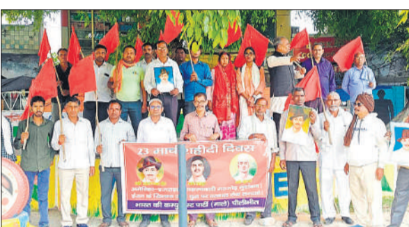
शहर के रामस्वरूप पार्क में एकत्र भाकपा माले कार्यकर्ता।

अमृत विचार : भाकपा माले कार्यकर्ताओं ने शहीदी दिवस को साम्राज्यवाद विरोधी दिवस के रूप में मनाया। इस दौरान माले कार्यकर्ताओं ने शहर में साम्राज्य विरोधी मार्च निकाला और ऐतिहासिक रामस्वरूप पार्क में पहुंचकर सभा की। सभा में अमेरिका-इजरायल से ईरान पर तत्काल हमला बंद करने की मांग की गई। शहीदे आजम भगत सिंह, राजगुरु, सुखदेव के शहीदी दिवस पर जनपद भर से भाकपा माले कार्यकर्ता सोमवार को शहर के बल्लभनगर कॉलोनी स्थित