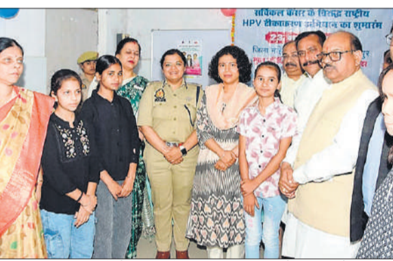
जिला महिला अस्पताल में टीकाकरण के आरंभ पर विधायक, डीएम व एसपी।

अमृत विचार: आस्था और शक्ति के पर्व नवरात्र के बीच जिले में बेटी बचाओ, कैंसर भगाओ का मजबूत संदेश गूँजा। प्रधानमंत्री की प्राथमिकता वाले सर्वाइकल कैंसर रोकथाम अभियान के तहत जिला महिला अस्पताल से एचपीवी (ह्यूमन पैपिलोमावायरस वैक्सीन) वैक्सीनेशन की शुरुआत हुई। पहले दिन शाम तक लगभग 80 किशोरियों को वैक्सीन लगाई गई।