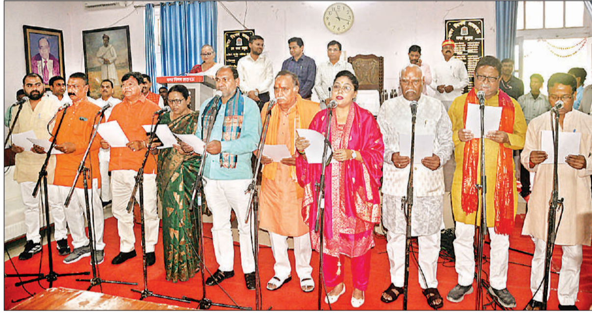
नगर निगम के त्रिलोकनाथ हॉल में शपथ ग्रहण करते नामित पार्षद।