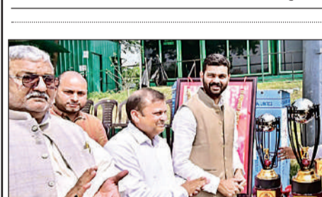
प्रतियोगिता के उद्घाटन पर मौजूद लोग।

लविवि छात्राएं महिला से बातचीत करती हुईं।