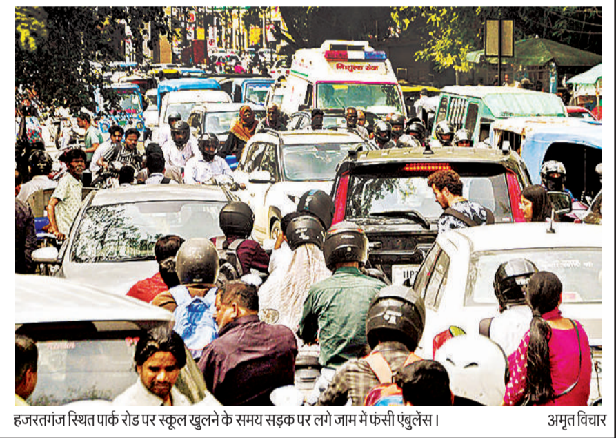
हजरतगंज स्थित पार्क रोड पर स्कूल खुलने के समय सड़क पर लगे जाम में फंसी एंबुलेंस।