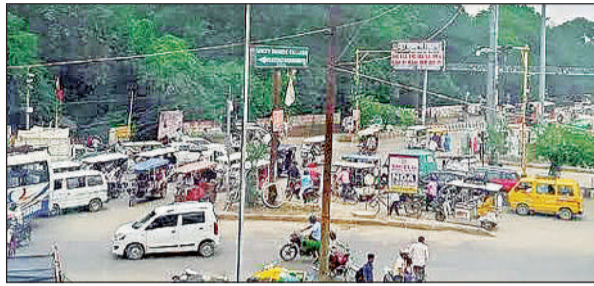
दुबग्गा चौराहे पर लगा जाम। (फाइल फोटो)

● 10 हजार की क्षमता का हॉल, 2500 की क्षमता का ऑडिटोरियम बनेगा