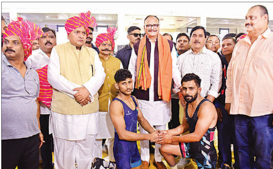
रसेलिंग गोल्ड कप के उद्घाटन मौके पर मौजूद पहलवानों के साथ मुख्य अतिथि उपमुख्यमंत्री ब्रजेश पाठक।