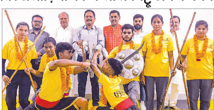
घोषित की गई उत्तर प्रदेश कलारीपयट्टू टीम के खिलाड़ी।