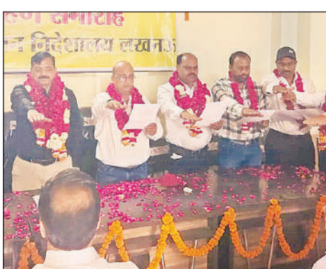
बादशाहबाग स्थित पशुपालन निदेशालय में शायथ ग्रहण करते पदाधिकारी।