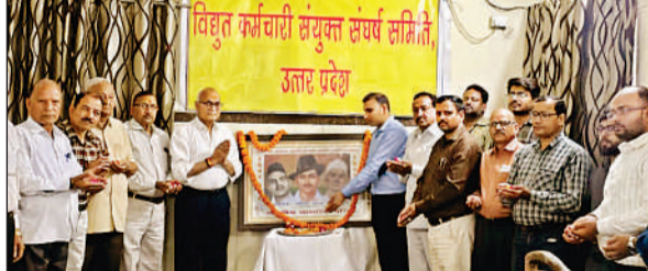
शहीदों को श्रद्धांजलि अर्पित करते विद्युत कर्मचारी संयुक्त संघर्ष समिति के लोग।

खर्च होगा। इसके अलावा मोबाइल वेटरनरी यूनिट के अंतर्गत योजना के लिए दी गई धनराशि से मशीनें, आवश्यक उपकरणों की खरीद की जाएगी। समूची धनराशि राज्य सरकार द्वारा ही प्रदान की जाएगी।