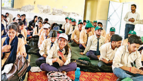
शिविर में शामिल छात्र और छात्राएं।