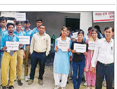
जागरूकता रैली निकालते छात्र-छात्राएं व शिक्षक।