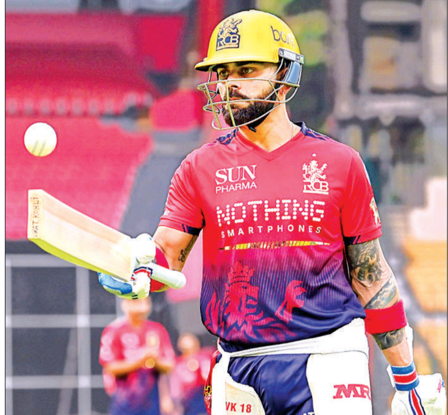
बेंगलुरु स्थित एम चिन्नास्वामी स्टेडियम में अभ्यास करते रॉयल चैलेंजर्स बेंगलुरु के विराट कोहली।

दिए जा रहे हैं, जबकि पीएसएल फ्रेंचाइजी उन वेतन पैकेजों का मुकाबला करने के लिए संघर्ष कर रही है। पीसीबी ने पिछले साल अनुबंध उल्लंघन के लिए दक्षिण अफ्रीका के कॉर्बिन बोश के खिलाफ कानूनी कार्रवाई की थी और उन पर एक साल का प्रतिबंध लगाया था। यह कदम हालांकि प्रभावी साबित नहीं हुआ, क्योंकि बोश ने पीएसएल खिलाड़ी ड्राफ्ट में शामिल होने से पहले ही अगली नीलामी में आईपीएल अनुबंध हासिल कर लिया। पीसीबी द्वारा इस मुद्दे को आईपीएल के अन्य सदस्यों के समक्ष भी उठाने की उम्मीद है, ताकि एक मजबूत ढांचा तैयार किया जा सके, जो यह सुनिश्चित करे कि खिलाड़ी किसी लीग में शामिल होने के बाद अपने अनुबंध संबंधी दायित्वों का पालन करें। इस बीच ऑस्ट्रेलिया के स्टीव स्मिथ और मारुस लाबुशेन, न्यूजीलैंड के मार्क चैपमैन और डेवोन कॉन्वे कुछ अन्य विदेशी खिलाड़ियों के साथ पीएसएल में भाग लेने के लिए लाहौर पहुंच गए।