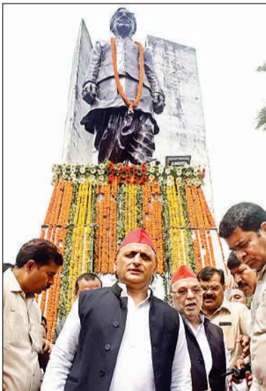
गोमतीनगर स्थित लोहिया पार्क में समाजवादी चिंतक डॉ. राम मनोहर लोहिया की जयंती पर उन्हें श्रद्धांजलि देने पहुंचे सपा प्रमुख अखिलेश यादव।

फिल्म में बनाने में पैसा खर्च कर रही है जो दूसरे दलों को बदनाम करने का काम करती है। मुझे लगता है कि उनके पास बहुत ज्यादा पैसा है, तभी तो फिल्मों की रिलीज पर भी पैसे बहाए जा रहे हैं।