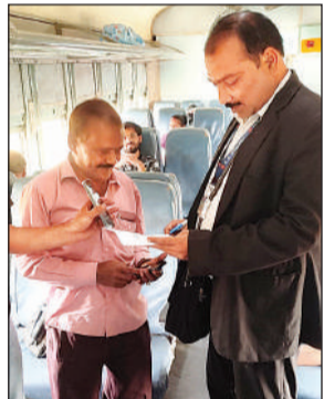
ट्रेन में यात्रियों के टिकटों की जांच करते अधिकारी।