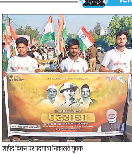
शहीद दिवस पर पदयात्रा निकालते युवक।