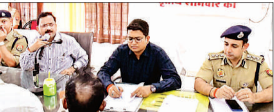
लोगों की शिकायतें सुनते डीएम और एएसपी।