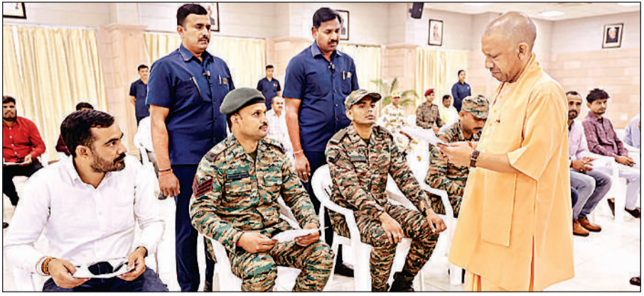
जनता दर्शन में आए सैनिकों की समस्याएं सुनते मुख्यमंत्री योगी आदित्यनाथ।

जनता दर्शन में विभिन्न जनपदों से आए सैनिकों ने अपनी समस्याएं मुख्यमंत्री के सामने रखीं, जिनमें कई मामलों में जमीनी विवाद से जुड़े थे। सीएम योगी ने संबंधित प्रार्थना पत्र लेते हुए अधिकारियों को निर्देश