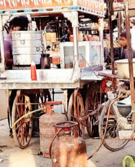
रोड किनारे लगे टैला पर घरेलू सिलेंडर से बनाई जाती खाद्य सामग्री।