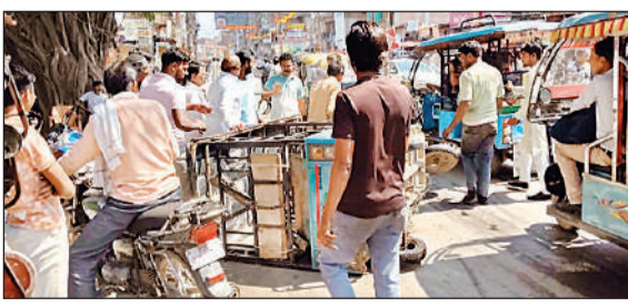
अताउल्ला नाले के पास पलटा ई-रिक्शा को उठाते लोग।

कार्यालय संवाददाता, उन्नाव अमृत विचार: शहर के मुख्य मार्ग पर नगर पालिका की लापरवाही सामने आई है। छोटा चौराहा और नाला चौराहा के बीच अताउल्ला नाले के पास पाइप काटा उल्ला लीकेज होने से हुआ गहरा गड्ढा अब राहगीरों के लिए काल सावित हो रहा है। मंगलवार को इस गड्ढे की वजह से कई ई-रिक्शा पलट गए। जिसमें सवार यात्री चोटहिल हो गए। बता दें कि अताउल्ला नाले के पास कुछ दिन पूर्व पाइप लाइन में रिसाव शुरू हुआ था। धीरे-धीरे पानी के कटाव से सड़क के बीचोबीच गहरा गड्ढा हो गया। जिम्मेदार अफसरों द्वारा समय रहते सुध न लेने से यह गड्ढा अब