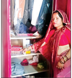
चोरी के बारे में जानकारी महिला।