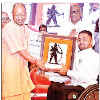
पैरालंपिक खिलाड़ी को लक्ष्मण अवार्ड देते मुख्यमंत्री।

अमृत विचार, लखनऊ: मुख्यमंत्री योगी आदित्यनाथ ने मंगलवार को लोकभवन में अंतरराष्ट्रीय और राष्ट्रीय स्तर के खिलाड़ियों को सम्मानित करते हुए कहा कि हर मेडल के पीछे संघर्ष, अनुशासन और दृढ़ संकल्प की कहानी होती है। जितना परीना बहेगा, जीत उतना ही निकट आएगी। खिलाड़ियों को नियुक्ति पत्र, लक्ष्मण एवं रानी लक्ष्मीबाई पुरस्कार और पदक जीतने पर बधाई देते हुए ऐलान किया कि इन दोनों प्रतिष्ठित पुरस्कारों की राशि 3.11 लाख रुपये से बढ़ाकर 10-10 लाख रुपये की जाएगी। इसके लिए उन्होंने खेल विभाग को प्रस्ताव तैयार कर भेजने के निर्देश दिए। मुख्यमंत्री ने बताया कि मेरठ में बन रहे मेजर ध्यानचंद खेल विश्वविद्यालय को प्राथमिकता दी जा रही है। उन्होंने बताया कि प्रदेश में पिछले 9 वर्षों में खिलाड़ियों को 200 करोड़ रुपये से अधिक की प्रोत्साहन राशि दी गई है। ओलंपिक में स्वर्ण पदक जीतने वाले खिलाड़ी को 6 करोड़ रुपये, रजत पदक 4 करोड़ और कांस्य पदक 2 करोड़ रुपये दिए जाते हैं। अब तक 500 से अधिक खिलाड़ियों को सरकारी नौकरी भी दी जा चुकी है। मुख्यमंत्री ने यह भी कहा कि पहले जहां खेल उपेक्षित थे, वहीं अब बेहतर इंफ्रास्ट्रक्चर, पारदर्शी व्यवस्था और प्रोत्साहन के कारण खिलाड़ियों को आगे बढ़ने का अवसर मिल रहा है।