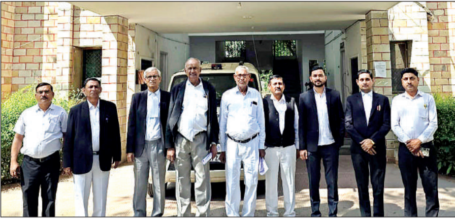
एसपी कार्यालय पहुंचा अधिवक्ताओं का प्रतिनिधिमंडल।