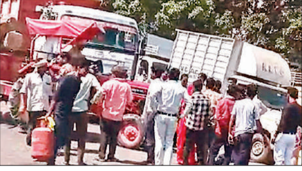
गैस सिलेंडर के लिए हाईवे पर जाम लगाए उपभोक्ता।

नवाबगंज उन्नाव अमृत विचार: कस्बे में गैस संकट को लेकर उपभोक्ताओं का गुस्सा सड़क पर फूट गया। गैस न मिलने से नाराज महिलाओं व पुरुषों ने कानपुर-लखनऊ हाईवे पर सिलेंडर रखकर जाम लगा दिया। इससे कुछ देर तक यातायात ठप हो गया। सूचना पर पहुंची पुलिस ने समझाकर जाम खुलवाया। कस्बे की भड़या जी गैस एजेंसी पर उपभोक्ताओं ने गंभीर आरोप लगाए हैं। उनका कहना है कि गैस बुकिंग के बाद मोबाइल पर डिलीवरी का मैसेज आ जाता है लेकिन, सिलेंडर नहीं मिलता। आरोप है कि कागजों