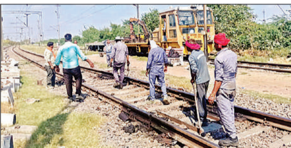
यूटीवी मशीन से अप लाइन पर होता कार्य।