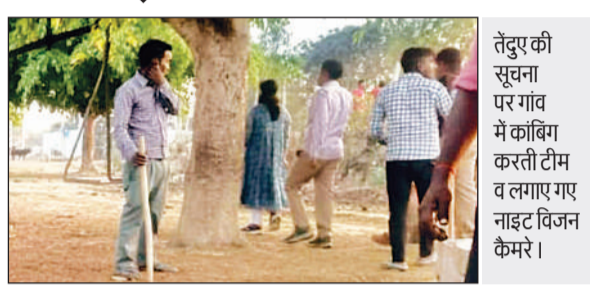
तेंदु की सूचना पर गांव में काबिगा करती टीम व लगाए गए नाइट विज़न कैमरे।