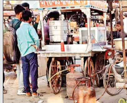
रोड किनारे लगे टैलों पर धरेलु सिलेंडर से बनाई जाती खाद्य सामग्री।

कराने को कहा। तहसील हसनगंज से पहुंचे विभागीय कर्मचारियों ने शिकायतकर्ताओं के बयान लिये।