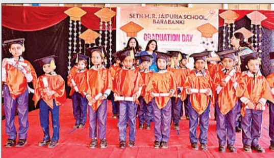
मंच पर मौजूद बच्चे व अतिथि।