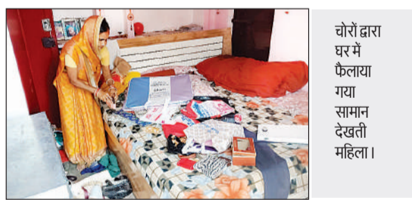
चोरों द्वारा घर में फैलाया गया सामान देखती महिला।