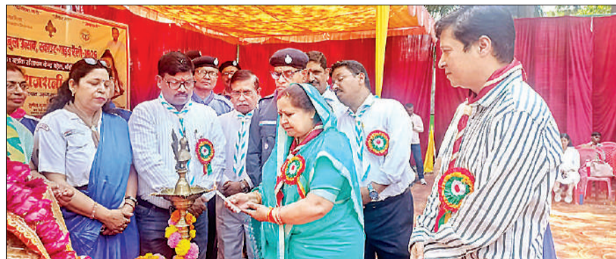
कार्यक्रम का शुभारंभ करती जिला पंचायत अध्यक्ष।

कब-बुलबुल उत्सव के अंतर्गत बच्चे खेल-खेल में सीखने, टीमवर्क और नेतृत्व क्षमता का उत्कृष्ट प्रदर्शन करना सीखते हैं। स्काउट-गाइड रैली में प्रतिभागियों ने परेड, प्राथमिक चिकित्सा, गॉट बांधने की कला तथा विभिन्न प्रतियोगिताओं में अपनी दक्षता