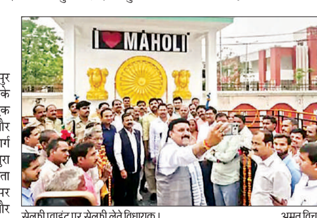
सेल्फी व्हाइट पर सेल्फी लेते विधायक।