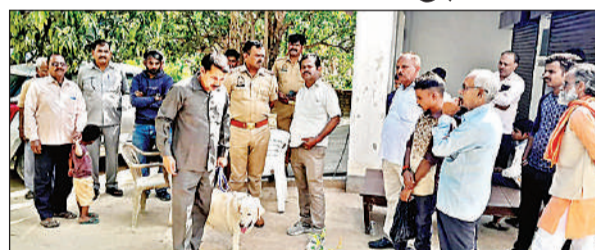
जांच करती पुलिस व डॉंग स्क्वायड टीम।

संवाददाता, बीधापुर उन्नाव, अमृत विचार। बीधापुर कोतवाली क्षेत्र में बीते दो महीनों में हुई आधा दर्जन चोरियों की घटनाओं से क्षेत्र में दहशत का माहौल है। बेखौफ चोरों ने बेहटा भवानी गांव में सोमवार रात दो घरों व ओसियां में एक घर से लाखों का जेवर व हजाराों की नगदी पार कर दी। पीड़ित परिवारों ने थाने में तहरीर दी है। फिंगरप्रिंट टीम व डॉंग स्क्वायड ने मौके की जांच की है।