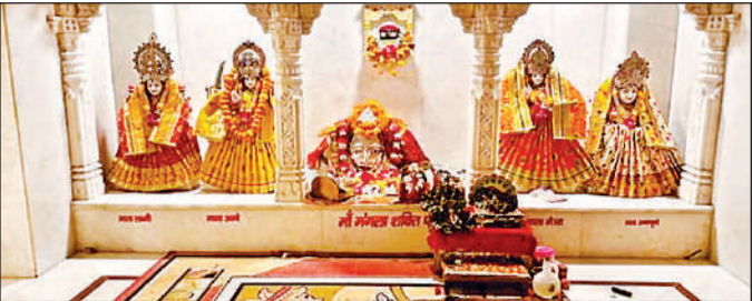
मां मंगला देवी का दरबार।

अमृत विचार। यहां पूरी होती है मनोकामना सांडी कस्बा स्थित मां मंगला देवी मंदिर में जिसने भी सच्चे मन से मनोकामना मांगी वह पूरी हो गई। लोग कहते हैं कि "तेरे दर ना कोई खाली हाथ गया, भर गई झोलियां उसकी जो भी तेरे दर पर आया। कस्बे के बस अड्डे तक आने के लिए परिवहन निगम की बसें व प्राइवेट बसें चल रही हैं तथा बस अड्डे से करीब आधा किलोमीटर दूरी पर स्थित उक्त मंदिर तक जाने के लिए ई रिक्शा बड़ी संख्या में चल रहे हैं। सांडी कस्बे के मां मंगला देवी मंदिर में करीब 500 वर्ष पूर्व कंकड़ों पर बनी देवी जी की मूर्ति की पूजा होने की जन चर्चा है जो कि प्राचीन है इसी मंदिर परिसर में मां