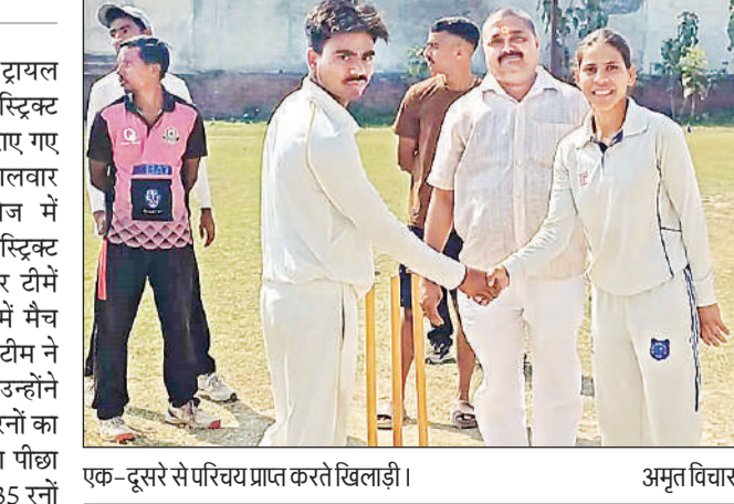
एक-दूसरे से परिचय प्राप्त करते खिलाड़ी।