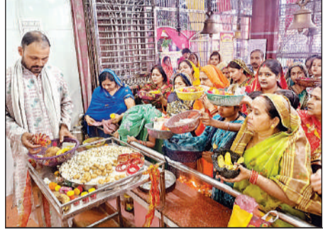
मंदिर में भक्तों को प्रसाद बांटे पुजारी।

बक्सर स्थित मां चंद्रिका देवी धाम गंगा किनारे स्थित मंदिर में दर्शन के लिए जिले के साथ गैर जनपद से भी श्रद्धालु पहुंचे। वहीं, शहर के कल्याणी देवी, दुर्गा मंदिर, पूर्णा देवी मंदिर व सिद्धनाथ मंदिर में भी दिनभर अनुष्ठान चलते रहे। नवाबगंज स्थित मां कुशहरी के दरबार में भक्तों ने नारियल, चुनरी व श्रृंगार का सामान चढ़ाकर परिवार की