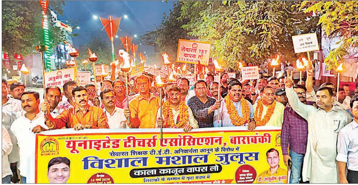
टीईटी अनिवार्यता के विरोध में मशाल जुलूस निकालते शिक्षक।