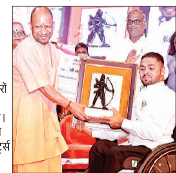
पैरालंपिक खिलाड़ी को लक्ष्मण अवार्ड देते मुख्यमंत्री।

अमृत विचार, लखनऊ: मुख्यमंत्री योगी आदित्यनाथ ने मंगलवार को लोकभवन में अंतरराष्ट्रीय और राष्ट्रीय स्तर के खिलाड़ियों को सम्मानित करते हुए कहा कि हर मेडल के पीछे संघर्ष, अनुशासन और दृढ़ संकल्प की कहानी होती है। जितना परसीना बहेगा, जीत उतनी ही निकट आएगी। खिलाड़ियों को नियुक्ति पत्र, लक्ष्मण एवं रानी लक्ष्मीबाई पुरस्कार और पदक जीतने पर बधाई देते हुए ऐलान किया कि इन दोनों प्रतिष्ठित पुरस्कारों की राशि 3.11 लाख रुपये से बढ़ाकर 10-10 लाख रुपये की जाएगी। इसके लिए उन्होंने खेल विभाग को प्रस्ताव तैयार कर भेजने के निर्देश दिए। मुख्यमंत्री ने बताया कि मेरठ में बन रहे मेजर ध्यानचंद खेल विश्वविद्यालय को प्राथमिकता दी जा रही है। उन्होंने बताया कि प्रदेश में पिछले 9 वर्षों में खिलाड़ियों को 200 करोड़ रुपये से अधिक की प्रोत्साहन राशि दी गई है। ओलंपिक में स्वर्ण पदक जीतने वाले खिलाड़ी को 6 करोड़ रुपये, रजत पदक 4 करोड़ और कांस्य पदक 2 करोड़ रुपये दिए जाते हैं। अब तक 500 से अधिक खिलाड़ियों को सरकारी नौकरी भी दी जा चुकी है। मुख्यमंत्री ने यह भी कहा कि पहले जहां खेल उपेक्षित थे, वहीं अब बेहतर इंफ्रास्ट्रक्चर, पारदर्शी व्यवस्था और प्रोत्साहन के कारण खिलाड़ियों को आगे बढ़ने का अवसर मिल रहा है।