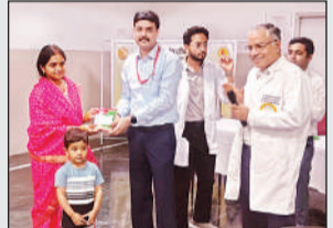
महिला को किट प्रदान करते अधिकारी।