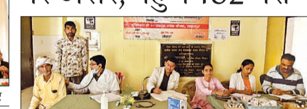
चिकित्सा शिविर में प्राथमिक उपचार करते चिकित्सक। अमृत विचार

संवाददाता, लहरपुर। अमृत विचार : उप स्वास्थ्य केंद्रों पर लगने वाले स्वास्थ्य शिविर में बारिश और प्रतिकूल मौसम के चलते मरीजों की संख्या सामान्य से कम रही। सामुदायिक स्वास्थ्य केंद्र के अंतर्गत आने वाले पांच केंद्रों पर कुल 182 मरीजों ने ही अपना पंजीकरण कराया। केंद्रवार मरीजों की संख्या रही जिसमें बिलरिया