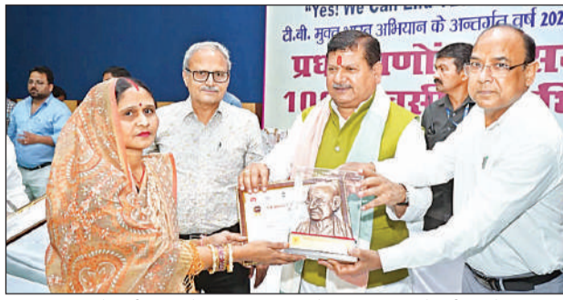
महिला प्रधान को गांधी प्रतिमा देकर सम्मानित करते मुख्य अतिथि और सीएमओ।