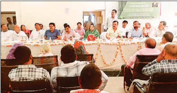
बैठक में मौजूद अधिकारी व अन्य।