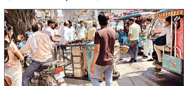
अताउल्ला नाले के पास पलटा ई-रिक्शा को उठाते लोग।

अमृत विचार: शहर के मुख्य मार्ग पर नगर पालिका की लापरवाही सामने आई है। छोटा चौराहा और बड़ा चौराहा के बीच अताउल्ला नाले के पास पाइप लाइन लीकेज होने से हुआ गहरा गड्ढा अब राहगीरों के लिए काल सावित हो रहा है। मंगलवार को इस गड्ढे की वजह से कई ई-रिक्शा पलट गए। जिसमें सवार यात्री चोटहिल हो गए।