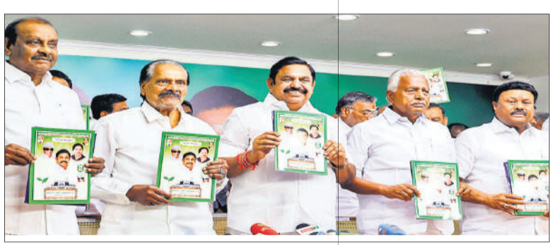
तमिलनाडु में घोषणा पत्र जारी करते अन्नाद्रमुक के नेता।