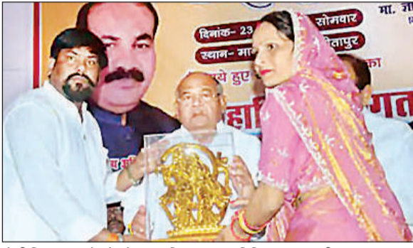
होली मिलन समारोह के दौरान उपस्थित मुख्य अतिथि कारागार मंत्री व अन्य।