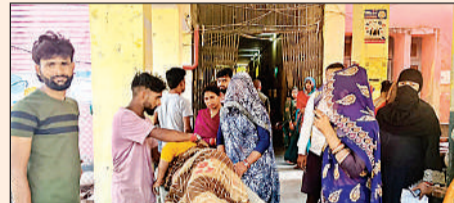
सीएचसी में घायल को लेकर जाते परिजन।