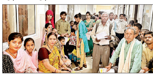
शिविर में मौजूद महिलाएं व पुरुष।

अमृत विचार। मानसिक रोग व बौद्धिक अक्षमताओं से ग्रस्त व्यक्तियों के कानूनी अधिकार व नशीले पदार्थों के दुरुपयोग व उसके बचाव के विषय, पर मंगलवार को विधिक जागरूकता शिविर का आयोजन हुआ। राष्ट्रीय विधिक सेवा प्राधिकरण