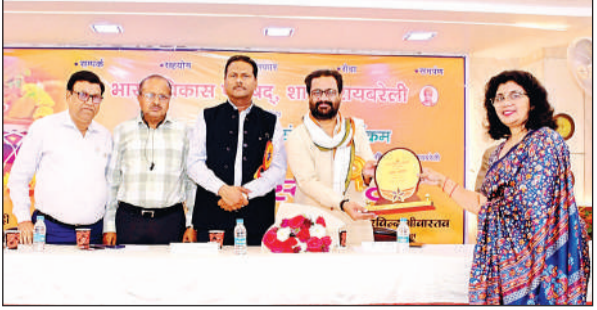
कार्यक्रम में अतिथि का स्वागत करते लोग।

ने समाज कल्याण विभाग की प्रमुख योजनाओं के बारे में जिसमें प्रमुख रूप से संचालित राष्ट्रीय वृद्धा व्यवस्था पेंशन योजना, छात्रवृत्ति एवं शुल्क प्रतिपूर्ति योजना, मुख्यमंत्री सामूहिक विवाह योजना, राष्ट्रीय पारिवारिक लाभ योजना एवं मुख्यमंत्री अभ्युदय कॉमिंग योजना के बारे में विस्तारपूर्वक जानकारी प्रदान की। भाजपा के पूर्व जिलाध्यक्ष