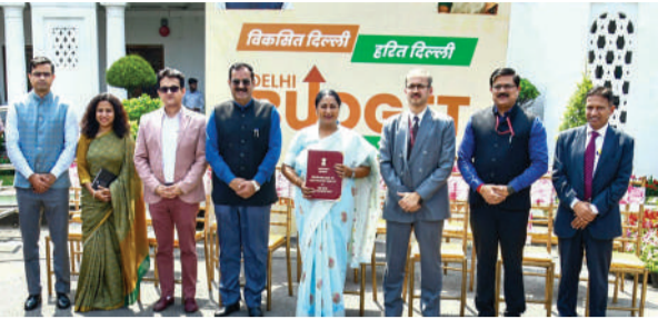
बजट पेश करने से पहले, एक ग्रुप फोटो में दिल्ली की सीएम रेखा गुप्ता (केंद्र में) व अन्य

दिल्ली विधानसभा में दूसरी बार बजट पेश करते हुए वित्त मंत्रालय का प्रभार भी संभाल रही गुप्ता ने इसे 'हरित बजट' करार दिया और बताया कि कुल आवंटन का 21 प्रतिशत पर्यावरण संरक्षण पहल के लिए रखा गया है। उन्होंने दिल्ली की प्रति व्यक्ति आय के देश में तीसरे स्थान पर होने का उल्लेख किया और कहा कि 'ट्रिपल इंजन' सरकार के साथ राष्ट्रीय राजधानी तेजी से प्रगति कर रही है। सरकार ने शिक्षा क्षेत्र के लिए 19,326 करोड़ रुपये का प्रावधान किया है जो कुल बजट का 18 प्रतिशत है। इसके बाद स्वास्थ्य क्षेत्र के लिए 13,034 करोड़ रुपये, परिवहन के लिए 12,613 करोड़