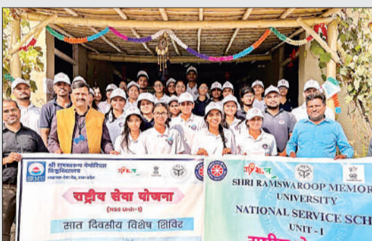
शिविर के समापन अवसर पर प्रतिभागी।