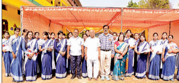
बाबू एलपीएस पब्लिक स्कूल में वार्षिक परीक्षा पत्र वितरण समारोह में मौजूद अतिथिगण और शिक्षिकाएं।