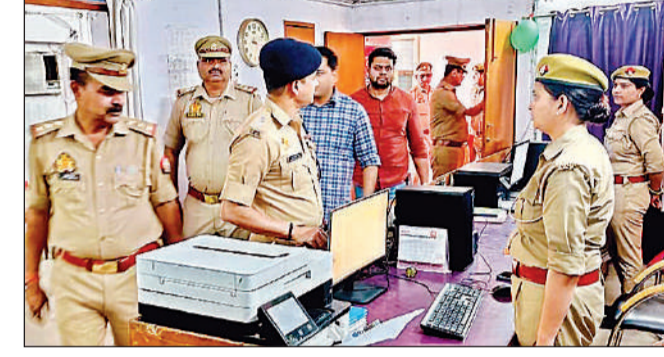
कोतवाली का निरीक्षण करते पुलिस अधीक्षक अशोक कुमार मीणा।

खंड विकास कार्यालय के निरीक्षण के दौरान सीडीओ ने मनरेगा के अंतर्गत आवास लाभार्थियों को 90 दिवस का रोजगार उपलब्ध कराने के लक्ष्य की समीक्षा में प्रगति संतोषजनक न पाए जाने पर अतिरिक्त कार्यक्रम अधिकारी को निर्देशित किया गया कि 31 मार्च तक प्रधानमंत्री आवास योजना एवं मुख्यमंत्री आवास योजना के सभी लाभार्थियों को निर्धारित 90 दिवस का रोजगार उपलब्ध कराया जाए।