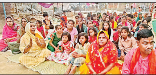
भागवत कथा सुनते श्रद्धालु।