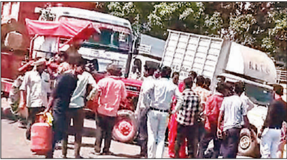
गैस सिलेंडर के लिए हाईवे पर जाम लगाए उपभोक्ता।