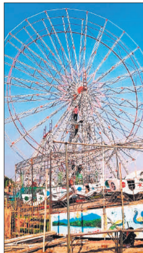
गोला के मेला मैदान में आकाशी झूला की फिटिंग करतें कारीगर।

मेला मैदान में आकाशी झूला, मौत का कुआं, नाव वाला झूला,