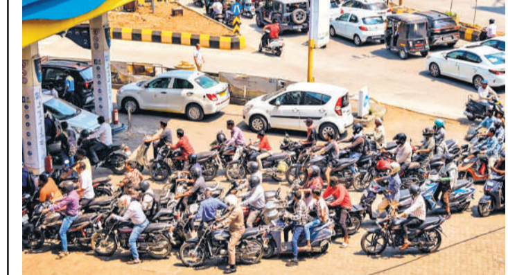
पश्चिम एशिया संघर्ष के मद्देनजर सोशल मीडिया पर ईंधन की कमी की अफवाहों से घबराकर लोहा वहां की टिकियां फुल कराने पहुंच गए। नागपुर में पेट्रोल पंप पर लगी लंबी कतार।