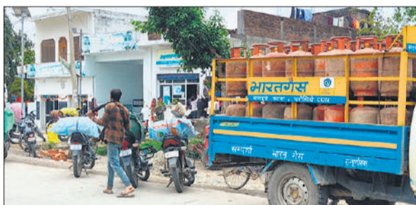
एजेंसी के सामने गाड़ी खड़ी कर सिलेंडर वितरित करते कर्मचारी।

वाहन खड़ा कर वहीं से सिलेंडर वितरण किया जा रहा है, जिससे उपभोक्ताओं को भारी असुविधा हो रही है। बुजुर्गों और महिलाओं को विशेष रूप से परेशानी का सामना करना पड़ रहा है। एजेंसी पर कार्यरत कर्मचारी भी उपभोक्ताओं की समस्याओं के प्रति उदासीन नजर आ रहे हैं। फोन करने पर जवाब नहीं दिया जाता, जिससे लोगों में नाराजगी और बढ़ रही है।