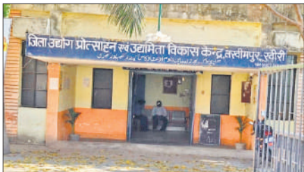
जिला उद्योग प्रोत्साहन एवं उद्यमिता विकास केंद्र भवन।

जिले में रोजगार की स्थापना के लिए प्रदेश सरकार ने योजना के तहत एक हजार युवाओं को