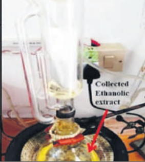
शोध के दौरान इकट्ठा किया गया एक्सट्रैक्ट।