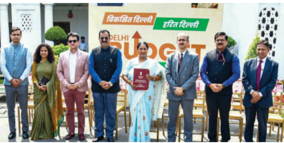
बजट पेश करने से पहले, एक ग्रुप फोटो में दिल्ली की सीएम रेखा गुप्ता (केंद्र में) व अन्य

दिल्ली विधानसभा में दूसरी बार बजट पेश करते हुए वित्त मंत्रालय का प्रभार भी संभाल रही गुप्ता ने इसे 'हरित बजट' करार दिया और बताया कि कुल आवंटन का 21 प्रतिशत पर्यावरण संरक्षण पहल के लिए रखा गया है। उन्होंने दिल्ली की प्रति व्यक्ति आय के देश में तीसरे स्थान पर होने का उल्लेख किया और कहा कि 'ट्रिपल इंजन' सरकार के साथ राष्ट्रीय राजधानी तेजी से प्रगति कर रही है। सरकार ने शिक्षा क्षेत्र के लिए 19,326 करोड़ रुपये का प्रावधान किया है जो कुल बजट का 18 प्रतिशत है। इसके बाद स्वास्थ्य क्षेत्र के लिए 13,034 करोड़ रुपये, परिवहन के लिए 12,613 करोड़