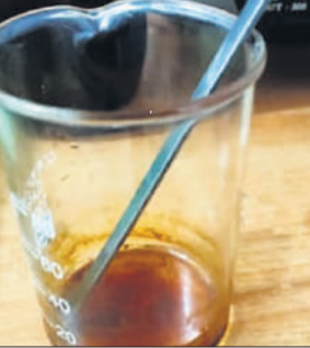
● अमृत विचार

जांच में सामने आया कि इस अर्क में '5-हाइड्रोक्सीमैथिलफुंरुल' नामक तत्व की मात्रा सबसे अधिक (65 प्रतिशत) है, जो कैंसर कोशिकाओं