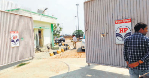
अधिकारियों के आगमन के समय खुला प्लांट का दरवाजा।