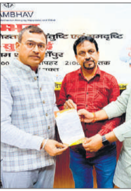
इस कार्रवाई को लेकर पार्षदों और नागरिकों ने नाराजगी जताते हुए इसे दुर्भाग्यपूर्ण और जनभावनाओं को ठेस पहुंचाने वाला बताया है।