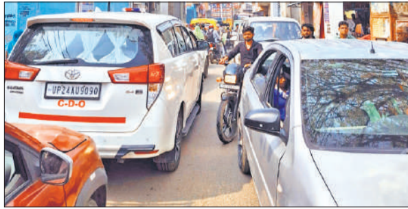
कस्बे में लगा जाम

अमृत विचार: प्रधानों का कार्यकाल समाप्त होने में दो माह का ही समय बचा है। 26 मई को प्रधानों का कार्यकाल समाप्त हो जाएगा। समय पर चुनाव कराने के लिए तैयारी चल रही है। गांवों में पंचायत चुनाव को लेकर माहौल बनना शुरू हो गया है। प्रधानों का कार्यकाल 26 मई को पूरा हो रहा है जिसमें अब कम समय बचा है। संभावित प्रत्याशी चुनाव प्रचार में जुट गए हैं। लोगों से संपर्क बढ़ाना शुरू कर दिया गया है। साथ ही अपने समर्थन में आकलन किया जा रहा है। संभावित प्रत्याशी लोगों के सुख-दुख में शामिल हो रहे हैं। साथ ही, ग्रामीणों को अपना