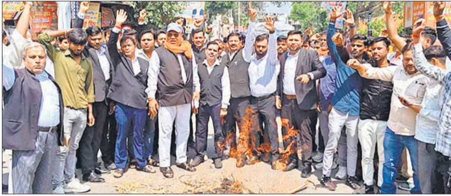
कचहरी के पास निर्माण संस्था का पुतला फूंकते अधिवक्ता।

इस पूरे मामले पर सपा के राष्ट्रीय अध्यक्ष अखिलेश यादव ने भी नाराजगी जताई है। उन्होंने इसे घोर निंदनीय बताया है और कहा कि सौंदर्यकरण के नाम पर शहीदों के सम्मान से खिलवाड़ किया गया है और यह एक गलत मानसिकता को