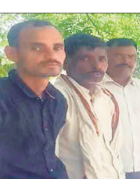
पोस्टमार्टम हाउस पर मृतक के परिजन।

अमृत विचार : बखौरा गांव में एक युवक का शव कमरे में चारपाई पर संदिग्ध परिस्थितियों में मिला है। उसके नाक से खून निकल रहा था। युवक कई साल से बतौर पति के रूप में एक महिला और उसके दो बच्चों के साथ रह रहा था। महिला अपने दो बच्चों के साथ लापता हो गई। मृतक की मां और भाई ने हत्या का आरोप लगाया है।