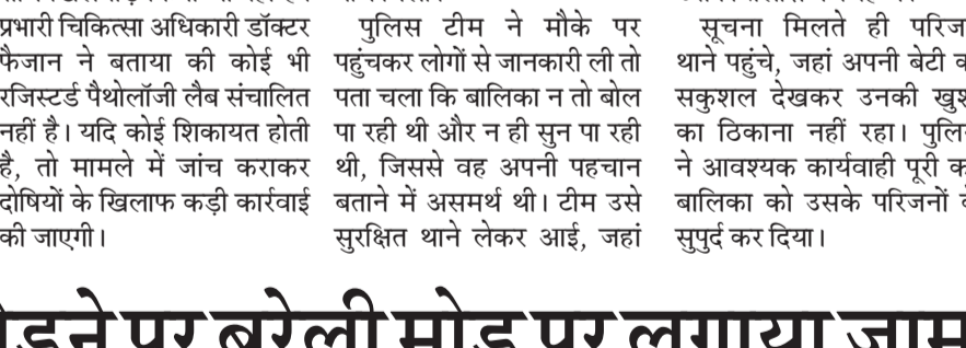
मंगलवार की शाम बरेली मोड़ पर जाम लगाते हिंदू युवा वाहिनी के कार्यकर्ता।

अमृत विचार : बरेली मोड़ के निकट खाटू श्याम मंदिर के सामने शिवलिंग को एक व्यक्ति ने जानबूझकर तोड़ दिया। इस दौरान लोगों में आक्रोश फैल गया और जाम लगा दिया। चौक कोतवाली प्रभारी निरीक्षक मौके पर पहुंचे और रिपोर्ट दर्ज करने का आश्वासन देकर आधे घंटे बाद जाम खुलवाया। बता दें कि बरेली मोड़-कांट रोड पर खाटू श्याम मंदिर के सामने कई साल पुराना शिवलिंग था। लोग शिवलिंग की पूजा करते थे। मंगलवार की शाम को लोगों ने देखा कि किसी ने शिवलिंग तोड़ दी है। इस दौरान क्षेत्र के लोग आक्रोश जताया। इस दौरान लोगों ने स्टेट हाइवे पर जाम लगा दिया। पुलिस चौकी अजीजगंज के दरोगा और सिपाही मौके पर पहुंच गए।