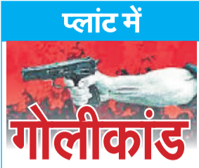
कार्यालय संवाददाता, बदार्थ