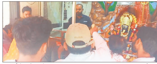
मां काली के दर्शन करते श्रद्धालु

ओरछी, अमृत विचार : एसएसपी के निर्देश के बाद पुलिस अपराध नियंत्रण और लंबित मामलों के त्वरित निस्तारण को एक्शन मोड में है। एसपी देहात डॉ. हर्देश कठेरिया ने थाना फैजगंज बेहटा के कार्यालय का निरीक्षण किया। इस दौरान उन्होंने विवेचनाओं में देरी पर नाराजगी जाहिर करते हुए गुणवत्तापूर्ण निस्तारण के कड़े निर्देश दिए। उन्होंने कहा कि विवेचनाओं के निस्तारण में ढिलाई बर्दाश्त नहीं की जाएगी। अर्दली रूम के निरीक्षण के बाद उन्होंने एक-एक कर सभी लंबित मुकदमों की प्रगति रिपोर्ट जांची। विवेचकों को हदायत दी कि विवेचनाओं का निस्तारण समय सीमा के भीतर किया जाए। समीक्षा बैठक के बाद उन्होंने शांति एवं सुरक्षा व्यवस्था को सुदृढ़ करने के उद्देश्य से पुलिस बल क साथ बाजार में पैदल गश्त की। ड्यूटी पर तैनात पुलिस कर्मियों को संदिग्ध व्यक्तियों और वाहनों पर पैनी नजर रखने के निर्देश दिए।