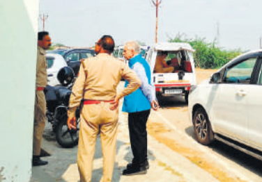
हत्याकांड के बारे में पता करते अधिकारी।

माचों को दिन दहाड़े तीन गोली मारकर दोनों अधिकारियों की हत्या कर दी थी। पुलिस ने तीनों आरोपियों को जेल भेजा था। हत्याकांड से डरे अधिकारी और कर्मचारी प्लांट से वापस अपने घर लौट गए थे। वहीं संस्था ने प्लांट के 85 आउटसोर्सिंग कर्मचारियों को हटा दिया था। कहा गया था कि प्लांट का संचालन