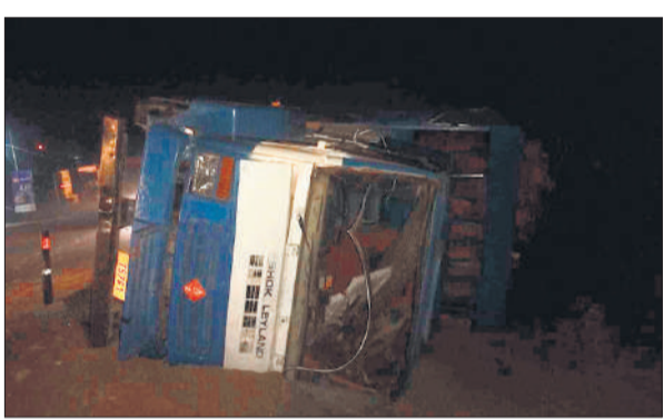
राजमार्ग स्थित गांव घेर के पास पलटा पड़ा ट्रक।

अमृत विचार : बरेली-मथुरा राजमार्ग पर कोतवाली सिविल लाइन क्षेत्र के गांव घर के पास सिलेंडर से भरा ट्रक अनियंत्रित होकर पलट गया जिससे ट्रक चालक घायल हो गया। घायल को अस्पताल में भर्ती कराया गया है। चालक सोमवार देर शाम एलपीजी सिलेंडर भरे ट्रक को लेकर उझानी बरेली की ओर जा रहा था। राजमार्ग पर निर्माण कार्य चलने की वजह से दोनों साइड के वाहन एक ही लेन में आ रहे हैं। ट्रक चालक के सामने दूसरे वाहन की तेज रोशनी आई। चालक ने ट्रक को बचाने का प्रयास किया तो एक साइड राजमार्ग किनारे चल गई और ट्रक पलट गया। ट्रक चालक मूसाझाग थाना क्षेत्र के गांव