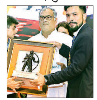
लक्ष्मण पुरस्कार लेता खिलाड़ी।

खिलाड़ियों को नियुक्ति पत्र, लक्ष्मण एवं रानी लक्ष्मीबाई पुरस्कार और पदक जीतने पर बधाई देते हुए ऐलान किया कि इन दोनों प्रतिष्ठित पुरस्कारों की राशि 3.11 लाख रुपये से बढ़ाकर 10-10 लाख रुपये की जाएगी। इसके लिए उन्होंने खेल विभाग को प्रस्ताव