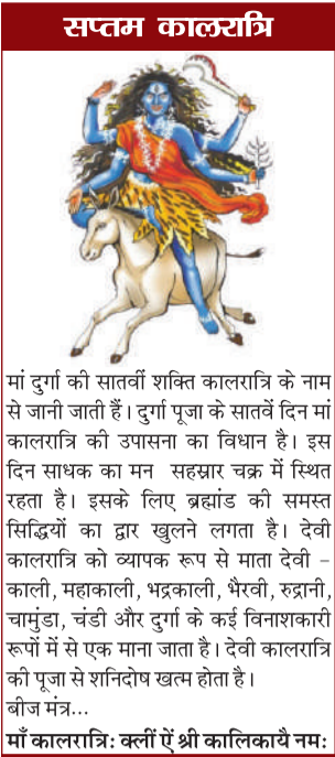
मां दुर्गा को सातवें शक्ति कालरात्रि के नाम से जानी जाती है। दुर्गा पूजा के सातवें दिन मां कालरात्रि की उपासना का विधान है। इस दिन साधक का मन सहस्रार चक्र में स्थित रहता है। इसके लिए ब्रह्मांड को समस्त सिद्धियों का द्वार खुलने लगता है। देवी कालरात्रि को व्यापक रूप से माता देवी - काली, महाकाली, भद्रकाली, धैरवी, रुद्राणी, चामुंडा, चंडी और दुर्गा के कई विनाशकारी रूपों में से एक माना जाता है। देवी कालरात्रि की पूजा से शनिदोष खत्म होता है।