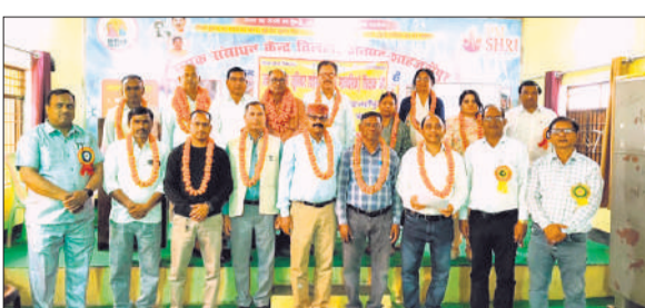
तिलहर में शिक्षक संघ के निर्वाचन के बाद नवनिर्वाचित पदाधिकारियों के साथ शिक्षक कार्यालय संवाददाता, शाहजहांपुर