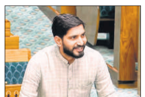
लोकसभा में सांसद आदित्य यादव।

बदायूं, अमृत विचार : रेल सेवा को स्वीकृति मिलने पर सांसद आदित्य यादव ने हर्ष व्यक्त किया है। उन्होंने बताया कि लंबे समय से लंबित इस महत्वपूर्ण मांग को उन्होंने लोकसभा में उठाया था। जिस पर रेल मंत्रालय ने सकारात्मक रुख अपनाते हुए रेल सेवा शुरू करने का निर्णय लिया है। यह रेल सेवा बदायूं ही नहीं बल्कि आस-पास के लाखों लोगों को राहत देगी। उन्होंने बताया कि लोगों को बस या अन्य वाहन का सहारा लेना पड़ता था। फिर बरेली जाकर ट्रेन पकड़नी पड़ती थी जिसमें समय और रुपये की बर्बादी होती थी। उन्होंने लोकसभा में कहा था कि बदायूं बड़ा जिला है। जहां से रोज लोग शिक्षा, रोजगार, चिकित्सा और व्यापारिक कार्यों के लिए दिल्ली जाते हैं। सीधी रेल सेवा न होने से असुविधा होती है। उन्होंने सरकार से बदायूं को दिल्ली से जोड़ने के लिए जल्द रेल सेवा शुरू करने की मांग उठाई थी। अब इसका संचालन शुरू होने पर व्यापारी दिल्ली के बाजार तक आसानी से पहुंचेंगे। उच्च शिक्षा संस्थानों तक पहुंच में सुविधा होगी। स्थानीय रोजगार में वृद्धि होगी। यह निर्णय परिवहन ही नहीं बल्कि क्षेत्र में विकास और प्रगति के दरवाजे खोलने वाला है।