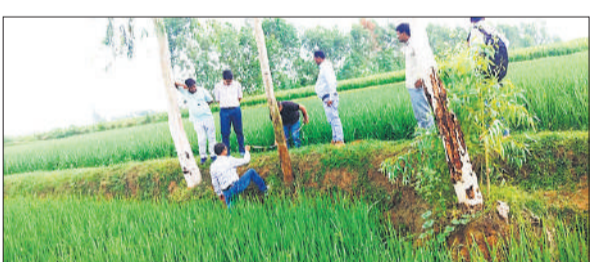
खेत की टियाबंदी करते भूमि संरक्षण अधिकारी।