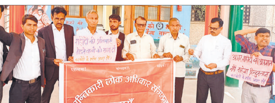
विरोध प्रदर्शन करते जनहित सत्याग्रह मोर्चा के पदाधिकारी और कार्यकर्ता ● अमृत विचार

कार्यालय संवाददाता, बदार्थ डीएम को ज्ञापन सौंपा। वक्ताओं ने कहा कि हमारे देश के महान क्रांतिकारियों के संघर्षों और बलिदानों के कारण ही देश आजाद हो पाया था लेकिन दुःख है कि हमारी इस क्रांतिकारी विरासत को कुत्सित इरादों से मिटाने की कोशिश की जा रही है। लेकिन आज की फासीवादी ताकतें भूल जाती हैं कि क्रांतिकारियों की विरासत और उनके सपनों को आगे बढ़ाने के लिए देश में लोग