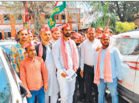
कलेक्ट्रेट में विरोध जताते सपा युवा वाहिनी के पदाधिकारी।