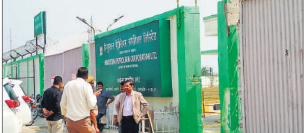
प्लांट के गेट पर सुरक्षा व्यवस्था की जानकारी करते अधिकारी।