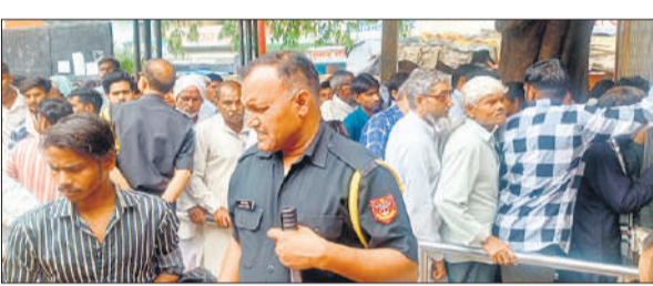
हंगामा कर रहे मरीजों को शांत कराते सुरक्षा गाड़ ● अमृत विचार

अमृत विचार : जिला अस्पताल में पर्चा बनवाने को लाइन में लगे मरीज देरी होने पर हंगामा करने लगे, जिसके बाद सुरक्षा गाड़ों ने मरीजों को किसी तरह शांत कराया। पर्चा बनाने के नियम बदल जाने के बाद से हर दिन हंगामा देखने को मिल रहा है। आधार कार्ड और मोबाइल नं.न होने पर मरीजों के पर्चे नहीं बनाए जाते हैं जिससे दर्जनों मरीज हर दिन वापस लौटते हैं। शासन स्तर से जारी निर्देशों के बाद से जिला अस्पताल में अब ऑनलाइन पर्चे बनाए जा रहे हैं। ऑनलाइन पर्चे बनवाने में मरीजों को अपना आधार कार्ड और मोबाइल नंबर देना जरूरी होता है। ऑनलाइन पर्चे बनाने की प्रक्रिया में काफी समय लगता है जिससे मरीजों को परेशानी होती है। मंगलवार को पूर्वाह्न 11 बजे सौ से अधिक मरीज पर्चा बनवाने