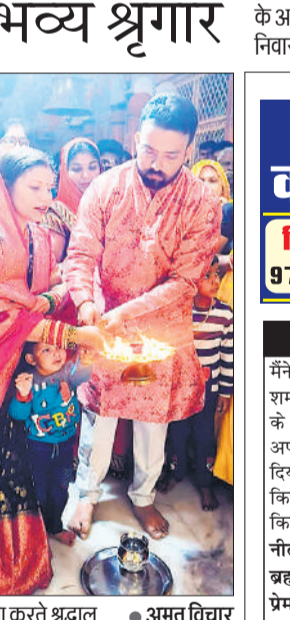
पूजा करते श्रद्धालु ● अमृत विचार

अमृत विचार : नगर के मुख्य बाजार स्थित शिव शक्ति भवन मंदिर में सोमवार की रात भक्तों ने नवरात्र के उपलक्ष्य में मां काली के स्वरूप में महाकाल का अद्भुत श्रृंगार किया। बाबा के दर्शन के लिए यहां देर रात तक भक्तों का तांता लगा रहा। इससे पहले यहां भक्तों ने रुद्राभिषेक कर विभिन्न धार्मिक अनुष्ठान किए। बाबा का श्रृंगार प्रत्येक सोमवार को बदल-बदल कर स्वरूप में किया जाता है। बाद में यहां बाबा की आरती कर प्रसाद का वितरण किया गया। मंदिर समिति के जरिये महाकाल का श्रृंगार करने वाले परिवार के सदस्यों को पटक पहनकर सम्मानित किया गया। इधर नगर के मुख्य बाजार