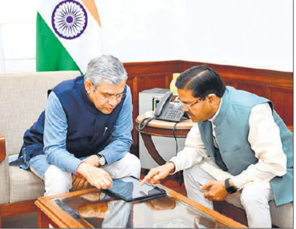
केंद्रीय रेल मंत्री अश्विनी वैष्णव से मुलाकात करते केंद्रीय राज्यमंत्री बीएल वर्मा।

अमृत विचार : बदायूं से दिल्ली तक ट्रेन के संचालन की कई साल पुरानी मुराद अब पूरी होने जा रही है। रेलवे ने ट्रेन के संचालन पर मुहर लगा दी है। केंद्रीय राज्यमंत्री बीएल वर्मा ने केंद्रीय रेल मंत्री अश्विनी वैष्णव से मुलाकात की। रेल मंत्री ने बरेली से नई दिल्ली जाने वाली ट्रेन का विस्तार किये जाने की जानकारी दी। अब यह ट्रेन कासगंज से संचालित की जाएगी। व्यापारियों से लेकर हर वर्ग कई साल से दिल्ली के लिए ट्रेन के संचालन की मांग करता आया है। जनप्रतिनिधियों की कार्रवाई आश्वासन तक ही सीमित रही थी। लगातार मांग के चलते केंद्रीय