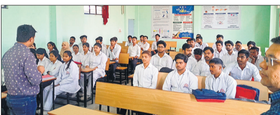
विश्व टीबी रोग दिवस के अवसर जागरूकता कार्यक्रम में मौजूद छात्र।