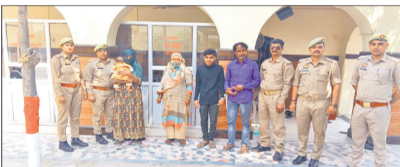
किला पुलिस की गिरफ्त में देह व्यापार के आरोपी।