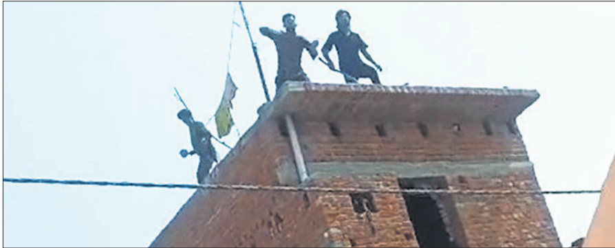
सरनिया गांव में पथराव का वीडियो वायरल।

स्थानीय लोगों ने पुलिस को बताया कि सरनिया गांव के एक युवक और युवती के बीच काफी समय से प्रेम प्रसंग चल रहा था। इसका पता युवक-युवती दोनों