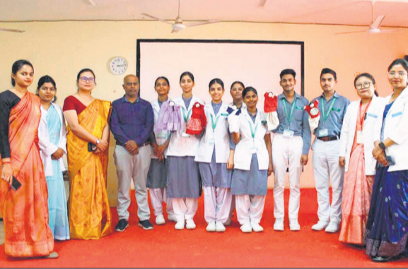
क्षय दिवस पर हुए जागरूकता कार्यक्रम में उपस्थित डॉक्टर एवं छात्र।