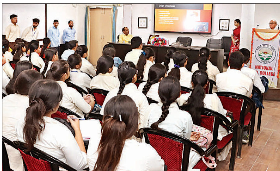
नेशनल पीजी कॉलेज में आयोजित कार्यक्रम में इतिहास के विद्यार्थी।