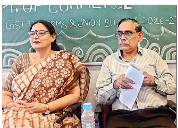
प्रश्नोत्तरी कार्यक्रम में उपस्थित विशेषज्ञ।