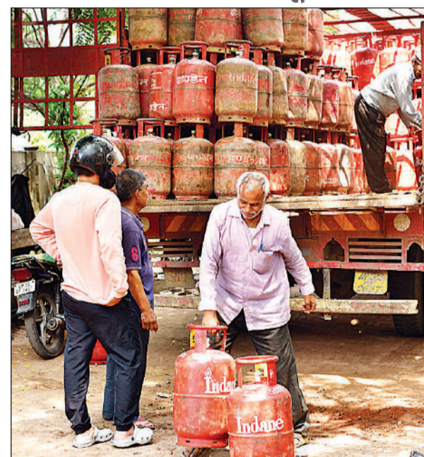
घरेलू गैस सिलेंडर मिलने के बाद वृद्ध के चेहरे पर झलकती खुशी।