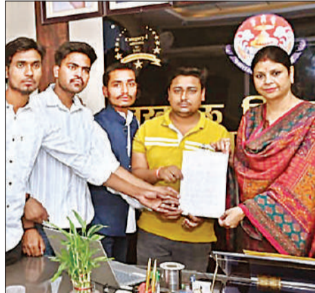
कुलसचिव को ज्ञापन सौंपते छात्र।