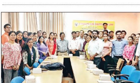
शोध कार्यशाला में उपस्थित प्रतिभागी।