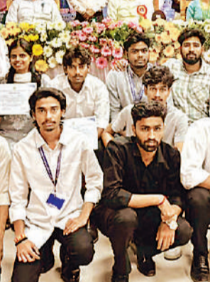
विश्व जल दिवस पर संगोष्ठी में उपस्थित प्रतिभागी।