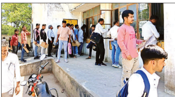
एआरटीओ कार्यालय में बाबू के काउंटर पर लगी काम से आये लोगों की कतार।

एआरटीओ कार्यालय कहीं का भी हो दलालों का वर्चस्व रहता है। लोग भी जल्दी काम कराने के लिए इनका सहाय लेते और चढ़ावा चढ़ा देते हैं। इससे कन्नौज का कार्यालय भी अछूता नहीं। इसी तरह की शिकायतें जिलाधिकारी आशुतोष मोहन अग्निहोत्री के अलावा शासन तक भी पहुंची। इसके बाद जिलाधिकारी ने मंगलवार को एसडीएम, सीओ व अन्य अधिकारियों की टीम भेजकर एआरटीओ कार्यालय में छापे की कार्रवाई कराई थी। इस दौरान भगदड़ तो मची पर दूसरे दिन छापे