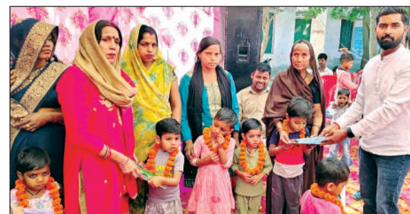
नवारंभ उत्सव के दौरान बाल वाटिका प्राथमिक विद्यालय जयसिंहपुरवा के बच्चे।