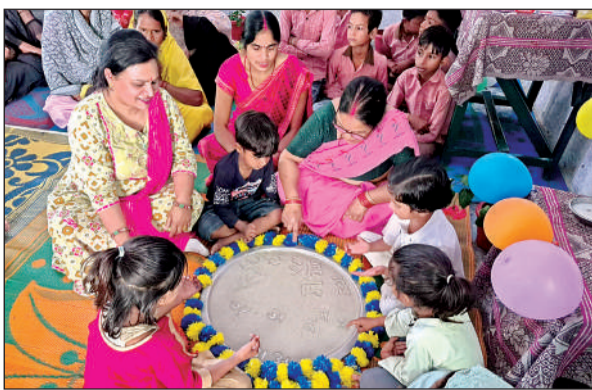
प्राथमिक विद्यालय रिजगिर के कोलोकेटेड आंगनवाड़ी केंद्र में नवारंभ उत्सव में रेत पर लिखते बच्चे।