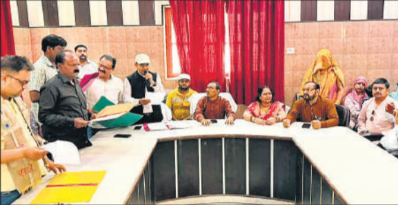
नामित सदस्यों को शपथ दिलाते एसडीएम