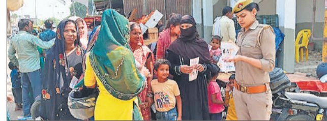
महिलाओं को जागरूक करती थाना पुलिस

पर विस्तार से जानकारी दी। उन्होंने बताया कि किसी भी आपात स्थिति में हेल्पलाइन नंबर 1090, 112, 181, 1076, 1098 और 1930 का उपयोग कर तत्काल सहायता प्राप्त की जा सकती है। साथ ही, छात्राओं को साइबर अपराध, छेड़छाड़, धरलू हिंसा और अन्य अपराधों के प्रति सतर्क रहने के लिए भी जागरूक किया गया।