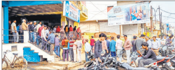
गैस एजेंसी के बाहर लगी उपभोक्ताओं की लाइन

बुधवार को शहर के इंदिरा चौक और गांधी ग्राउंड स्थित भारत गैस एजेंसियों के ऑफिस के बाहर लोगों की लंबी लाइन दिखाई दी। गांधी