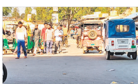
तिलहर बाईपास चौराहे पर सड़क पर खड़े टेंपो से लगा जाम। ● अमृत विचार

जाम लगने पर जब राहगीर इसका विरोध करते हैं तो चालक व वहां मौजूद दबंग झगड़ा करने पर उतारू हो जाते हैं। कई बार गाली-गलौज व मारपीट की