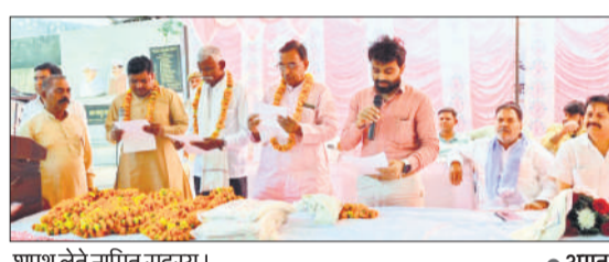
शपथ लेते नामित सदस्य।