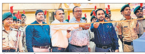
रोजगार मेला का फीता काटकर उद्घाटन करते कॉलेज प्राचार्य