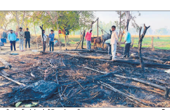
जली झोपड़ी को देखते पीड़ित और ग्रामीण