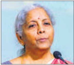
● वित्तमंत्री निर्मला सीतारमण ने वित्त विधेयक पर दिया चर्चा का जवाब

वित्त मंत्री निर्मला सीतारमण ने बुधवार को विपक्ष पर निशाना साधते हुए कहा कि नरेन्द्र मोदी सरकार से पहले मजबूरी के चलते आर्थिक सुधार किए जाते थे, लेकिन अब संकल्प और प्रतिबद्धता के साथ यह किया जा रहा है तथा देश रिफॉर्म एक्सप्रेस पर सवार होकर निरंतर आगे बढ़ रहा है। उन्होंने वित्त विधेयक, 2026 पर सदन में हुई चर्चा का जवाब देते हुए यह भी कि देश को विकसित बनाने और 140 करोड़ भारतीय नागरिकों की अकांक्षाओं को पूरा करने के लिए कदम उठाए जा रहे हैं। मंत्री के जवाब के बाद सदन ने विपक्षी सदस्यों के संशोधनों को खारिज करते हुए विधेयक को ध्वनित से स्वीकृति प्रदान की। सीतारमण ने कहा कि पहले की तरह मजबूरी में सुधार नहीं किए जा रहे हैं, बल्कि संकल्प और प्रतिबद्धता के साथ सुधार किए जा रहे हैं। उन्होंने इस बात पर जोर दिया कि देश रिफॉर्म एक्सप्रेस पर सवार होकर निरंतर आगे बढ़ रहा है। उनका कहना था कि विश्वस्य आधारित कर व्यवस्था बनाने पर काम किया