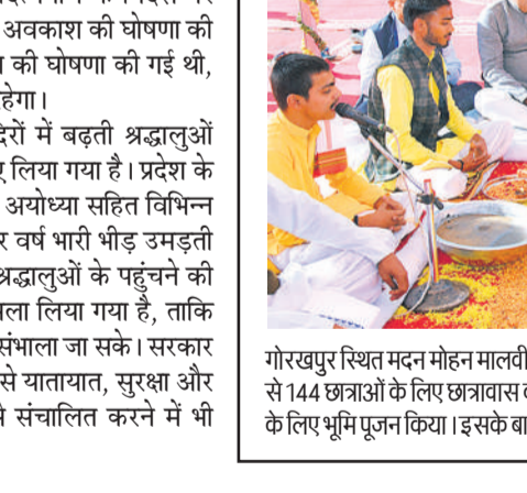
गोरखपुर स्थित मदन मोहन मालवीय प्रौद्योगिकी विश्वविद्यालय में पावर ग्रिड कॉर्पोरेशन ऑफ इंडिया के सीएसआर फंड से 144 छात्राओं के लिए छात्रावास का निर्माण होगा।

नवरात्र के शुभ दिनों के बीच बुधवार को मुख्यमंत्री योगी ने इसके लिए भूमि पूजन किया। इसके बाद यहां शिलान्यास भी किया गया।