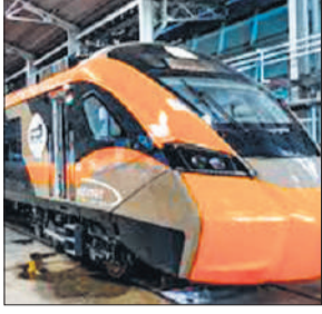
● पटना-टाटानगर वंदे भारत एक्सप्रेस में खराब खाना देने की यात्री की शिकायत पर कार्रवाई

रेलवे ने बुधवार को यहां बताया कि भारतीय रेलवे ने यात्रियों की सुरक्षा को ध्यान में रखते हुए ने अपनी ही आईआरसीटीसी पर शिकंजा कसते हुए 10 लाख का जुर्माना ठोका है। यह कार्रवाई 15 मार्च को ट्रेन संख्या 21896 पटना - टाटानगर वंदे भारत एक्सप्रेस में पाई गई अनियमितता को लेकर की गई है। रेलवे ने यात्री द्वारा भोजन की गुणवत्ता को लेकर की गई शिकायत को गंभीरता से लिया गया और आईआरसीटीसी पर 10 लाख रुपये का जुर्माना लगाया है। इसके साथ ही संबंधित सेवा प्रदाता