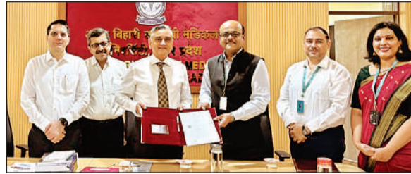
अटल बिहारी वाजपेई मेडिकल यूनिवर्सिटी में जपाइगो इंडिया संस्था से हुए करार के दस्तावेज के साथ अधिकारी।