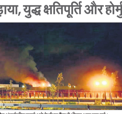
ईरान के झोले हमले के बाद कुवैत अंतर्राष्ट्रीय हवाई अड्डे के ईंधन टैंक में भीषण आग लग गई।