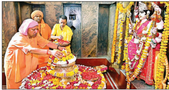
देवीपाटन धाम में मां पाटेश्वरी की पूजा करते सीएम योगी आदित्यनाथ।

अमृत विचार: जनपद पहुंचे मुख्यमंत्री योगी आदित्यनाथ ने 136 परिवारों को आवास, शौचालय व भूमि के पट्टों का वितरण किया। इस दौरान उन्होंने विपक्ष पर हमला बोला। बुधवार को मिर्हीपुरवा के सेमरहना ग्राम में उन्होंने कहा महर्षि बालार्क की पावन साधनास्थली, महाराज सुहेलदेव के शौर्य पराक्रम की धरा है। आज से 1 हजार वर्ष पहले जिस धरती पर महाराज सुहेलदेव ने अपने शौर्य और पराक्रम के तेज से विधर्मियों और विदेशी आक्रांताओं को नेस्तनाबूद कर, भारत की सनातन ध्वजपताका को जीवंत बनाये रखने के लिए अप्रतिम शौर्य और तेज का परिचय दिया था, आज 1 हजार वर्ष बाद भी उनका शौर्य पराक्रम हम सबको प्रेरणा दे रहा है। उन्होंने विश्वी दलों पर हमला