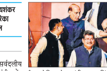
बैठक से निकलते रक्षामंत्री राजनाथ सिंह।

रक्षामंत्री राजनाथ सिंह की अध्यक्षता में पश्चिम एशिया संकट पर चर्चा के लिए संसद परिसर में बुलाई गई बैठक में विपक्ष ने केंद्र की भूमिका पर सवाल उठाए। सूत्रों के अनुसार, सरकार ने विपक्ष के इस आरोप का खंडन किया कि भारत सरकार इस मामले पर चुप है। कहा, हम टिप्पणी कर रहे हैं और जवाब दे रहे हैं। विपक्ष का आरोप है कि सरकार ने ईरान के सर्वोच्च नेता अयातुल्ला अली खामेनेई के मारे जाने