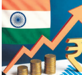
● एजेंसी ने 2025-26 के वृद्धि अनुमान को 0.4 प्रतिशत अंक बढ़ाकर 7.6 प्रतिशत

एशिया-प्राशांत क्षेत्र पर अपनी नवीनतम त्रैमासिक आर्थिक टिप्पणी में एसएंडपी ने कहा कि नए भू-राजनीतिक तनाव और लगातार बने व्यापार संबंधी अनिश्चितता के जोखिम से भारत पर वस्तु कीमतों, व्यापार मात्रा एवं पूंजी प्रवाह में उतार-चढ़ाव के माध्यम से असर पड़ सकता है। इसमें कहा गया कि यदि कच्चे तेल की कीमतें ऊंची बनी रहती हैं तो भारत में ईंधन की कीमतें बढ़ सकती हैं, ताकि सख्खिडी लागत को नियंत्रित किया जा सके। हालांकि कीमतों का पूरा असर उपभोक्ताओं तक पहुंचने के आसार नहीं हैं। एसएंडपी ने कहा कि हमारा अनुमान है कि 31 मार्च 2027 को समाप्त