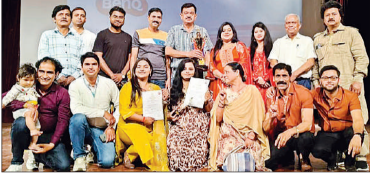
नाट्य मंचन कर पुरस्कार जीतने वाली पूर्वोत्तर रेलवे की टीम।