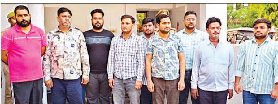
एसटीएफ की गिरफ्त में परीक्षा में नकल कराने के आरोपी गिरोह के सदस्य।