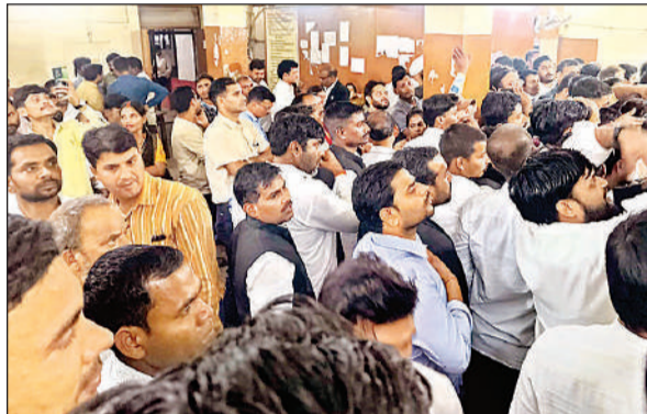
मोहनलालगंज तहसील में रजिस्ट्री के लिए लगी भीड़।

मोहनलालगंज तहसील में कई महीने से सर्वर की समस्या आ रही है। इससे रजिस्ट्री कराने वालों को सुबह से देर रात तक रुकना पड़ता था। सर्वर ठीक कराने के लिए करीब चार दिन रजिस्ट्री बंद कर दी गई। अब तो समस्या पहले से अधिक बढ़ गई है। मंगलवार दिन में सर्वर लगभग ठप रहा। शाम को काम शुरू हुआ और रात लगभग