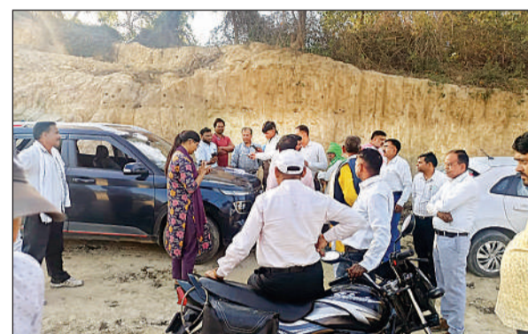
नाले की पैमाइश के दौरान मौजूद अधिकारी और अन्य लोग।

गाटा संख्या 1368 की तीन बीघा बंजर भूमि नाला प्राकृतिक नाला बना था। इसे रियल एस्टेट कंपनियों ने पाटकर पांच फीट का कर दिया। विवाद होने पर राष्ट्रीय किसान मजदूर संगठन के पदाधिकारियों ने उप जिलाधिकारी से शिकायत की थी। उनका कहना था कि इस