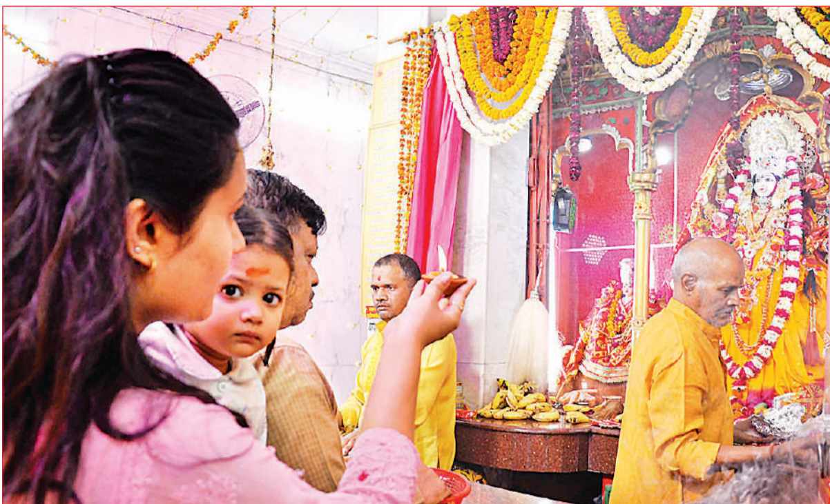
शहर के अष्टभुजा दुर्गा मंदिर में देवी की मूर्ति की आरती करती महिला।