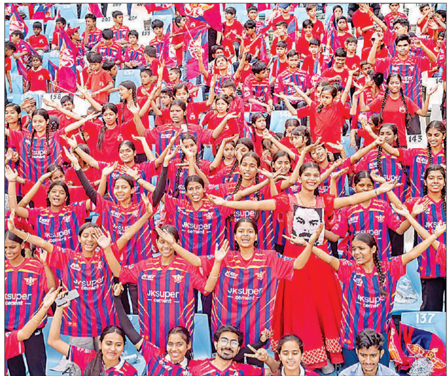
इकाना क्रिकेट स्टेडियम में आयोजित एलएसजी नेक्स्ट-जेन डे कार्यक्रम में नई टी शर्ट में स्कूली बच्चे। अमृत विचार

चरण के कार्यक्रम की भी घोषणा की गई है, जिसमें लखनऊ को कुल सात मैचों की मेजबानी मिली है। पहले चरण में दो मुकाबले पहले ही घोषित किए जा चुके हैं।