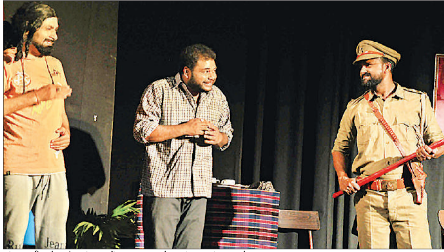
अंतरराष्ट्रीय बौद्ध शोध संस्थान में हास्य नाटक गोरखधंधा का मंचन करते कलाकार।