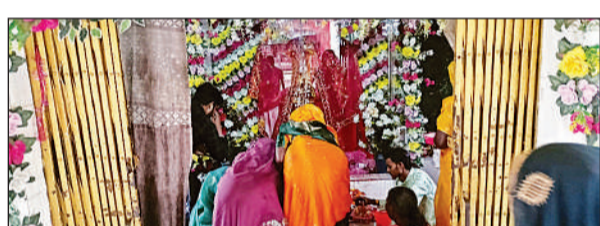
मां बाराही देवी में दर्शन करते भक्त।

उधर, राम नवमी पर शुक्रवार को धार्मिक भगवा यात्रा शोभायात्रा निकाली जाएगी। अलीगंज के कपूरथला चौराहे पर शाम 4 बजे से शोभायात्रा की शुरुआत होगी। शहर के विभिन्न मार्गों से होकर शाम सात बजे शोभायात्रा खाटू श्याम मंदिर पर संपन्न होगी। इस बीच पड़ने वाले तिराहों और चौराहों व अन्य जगह शोभायात्रा का स्वागत किया जाएगा।