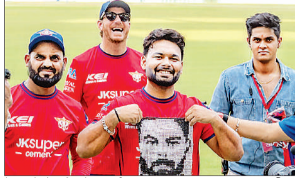
नेक्स्ट-जेन डे कार्यक्रम में एलएसजी कप्तान ऋषभ पंत।

कार्यक्रम में पांच हजार से अधिक छात्र-छात्राएं एलएसजी की नई टी शर्ट पहनकर पहुंचे थे। लाइव म्यूजिक और जोश से भरे माहौल के बीच बच्चों ने अपने पसंदीदा खिलाड़ियों का उत्साह