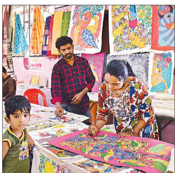
माधव सभागार में स्टाल पर कपड़े पर हाथ से नक्काशी करती युवती।