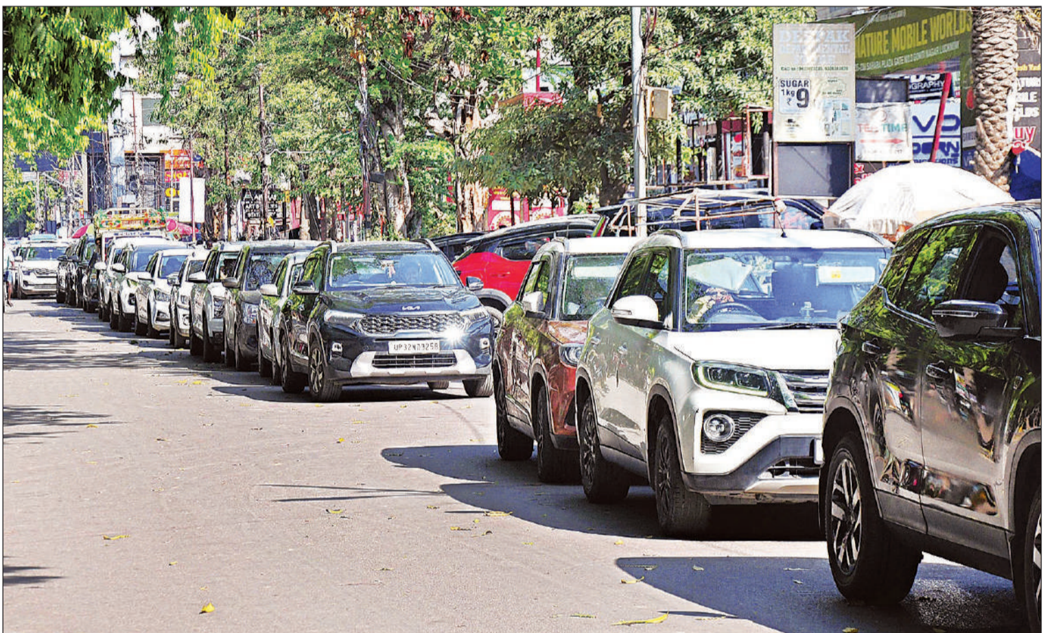
गोमती नगर में पत्रकारपुरम चौराहे के पास स्थित इंडियन ऑयल के पेट्रोल पंप पर पेट्रोल और डीजल भरवाने के लिए लगी कारों की लाइन।