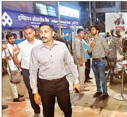
भीमराव अंबेडकर मार्ग पर पेट्रोल पंप का निरीक्षण करते जिलाधिकारी।