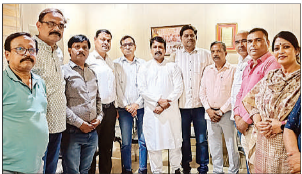
बैठक के दौरान मौजूद शिक्षक।

अमृत विचार: टीईटी अनिवार्यता के खिलाफ आंदोलनरत शिक्षक अब मशाल जुलूस निकालने की तैयारी कर रहे हैं जिसके लिए बैठक आयोजित कर रणनीति बनाई गई। शिक्षकों की मांग है कि शिक्षा का अधिकार अधिनियम-2009 से पूर्व सेवारत शिक्षकों को टीईटी अनिवार्यता से छूट प्रदान की जाए। राजभवन गेट के सामने डिप्लोमा इंजीनियर्स कार्यालय पर बैठक में उपस्थित अखिल भारतीय संयुक्त शिक्षक महासंघ के समस्त घटक