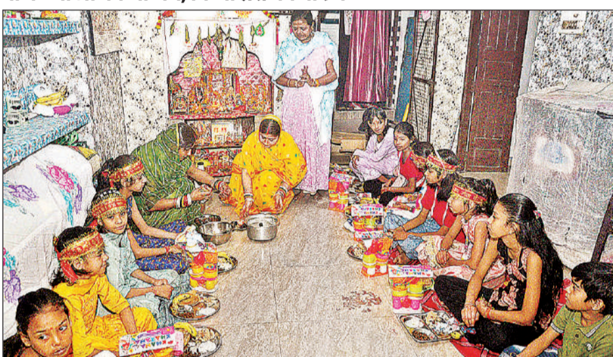
नवरात्र की अष्टमी को आलमबाग के एक घर में कन्याओं को भोजन कराती महिलाएं।