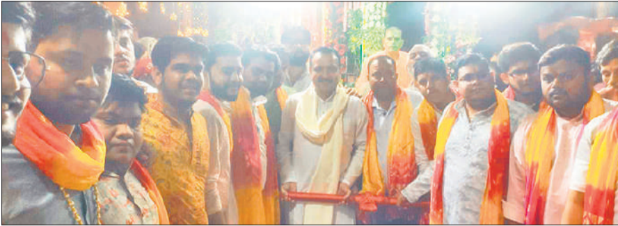
माता रानी का रथ खींचते श्रद्धालु।