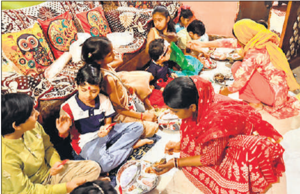
अष्टमी पर कन्या पूजन करती महिलाएं।

माता सिद्धिदात्री की पूजा के साथ आज होगा चैत्र नवरात्र व्रतों का परायण, मंदिरों में पूरे दिन रही भीड़