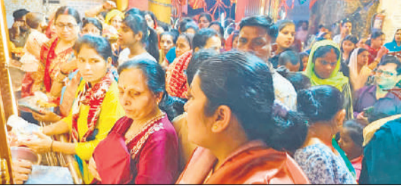
संभल के चामुंडा मंदिर में देवी पूजन करती महिलाएं। ● अमृत विचार

झांकियों में देवी-देवताओं के विभिन्न स्वरूपों के साथ-साथ पौराणिक प्रसंगों का सुंदर चित्रण किया गया,