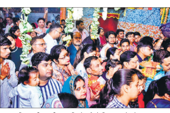
लालबाग स्थित प्राचीन काली माता मंदिर में दर्शन के लिए लाइन में लगे श्रद्धालु।

मंदिरों में भी दिनभर भीड़ बनी रही। सुबह से पूजन, दुर्गा सप्तशती पाठ और हवन-यज्ञ का क्रम शुरू हुआ जो देर शाम तक चलता रहा। शाम को आरती के समय मंदिरों में भीड़ उमड़ी। इसके अलावा जो श्रद्धालु नवमी को कन्या पूजन करते हैं, उन्होंने अष्टमी का त्रत रखा और दिनभर फलाहार कर मां का स्मरण किया। ऐसे श्रद्धालु शुक्रवार को कन्या भोज कर त्रत का समापन करेंगे।