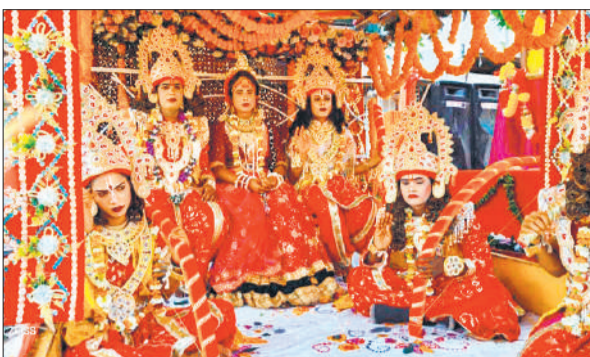
शोभायात्रा में श्रीराम, माता सीता, लक्ष्मण और हनुमान की झांकी।