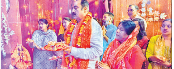
मंदिर में मां महागौरी की आरती करते भक्त।

अमृत विचार : जिले भर के मंदिरों में चैत्र नवरात्र पर गुरुवार को आठवीं देवी महागौरी का श्रृंगार कर पूजा अर्चना कर कन्याओं को जिमाया गया। यज्ञ हवन में आहुति देकर जन कल्याण के लिए प्रार्थना की गई।