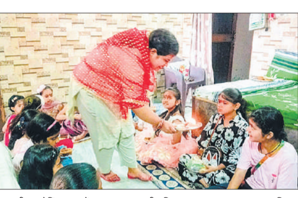
अष्टमी पर गोविंद नगर में कन्या पूजन करती महिला।

अमृत विचार : चैत्र नवरात्र की अष्टमी पर गुरुवार को मां महागौरी की आराधना भक्ति भाव से की गई। मंदिरों में पूजा अर्चना के दौरान माता रानी का जयकारा गूंजा रहा। घरों में सजी चौकियों पर दीपक की लौ और अगरबत्ती के बीच मां का पूजन कर सुख-शांति की कामना की गई। कन्याओं को आदरपूर्वक घर बुलाकर उनका पूजन कर भोजन कराया, तिलक लगाकर चरण स्पर्श कर आशीर्वाद लिया। छोटी-छोटी कन्याएं समूह बनाकर एक घर से दूसरे घर जाती नजर आईं।