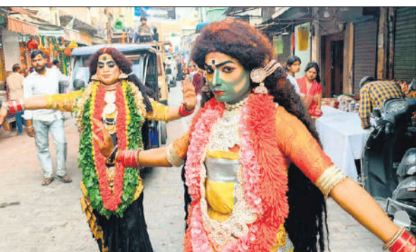
शोभायात्रा में नृत्य करते कलाकार।

शोभा यात्रा के प्रारंभ में 200 मोटरसाइकिल सवार राम भक्त इसके बाद भजन प्रचार गाड़ी, ढोल नगाड़े, श्री गणेश जी की झांकी, श्री बांके बिहारी जी की झांकी, शंकर अचारी, काली माता की झांकी, श्री राम जन्मोत्सव की झांकी, ताड़का वध, श्री विश्वामित्र यज्ञ की रक्षा, धनुष यज्ञ, कोप भवन, केवट संवाद, पंचवटी, सीता हरण, शबरी मिलन, बाहुबली हनुमान, श्री सुग्रीव मित्रता, लव कुश, श्री राम दरबार की झांकियां शामिल थीं। इसके अलावा भव्य सुंदर स्वचलित झांकियां ने लोगों को मन को मोहा। जगह-जगह भक्तों ने शोभायात्रा का स्वागत पुष्प वर्षा