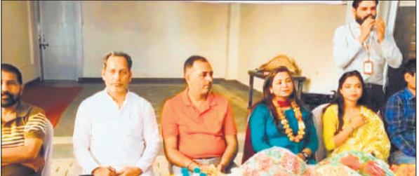
शिविर में मौजूद अतिथि व अन्य।