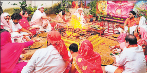
संभल के पूंजू सराय में यज्ञ में आहुतियां देते साधक व श्रद्धालु।