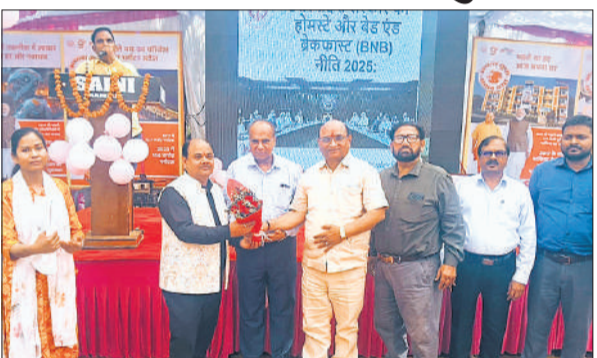
विकास भवन में कार्यक्रम में मौजूद आईआईएफ के चेयरमैन व अन्य उद्यमी।