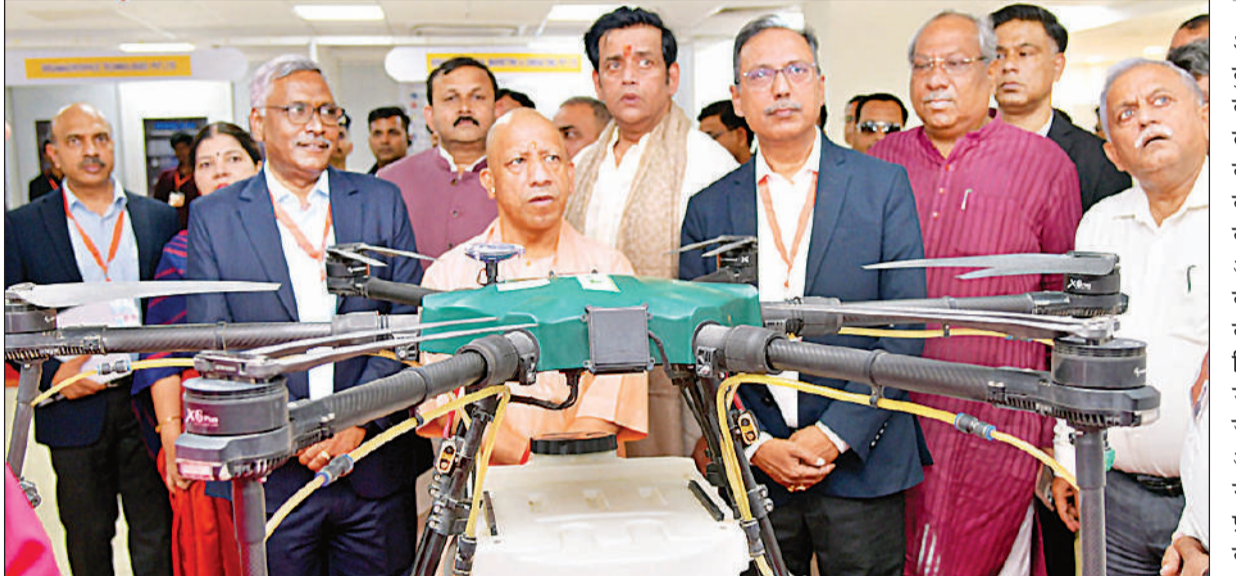
गोरखपुर : गीडा में निर्मित साँपटवेयर टेक्नोलॉजी पार्क के उद्घाटन के बाद हाईटेक ड्रोन का संचालन समझते मुख्यमंत्री योगी आदित्यनाथ, साथ में अन्य।

मुख्यमंत्री ने कहा कि प्रदेश के युवाओं में अपार प्रतिभा है, जिसे तकनीक और प्लेटफॉर्म से जोड़ने की जरूरत थी। पहले की सरकारों ने इस “स्केल” को “स्किल” में बदलने पर ध्यान नहीं दिया, जिससे युवा पलायन और निराशा का शिकार हुआ। अब सरकार युवाओं को टेक्नोलॉजी और स्टार्टअप संस्कृति से जोड़कर उन्हें इंडस्ट्री रेडी बना रही है। योगी ने बताया कि यह सेंटर पूर्वी उत्तर प्रदेश के युवाओं को बड़ा अवसर देगा। यहां प्लग एंड प्ले मॉडल के तहत स्टार्टअप शुरू करने वाले युवाओं को जगह, बिजली और बुनियादी सुविधाएं उपलब्ध होंगी। उन्होंने कहा कि यह सेंटर युवाओं के सपनों को नई उड़ान देगा और उन्हें वैश्विक स्तर पर प्रतिस्पर्धा के योग्य बनाएगा।