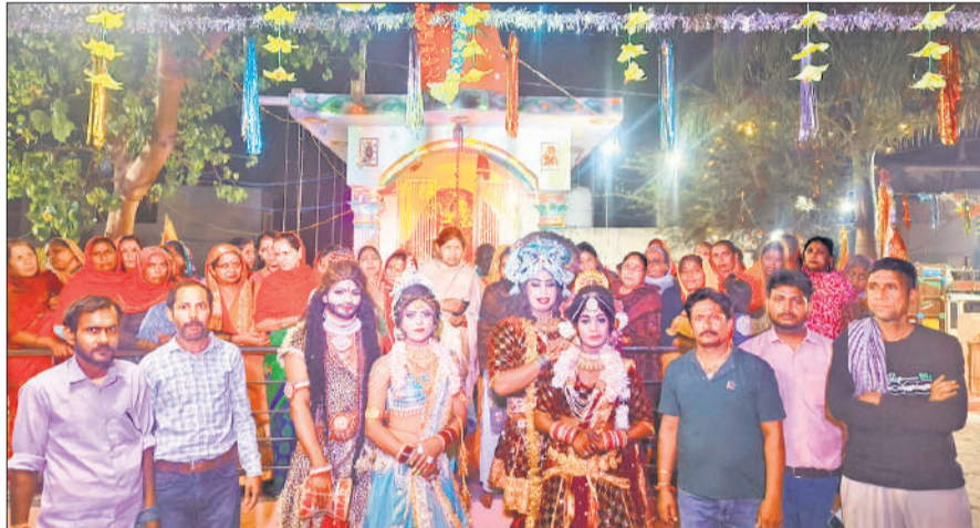
शोभायात्रा में शामिल लोग व भोलेनाथ और पार्वती के स्वरूप।

अमृत विचार : दुर्गा अष्टमी पर गुरुवार सुबह से ही मंदिरों में श्रद्धालुओं की भीड़ रही। मां भगवती के जयकारों से माहौल भक्तिमय हो गया। पूजा अर्चना करने के बाद व्रत करने वाले भक्तों ने कन्या बरुआ भोजकर करारक व्रत तोड़ा। घरों में लोगों ने सुबह से ही कन्या भोज की तैयारियां शुरू कर दी थीं। ठाकुरद्वारा में श्रद्धालुओं ने दुर्गा शोभायात्रा निकाली। शोभायात्रा में शामिल झांकियों ने लोगों का मरन मोह लिया। वहीं बिलारी में माता की चौकी निकाली। इस दौरान जयकारे लगते रहे।