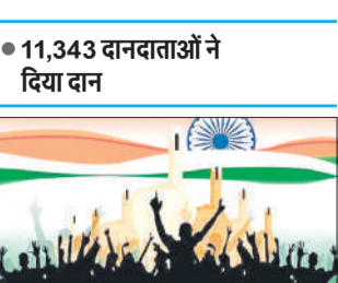
जो 6,648.56 करोड़ रुपये रहे। इनमें से भाजपा को 6,074.01 करोड़ रुपये, जबकि कांग्रेस को 2,501 चंदे से 517.39 करोड़ रुपये प्राप्त हुए। भाजपा द्वारा घोषित चंदा कांग्रेस, आम आदमी पार्टी (आप), राष्ट्रीय दलों को मिलने वाले कुल चंदे में मार्क्सवादी कम्युनिस्ट पार्टी (माकपा) और नेशनल पीपुल्स पार्टी के उसी अवधि

नई दिल्ली, एजेंसी राष्ट्रीय दलों को मिलने वाले चंदे में 2024-25 में पिछले वित्तीय वर्ष की तुलना में 161 प्रतिशत की वृद्धि हुई, जिसमें सत्तारूढ़ भाजपा का हिस्सा सबसे अधिक रहा। भाजपा को इस अवधि में अन्य सभी राष्ट्रीय दलों द्वारा प्राप्त कुल चंदे से दस गुना से भी अधिक चंदा मिला। एसेसिएशन फोर डेमोक्रेटिक रिफॉर्म (एडीआर) की एक रिपोर्ट में यह जानकारी दी गई। गुरुवार को जारी रिपोर्ट में कहा गया है कि वित्त वर्ष 2025 में राष्ट्रीय दलों द्वारा घोषित 20,000 रुपये से अधिक के कुल दान 11,343 दानदाताओं से मिले