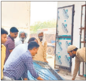
मदरसे का दरवाजा उखाड़ते ग्रामीण

के जवानों की भारी तैनाती की गई। देर रात शोभायात्रा पुनः वाणेंय सेवा सदन पहुंचकर संपन्न हुई।