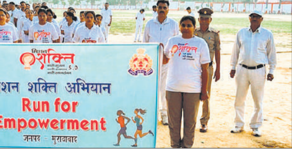
महिला सुरक्षा एवं जागरूकता दौड़ में भागीदारी करती महिला सिपाही।