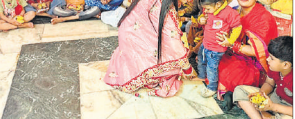
अष्टमी को कन्या जिमाती भवत।