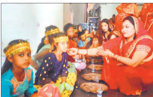
कन्या पूजन करते श्रद्धालु।

संवाददाता मंडी धनौरा, अमृत विचार : चैत्र नवरात्र के नौवें दिन भक्तों ने शक्ति की अधिष्ठात्री मां दुर्गा के आठवें मां महागौरी का विधि-विधान से पूजन किया। इस दौरान नगर से लेकर ग्रामीण क्षेत्रों तक भक्ति और आस्था का वातावरण देखने को मिला। घरों और मंदिरों में श्रद्धालुओं ने मां की आराधना कर परिवार की सुख-समृद्धि और मंगलकामना की। श्रद्धालुओं ने कन्याओं को देवी स्वरूप मानकर उनका पूजन किया और उन्हें भोजन कराकर आशीर्वाद प्राप्त किया। इस दौरान अन्न, वस्त्र और धन की समृद्धि के लिए विशेष प्रार्थनाएं की गईं। वहीं नगर के प्राचीन नवदुर्गा मंदिर में सुबह भोर से ही श्रद्धालुओं का ताता लगना शुरू हो गया था।