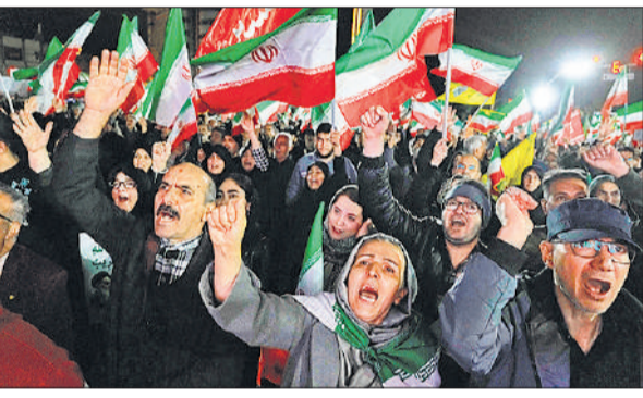
तेहरान में बृहस्पतिवार को सरकार समर्थकों ने रैली निकालकर प्रदर्शन किया।

अमेरिका का अपने रणनीतिक भंडार से तेल का उपयोग करना इस जोखिम का संकेत करार दिया जा रहा है कि ईरान के साथ संघर्ष लंबा खिंच सकता है। राष्ट्रपति डोनाल्ड ट्रंप के पहले अभियान के विदेश नीति सलाहकार जॉर्ज पापाडोपोलोस ने यह दावा किया है। पापाडोपोलोस ने कहा, इन भंडारों को केवल अत्यधिक संकट के दौरान उपयोग करने के लिए बनाया गया है, जैसे कि अमेरिका में या दुनिया भर में होने वाला लंबी अवधि का कोई भी संभावित युद्ध। पापाडोपोलोस ने कहा कि अमेरिका का वर्तमान भंडार केवल लगभग एक महीने या उससे भी कम समय तक चल सकता है। अमेरिकी ऊर्जा मंत्री क्रिस राइट ने इससे पहले मार्च में कहा था कि वॉशिंगटन अपने रणनीतिक भंडार से 17.2 करोड़ बैरल तेल निकालेगा और 2027 में इसमें 20 करोड़ बैरल तेल फिर से भरेगा। इतनी बड़ी मात्रा में तेल जारी करने में लगभग 120 दिन लग सकते हैं। अमेरिका और इजराइल ने 28 फरवरी को तेहरान सहित ईरान के कई टिकानों पर हमले किए थे,