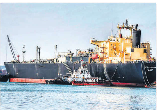
कतर से कर्नाटक के न्यू मंगलुरु बंदरगाह पर पहुंचा एलपीजी पोत अपोलो ओशन।

उन्होंने कहा, हम युद्ध की स्थिति में हैं। यह क्षेत्र युद्ध क्षेत्र बना हुआ है और हमारे दुश्मनों एवं उनके सहयोगियों के पोतों को इससे गुजरने देने का कोई कारण नहीं है लेकिन यह अन्य देशों के लिए खुला है। संघर्ष समाप्त करने के लिए अन्य देशों द्वारा मध्यस्थता करने के प्रयासों से जुड़े सवाल पर अराघची ने कहा, अमेरिका के साथ कोई बातचीत नहीं चल रही है।