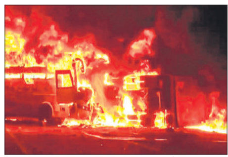
आंध्र प्रदेश के रायवरम में आग लगने के बाद जलती बस।

हादसे के समय बस में कुल 35 यात्री सवार थे। तीन घायल की हालत गंभीर बताई जा रही है। बस टुक के डीजल टैंक से टकरा गई जिससे उसमें भीषण आग लग गई। अधिकारियों ने बताया कि बचाव अभियान जारी है और परिजनों की सहायता के लिए मार्कापुरम उपजिलाधिकारी कार्यालय में एक कमान एवं नियंत्रण कक्ष स्थापित किया गया है। यह निजी बस तेलंगाणा के जगतिपाल से नेल्लोर जिले के कालीपतिरि जा रही थी तभी