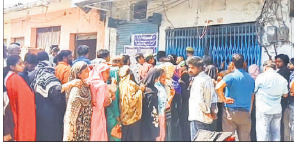
गैस एजेंसी पर लगी उपभोक्ताओं की लाइन।

अमृत विचार : ठाकुरद्वारा नगर सहित आसपास के ग्रामीण क्षेत्रों में रसोई गैस (एलपीजी) की कृत्रिम कमी पैदा कर कालाबाजारी किए जाने का मामला सामने आया है। आरोप है कि घरेलू गैस सिलेंडर निर्धारित मूल्य 933 रुपये के बजाय 1700 से 2000 रुपये तक बेचे जा रहे हैं, जबकि कर्मशियल सिलेंडर की कीमत 6000 रुपये तक वसूली जा रही है। इतना ही नहीं, गैस रिफिलिंग भी 80-90 रुपये प्रति किलो के स्थान पर 140 रुपये प्रति किलो तक बेची जा रही है। स्थानीय लोगों के अनुसार, गैस एजेंसियों, डीलरों और एजेंटों