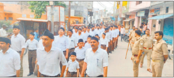
पथ संचलन निकालते भारतीय स्वयं सेवक।