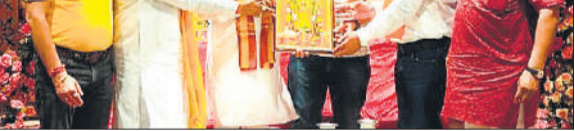
विश्व हिंदू परिषद के कार्यक्रम में भगवान राम के चित्र अतिथि को देते पदाधिकारी।