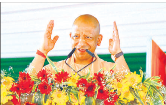
राज्य ब्यूरो, लखनऊ

अमृत विचार : मुख्यमंत्री योगी आदित्यनाथ ने रसोई गैस और पेट्रोल-डीजल को लेकर फैल रही अफवाहों पर सख्त रुख अपनाते हुए स्पष्ट किया कि प्रदेश में किसी प्रकार की कमी नहीं है। कहा कि गैस सिलेंडर के लिए एजेंसी पर लाइन लगाने की जरूरत नहीं है, निर्धारित प्रक्रिया के तहत बुकिंग करें, सिलेंडर घर तक पहुंचेगा। उन्होंने वैश्विक हालात के बीच लोगों से संयम और सहयोग की अपील दोहराई।