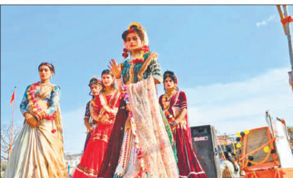
श्री राम शोभायात्रा में शामिल झांकी।