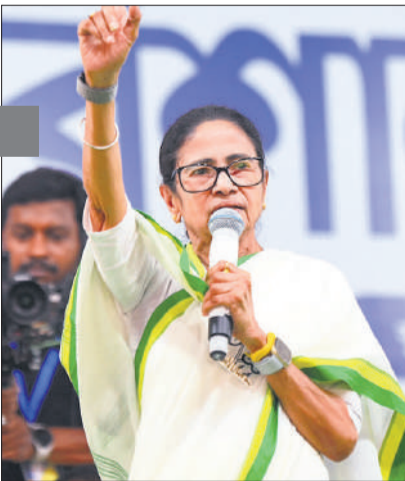
दुबराजपुर में चुनावी

दुबराजपुर। तृणमूल कांग्रेस प्रमुख ममता बनर्जी ने बृहस्पतिवार को दावा किया कि अगर विचारार्थीन 60 लाख से अधिक लोगों के नामों में से लगभग 30 लाख नाम मतदाता सूची में शामिल हो जाते हैं तो यह उनकी उपलब्धि है और इसका श्रेय उनकी पार्टी को मिलेगा।