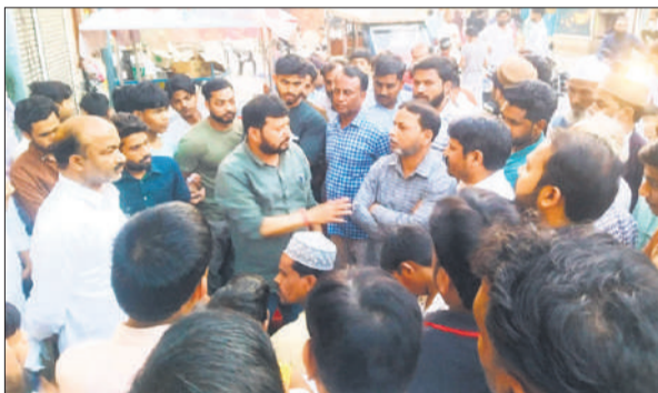
कुम्हार चौक पर डिवाइडर बनाता देख दो पक्ष के लोग आमने सामने आये।

जानकारी के अनुसार नगर पंचायत द्वारा अंसारी मोहल्ला स्थित कुम्हार चौक से लेकर अंडे वाले के घर तक सीसी रोड का निर्माण कराया जा रहा है। आरोप है कि निर्माण कार्य में डिवाइडर शामिल