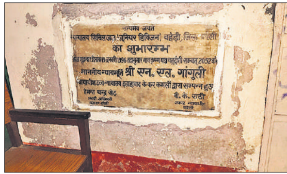
तीस साल पहले लगाया गया पत्थर।

गौरतलब है कि बहेड़ी में सिविल जज की अदालत पिछले करीब 30 वर्षों से नगर पालिका की इमारत में संचालित हो रही है। 19 जनवरी 1996 को यह अदालत अस्थायी रूप से शुरू हुई थी, जबकि 1991