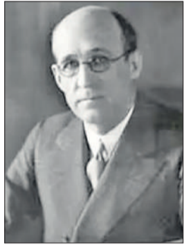
वाल्टर ओ. स्मेलिंग का जन्म 1880 में अमेरिका में हुआ था। वे पेशे से रसायनशास्त्री थे और ईंधन के क्षेत्र में महत्वपूर्ण शोध किए। उन्होंने हार्वर्ड, येल और जॉर्ज वाशिंगटन विश्वविद्यालय से शिक्षा हासिल की। 1907 में उन्होंने पानी के नीचे डेटोनेटर का आविष्कार किया, जो पनामा नहर निर्माण में अमेरिकी सरकार को सालाना 5 लाख डॉलर बचाने में सहायक रहा। 1910 में यूएस ब्यूरो ऑफ माइंस के विस्फोटक प्रयोगशाला के प्रमुख बने। उन्होंने विस्फोटकों पर 179 पेटेंट कराए। उनका निधन 1965 में हुआ।