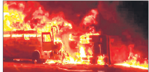
आंध्र प्रदेश के रायचरम में आग लगने के बाद जलती बस।