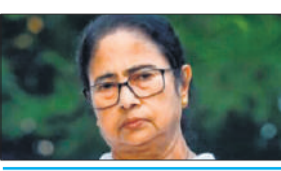
● हलक में अटक रही अधिकारियों की जान, कई प्रयासों के बाद उतरा

कोलकाता, एजेंसी सांस रोक देने वाले एक घटनाक्रम में पश्चिम बंगाल की मुख्यमंत्री ममता बनर्जी का विमान बृहस्पतिवार को भीषण तूफान और भारी बारिश के कारण करीब एक घंटे तक हवा में फंसा रहा। कई प्रयासों के बाद पायलट जब उसे सुरक्षित नेताजी सुभाष चंद्र बोस अंतरराष्ट्रीय हवाई अड्डे पर उतारने में सफल हुआ तो अधिकारियों की जान में जान आई। हवाई अड्डे के सूत्रों से मिली जानकारी के अनुसार ममता बनर्जी का विमान भीषण तूफान और भारी बारिश के कारण एक घंटे से भी ज्यादा समय तक हवा में फंसा रहा। खराब मौसम, भारी बारिश और हवाईअड्डा क्षेत्र के आसपास चल रही तेज हवाओं के कारण उसे उतरने की अनुमति नहीं दी गई थी। बताया गया कि पायलट ने विमान उतारने के कई प्रयास किए लेकिन सफल नहीं हुआ। एक समय जब तूफान थोड़ा कम हुआ तो विमान कोलकाता हवाई अड्डे के करीब पहुंचा था लेकिन मौसम फिर विवाड़ने के कारण उसे लैंडिंग किए बगैर उड़ना पड़ा। काफी देर बाद वह लैंड करने में सफल हो पाया। मुख्यमंत्री चुनाव रैलियां कर कोलकाता लौट रही थीं।