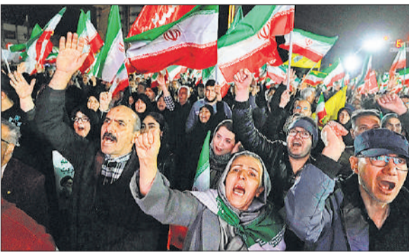
तेहरान में बृहस्पतिवार को सरकार समर्थकों ने रैली निकालकर प्रदर्शन किया।

इरान के विदेश मंत्री अब्बास अराधची ने अमेरिका पर पश्चिम एशिया में दोहरा मापदंड अपनाने का आरोप लगाते हुए उसके 15-सूत्रीय प्रस्ताव को खारिज कर दिया है। अराधची ने 'एक्स' पर अमेरिका पर दोहरे मापदंड अपनाने का आरोप लगाते हुए कहा कि वह एक ओर गाजा में इजराइल की नाकेबंदी का समर्थन करता है, जबकि दूसरी ओर होर्मुज जलडमरूमध्य में आत्मरक्षा के लिए उठाए गए इरान के कदमों की आलोचना कर रहा है। अराधची ने कहा, अंतरराष्ट्रीय कानून सुविधा के अनुसार इस्तेमाल करने का उपकरण नहीं है। उन्होंने तारा कि इरान अमेरिका के साथ कोई वार्ता नहीं कर रहा है और न ही ऐसी कोई योजना है, जिससे युद्ध समाप्त हो सके। यह बयान अमेरिकी अधिकारियों के उन दावों के उलट है, जिनमें बातचीत जारी होने और उसके सार्थक होने का दावा किया गया था। अमेरिका के 15 सूत्री प्रस्ताव को तेहरान ने अत्यधिक कठोर और अव्यावहारिक करार दिया है। अराधची ने इरान की ओर से पेश किए गए पांच बिंदुओं के जवाबी प्रस्ताव का भी उल्लेख किया और देश की प्रमुख नीतिगत स्थितियों को दोहराया।