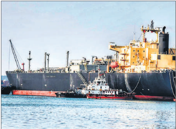
कतर से कर्नाटक के न्यूमंगलुरु बंदरगाह पर पहुंचा एलपीजी पोत अपोलो ओशन।

उन्होंने कहा, हम युद्ध की स्थिति में हैं। यह क्षेत्र युद्ध क्षेत्र बना हुआ है और हमारे दुश्मनों एवं उनके सहयोगियों के पोतों को इससे गुजरने देने का कोई कारण नहीं है लेकिन यह अन्य देशों के लिए खुला है। संघर्ष समाप्त करने के लिए अन्य देशों द्वारा मध्यस्थता करने के प्रयासों से जुड़े सवाल पर अराघची ने कहा, अमेरिका के साथ कोई बातचीत नहीं चल रही है।