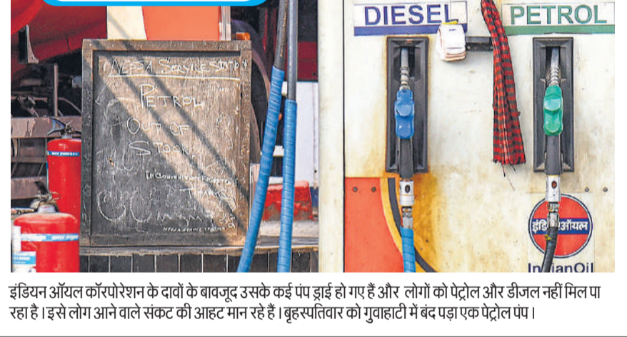
इंडियन ऑयल कॉर्पोरेशन के दावों के बावजूद उसके कई पंप ड्राई हो गए हैं और लोगों को पेट्रोल और डीजल नहीं मिल पा रहा है। इससे लोग अपने-आप संकट की आहट मान रहे हैं। बृहस्पतिवार को गुवाहाटी में बंद पड़ा एक पेट्रोल पंप।