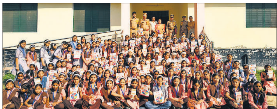
क्योलडिया में कस्तूरबा गांधी आवासीय विद्यालय में पुलिस ने बालिकाओं को गुड टच बेड टच के बारे में जानकारी दी।