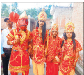
शोभायात्रा में शामिल रामायण के पात्र