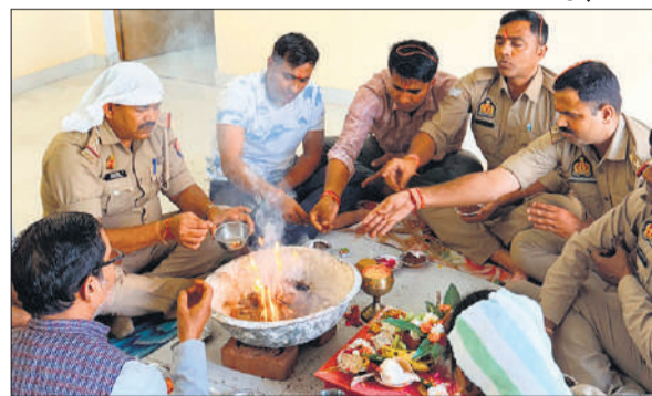
चौकी में हवन करते पुलिस कर्मी।