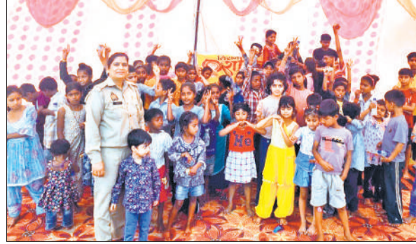
कन्या पूजन के बाद बेटियों के साथ पुलिसकर्मी।

अमृत विचार: मिशन शक्ति फेस 5.0 अभियान के द्वितीय चरण के तहत शुक्रवार को थाना मिलक खानम परिसर में कन्या पूजन किया गया। कार्यक्रम का उद्देश्य नारी सम्मान, सुरक्षा एवं सशक्तिकरण के प्रति जागरूकता बढ़ाना रहा। थाना प्रभारी एवं समस्त पुलिस स्टाफ द्वारा कन्याओं का विधि-विधान से पूजन कर उन्हें प्रसाद वितरित किया। कार्यक्रम में मौजूद