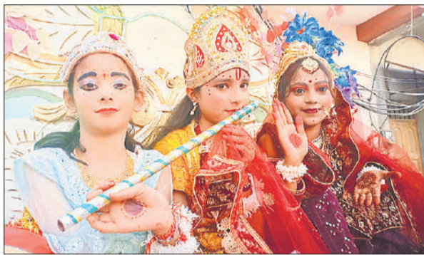
शोभायात्रा में शामिल राधा कृष्ण की झांकी।