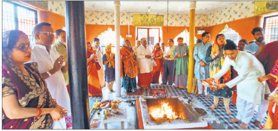
नवचंडी महायज्ञ में आहुतियां देते यजमान।