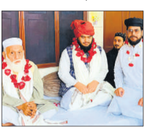
शहर काजी की गुलपोशी की गई।