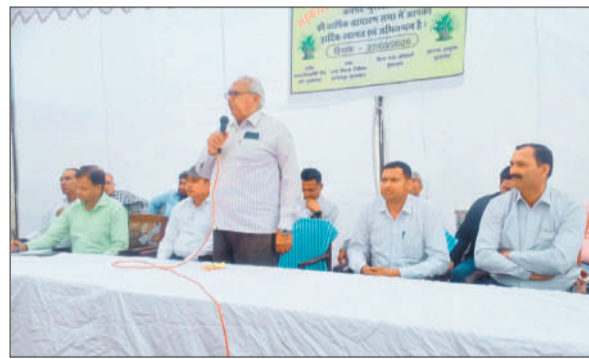
क्षेत्र के किसानों को संबोधित करते सभापति।

अमृत विचार: कुछ समय बाद ही चीनी मिल बंद होने वाले हैं। इस विषय को लेकर सहकारी गन्ना समिति में सभा का आयोजन कर किसानों को संबोधित किया गया। शुक्रवार को सहकारी गन्ना समिति कांठ के प्रांगण में साधारण सभा का आयोजन किया गया। जिसमें रानी नांगल, स्योहरा और दीवान शुगर मिल के प्रतिनिधियों ने भी भाग लिया और क्षेत्र से आए किसानों ने अपनी समस्याओं से अवगत कराया। दीवान शुगर मिल के प्रतिनिधि द्वारा अवगत कराया कि किसानों को भटकने की जरूरत नहीं है जो किसान गन्ने की खेती कर रहे हैं उनको खु गन्ने के बीज की प्रजाति का क्या नाम है और कितनी मात्रा से बुवाई करनी है। त्रिवेणी शुगर मिल के प्रतिनिधि ने बताया कि 20 मार्च तक का