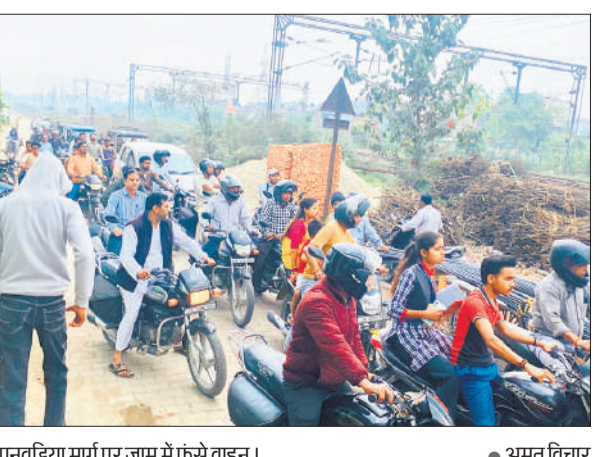
पनवड़िया मार्ग पर आम में फंसे वाहन।

सिविल लाइंस से पचालानगर को जोड़ने वाले राम-रहीम पुल की मरम्मत के महनेजर 20 मई तक के लिए गुरुवार से बंद कर दिया गया है। राम-रहीम पुल आवाजाही के लिए बंद होने से लोगों को काफी परेशानी का सामना करना पड़ रहा है। पुल पर मरम्मत के चलते हल्के और भारी वाहनों की आवाजाही पूरी तरह बंद कर दी गई है। पुल बंद होने के कारण शार्ट कट के चक्कर में