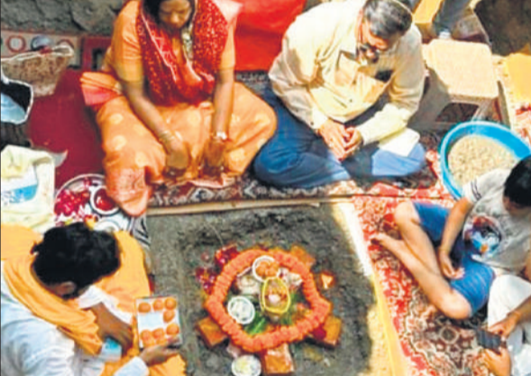
जडी गोयनका स्कूल में भूमि पूजन करते प्रबंध समिति के सदस्य।