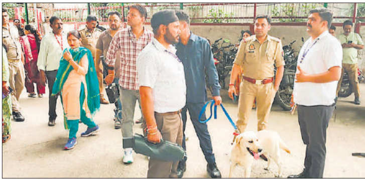
डाकघर में चेकिंग करने पहुंचा डॉग स्ववायड।