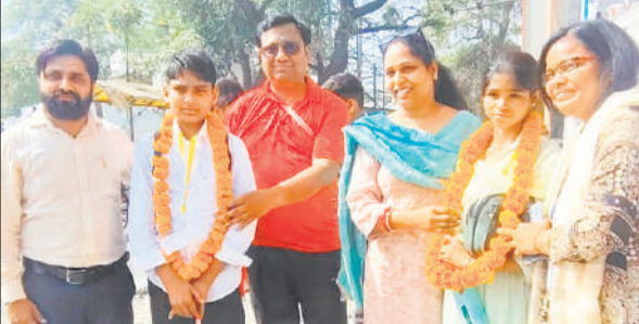
श्रीहरिकोटा से लौटे विद्यार्थियों का हुआ स्वागत।