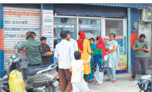
गैस सिलेंडर के लिए एजेंसी पर खड़े लोग।

28 फरवरी को अमेरिका और इजराइल के ईरान पर हमले के बाद गैस का संकट गहरा गया है। हालांकि सरकार ने दावा किया है कि गैस की कोई कमी नहीं है। लेकिन इसके बावजूद लोगों को एजेंसियों पर गैस नहीं मिल रही है। गैस एजेंसियों पर बच्चे भी गैस सिलेंडर पर बैठकर नंबर आने का इंतजार करते रहे। घरों में लकड़ी