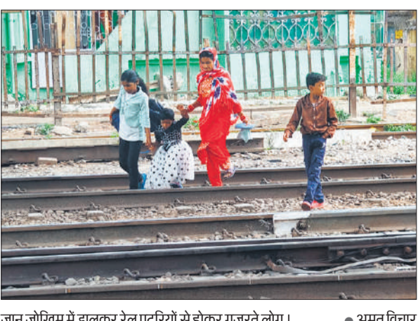
पुल की मरम्मत 20 मई तक होगी। इतने लंबे समय में पटरियों पार करने वाले लोग दुर्घटना का शिकार हो सकते हैं। पटरियों पर वैकल्पिक मार्ग की व्यवस्था करानी चाहिए।