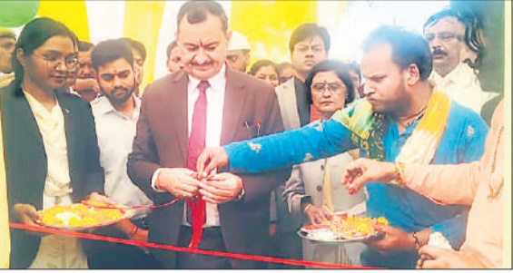
गुन्नौर में न्यायालय कक्ष का उद्घाटन करते हाईकोर्ट के प्रशासनिक जज।