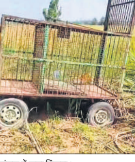
जंगल में लगा पिंजरा।