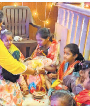
नवमी को कन्याएं जिमाती भक्त।