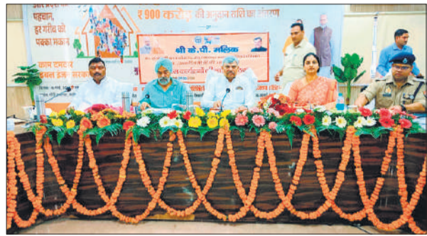
बैठक में समीक्षा करते प्रभारी मंत्री केपी मलिक।