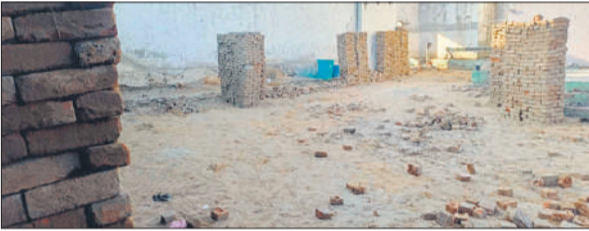
संभल के मुबारकपुर बंद गांव में मदरसा परिसर से उखाड़ी गई ईंटें।

गांव में गाटा संख्या 623 और 630 को राजस्व अभिलेखों में सरकारी भूमि के रूप में दर्ज बताया गया है। इसी जमीन पर करीब 30 वर्ष पूर्व "गोसुल उल्म" नाम से मदरसा संचालित किया जा रहा था, जिसके पास ही मस्जिद का भी निर्माण किया गया था। स्थानीय लोग इसे मदरसे