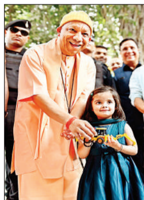
गोरखपुर: सीएम योगी को बुलडोजर खिलौना भेंट करती कानपुर की यशस्विनी।

वह यह गिफ्ट लाई है। बच्ची की इस बात ने माहौल को और भी खुशनुमा बना दिया। कन्या पूजन में भी शामिल कर मुख्यमंत्री ने उसके पांव भी पखारे।