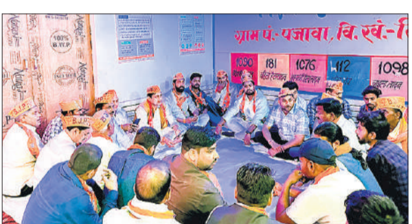
ग्राम पजाबा में प्रशिक्षण शिविर में कार्यकर्ताओं से बात करते जिलाध्यक्ष।

इसलिए कार्यकर्ता कभी भी अपने आप को पद के लिहाज से छोटा न आंके। उन्होंने सभी पदाधिकारियों व कार्यकर्ताओं को मेहनत से काम करने की अपील की। बिलासपुर विधानसभा के ग्राम पजाबा में प्रशिक्षण शिविर में उन्होंने कहा कि एक तरफ कांग्रेस, बसपा और