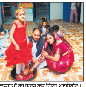
कन्याओं का पूजन कर लिया आशीर्वाद।

अमृत विचार: शुक्रवार को चैत्र नवरात्रि की नवमी पर भक्तों ने घरों में पूजा अर्चना कर कन्याओं को भोजन करा कर अपने व्रत खोले। सनातन धर्म के अनुसार व्रत के दौरान कन्या भोग करना शुभ माना जाता है। नवरात्रों में कन्या भोग माता दुर्गा के नौ स्वरूपों का सम्मान करने और उनका आशीर्वाद पाने के लिए किया जाता है, कन्या भोग में दो से दस वर्ष की कन्याओं को देवी का रूप माना जाता है। भक्तों द्वारा कन्याओं को भोजन करने से पूर्व उनके चरण धोए जाते हैं फिर उन्हें श्रद्धा पूर्व भोजन कराया जाता है। भोजन के बाद कन्याओं के चरण छूकर उन्हें उपहार देकर मनोकामना पूर्ण होने का आशीर्वाद प्राप्त किया जाता है। सनातन धर्म में मान्यता है की कन्याओं को भोजन कराने से मां दुर्गा अत्यंत