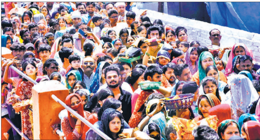
लालबाग स्थित प्राचीन काली माता मंदिर पर दर्शन के लिए लाइन में लगे श्रद्धालु।

अमृत विचार : चैत्र नवरात्रि के नवें दिन मां के सिद्धिदात्री स्वरूप की पूजा अर्चना घरों व मंदिरों में की गई। सुबह से देर शाम तक पूजा अर्चना का क्रम चलता रहा। लालबाग स्थित काली माता मंदिर, कोर्ट रोड स्थित दुर्गा मंदिर सहित अन्य मंदिरों में बड़ी संख्या में भक्तों ने कतार में लगकर मां का दर्शन कर अपनी मन्तव्य मांगी। नवरात्रि के नवें दिन घरों में कन्याओं की आरती उतार कर उन्हें भोजन प्रसाद खिलाया गया। कन्याओं को उपहार देकर उनके पैर छूकर व्रतियों ने आशीर्वाद लिया। वहीं मंदिरों में सुबह से माता रानी के जयकारे गूंजे। वहीं दूसरी ओर रामनवमी पर श्रीराम जन्मोत्सव की खुशियां भी मनाई गईं। मनोकामना हनुमान मंदिर, आशियाना फेज एक स्थित शिवशक्ति मंदिर में सुबह और शाम आरती के अलावा भजन कीर्तन भी किया गया। लालबाग स्थित प्राचीन काली माता मंदिर, सिद्धपीठ श्री नौ