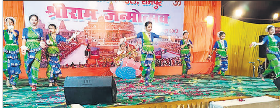
आदर्श रामलीला मैदान में आयोजित कार्यक्रम में नृत्य प्रस्तुत करते बच्चे।