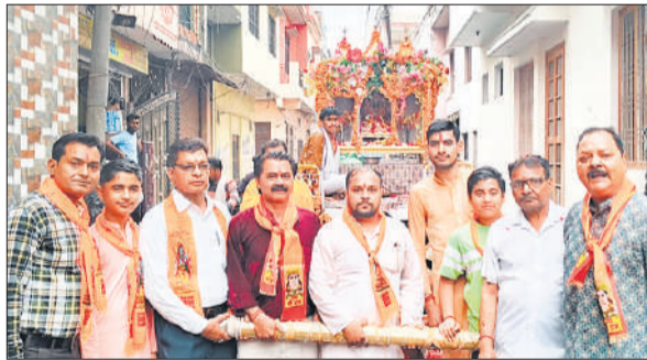
शोभायात्रा निकालते संकीर्तन मंडल के लोग।