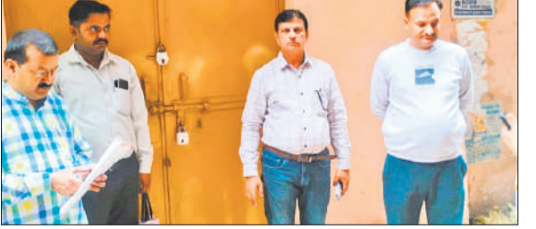
टैक्स बकायेदार का प्रतिष्ठान सील करने पहुंची नगर निगम की टीम।