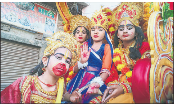
शोभायात्रा में शामिल श्रीराम दरबार की झांकी।