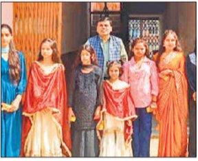
फैशन शो में शामिल प्रतिभागी।