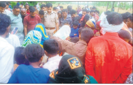
महिला की मौत के बाद इकट्ठा लोग व कार्रवाई करती पुलिस।