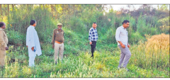
शाहबाद के जयतोली मदारपुर मार्ग पर जांच करती वन विभाग की टीम।