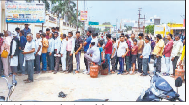
गैस एंजेंसी एवं गोदाम पर लगी उपभोक्ताओं की भीड़।

अमृत विचार: क्षेत्र में पिछले कई दिनों से जारी रसोई गैस की किल्लत के बीच शुक्रवार को कुछ राहत महसूस की गई, लेकिन उपभोक्ताओं को भारी मशक्कत का सामना करना पड़ा। कोतवाली के गजरोला मार्ग दीपपुर गेट स्थित गैस गोदाम पर सात दिनों के लंबे इंतजार के बाद गैस की गाड़ी पहुंची, जिसे देखते ही उपभोक्ताओं का हजूम उमड़ पड़ा। गैस आपूर्ति ठप्प होने के कारण नगर की विभिन्न एरेंजियों पर सुबह से ही उपभोक्ताओं की लंबी-लंबी कतारें देखने को मिलीं। दीपपुर गेट पर स्थिति यह थी कि