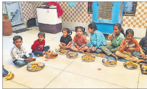
टाकुरद्वारा क्षेत्र मेंमाता सिद्धि रात्रि पर कन्या बरुआ को भोज कराता श्रद्धालु।