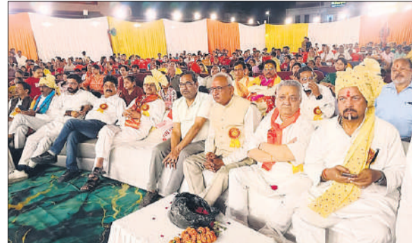
कार्यक्रम में मौजूद लोग।

संवाद एवं गीत ने लोगों का मन मोहा। ढोल नगाड़ा बाजे मृदंग बाजे, बजे खडताल, राम के भजन में होके मगन देखो, घुंघरू बांधे नाचे अंजनी को लाल। आनंद कॉन्वेंट पब्लिक स्कूल के छात्रों ने फौज में भर्ती देश पे मर मिटने वाले जवानों की स्थिति संदेश आते हैं गीत पर समा बांध दिया। सांची