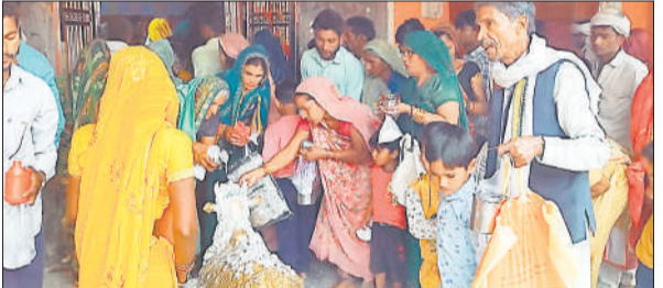
संभल के कैला देवी धाम पर दर्शन पूजन करते श्रद्धालु।

सुबह से ही मंदिर परिसर में श्रद्धालुओं की लंबी कतारें लग गईं। भक्तों ने विधि-विधान से माता रानी की पूजा-अर्चना कर अपनी मनोकामनाएं मांगी और परिवार की सुख-समृद्धि के लिए प्रार्थना की। कई श्रद्धालुओं ने हवन-यज्ञ कराकर अपनी आस्था व्यक्त की। मंदिर परिसर में बड़ी संख्या में बच्चों के मुंडन संस्कार भी कराए गए, जिससे धार्मिक परंपराओं का पालन होता नजर आया। मेले में महिलाओं