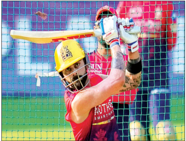
बंगलुरु के एम चिन्नास्वामी स्टेडियम में अभ्यास सत्र के दौरान रॉयल चैलेंजर्स बंगलुरु के विराट कोहली और सनराइजर्स हैदराबाद के कप्तान ईशान किशन।

कर्नाटक राज्य क्रिकेट संघ और आरसीबी प्रबंधन ने इस दुर्भाग्यपूर्ण घटना में जान गंवाने वाले लोगों की स्मृति को बनाए रखने के लिए कुछ कदम उठाए हैं। केएससीए ने स्टेडियम में 11 सीटें स्थायी रूप से खाली छोड़ने की घोषणा की है। इस स्टेडियम को आईपीएल मैचों की मेजबानी के लिए राज्य सरकार से अनुमति मिलने से पहले कई अनिश्चित महीनों का सामना करना पड़ा था। आरसीबी के खिलाड़ी पहले मैच के दिन अभ्यास सत्र के दौरान 11 नंबर की जर्सी पहनेंगे। जहां तक मैच का सवाल है तो आरसीबी और सनराइजर्स दोनों के पास गेंदबाजी संसाधनों की कमी है। आरसीबी को जोश हेजलवुड और बाएं हाथ के तेज गेंदबाज