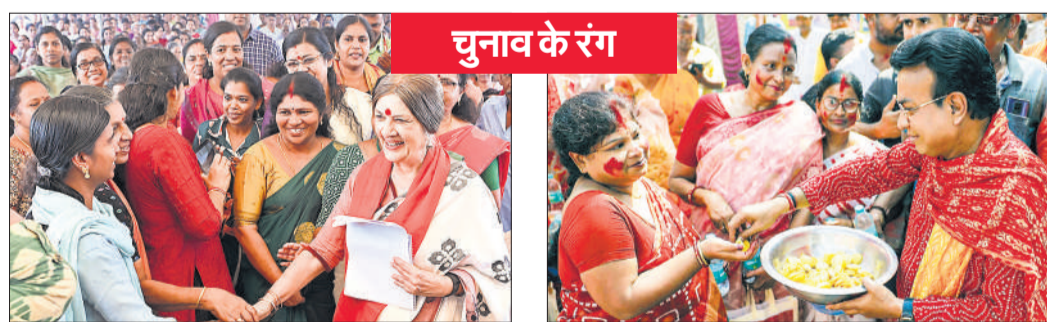
तिरुवनंतपुरम में मतदाताओं के बीच सीपीआई एम नेता वृंदा करात।

साल 2021 के चुनाव में दिनहाटा जैसा ही माहौल पास के शीतलकुची में भी दिखा था, जहां मतदान के दिन हिंसा में पांच लोगों की मौत हो गई थी। शीतलकुची के जोरपाटकी गांव में सीआईएसएफ के जवानों की गोलीबारी में चार युवकों की मौत हो गई थी। उसी दिन एक भाजपा समर्थक की भी गोली मारकर हत्या कर दी गई।