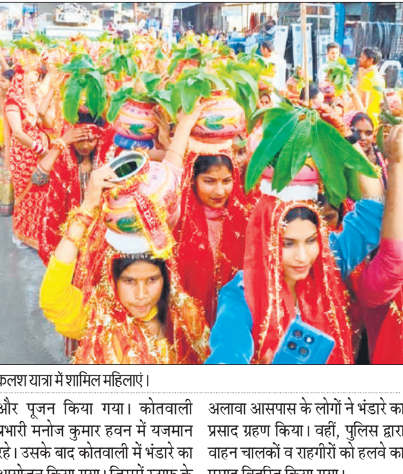
कलश यात्रा में शामिल महिलाएं।

प्रसन्न होती है और घर में सुख समृद्धि एवं शांति का वास होता है नवरात्रि की नवमी को नौ कन्याओं को भोजन कराया जाता है जो नौ देवियों का स्वरूप माना जाता है। गजराैला: शहर व देहात क्षेत्रों में शुक्रवार को राम नवमी का पर्व धूमधाम से मनाया गया। जगह-जगह हवन-पूजन व भंडारे का आयोजन किया गया। वहीं, घरों में कन्याओं का भी पूजन किया गया। राम नवमी के अवसर पर कोतवाली परिसर में हवन