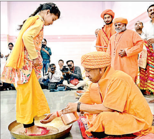
गोरखपुर : गोरखनाथ मंदिर में चैत्र नवरात्र पर मुख्यमंत्री योगी ने देवी स्वरूपा कन्याओं का पांव पखारकर उनका पूजन किया और उन्हें भोजन कराने के साथ दक्षिणा व उपहार भी प्रदान किया।