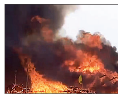
महायज्ञ स्थल पर कुछ इस तरह दिखा आग का दृश्य।