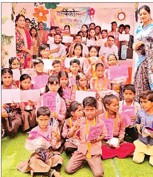
मेधावी बच्चों के साथ मौजूद शिक्षक-शिक्षिकाएं।