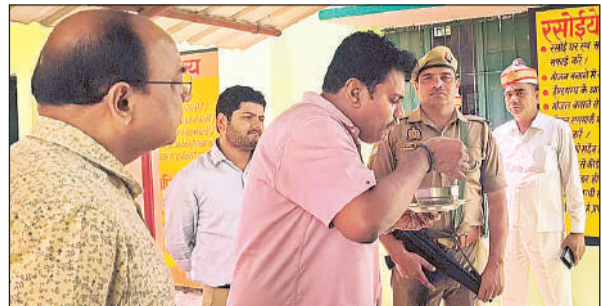
मिड-डे-मिल चखकर जांचते जिलाधिकारी।