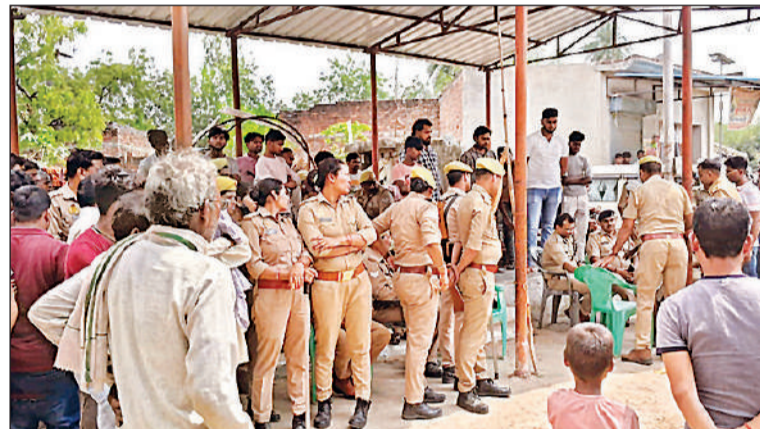
गांव में तैनात पुलिस फोर्स।