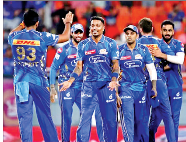
मुंबई इंडियंस की टीम।

रोहित शर्मा फॉर्म में वापसी करने के लिए उत्सुक होंगे। रोहित के अलावा उसकी टीम में कई स्टार खिलाड़ी हैं जिनमें भारत की टी20