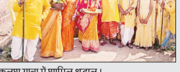
कलश यात्रा में शामिल श्रद्धालु।