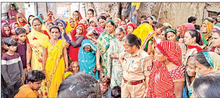
शव गांव पहुंचने पर रोते-बिलखते परिजन व मौजूद ग्रामीण।