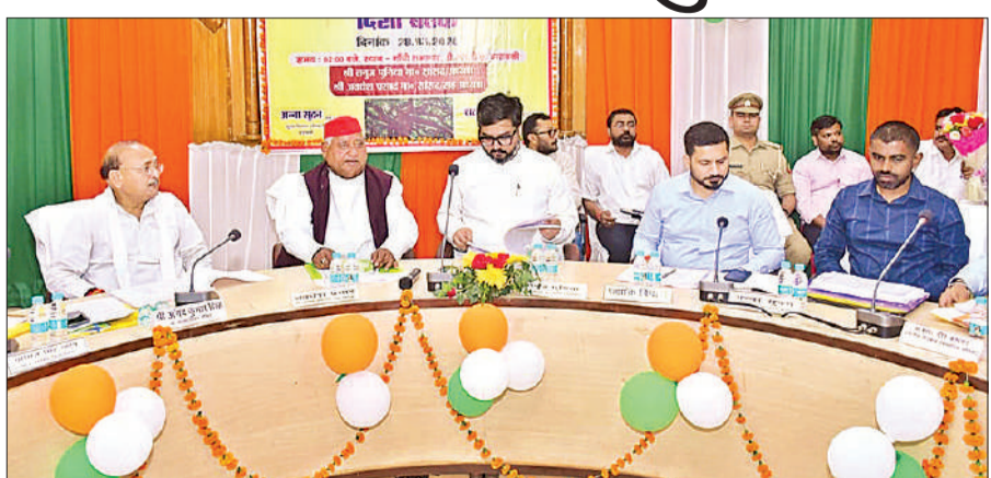
बैठक में मौजूद बाराबंकी व अयोध्या सांसद।