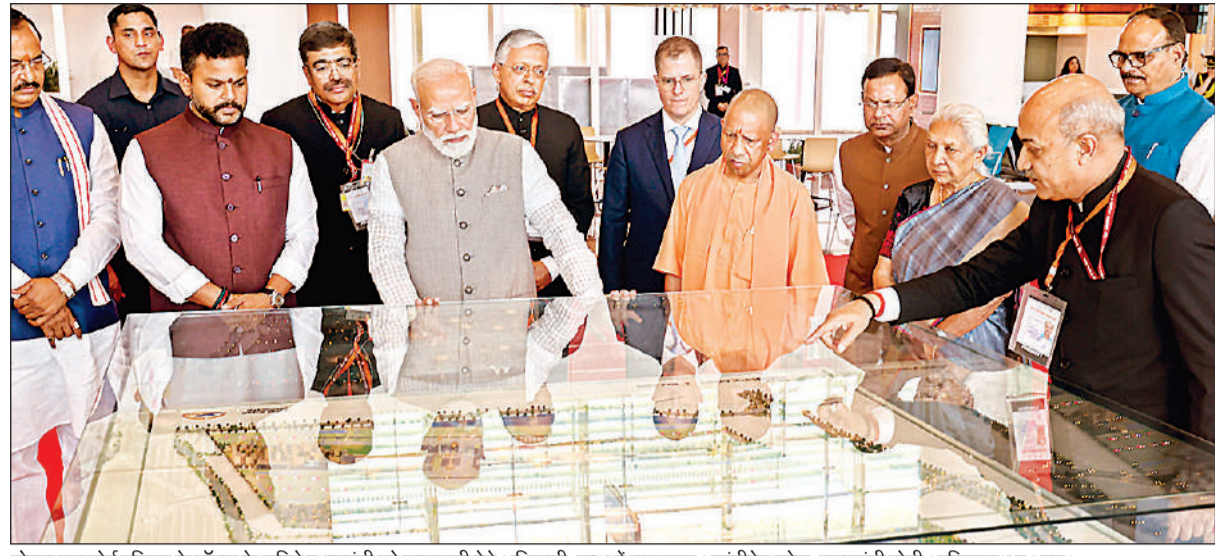
नोएडा एयरपोर्ट परिसर के मॉडल के जरिये प्रधानमंत्री को जानकारी देते अधिकारी, साथ में राज्यपाल आनंदीबेन पटेल, मुख्यमंत्री योगी आदित्यनाथ व अन्य।