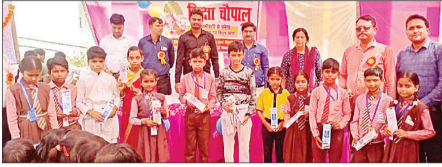
शिक्षा चौपाल में सम्मानित गए एनपुण बच्चे।

बचाने के लिए पानी में कूद गया। लेकिन पानी के तेज बहाव में वह भी युवती के साथ डूबने लगा। लहरों का तेज वेग और युवती की घबराहट के चलते युवक को काफी मशक्कत करनी पड़ी। लेकिन कड़े संघर्ष और जद्दोजहद के बाद डूबते हुए युवक ने खुद को और युवती को मौत के मुह से खींच निकाला। दोनों को सुरक्षित बाहर आते देख किनारे पर मौजूद श्रद्धालुओं ने राहत की सांस ली। श्रद्धालुओं का कहना था कि श्रद्धा और भक्ति के केंद्रों पर प्रशासन की लापरवाही और गोताखोरों की कमी अवसर भारी पड़ती है। इस बार तो चमत्कार हो गया, लेकिन हर बार किस्मत साथ नहीं देती।