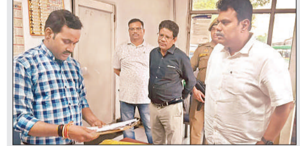
खेराबाद स्थित पेट्रोल पंप की जांच करते जिलाधिकारी डॉ. राजा गणपति आर।

सीतापुर, अमृत विचार : जिलाधिकारी डॉ. राजागणपति आर. ने जनपद के सभी पेट्रोल पंपों को सख्त निरीक्षण दिए हैं कि वे किसी भी स्थिति में मानक से हटकर खुले पेट्रोल, जैसे प्लास्टिक की बोतल या जरीकेन आदि में पेट्रोलियम पदार्थों की बिक्री न करें। जिलाधिकारी द्वारा जारी आदेश में कहा गया है कि वर्तमान में ग्रीष्म ऋतु के आगमन को देखते हुए सुरक्षा की दृष्टि से यह कदम उठाया गया है। मानक विहीन पत्रों में पेट्रोल या डीजल ले जाना जन्मानस और संपत्ति के लिए खतरनाक साबित हो सकता है। यह नियम 'पेट्रोलियम नियम 2002' के तहत निर्धारित मानकों के अनुरूप है। डीएम ने स्पष्ट चेतावनी दी है कि यदि जांच के दौरान किसी भी प्रतिष्ठान द्वारा नियमों का उल्लंघन पाया गया, तो संबंधित के विरुद्ध कड़ी कानूनी और वैधानिक कार्रवाई की जाएगी।