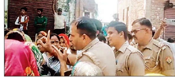
परिजनों को समझाते पुलिस कर्मी।