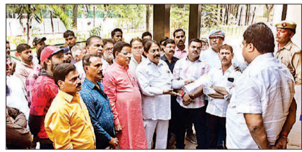
अतिरिक्त मजिस्ट्रेट को ज्ञापन देते व्यापारी।