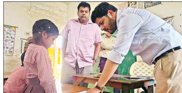
छात्रा से किताब पढ़ाते जिलाधिकारी साथ में बीएसए।