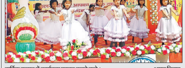
वार्षिक उत्सव में कार्यक्रम प्रस्तुत करते बच्चे।