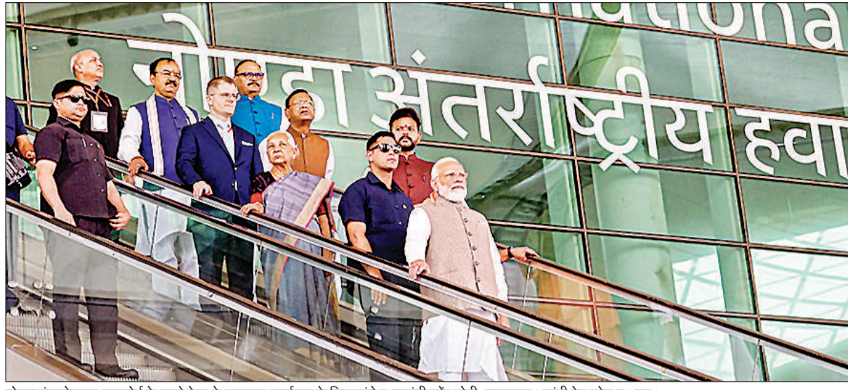
नोएडा इंटरनेशनल एयरपोर्ट के पहले फेज के उद्घाटन कार्यक्रम के लिए पहुंचे प्रधानमंत्री नरेंद्र मोदी, राज्यपाल आनंदी बेन पटेल व अन्य।