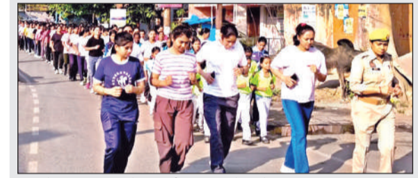
शहर के मुख्य मार्ग पर दौड़ लगाती महिलाएं और बच्चे।