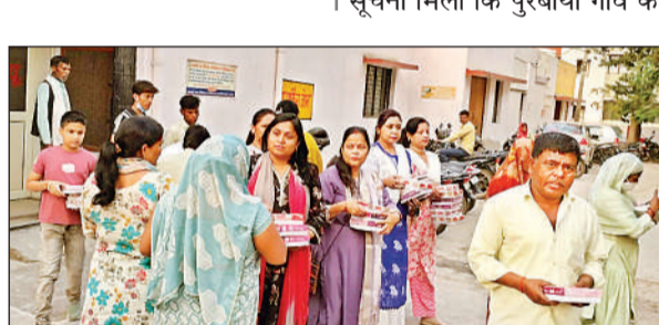
मेडिकल कॉलेज में भोजन वितरण करती समिति के लोग।