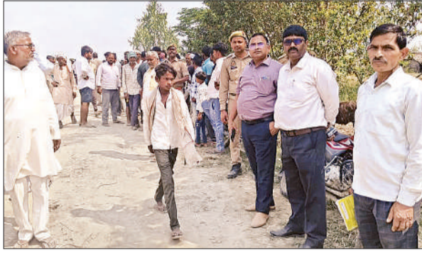
मौके पर मौजूद पुलिस व लगी लोगों की भीड़।

टिकैतनगर थाना क्षेत्र का गांव परसावल सरयू नदी के उस पार बसा हुआ है। शनिवार सुबह दरियाबाद थाना क्षेत्र के ग्राम