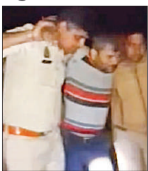
पुलिस की गिरफ्त में आरोपी।