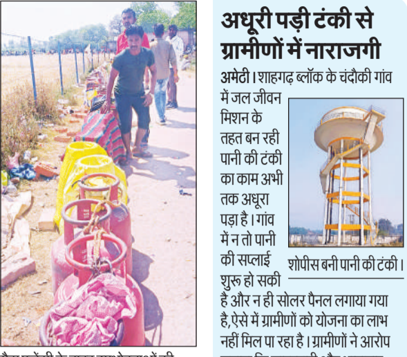
गैस एजेंसी के बाहर उपभोक्ताओं की लगी लंबी कतार।