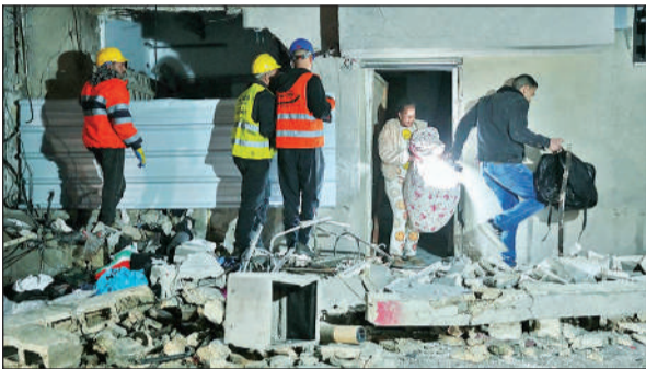
इजराइल के तेल अवीव में मिसाइल हमले में क्षतिग्रस्त हुई एक इमारत से अपना सामान लेकर बाहर निकलते लोग।

● पश्चिम एशिया युद्ध में पहली बार यमन ने इजराइल की ओर दार्गी मिसाइलें