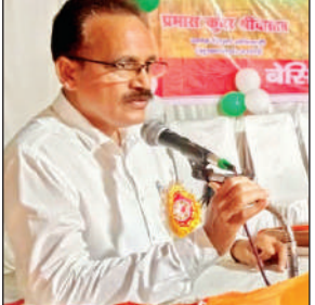
कार्यक्रम को संबोधित करते वीईओ व मौजूद शिक्षक-शिक्षिकाएं।