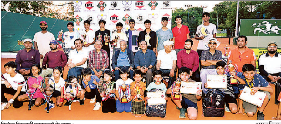
विजेता खिलाड़ी पुरस्कारों के साथ।