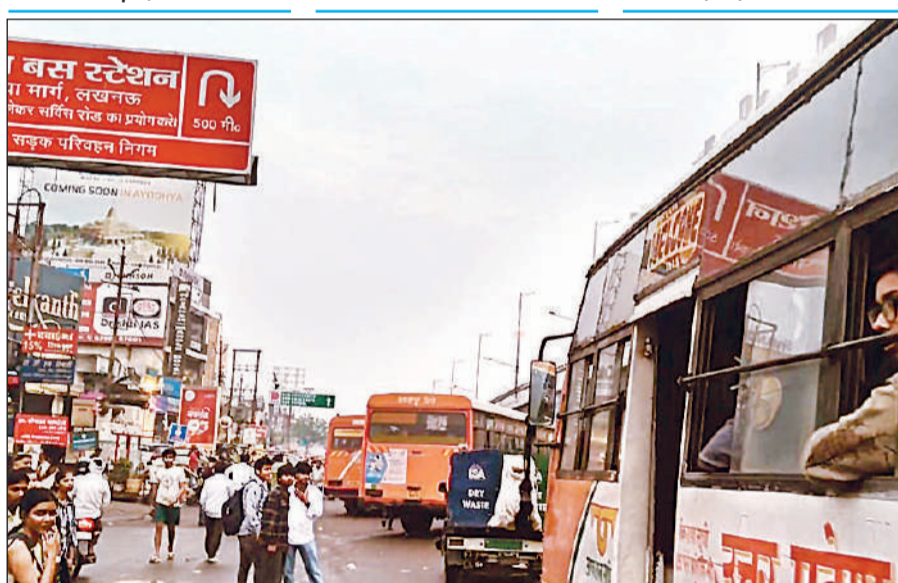
कमता तिराहे पर जाम लगाती रोडवेज बसें।

■ वाहनों का भारी दबाव होने के कारण हो रही जाम की समस्या