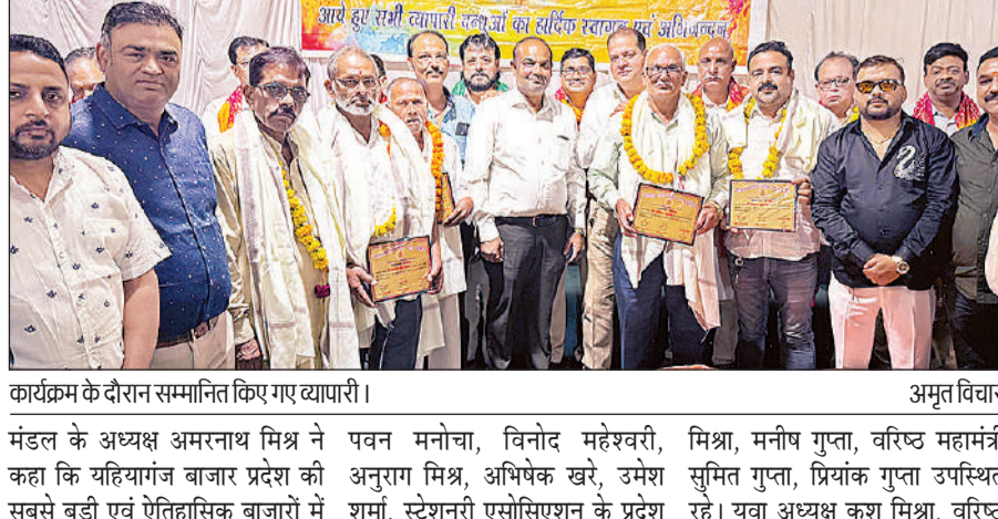
कार्यक्रम के दौरान सम्मानित किए गए व्यापारी।