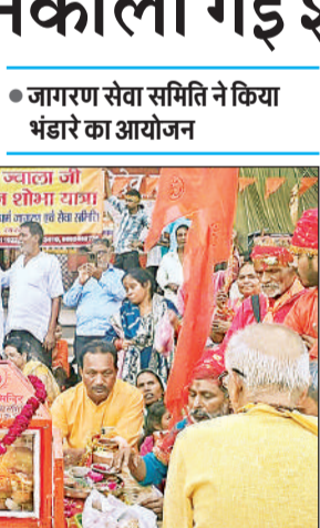
शनिवार को मंदिर के श्रद्धालु शोभा यात्रा द्वारा कुड़िया घाट पहुंचे और