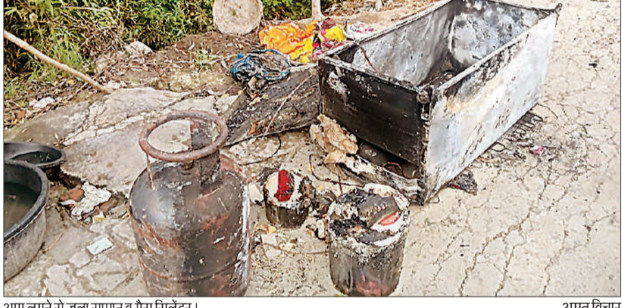
आग लगने से जला सामान व गैस सिलेंडर।