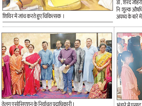
तेलुगु एसोसिएशन के निर्वाचित पदाधिकारी।