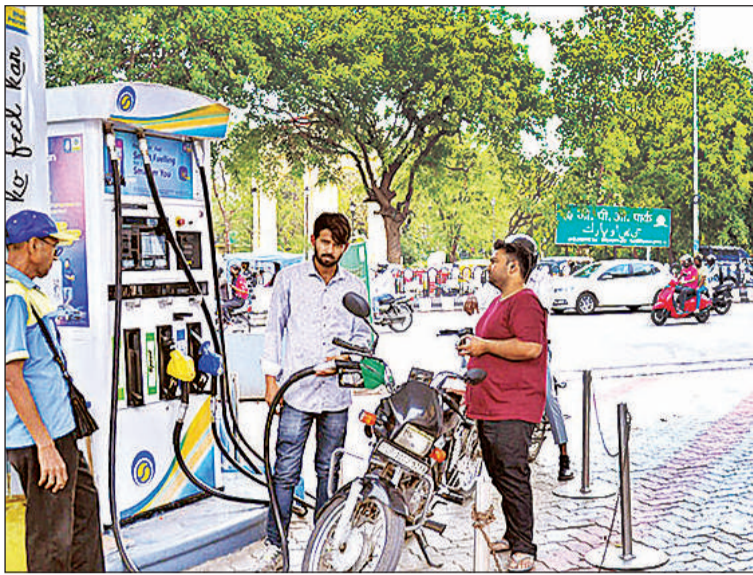
डॉ. भीमराव अम्बेडकर मार्ग स्थित भारत पेट्रोल पम्प तेल भरता बाइक सवार।