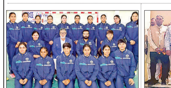
यूपी हैडबाल महिला टीम के खिलाड़ी।