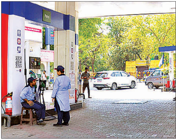
आलमबाग स्थित एचपी पेट्रोल पम्प पर पसरा रहा सन्नाटा।

अमृत विचार, लखनऊ: वित्तीय वर्ष 2025-26 समाप्त होने में तीन दिन हैं। भवन स्वामी 31 मार्च तक अपना बकाया जमा कर दें नहीं तो इसके बाद 12 प्रतिशत ब्याज के साथ गृहकर जमा करना होगा। भवन स्वामियों की सुविधा के लिए नगर निगम के सभी जौनल कार्यालय और केश काउंटर सुबह 10 से शाम 6 बजे तक खुले रहेंगे। इसके अलावा 30 और 31 मार्च को नगर निगम के सभी जौनल कार्यालय सुबह 10 से रात 11 बजे तक खुलेंगे।