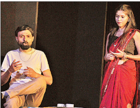
नाटक का मंचन करते कलाकार।

ज्ञान और छाया पति-पत्नी हैं। ज्ञान एक प्राइवेट ड्रामा स्कूल में अभिनय और निर्देशन का शिक्षक है। उनका दाम्पत्य जीवन सामान्य रूप से ठीक चल रहा था कि तभी एक दुर्घटना में ज्ञान अपाहिज हो जाता है। जिसके कारण उसे नौकरी से निकाल दिया जाता है। ऐसी हालत में घर चलाने के लिए छाया को नौकरी करनी पड़ती है।