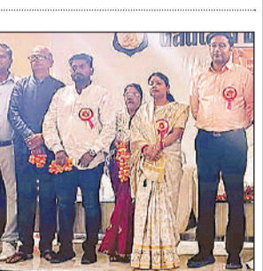
गोष्ठी में मौजूद लोग।