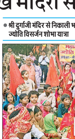
श्री दुर्गाजी मंदिर से निकलती ज्योति विसर्जन शोभा यात्रा में शामिल भक्त