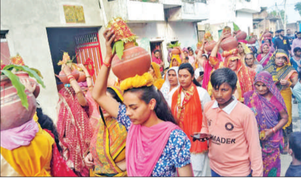
नागलिया जट गांव में कलश यात्रा में शामिल महिला श्रद्धालु।