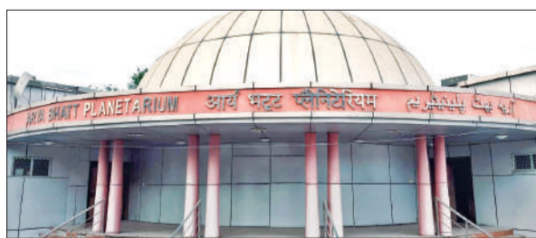
शहर के मोहल्ला वेगम वाली बगिया स्थित आर्यभट्ट नक्षत्रशाला।

अमृत विचार : शहर के मोहल्ला वेगम वाली बगिया स्थित आर्यभट्ट नक्षत्रशाला बजट का इंतजार कर रही है। करीब ढाई साल से बंद नक्षत्रशाला में खगोलीय घटनाओं को देखने के लिए अभी करीब 6 माह का इंतजार और करना पड़ सकता है। बरसात में पानी आने के चलते तकनीकी खराबी के कारण नक्षत्रशाला जुलाई 2023 से बंद है। इमारत और उसके आसपास स्थिति बदहाल हो चुकी है। ऐसे में स्कूलों के बच्चे खगोलीय ज्ञान के सीधे प्रसारण से वंचित हैं। करीब 27 करोड़ की लागत से निर्मित आर्यभट्ट नक्षत्रशाला में आकाशगंगा, चांद, सूर्य, ध्रुव इत्यादि को नजदीक से देखा जा सकता था। चंद्र ग्रहण इत्यादि खगोलीय घटनाओं को देखने के