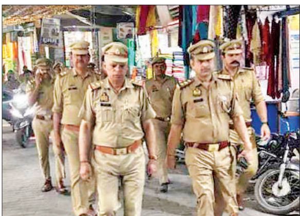
ठाकुरद्वारा पुलिस शांति व्यवस्था के लिए फ्लैग मार्च निकलते हुए। ● अमृत विचार

फ्लैग मार्च नगर के प्रमुख मार्गों कोतवाली चौराहा, बुध बाजार, पुरानी घास मंडी, कामालपुरी मार्ग, अस्पताल रोड सहित अन्य क्षेत्रों से होकर गुजरा। इस दौरान पुलिस अधिकारियों ने सुरक्षा व्यवस्था का जायजा लिया और संवेदनशील स्थानों पर विशेष सतर्कता बरतने के निर्देश दिए। कोतवाली प्रभारी ने कहा कि क्षेत्र में शांति एवं कानून-व्यवस्था बनाए रखना पुलिस की सर्वोच्च प्राथमिकता है। उन्होंने स्पष्ट किया कि किसी भी प्रकार की