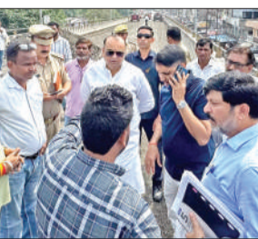
अधिकारियों से बात करते शहर विधायक।

अंडरपास का भी किया निरीक्षण अंडरपास का भी निरीक्षण किया। यह अंडरपास शिव विहार कॉलोनी के नाले के बराबर से निकल रहा है। इसका प्रयोग दो पहिया वाहनों के आवागमन में किया जा सकता है। जिस कारण अंडरपास को खुलवाने का प्रयास किया जा रहा है।