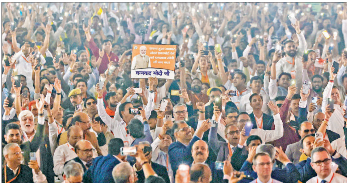
नोएडा में नवनिर्मित नोएडा अंतर्राष्ट्रीय हवाई अड्डे के उद्घाटन के दौरान लोग प्रधानमंत्री नरेंद्र मोदी का पोस्टर पकड़े हुए और मोबाइल फोन की टॉच जलाते हुए।