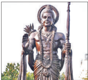
श्री राम प्रतिमा।

विश्व प्रसिद्ध पीतलनगरी विकास कार्यों के चलते अब पर्यटन के नक्शे पर भी उभरा है। नगर निगम व स्मार्ट सिटी के कई प्रोजेक्ट इसे नई पहचान दिला रहे हैं। इसी कड़ी में नगर निगम के द्वारा लगभग 6 करोड़ की लागत से बुद्धि विहार में निर्मित श्रीराम वाटिका शहर में नया धार्मिक और सांस्कृतिक