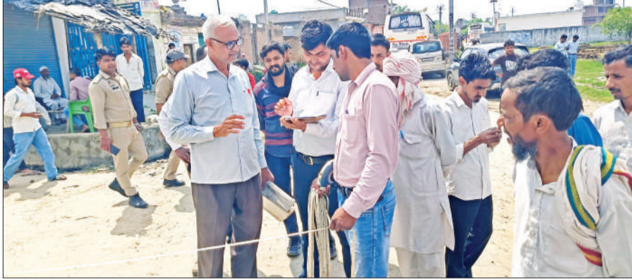
संभल के मुबारकपुर बंद गांव में सरकारी जमीन की पैमाइश करती राजस्व विभाग की टीम।

अमृत विचार: असमोली थाना क्षेत्र के गांव मुबारकपुर बंद में सरकारी भूमि पर अवैध निर्माण की शिकायत के बाद प्रशासन हरकत में आ गया। शनिवार को राजस्व विभाग की पांच सदस्यीय टीम ने मौके पर पहुंचकर पैमाइश की, जिसमें मदरसा, मस्जिद, मकान, दुकान और एक स्कूल तक सरकारी जमीन पर बने होने का मामला सामने आया। प्रशासन की संभावित कार्रवाई को देखते हुए ग्रामीणों ने पहले ही निर्माण से जुड़े सामान हटाना शुरू कर दिया था। राजस्व अभिलेखों के अनुसार, गाटा संख्या 623 (रकबा 0.112) भूमि खाद के गड्डे के रूप में दर्ज है, जबकि गाटा संख्या 630 (रकबा 0.126) खेल के मैदान के रूप में दर्ज है। इन दोनों सरकारी खातों