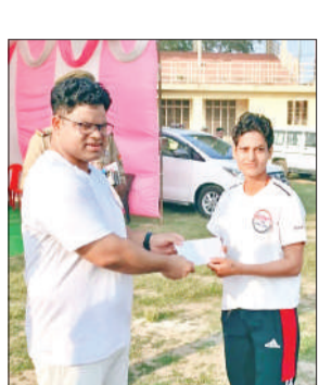
विजेता को पुरस्कृत करते एसपी।