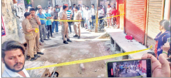
युवक को गोली मारने की घटना के बाद जांच करती पुलिस।