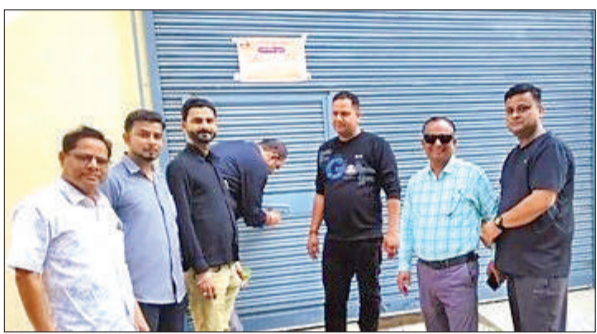
प्रतिष्ठान सील करते निगम के कर्मचारी।