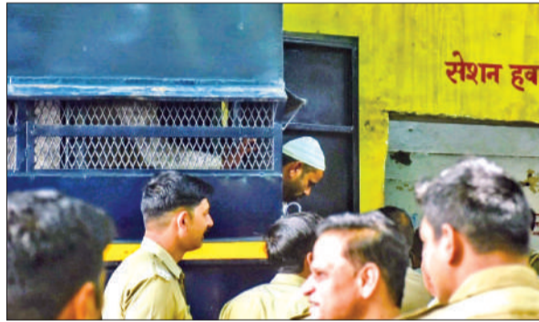
कड़ी सुरक्षा में कोर्ट में पहुंचे आरोपी।

अलावा एक कंपनी आरएफएफ के जवान सुरक्षा में लगाए गए। वहीं डींग