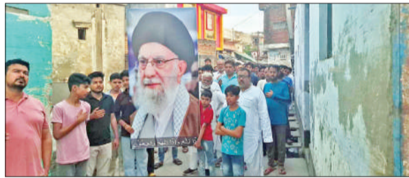
जुलूस निकालते लोग।