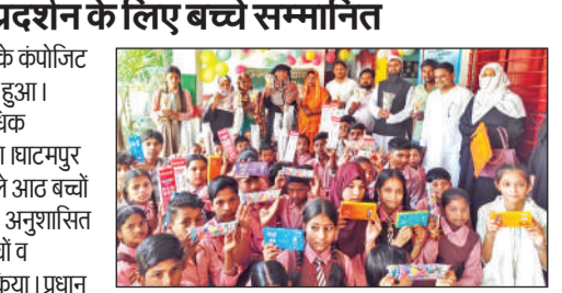
कंपोजिट विद्यालय में उत्कृष्ट प्रदर्शन के लिए बच्चों सम्मानित