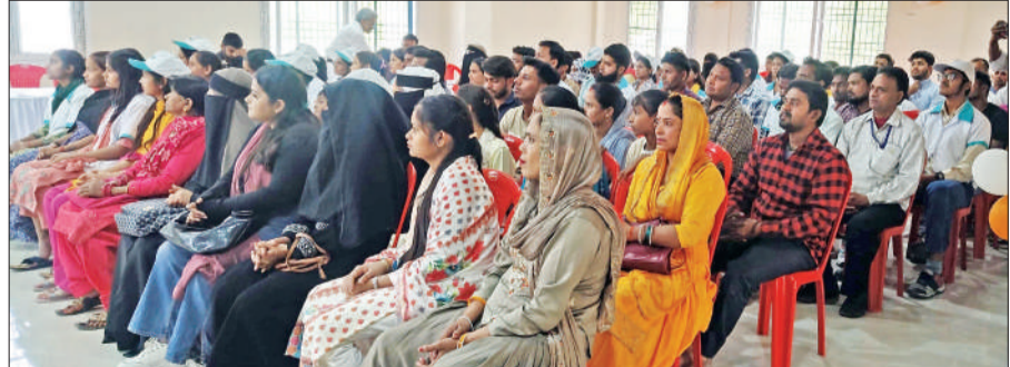
केंद्र पर आयोजित कार्यक्रम में मौजूद युवा।