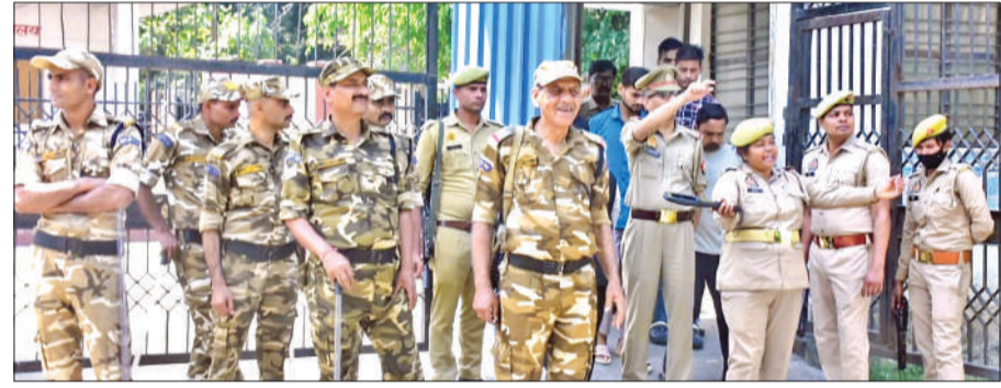
छावनी में तब्दील हुई कचहरी में तेनात फोर्स।

दोषियों को कचहरी स्थित फिंगरप्रिंट यूनिट में ले जाया गया। जहां सभी का