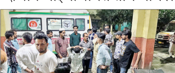
संभल में हादसे के बाद जिला अस्पताल में इकट्ठा घायलों के परिजन।