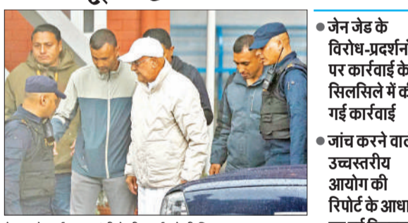
नेपाल के पूर्व प्रधानमंत्री केपी शर्मा ओली गिरफ्तार।

पुलिस ने बताया कि नेपाल कम्युनिस्ट पार्टी-एकीकृत मार्क्सवादी-लेनिनवादी (सीपीएम-यूएमएल) के अध्यक्ष ओली को शनिवार तड़के काठमांडू से 12 किलोमीटर पूर्व भक्तपुर जिले के गुंडू इलाके से गिरफ्तार किया गया। पूर्व गृह मंत्री एवं नेपाली कांग्रेस के नेता रमेश लेखक को भी भक्तपुर जिले की सूर्यविनायक नगरपालिका के कटुंडे स्थित उनके आवास से गिरफ्तार किया गया है। ओली और लेखक को पिछले साल आठ और नौ सितंबर को हुए 'जेन