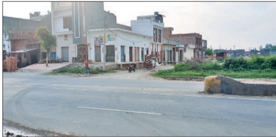
सजा से पहले गांव में पसरा सन्नाटा।