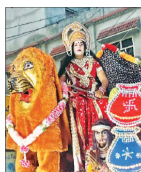
शोभायात्रा में शामिल माता की झांकी।

शोभायात्रा में बाहर से आए कलाकारों ने सुंदर सुंदर झांकियां प्रस्तुत कर दर्शकों को झूमने पर मजबूर कर दिया। शोभायात्रा में डीजे तथा ढोल की थाप पर माता के भजनों पर सैकड़ों भक्त झूमते हुए चल रहे थे। उसके साथ ही माता की विशाल पालकी दर्शकों को मंत्रमुग्ध कर रही थी। माता की पालकी को कंधा देने के लिए श्रद्धालुओं में होड़ लगी हुई थी। शोभायात्रा में भगवान गणेश, भगवान शिव, आयोध्या श्री रामलला, महाकाली, माता दुर्गा, बाबा महाकाल, खादू श्याम आदि की झांकी ने भक्तों को मंत्रमुग्ध कर दिया। शोभायात्रा में दूर दराज के क्षेत्र