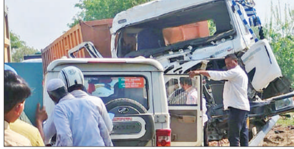
शाहबाद-बिलारी मार्ग पर हादसे के बाद खड़ा क्षतिग्रस्त डंपर।