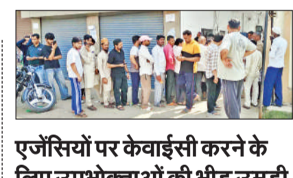
एजेंसियों पर केवाईसी करने के लिए उपभोक्ताओं की भीड़ उमड़ी

हसनपुर, अमृत विचार : नगर की न्यू तुलसी कॉलोनी स्थित चौधरी टीआर मेमोरियल पब्लिक स्कूल के प्रांगण में विद्यालय का परीक्षा फल घोषित किया गया। इस दौरान प्रबंध समिति द्वारा एक कार्यक्रम कथनी आयोजन किया गया। पेंशनर्स को आंदोलन के लिए मजबूर होना पड़ रहा है। बैठक में पेंशनर्स कक्ष के निर्माण में हो रही देरी पर भी नाराजगी जताई गई। इसके अलावा पेंशनर्स दिवस पर उठाई गई समस्याओं के समाधान में देरी को लेकर भी रोष व्यक्त किया गया।