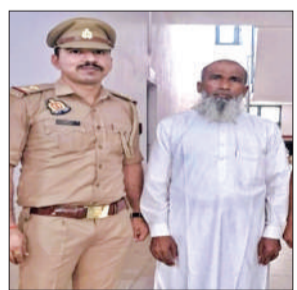
पुलिस की गिरफ्त में लापता हिस्ट्रीशीटर।

अमृत विचार : 21 साल से धर्म बदलकर रह रहे लापता हिस्ट्रीशीटर को पुलिस ने गिरफ्तार कर लिया है। कुंडली खंगालने पर पता चला कि वह संभल जिले में एक संगठन के जिला सचिव के रूप में सक्रिय है। पुलिस ने छानबीन करते हुए मुकदमा पंजीकृत कर कोर्ट में प्रस्तुत किया, जहां से उसे जेल भेज दिया गया।