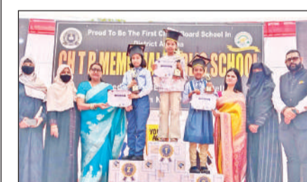
परीक्षा फल एवं ट्रांफी पाकर बच्चों को मिली खुशी