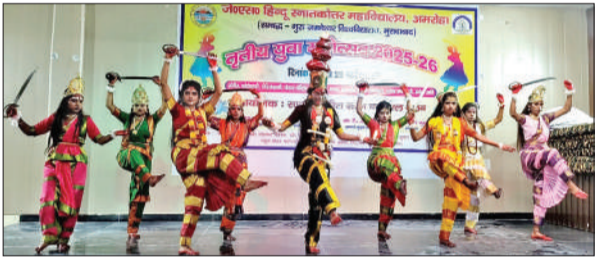
कार्यक्रम में प्रस्तुति देती छात्राएं।

अमृत विचार : जेएस हिन्दू (पीजी) कॉलेज अमरोहा में साहू जगदीशरसन कल्चरल क्लब की ओर से 23 मार्च से चल रहे तृतीय युवा महोत्सव का शनिवार को पुरस्कार वितरण व समापन समारोह के साथ समापन हो गया। कार्यक्रम में छात्र-छात्राओं की प्रतिभा, संस्कृति और सृजनशीलता का शानदार प्रदर्शन देखने को मिला।