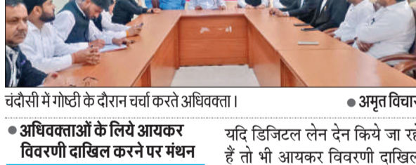
चंदौसी में गोष्ठी के दौरान चर्चा करते अधिवक्ता।