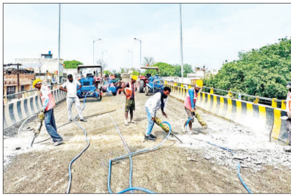
राम रहीम सेतु पर की मरम्मत करते मजदूर।

राम-रहीम पुल बंद होने से ज्वालानगर क्षेत्र की करीब 1 लाख आबादी परेशान है। इसके अलावा आगापुर, अजीतपुर, राजमाता फार्म के लोगों के लिए भी सिविल लाइंस आने-जाने का राम-रहीम पुल ही जरिया है। पुल पर लोगों को आवाजाही 20 मई तक रोक दी गई है। लोगों का कहना है कि पुल की मरम्मत से पहले रेलवे क्रॉसिंग