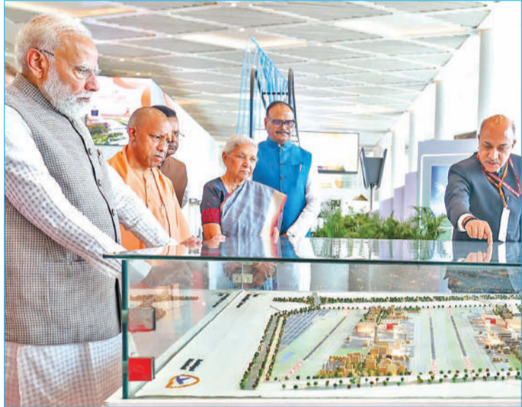
नोएडा अंतर्राष्ट्रीय हवाई अड्डे के उद्घाटन के दौरान प्रधानमंत्री नरेंद्र मोदी व यूपी के मुख्यमंत्री योगी

कहा, उप देश का प्रमुख एविएशन हब बन रहा है। एयरपोर्ट नेटवर्क के विस्तार से कनेक्टिविटी मजबूत हुई है।