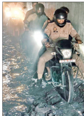
कीचड़ भरे अंडरपास से गुजरते लोग।

पुल पर लंबे समय तक मरम्मत कार्य होना है। इससे पहले लोगों की आवाजाही के लिए वैकल्पिक मार्ग की व्यवस्था करना चाहिए थी। - नासिर