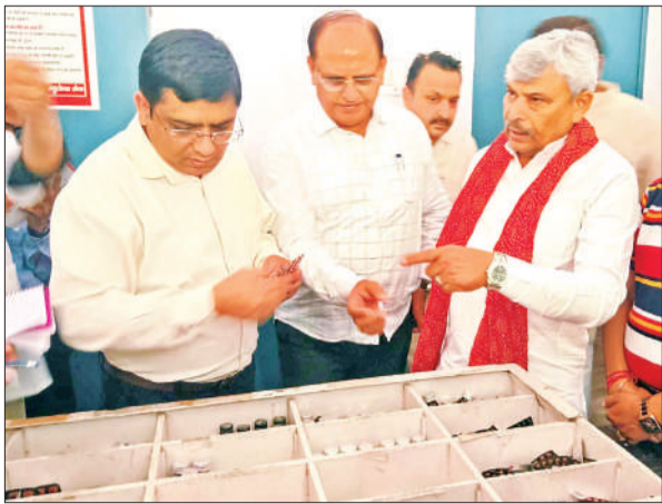
अस्पताल का निरीक्षण करते प्रभारी मंत्री केपी मलिक।

अमृत विचार : प्रभारी मंत्री केपी मलिक ने प्रधानमंत्री आयुष्मान भारत हेल्थ इन्फ्रास्ट्रक्चर मिशन के अंतर्गत बछरायूं स्थित संयुक्त चिकित्सालय में निर्माणाधीन 50 शैय्या क्रिटिकल केयर हॉस्पिटल ब्लॉक का निरीक्षण किया। उन्होंने जायजा लेते अधिकारियों के समक्ष तमाम खामियां निकालीं जिन्हें ठीक कराने के निर्देश दिए।