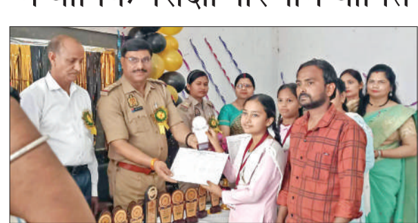
मेधावी छात्राओं को सम्मानित करते मुख्य अतिथि। ● अमृत विचार