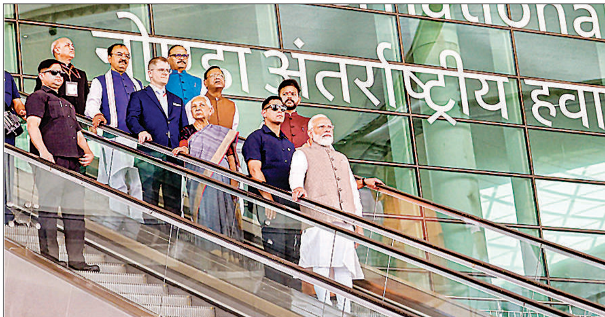
नोएडा इंटरनेशनल एयरपोर्ट के पहले फेज के उद्घाटन कार्यक्रम के लिए पहुंचे प्रधानमंत्री नरेंद्र मोदी, राज्यपाल आनंदी बेन पटेल व अन्य।