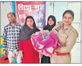
बरामद हुई बच्ची के साथ उसके मां-बाप और पुलिस।

अमृत विचार : जिला महिला अस्पताल से 21 दिन की नवजात चोरी होने का मामला झूठा निकला है। दुधमुंही गायब नहीं हुई थी, बल्कि अब्बू-अम्मी ने बहड़ी के निस्तान दंपती को सौंप दिया था। समाज की नजरों में सच पर परदा डालने को परिवार ने बच्ची चोरी होने की फर्जी कहानी गढ़ दी थी, लेकिन पुलिस और स्वास्थ्य अफसरों के सवालों के आगे झूठ टिक नहीं सका। पुलिस ने बच्ची को सकुशल बरामद कर सीडब्ल्यूसी को सौंप दिया है। बच्ची को दान देने के पीछे दंपती ने तीसरी बेटी पैदा होने और गरीबी में उसका पालन-पोषण नहीं की बात कही है, लेकिन पुलिस झूठी घटना बनाने के मामले में उनके खिलाफ कार्रवाई करने वाली है। एक दिन पहले जिला महिला अस्पताल में उस समय हड़कंप मच गया था, जब पुलिस के पास वहां से बच्ची चोरी होने और मां के बेसुध पड़े मिलने की सूचना आई थी। इज्जतनगर थाना क्षेत्र