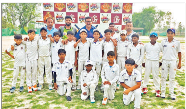
नेक्स्ट जेनरेशन जूनियर हाईट एंड वेट 99 पॉइंट क्रिकेट टूर्नामेंट में विजेता टीम के खिलाड़ी।