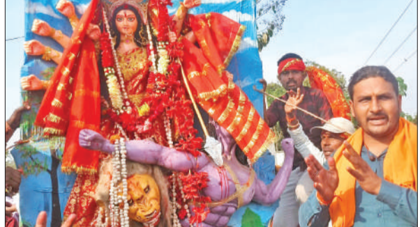
गाजे बाजे के साथ निकली विसर्जन यात्रा में शामिल श्रद्धालु।