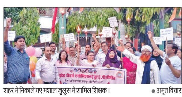
शहर में निकाले गए मशाल जुलूस में शामिल शिक्षक।

अमृत विचार : शांतिभंग की आशंका में किया चालान