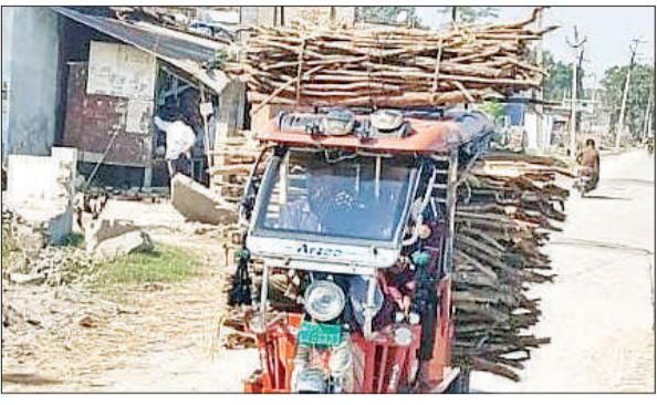
कस्बा सिंगाही में लकड़ी लादकर जा रहा ई-रिक्शा।