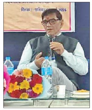
प्रशिक्षण कार्यक्रम को संबोधित करते डीएम।