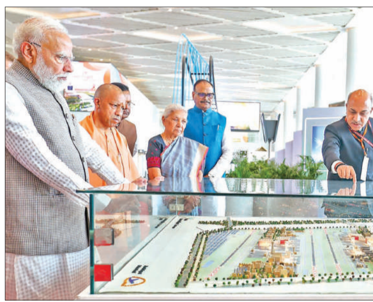
नोएडा अंतर्राष्ट्रीय हवाई अड्डे के उद्घाटन के दौरान प्रधानमंत्री नरेंद्र मोदी व यूपी के मुख्यमंत्री योगी।

अमृत विचार: प्रधानमंत्री नरेंद्र मोदी ने शनिवार को नोएडा इंटरनेशनल एयरपोर्ट के प्रथम चरण का भव्य शुभारंभ किया। इस मौके पर उन्होंने कार्गो टर्मिनल का लोकार्पण व 40 एकड़ में विकसित होने वाली अत्याधुनिक एमआरओ (मेंटेनेंस, रिपेयर एंड ओवरहॉल) सुविधा का शिलान्यास भी किया। प्रधानमंत्री ने इसे 'विकसित भारत-विकसित उत्तर प्रदेश' की दिशा में एक ऐतिहासिक कदम बताते हुए कहा कि यह एयरपोर्ट राज्य के उज्ज्वल भविष्य की नई उड़ान का प्रतीक है। प्रधानमंत्री ने कहा कि जेवर स्थित यह एयरपोर्ट आगरा, मथुरा, मेरठ, अलीगढ़, गाजियाबाद और बुलंदशहर समेत पूरे पश्चिम यूपी के जिलों के विकास को नई गति देगा। इससे किसानों, लघु उद्योगों और युवाओं के लिए नए अवसर सृजित होंगे। उन्होंने किसानों के योगदान को विशेष रूप से सराहते हुए कहा कि उनकी जमीन के सहयोग से यह परियोजना साकार हो पाई है, जिससे कृषि उत्पाद वैश्विक बाजार तक आसानी से पहुंच सकेंगे। कहा, उग्र देश का प्रमुख एविएशन हब बन रहा है। एयरपोर्ट नेटवर्क के विस्तार से कनेक्टिविटी मजबूत हुई है।