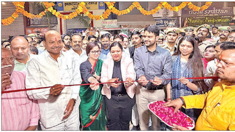
गोला के ऐतिहासिक चैती मेला का फीता काटकर उद्घाटन करते एसपी और सीडीओ।

ढोल-नगाड़े एवं बैंडबाजे के साथ ऐतिहासिक मेले की शुरुआत, मेला मैदान के प्रथम गेट पर की गई पूजा-अर्चना