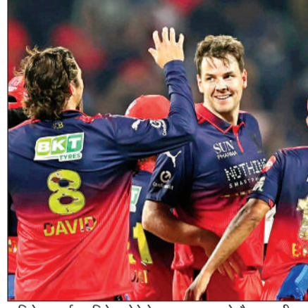
अभिषेक शर्मा का विकेट लेने के बाद जसन्नात जैकब डफी।

देवदत्त पडिक्कल के 26 गेंद में 61 रन और विराट कोहली के नाबाद अर्धशतक की मदद से गत चैम्पियन रॉयल चैलेंजर्स बेंगलुरु ने इंडियन प्रीमियर लीग के 2026 सत्र की शुरुआत शनिवार को सनराइजर्स हैदराबाद पर छह विकेट से जीत के साथ की। पडिक्कल और कोहली (38 गेंद में नाबाद 69) के बीच दूसरे विकेट के लिये सिर्फ 45 गेंद में 101 रन की साझेदारी की मदद से आरसीबी ने जीत के लिये 202 रन के लक्ष्य के जवाब में 15.4 ओवर में चार विकेट पर 203 रन बनाये। फिल साल्ट के जल्दी आउट होने के बाद कोहली और पडिक्कल ने शानदार बल्लेबाजी से एम चिन्नास्वामी स्टेडियम पर दर्शकों का भरपूर मनोरंजन किया। पडिक्कल ने तेज गेंदबाज डेविड पेन के एक ओवर में दो छक्के और एक चौका लगाया जबकि स्पिनर हर्ष दुबे को लगातार चौका छक्का जड़ा। उन्होंने हर्षल पटेल को चौका लगाकर सिर्फ 21 गेंद में अर्धशतक पूरा किया। दूसरी ओर कोहली ने तेज गेंदबाजों जयदेव उनादकट और ऐशान मलिंगा को नसीहत दी। पावरप्ले में आरसीबी ने 76 रन बना लिये थे और सौ रन 8.1 ओवर में बन गए। पडिक्कल को हेनरिच क्लासेन ने पवेलियन भेजा जिन्होंने हर्षल को गेंद पर पहले लांग आन में कोहली का कैच टपकाया था जब वह 28 रन पर थे। कोहली ने 33 गेंदों में अर्धशतक पूरा किया। वहीं आरसीबी के कप्तान रजत पाटीदार ने 12 गेंद में 31 रन बनाये। कोहली ने आखिर में 16वें ओवर में हर्षल की चार गेंदों पर छक्का और तीन चौके लगाकर टीम को जीत