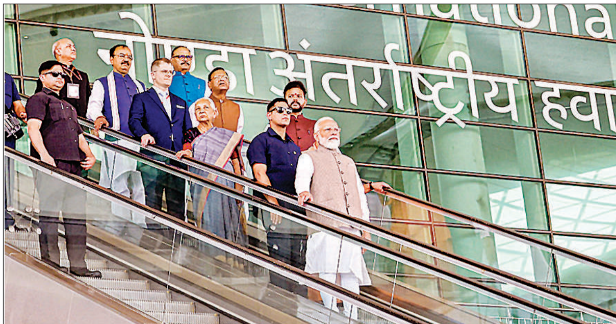
नोएडा इंटरनेशनल एयरपोर्ट के पहले फेज के उद्घाटन कार्यक्रम के लिए पहुंचे प्रधानमंत्री नरेंद्र मोदी, राज्यपाल आनंदी बेन पटेल व अन्य।