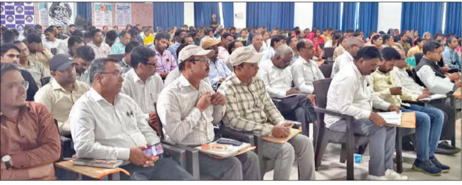
बेनहर पब्लिक स्कूल में हुए प्रशिक्षण कार्यक्रम में मौजूद लोग।