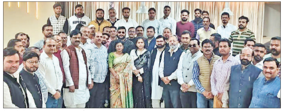
बैठक में मौजूद व्यापार मंडल पदाधिकारी व सदस्य।