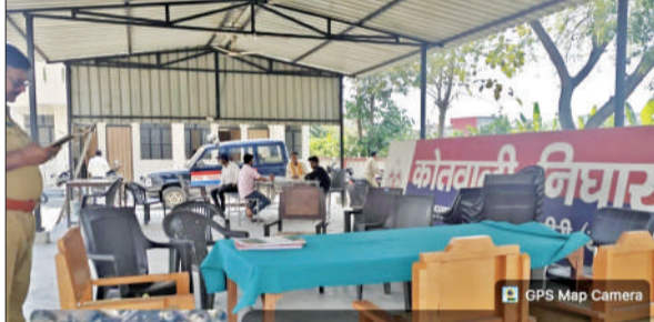
कोतवाली परिसर में खाली पड़ी कुर्सियां।

अमृत विचार : थाना परिसर में आयोजित समाधान दिवस महज औपचारिकता बनकर रह गया। शनिवार को हुए समाधान दिवस में न तो जिम्मेदार अधिकारी पहुंचे और न ही फरियादियों की समस्याओं का समाधान हो सका। खाली पड़ी कुर्सियां ही पूरे आयोजन की हकीकत बयां करती रहीं। जानकारी के अनुसार राजस्व विभाग के पांच लेखपाल तो पहुंचे, लेकिन उन्होंने केवल उपस्थिति रजिस्टर पर हस्ताक्षर किए और बिना किसी सुनवाई के वापस चले गए। अधिकारी न होने के कारण पुलिसकर्मी भी फरियाद सुनने के