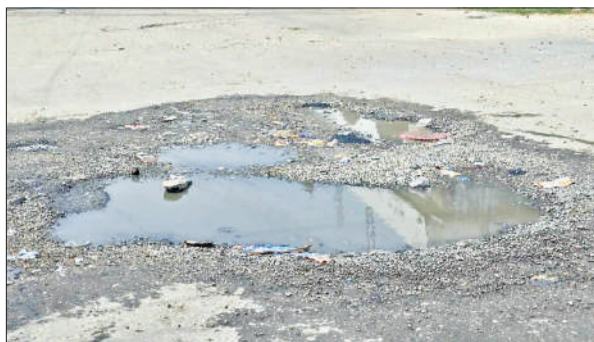
आवास विकास चौराहा पर गड्डे में भरा पानी।

टनकपुर हाईवे शहर से सटकर गुजरा है। कई जगह हाईवे के दोनों तरफ अतिक्रमण की भरमार है। वहीं, बिना पार्किंग के प्रतिष्ठानों की वजह से आवामगमन बाधित रहता है। असम चौराहा से लेकर कचहरी तिराहा तक करीब पांच किमी के हिस्से में कई दुर्घटना बाहुल्य क्षेत्र भी पूर्व में चिह्नित किए जा चुके हैं। सड़क हादसों की बढ़ती संख्या पर शासन