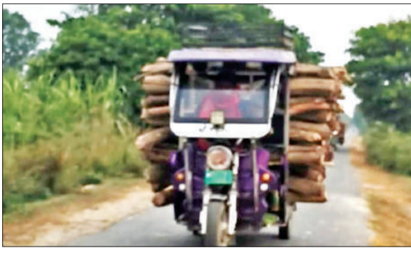
खीरीगढ़ रोड पर लकड़ी भरकर जा रहा ई-रिक्शा।

है। इन पर अत्यधिक भार डालने से ब्रेक सिस्टम कमजोर हो जाता है, टायर फटने का खतरा बढ़ जाता है और वाहन का संतुलन बिगड़ने से पलटने की संभावना कई गुना बढ़ जाती है। इसके बावजूद इन वाहनों का उपयोग छोटे मालवाहक ट्रकों की तरह किया जा रहा है, जो सड़क सुरक्षा मानकों का खुला उल्लंघन है। क्षेत्र में पूर्व में भी ओवरलोड ई-रिक्शा के कारण हादसे हो चुके हैं, जिनमें लोगों की जान तक जा चुकी है। क्षेत्रीय नगरपालिका और सामाजिक संगठनों ने प्रशासन से मांग की है कि इस मुद्दे पर सख्त कार्रवाई की जाए। नियमित चेकिंग अभियान