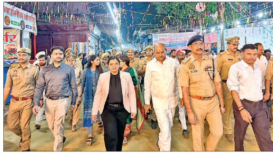
मेले का भ्रमण कर व्यवस्थाएं देखते अतिथि।