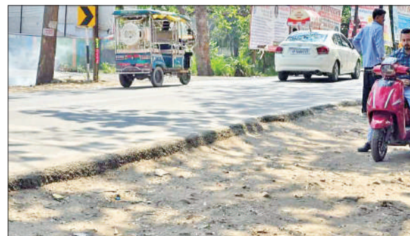
टनकपुर हाईवे पर टीवी अस्पताल के पास पटरी से ऊंची सड़क, जिससे होते हैं हादसे।