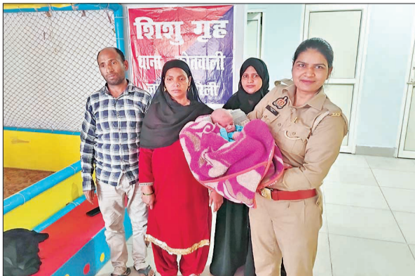
बरामद हुई बच्ची के साथ उसके मां-बाप और पुलिस।