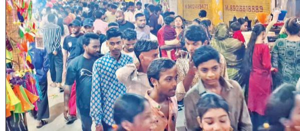
सिकलापुर में मेले में दिखी लोगों की भीड़।

अमृत विचार : श्री रामलाला सभा सिकलापुर की ओर से रामनवमी के उपलक्ष्य में मेला ग्राउंड पर आयोजित मेले में शनिवार देर रात करीब 12.30 बजे रावण का पुतला दहन किया गया। हालांकि, पुतला दहन देखने के लिए भीड़ को काफी इंतजार करना पड़ा। श्री जानकी