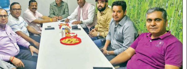
बरेली, अमृत विचार : फ्यूचर विश्वविद्यालय में शनिवार को 'इनविसिएक्स' वेबसाइट का शुभारंभ हुआ।

अमृत विचार : फ्यूचर विश्वविद्यालय में इनविसिएक्स का भव्य शुभारंभ