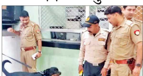
पासपोर्ट कार्यालय के बाहर खड़ी प्रेमनगर पुलिस।