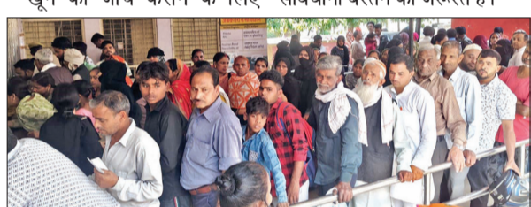
जिला अस्पताल में दवा काउंटर पर लगी मरीजों की कतार।