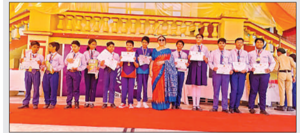
पुस्तकार पाकर खुशी मनाते बच्चे।