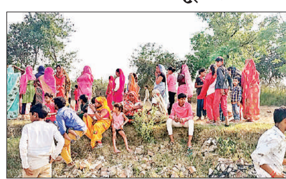
घटनास्थल पर मौजूद ग्रामीण। अमृत विचार