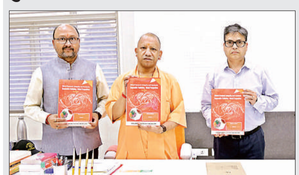
पुस्तक का विमोचन करते मुख्यमंत्री, कुलपति व अन्य।