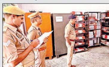
मल्हीपुर थाने का वाषिंक निरीक्षण करते एसपी।