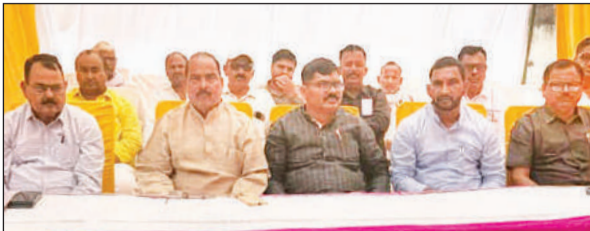
गन्ना समिति मसौधा के प्रांगण में आयोजित सामान्य निकाय की बैठक में समिति के पदाधिकारी।

अमृत विचार : सहकारी गन्ना विकास समिति मसौधा के सामान्य निकाय की बैठक में कई मुद्दों पर विचार किया गया। बैठक में गन्ना खरीद के समय चीनी मिल क्षेत्र के लिए आरक्षित गन्ना किसानों के साथ दोहरा मापदंड अपनाने का भी आरोप लगा है। साथ ही कई अन्य प्रस्ताव पारित किए गए।