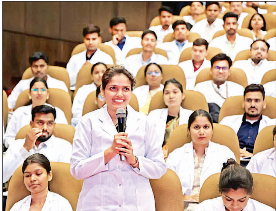
लखनऊ के लोक भवन में आयोजित 665 नर्सिंग अधिकारियों को नियुक्ति पत्र वितरण कार्यक्रम में चयनित अभ्यर्थियों से संवाद करते मुख्यमंत्री योगी आदित्यनाथ।