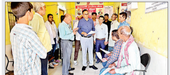
जन आरोग्य मेले का निरीक्षण करते सीएमओ और अन्य।