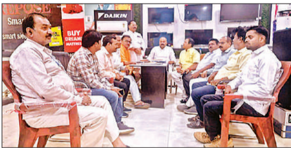
बैठक कर व्यापारियों की समस्याओं पर विचार करते जिलाध्यक्ष।

संवाददाता, सुलतानपुर, अमृत विचार : अमृत विचार: वर्षों की लगातार मेहनत और प्रयास के बाद गोमती मित्र मंडल समिति का सपना साकार होता नजर आ रहा है। पिछले 13 वर्षों से सीता कुंड धाम के विकास और गोमती नदी के संरक्षण को लेकर सक्रिय गोमती मित्रों ने अंततः अपनी मुहिम में सफलता प्राप्त की है। बताया जाता है कि समिति ने लंबे समय तक विभिन्न जनप्रतिनिधियों और अधिकारियों से संपर्क कर सीता कुंड धाम के सुंदरीकरण और गोमती कॉरिडोर के निर्माण की मांग उठाई थी। वर्ष 2022 में विधायक के रूप में विनोद सिंह के निर्वाचित होने के बाद एक बार फिर उम्मीद जगी। गोमती मित्रों के अनुरोध पर विधायक ने मामले को गंभीरता से लेते हुए शासन स्तर पर प्रस्ताव भेजा और मुख्यमंत्री से लगातार प्रयास कर लगभग पांच करोड़ रुपये की स्वीकृति दिलाई। रविवार को इस उपलब्धि पर खुशी जाहिर करते