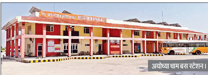
अयोध्या धाम बस स्टेशन।

विकास के क्रम में योगी आदित्यनाथ के निर्देश पर एनएच-27 पर माझा बरहटा के पास इस बस स्टेशन का निर्माण शुरू कराया था। करीब सात एकड़ भूमि पर 14 करोड़ की लागत से इस बस स्टेशन का निर्माण जून 2021 में पूर्ण हुआ। इसके बाद औपचारिक रूप से इसके संचालन की भी घोषणा कर दी गई, लेकिन हाईवे