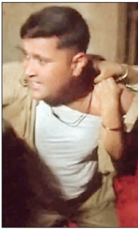
सिपाही से मारपीट करते लोग (सोशल मीडिया पर वायरल वीडियो का स्क्रीनशॉट)।