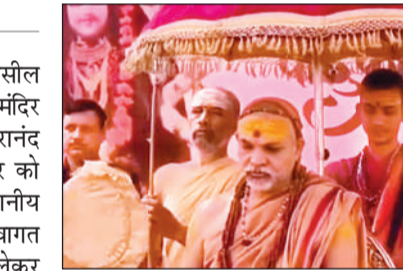
टांडा तहसील क्षेत्र स्थित गोवर्धनपुर के मां सिद्धेश्वरी मंदिर में शंकराचार्य स्वामी अविमुक्तेश्वरानंद सरस्वती व अन्य।

अमृत विचार। जनपद के टांडा तहसील क्षेत्र स्थित गोवर्धनपुर के मां सिद्धेश्वरी मंदिर में शंकराचार्य स्वामी अविमुक्तेश्वरानंद सरस्वती का आगमन हुआ। रविवार को इस अवसर पर श्रद्धालुओं और स्थानीय निवासियों ने उनका गर्मजोशी से स्वागत किया। शंकराचार्य के आगमन को लेकर मंदिर परिसर में बड़ी संख्या में भक्त एकत्रित हुए, जिससे पूरे क्षेत्र में एक धार्मिक और आध्यात्मिक वातावरण निर्मित हो गया।