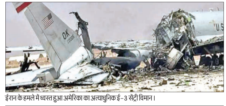
ईरान के हमले में ध्वस्त हुआ अमेरिका का अत्याधुनिक ई-3 सेंटी विमान।

दुबई, एजेंसी पश्चिम एशिया में एक माह से जारी संघर्ष के बीच अमेरिका के लगभग 2,500 मरीन सैनिक युद्ध क्षेत्र में पहुंच गए हैं और इसके साथ ही यहां पिछले दो दशकों में अमेरिका की सबसे बड़ी सैन्य तैनाती हो गई है। इसके अलावा, 82वीं 'एयरबोर्न डिवीजन' के 1,000 'पैराट्रूपर्स' को भी पश्चिम एशिया भेजने का आदेश दिया गया है, जो दुश्मन के इलाके में उतरकर अहम ठिकानों और हवाई पट्टियों को सुरक्षित करने में सक्षम हैं। वहीं, ईरान ने शुक्रवार को सऊदी अरब के प्रिंस सुल्तान एयर बेस पर मिसाइल और ड्रोन से बड़ा जवाबी हमला किया। ईरानी मीडिया का दावा है कि इस हमले में अमेरिका का अत्याधुनिक ई-3 सेंटी विमान काफी हद तक नष्ट हो गया। अमेरिका के विदेश मंत्री मार्को