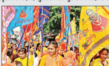
खाटू श्याम निशान यात्रा निकालते भवत।

कानीबोझी (श्रावस्ती), अमृत विचार। हरिहरपुररानी ब्लॉक मुख्यालय भंगाहा बाजार में रविवार को शिव मंदिर से भंगाहा बाजार होते हुए प्रहलादा खाटू श्याम मंदिर प्रहलादा तक द्वितीय खाटू श्याम निशान यात्रा निकाली गई। इसमें महिला व बच्चों सहित सैकड़ों की संख्या में श्रमण प्री शामिल हुए। लोग अपने हाथों में निशान खाटू श्याम निशान यात्रा निकालते भवत।