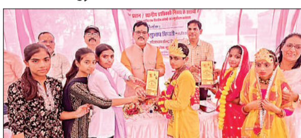
बच्चों को सम्मानित करते मुख्य अतिथि व मौजूद अन्य।