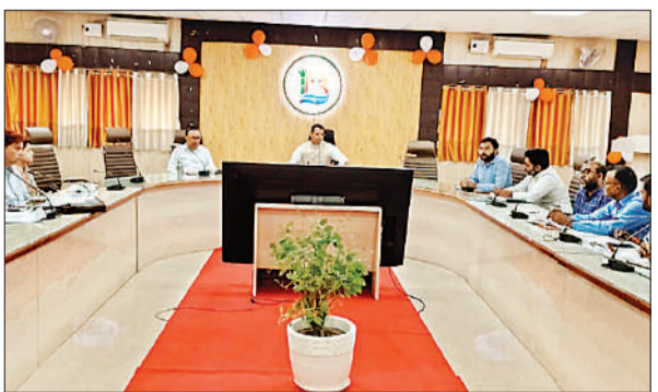
बैठक में मौजूद डीएम और अन्य अधिकारी।