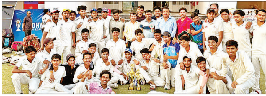
राज्य आमंत्रण पुरुष क्रिकेट प्रतियोगिता की विजेता व उपविजेता टीम कप के साथ।