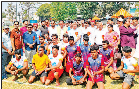
खिलाड़ियों के साथ मुख्यअतिथि व मौजूद अन्य लोग।