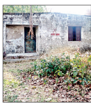
लम्हुइया गांव में बना आंगनबाड़ी केंद्र भवन हो गया बदहाल। अमृत विचार

जमुनाहा विकास क्षेत्र के ग्राम पंचायत देवरनिया के मजरा लम्हुइया गांव में बने आंगनबाड़ी केंद्र के भवन पर जर्जर भवन का सांकेतिक लाल चिन्ह लगा दिया गया है। देखा जाए तो इसकी दीवार अभी सही है। ग्रामीणों का कहना है कि यदि भवन का छत तोड़कर नया छत डलवा दिया जाए