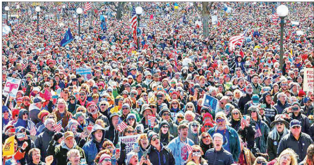
अमेरिका के सेंट पॉल में 'नो किंग्स' मार्च के दौरान मिनेसोटा स्टेट कैपिटल के बाहर नारे लगाते प्रदर्शनकारी।