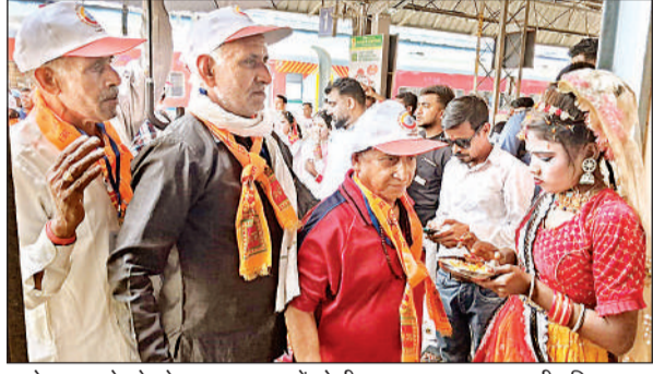
अयोध्या धाम रेलवे स्टेशन पर श्रद्धालुओं को टीका लगाकर स्वागत करती महिला।