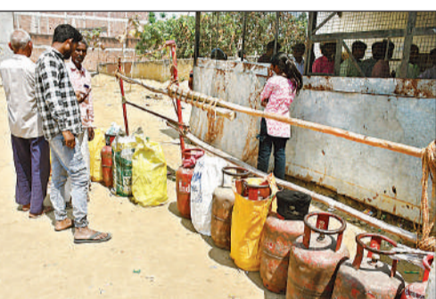
सिलेंडर लेने के लिए लाइन में लगे लोग।