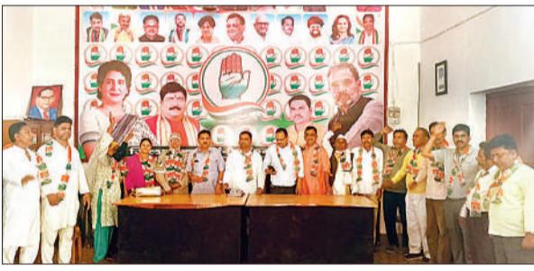
जिला कार्यालय में बैठक करते कांग्रेस कार्यकर्ता।

दो दिवसीय परीक्षा के पहले दिन शनिवार को विद्यापीठ मैदान में प्रायोगिक परीक्षा आयोजित की गई, जिसमें कैडेट्स का फुट ड्रिल, वेपन ट्रेनिंग, मी रीडिंग, फोल्ड क्राफ्ट और बैटल क्राफ्ट का परीक्षण किया गया। वहीं दूसरे दिन लिखित परीक्षा कॉलेज परिसर में सम्पन्न हुई। पूरे आयोजन के दौरान अनुशासन, सुरक्षा और गोपनीयता को सर्वोच्च प्राथमिकता दी गई। परीक्षा सीसीटीवी कैमरों की निगरानी में कराई गई। प्रवेश-निकास, बैठने की व्यवस्था, प्रश्न पत्र वितरण और उत्तर पुस्तिका संग्रहण तक हर चरण पर कड़ी नजर रखी गई।