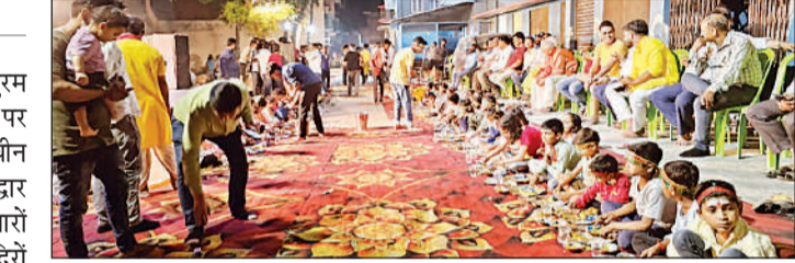
रुदौली के शिवपुरम में भंडारे में प्रसाद ग्रहण करते श्रद्धालु।

अमृत विचार : रुदौली नगर के शिवपुरम (पूरे काजी) में चैत्र मास की दशमी पर श्रद्धा एवं भक्ति का संगम रहा। प्राचीन श्रीरामेश्वर धाम मंदिर के पुनरुद्धार वार्षिकोत्सव का आयोजन हुआ। हजारों श्रद्धालुओं की भीड़ उमड़ी। दो भव्य मंदिरों की आभा के बीच आयोजित इस उत्सव ने समूचे क्षेत्र को भक्तिमय कर दिया।