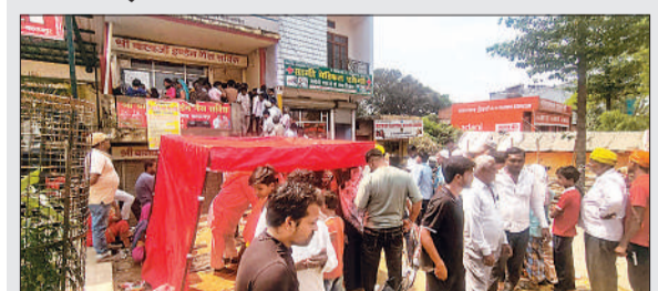
गैस एजेंसी पर लगी उपभोक्ताओं की भीड़।