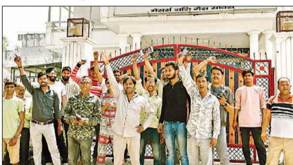
सिलेंडर न मिलने पर एजेंसी के बाहर प्रदर्शन करते लोग।

जिले में भले ही पेट्रोल डीजल का संकट खत्म हो गया हो, लेकिन सिलेंडर की किल्लत अभी भी जारी है। योजना गैस एजेंसियों व गोदामों में लोगों की भीड़ उमड़ रही है।