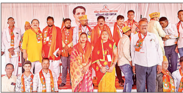
प्रशिक्षण कार्यक्रम में शामिल भाजपा कार्यकर्ता।