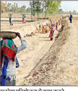
मनरेगा परियोजना में काम करते मजदूर (फाइल फोटो)

अमृत विचार : नए वित्तीय साल में वीबी जी राम जी (विकसित भारत-रोजगार और आजीविका मिशन ग्रामीण) की तैयारी तेज है। इसकी पृष्ठभूमि में जिले में मनरेगा की शुरुआत से वित्तीय साल 2024-25 तक की लगभग 15 हजार अधूरी परियोजनाओं को पूरा करने पर फोकस है। मनरेगा के तहत कार्यों की नई आईडी जनरेट नहीं की जा रही है। परियोजनाओं पर मजदूरों की संख्या भी कम हो