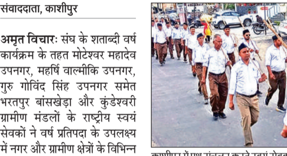
काशीपुर में पथ संचलन करते स्वयंसेवक। ● अमृत विचार

स्वयं सेवकों ने रामपुरम कॉलोनी स्थित अटल पार्क में एकत्र होकर पथ संचलन में भाग लिया। साथ ही ग्रामीण मंडलों में भी जगह-जगह पथ संचलन के कार्य आयोजित किए गए। सभी जगह बौद्धिक सत्र के दौरान मुख्य वक्ताओं ने संघ के सौ वर्षों के इतिहास और उपलब्धियों की जानकारी देते हुए समग्र हिंदू समाज को संगठित और एकजुट होने पर विशेष जोर दिया। इसके साथ ही वक्ताओं ने पंच परिवर्तन के तहत