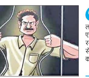
हैं और कहाँ से अपराध का रिपोर्ट संचालित कर रहे हैं। कुमाऊं के छह जिलों में अपराध नियंत्रण के उद्देश्य और अपराधों की श्रेणी के हिसाब से बड़ी संख्या में बदमाशों की हिस्ट्रीशीट खोली गई। दिसंबर 2025 तक के आंकड़ों के अनुसार, कुल हिस्ट्रीशीटों में सबसे अधिक 482 ऊधमसिंह नगर में हैं जबकि नैनीताल

अमृत विचार : कुमाऊं में आदतन अपराधियों पर शिकंसा कसने के लिए पुलिस ने बड़े पैमाने पर हिस्ट्रीशीटर तो खोलीं लेकिन उनकी निगरानी में फेल साबित हुई। इस गंभीर लापरवाही का नतीजा यह रहा कि 783 हिस्ट्रीशीटर वाले कुमाऊं मंडल से 84 हिस्ट्रीशीटर लापता हो गए हैं। ये वो हिस्ट्रीशीटर हैं जो पुलिस रिपोर्ट में तो मौजूद हैं, लेकिन धरातल पर लापता हैं और इनका पता कहीं नहीं है कि ये कहाँ छिपे