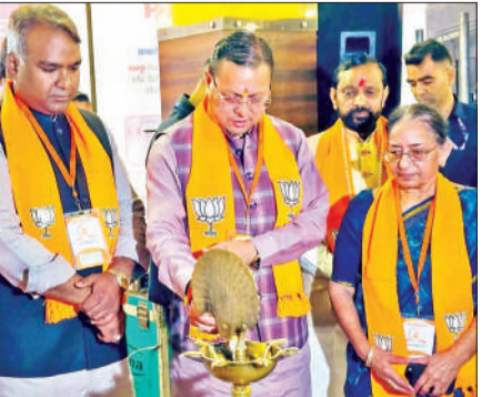
भाजपा प्रशिक्षण वर्ग कार्यशाला का शुभारंभ करते मुख्यमंत्री धामी। का नेता कैसे कहा जा सकता है। मुख्यमंत्री ने कांग्रेस पर तंज कसने के साथ सलाह दी कि अपना ही माल समेट लो। उन्होंने कांग्रेस पर झूठा नैरेटिव फैलाने का आरोप लगाते हुए कहा कि बार-बार उन्हीं लोगों को शामिल किया जा रहा है, जिन्हें बार-बार बाहर कर दिया जाता है।

अमृत विचार: मुख्यमंत्री पुष्कर सिंह धामी ने रविवार को पं. दीनदयाल उपाध्याय प्रशिक्षण महाअभियान के अंतर्गत देहरादून महानगर जिले के प्रशिक्षण वर्ग को संबोधित किया। मुख्यमंत्री ने 'भाजपा सरकार की उपलब्धियां एवं गरीब कल्याण योजनाएं' विषय के सत्र को संबोधित करते हुए कहा कि विपक्ष के पास मुद्दे नहीं हैं और ये अफवाह फैला रहे हैं। जिन लोगों के बारे में दावा किया जा रहा है कि वे भाजपा छोड़कर कांग्रेस में गए हैं, उनमें से कोई भी वर्तमान में भाजपा का सदस्य था ही नहीं। कोई पांच साल पहले तो कोई 10 साल पहले पार्टी से निष्कासित हो गया था तो कोई चुनाव लड़कर तो भ्रष्टाचार में बाहर हो गया था तो उन्हें भाजपा