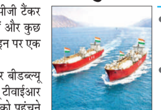
देश शत्रु नहीं हैं उनके जहाज ईरानी अधिकारियों के साथ समन्वय के बाद इस मार्ग से निकल सकते हैं। इससे पहले चार भारतीय झंडे वाले एलपीजी टैंकर सुरक्षित रूप से इस मार्ग से निकल चुके हैं।

काठमांडू। नेपाल की नवगठित सरकार ने अपनी महत्वाकांक्षी 100 सूत्री कार्य योजना के तहत पूर्व प्रधानमंत्रियों की संपत्तियों की जांच के लिए एक आयोग का गठन किया है। इस समिति में कानून, वित्त, राजस्व और अनुसंधान के विशेषज्ञ शामिल हैं। सीआईएए प्रधानमंत्री और मंत्रिमंडल के अधीन कार्य करेगा। पहले चरण में, 2006 की नेपाल क्रांति के बाद सार्वजनिक पदों पर आसीन सभी लोगों की जांच की जाएगी और आयोग 15 दिनों के भीतर जांच पूरी करेगा। इसके बाद सरकार चार पूर्व प्रधानमंत्रियों - शेर बहादुर देउबा, केपी शर्मा ओली, प्रचंड और माधव कुमार को जांच शुरू करेगी।