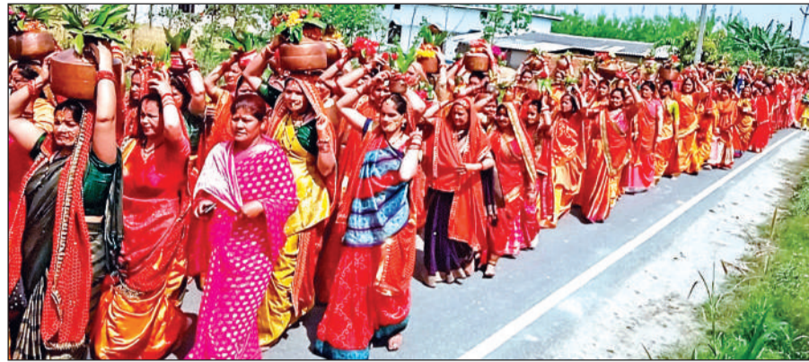
शांतिपुरी में राम कथा के आयोजन पर कलश यात्रा निकालती महिलाएं।