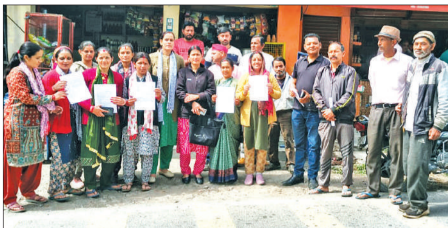
कालाढूंगी-नैनीताल मोटर मार्ग के मंगोली बाजार में शराब की दुकान के विरोध में प्रदर्शन करते जनप्रतिनिधि व महिलाएं।

अमृत विचार: कालाढूंगी-नैनीताल मोटर मार्ग पर नलनी-घटगढ़ से चारखेत के बीच प्रस्तावित शराब की दुकान के खिलाफ न्याय पंचायत खुर्पाताल क्षेत्र में महिलाओं और जनप्रतिनिधियों ने मोर्चा खोल दिया है। रविवार को मंगोली क्षेत्र में एकत्रित होकर महिलाओं और जनप्रतिनिधियों ने जोरदार नारेबाजी करते हुए दुकान खोलने पर तत्काल रोक लगाने की मांग की। महिलाओं का कहना है कि क्षेत्र में शराब की दुकान खुलने पर नैनीताल पर भी बुरा असर पड़ेगा। जिससे उनका भविष्य खतरों में है। प्रदर्शनकारियों ने कहा कि पर्वतीय क्षेत्रों में लगातार शराब की दुकानों के खुलने की खबरों से लोगों में सरकार के प्रति आक्रोश बढ़ रहा है। मंगोली, बजुन, अधौड़ा, नलनी, जलालगांव और खमारी सहित आसपास के गांवों से पहुंची महिलाओं ने एक स्वर में इस निर्णय का विरोध किया।