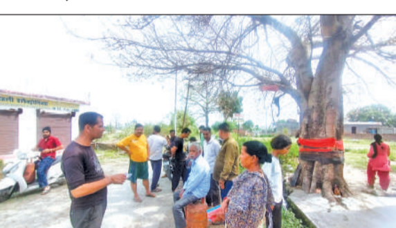
गौलापार के बागजाला में गैस सिलेंडर के वाहन का इंतजार करते लोग।

रविवार को गौलापार क्षेत्र में रामपुर रोड स्थित ज्वाला गैस एजेंसी की ओर से सिलेंडरों की आपूर्ति की गई, लेकिन वाहन के देर से पहुंचने पर लोगों में नाराजगी देखने को मिली। बागजाला और कुंवरपुर क्षेत्र में लोग सुबह से ही सिलेंडर लेकर काफी देर तक इंतजार करते रहे। दोपहर तक वाहन नहीं पहुंचने पर उपभोक्ताओं