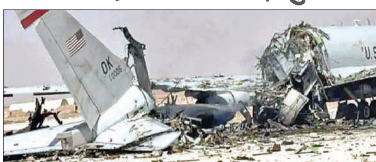
ईरान के हमले में ध्वस्त हुआ अमेरिका का अत्याधुनिक ई-3 सेंटी विमान।