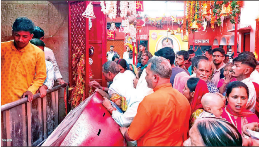
काशीपुर में मां बाल सुंदरी देवी के दर्शन करते श्रद्धालु।