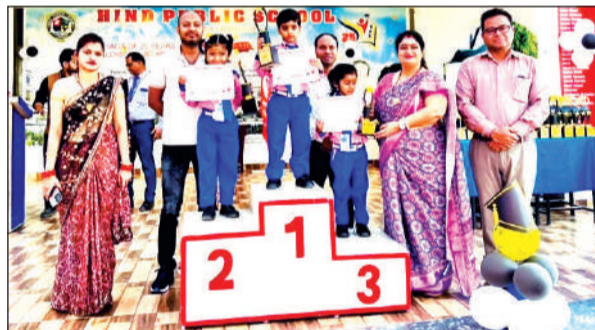
हिंद पब्लिक स्कूल में परीक्षाफल वितरण कार्यक्रम में बच्चों को पुरस्कृत करता प्रबंधन।