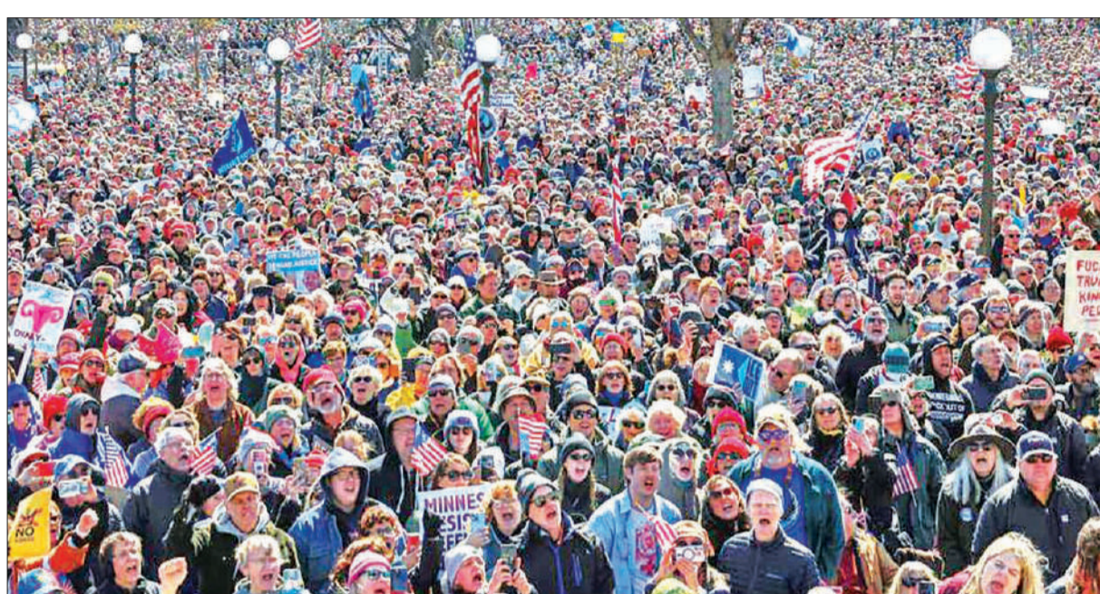
अमेरिका के सेंट पॉल में 'नो किंग्स' मार्च के दौरान मिनेसोटा स्टेट कैपिटल के बाहर नारे लगाते प्रदर्शनकारी।

सोमवार, 30 मार्च 2026, वर्ष 6, अंक 33, पृष्ठ 14 मूल्य 6 रुपये