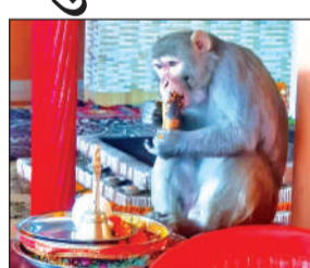
जगदंबा मंदिर में रामकथा के समापन पर पहुंचा वानर प्रसाद ग्रहण करता हुआ।