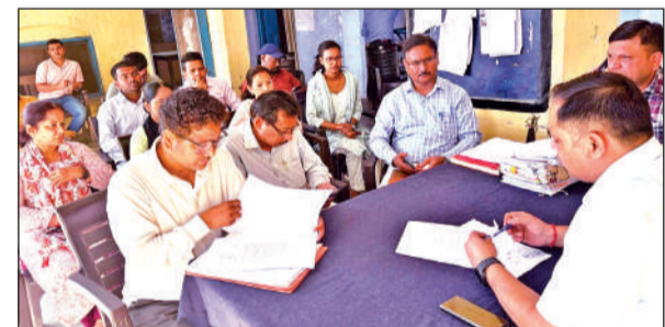
किच्छा तहसील में लोक अदालत के दौरान उपस्थित अधिकारी एवं अन्य।