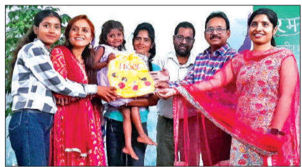
तारा बाल संस्था में आयोजित प्रतियोगिता की विजेता को पुरस्कृत करते आयोजक।