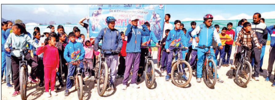
छ्मनियां स्पोर्ट्स स्टेडियम में साइकिल रैली में शामिल प्रतिभागी।

व्यापारियों का कहना है कि इस व्यवस्था से प्राप्त राशि टीपी नगर अनुश्रवण समिति को जाती है, जो क्षेत्र के संचालन और रखरखाव का कार्य करती है। ऐसे में नए टैक्स लगाने से पहले सभी पक्षों के साथ विचार-विमर्श जरूरी है।