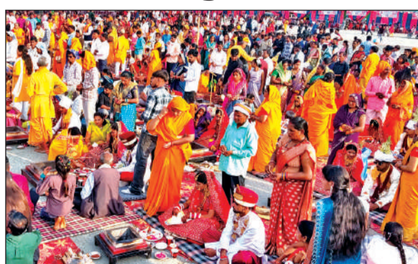
किच्छा में आयोजित विवाह कार्यक्रम में नव विवाहित जोड़े एवं परिवारजन।

अमृत विचार: अमर ज्योति सेवा संस्था के तत्वावधान में 51 निर्धन कन्याओं का सामूहिक विवाह कार्यक्रम विधि विधान से मंत्रोच्चारण के साथ संपन्न हुआ। इस दौरान घोड़ा बग्गी पर सवार 51 दूल्हों की विशाल बारात मुख्य मार्ग से होती हुई कार्यक्रम स्थल पर पहुंची। कार्यक्रम स्थल पर आर्य समाज के विद्वान पंडित पुरोहितों द्वारा हवन यज्ञ एवं पूजा अर्चना कर 51 जोड़ों का विवाह संपन्न कराया गया। अमर ज्योति सेवा संस्था के तत्वावधान में पूर्व निर्धारित कार्यक्रम के तहत नगर के हल्द्वानी मार्ग स्थित रेलवे स्टेशन के निकट से करीब 1 किलोमीटर लंबी बारात