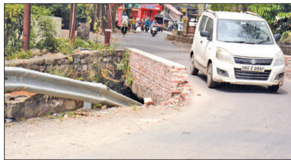
एसटीएच के पास फायर स्टेशन को जाने वाली रोड पर टूटी क्रेश बैरियर की दीवार।

बताते चलें कि बीते वर्ष यहां एक कार अनियंत्रित होकर नहर में गिर गई थी। इस हादसे में एक नवजात बच्चे समेत परिवार के कई लोगों