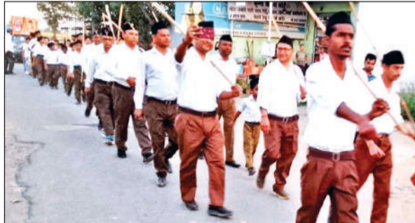
दिनेशपुर के चक्कीमोड़ में पथ संचलन करते स्वयंसेवक।

रविवार की सायं राष्ट्रीय स्वयंसेवक संघ (आरएसएस) ने रामलीला मैदान चक्कीमोड़ में आयोजित कार्यक्रम के बाद चक्कीमोड़ में पथ संचलन निकाला गया। इस दौरान अपने बौद्धिक में मुख्य वक्ता जिला प्रचारक भारत ने कहा कि संघ राष्ट्र निर्माण के कार्य में जुटा है। उन्होंने कहा की भारत की संस्कृति का गौरवमय इतिहास रहा है। खंड गदरपुर की ओर से रामलीला मैदान चक्कीमोड़ से पथ संचलन की शुरुआत हुई। जो मुख्य