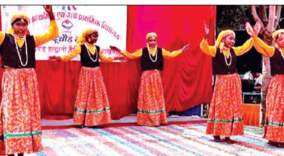
राष्ट्रीय दिना में आयोजित वार्षिकोत्सव उमंग कार्यक्रम के दौरान प्रस्तुति देती छात्राएं।