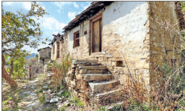
गाडियूड़ा में पलायन के बाद खाली पड़े घर और आसपास उगी झाड़ियाँ। • अमृत विचार

अमृत विचार: सरकारें भले ही रिवर्स पलायन और गांवों को पर्यटन से जोड़ने के दावे कर रही हों, लेकिन जमीनी हकीकत कुछ और ही कहानी बयां कर रही है। नैनीताल जिले के धारी ब्लॉक का गाडियूड़ा गांव आज पूरी तरह खंडहर में तब्दील हो चुका है। कमी 500 से अधिक परिवारों की चहल-पहल से गुलजार रहने वाला यह गांव अब सन्नाटे में डूबा हुआ है। टूटी छतें, जर्जर दीवारों और बंद दरवाजों पर लटकते ताले इस गांव के उजड़ने की कहानी खुद बयां करते हैं। गांव की पगडंडियों से जो लोग रोजगार, शिक्षा और बेहतर जीवन