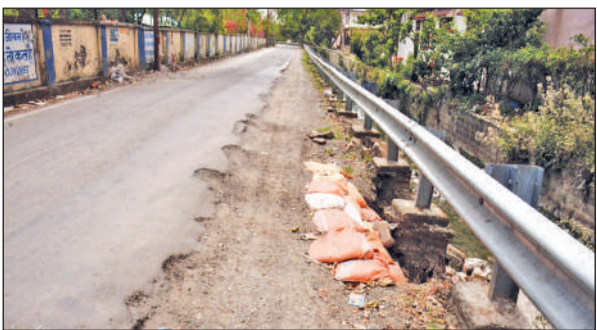
रामपुर रोड से फायर स्टेशन को जाने वाली सड़क में नहर से हुआ कटाव।

लेकिन वर्तमान हालात बताते हैं कि स्थिति फिर पहले जैसी ही होती जा रही है। नहर किनारे दो स्थानों पर कटाव के कारण क्रेश बैरियर