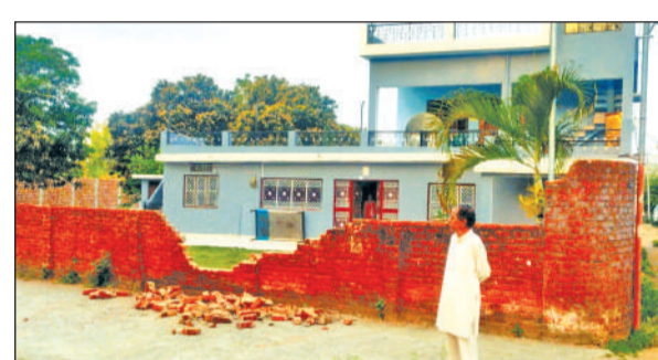
रामनगर के कंचनपुर छोई में हाथी द्वारा तोड़ी गई घर की दीवार।