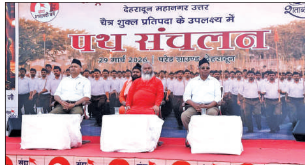
देहरादून परेड ग्राउंड में बौद्धिक कार्यक्रम में मौजूद संघ के वरिष्ठ पदाधिकारी।

चैत्र शुक्ल प्रतिपदा व आरएसएस के शताब्दी वर्ष पर परेड ग्राउंड में रविवार को उत्तर महानगर के स्वयंसेवकों के बौद्धिक में प्रांत प्रचार प्रमुख ने कहा कि वर्तमान में विश्व अनेक चुनौतियों का सामना कर रहा है, ऐसे में भारत की सांस्कृतिक विरासत और जीवन दृष्टि मार्गदर्शक की भूमिका निभा सकती है। उन्होंने समाज में एकता, समरसता और सांस्कृतिक मूल्यों को सुदृढ़ करने पर जोर देते कहा कि राष्ट्र के विकास और सशक्तिकरण के लिए आवश्यक है कि समाज अपने मूल्यों और परंपराओं से जुड़ा रहे। उन्होंने स्वयंसेवकों से आह्वान किया कि,