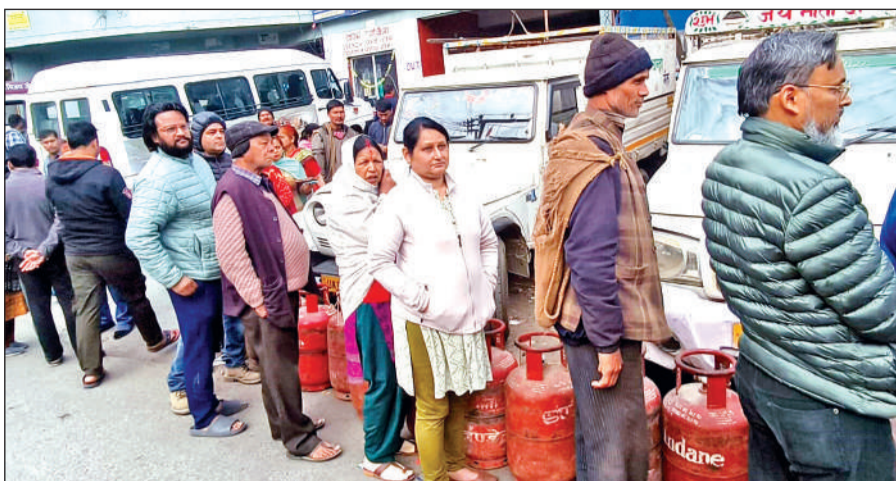
अल्मोड़ा शिखर तिराहे के पास गैस सिलेंडर लेने के लिए लगी लोगों की भीड़। • अमृत विचार

गैस एंजंसी की ओर से रसोई सिलेंडर के लिए घंटों लाइन में लगकर लोगों को मायूस न लौटना पड़े इसके लिए प्रशासन ने वरीयता के आधार पर एक दिन पहले ही उपभोक्तों की सूची चप्पा करने का नियम बनाया है। इसी के तहत रविवार को शिखर तिराहे के पास गैस बांटी गई। इस दौरान उमड़े लोगों के हुजूम को नियंत्रित करने के लिए पुलिस कर्मी भी तैनात रहे। भीड़ नियंत्रित हुई तो एंजंसी कर्मियों ने तय सूची के मुताबिक 170 लोगों को ही सिलेंडर वितरित करने की प्रक्रिया शुरू कर दी। रविवार को सिलेंडर बांटने के बाद भी कुछ लोगों को बिना गैस लिए वापस लौटना पड़ा। इधर, गैस एंजंसी की ओर से बताया कि गैस वरीयता के आधार पर नियमित सिलेंडर बांटे जा रहे हैं।