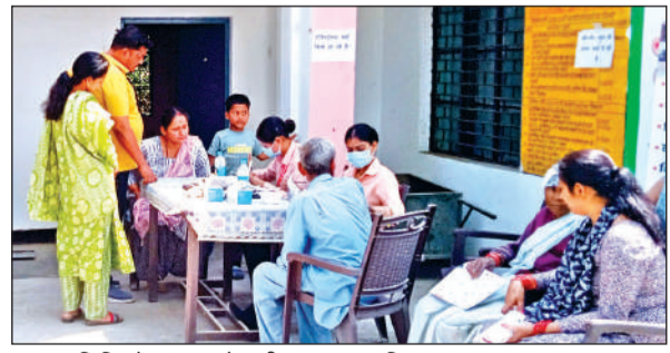
स्वास्थ्य शिविर में जांच कराते ग्रामीण। • अमृत विचार

अमृत विचार: शांतिपुरी नंबर दो सैनिक भवन परिसर में पूर्व सैनिक संगठन शांतिपुरी द्वारा आयोजित निशुल्क स्वास्थ्य शिविर में रविवार को क्षेत्रीय लोगों की अच्छी खासी भीड़ देखने को मिली। शिविर में कुल 114 लोगों ने विभिन्न रोगों की जांच एवं उपचार कराकर स्वास्थ्य लाभ लिया।