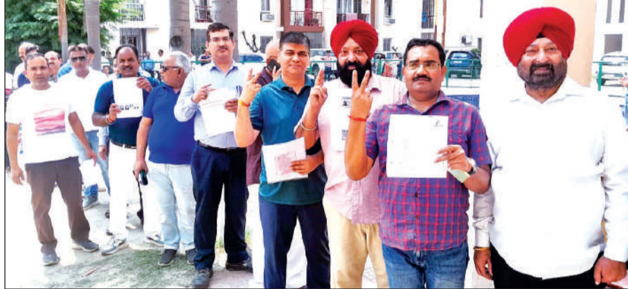
मतदान करने के लिए कतार में लगे सोसाइटी के लोग। • अमृत विचार