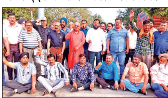
हल्लानी में मांगों को लेकर विरोध-प्रदर्शन करते टीपी नगर के व्यापारी।