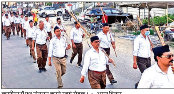
काशीपुर में पथ संचलन करते स्वयंसेवक।

स्वयं सेवकों ने रामपुरम कॉलोनी स्थित अटल पार्क में एकत्र होकर पथ संचलन में भाग लिया। साथ ही ग्रामीण मंडलों में भी जगह-जगह पथ संचलन के कार्य आयोजित किए गए। सभी जगह बौद्धिक सत्र के दौरान मुख्य वक्ताओं ने संघ के सौ वर्षों के इतिहास और उपलब्धियों की जानकारी देते हुए समग्र हिंदू समाज को संगठित और एकजुट होने पर विशेष जोर दिया। इसके साथ ही वक्ताओं ने पंच परिवर्तन के तहत