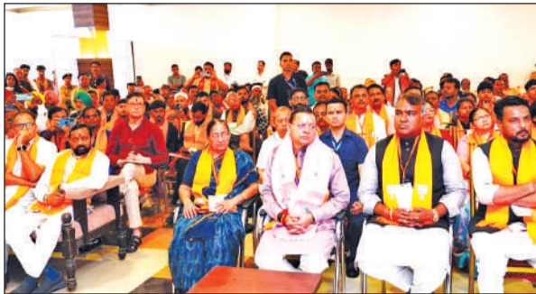
प्रधानमंत्री मोदी के मन की बात कार्यक्रम को सुनते मुख्यमंत्री धामी एवं जनप्रतिनिधि।

देहरादून के निजी होटल में आयोजित आयोजन के दौरान मुख्यमंत्री ने उपस्थित जनप्रतिनिधियों एवं नागरिकों के साथ कार्यक्रम के विभिन्न पहलुओं पर विचार साझा किए। मुख्यमंत्री ने कहा कि 'मन की बात' कार्यक्रम प्रधानमंत्री नरेंद्र मोदी द्वारा प्रारंभ किया गया एक अद्वितीय जनसंवाद मंच है, जो विश्व के किसी भी राष्ट्राध्यक्ष द्वारा संचालित सबसे लंबे समय तक चलने वाले प्रेरणादायी कार्यक्रमों में से एक है। यह कार्यक्रम समाज के विभिन्न वर्गों, विशेष रूप से दूरस्थ और कठिन परिस्थितियों में उत्कृष्ट कार्य करने वाले व्यक्तियों को राष्ट्रीय स्तर पर पहचान और सम्मान प्रदान करता है। प्रधानमंत्री द्वारा देश के कोने-कोने में कार्य कर रहे उन लोगों का उल्लेख किया जाता है, जो सीमित संसाधनों में