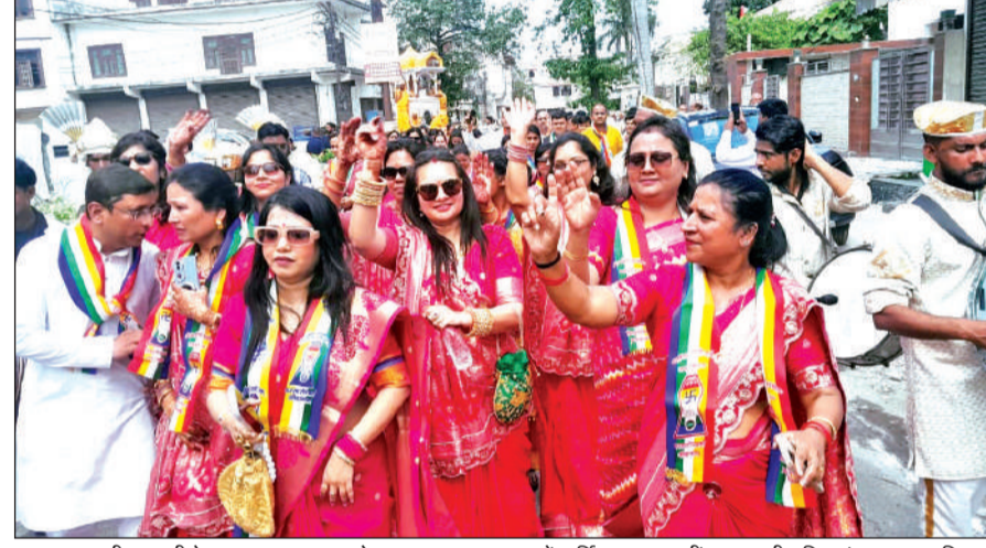
भगवान महावीर स्वामी के जन्म कल्याणक महोत्सव पर भव्य रथयात्रा में धार्मिक नृत्य करती समाज की महिलाएं।