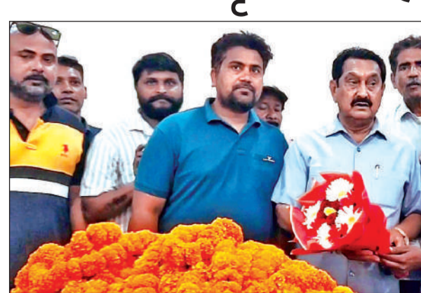
किच्छा में विधायक तिलकराज बेहड़ को सम्मानित करते ग्रामीण।

अमृत विचार : किच्छा विधानसभा क्षेत्र के लिए करोड़ों रुपये की विकास योजनाओं को वित्तीय एवं प्रशासकीय स्वीकृति मिलने पर क्षेत्रवासियों ने विधायक तिलक राज बेहड़ का जोरदार स्वागत किया। आवास विकास स्थित कार्यालय पर आयोजित कार्यक्रम में दर्जनों ग्रामीणों ने विधायक को फूल-मालाओं से लادकर उनका आभार जताया। विधायक बेहड़ ने बताया कि करीब 5 करोड़ की लागत से आधुनिक कम्प्यूनिटी हॉल के निर्माण को मंजूरी मिल गई है, जिससे सामाजिक कार्यक्रमों के लिए जनता को बड़ी सुविधा