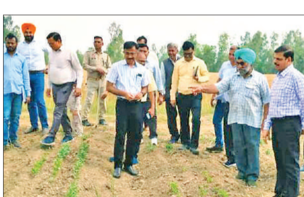
बीसलपुर में गन्ने के खेत का जायजा लेते अपर गन्ना आयुक्त विशेष कर्नोजिया व अन्य।

अमृत विचार : अपर गन्ना आयुक्त क्रय एवं नोडल अधिकारी बरेली परिक्षेत्र ने जनपद में भ्रमण कर बसंतकालीन गन्ना बुवाई एवं पुरानी अनुपयोगी गन्ना किस्मों के विस्थापन की प्रगति की समीक्षा की। इस दौरान उन्होंने बीसलपुर में प्रगतिशील किसान के गन्ने के खेत का भी निरीक्षण किया। उन्होंने किसानों से पुरानी एवं कम उत्पादक किस्मों की बुवाई न कर उन्नत एवं अधिक उपज देने वाली किस्मों को अपनाने की अपील की। जनपद में इन दिनों बसंतकालीन गन्ना बुवाई चल रही है। जिसके अंतर्गत जनपद में अब तक 29,268 हेक्टेयर में गन्ना बुवाई का कार्य