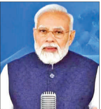
नई दिल्ली, एजेंसी

प्रधानमंत्री नरेन्द्र मोदी ने देश के सभी नागरिकों से पश्चिम एशिया में जारी भीषण युद्ध के कारण पैदा हुई चुनौतीपूर्ण स्थिति से पार पाने के लिए एकजुट होने का आग्रह किया। मोदी ने वर्तमान संकट का राजनीतिकरण करने वालों को आगाह करते हुए कहा कि मौजूदा हालात में स्वार्थ भरी राजनीति के लिए कोई जगह नहीं है। उन्होंने अपने मासिक रेडियो कार्यक्रम मन की बात में कहा कि अफवाह फैलाने वाले लोग देश को बहुत बड़ा नुकसान पहुंचा रहे हैं। प्रधानमंत्री ने कहा, वर्तमान में हमारे पड़ोस में आतंक से भीषण युद्ध जारी है। यह निश्चित तौर पर चुनौतीपूर्ण समय है। मैं आज मन की बात के माध्यम से सभी देशवासियों से फिर यह आग्रह करूंगा कि हमें एकजुट होकर इस चुनौती से बाहर निकलना है। उन्होंने कहा कि जो लोग इस