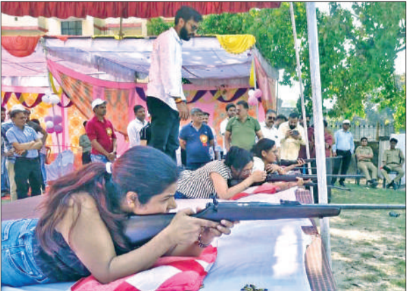
शूटिंग प्रतियोगिता में भाग लेती युवतियां।