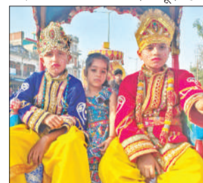
शोभायात्रा में सजाई गई झांकी।