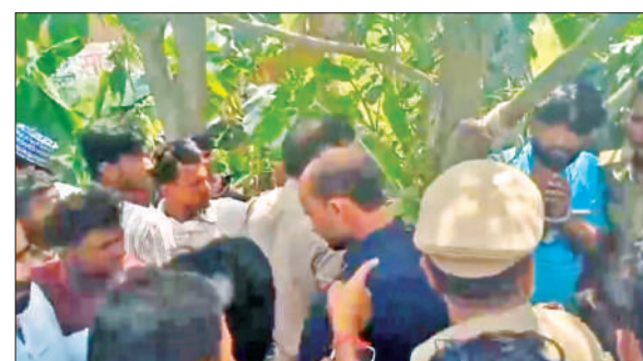
पेड़ से बंधे चालक को बचाती पुलिस।