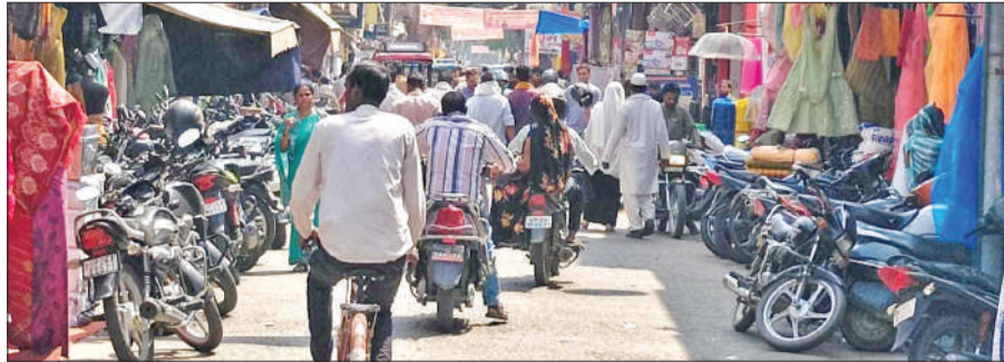
जेपी रोड पर दुकानों के बाहर अतिक्रमण और जाम में फंसे राहगीर।

अतिक्रमण जाम का सबब बने हैं। नो एंट्री जोन होने के बाद भी वाहनों की आवाजाही और फैली