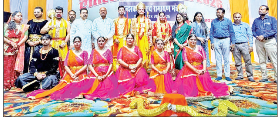
सांस्कृतिक मंच पर रामायण मंचन के कलाकारों के साथ पालिकाध्यक्ष एवं अतिथि।