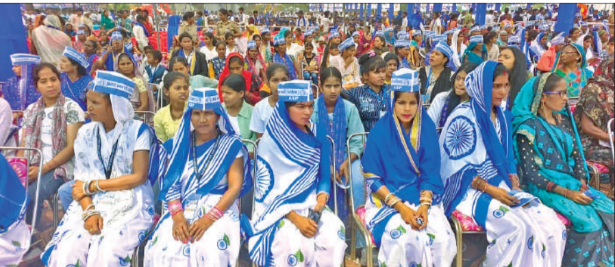
महारैली में मौजूद महिलाओं की भीड़।