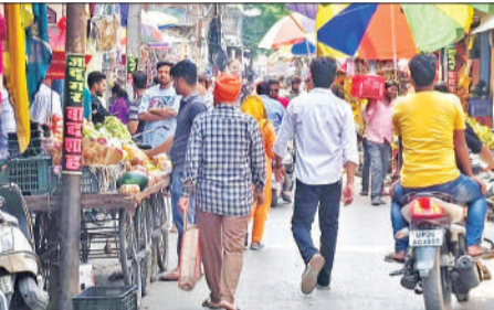
मुख्य बाजार में नींबू मंडी के पास अतिक्रमण।

अतिक्रमण और जाम की हकीकत बयां करती तस्वीर देखनी है तो नींबू मंडी काफी है। यहां पैदल गुजरने के लिए भी मशक्कत करनी पड़ती है। दुकानों का सड़क पर सामान लगता है। इसके बाद टेले और फड़ लगे हैं। कई बार दुकानदार और टेले वालों का भी ग्राहकों के वाहन खड़ा कदने को लेकर विवाद मारपीट में तब्दील हो चुका है। इसके पास की चूड़ी और पटाखा वाली गली भी अतिक्रमण की जद में है। कई बार अतिक्रमण हटाने को प्रयास डीएम एसपी भी कर चुके, लेकिन मातहतों की लापरवाही रही और फिर हालात बदतर हुए। पुलिस या कभी अफसरों की गाड़ी जाम में फंसी तो सख्ती हुई और फिर भूल गए। राहगीर की परेशानी का समाधान करने की सुध नहीं ली जा सकी है।