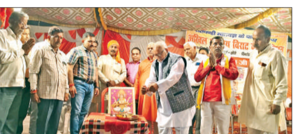
कार्यक्रम की शुरुआत करते समिति अध्यक्ष व अन्य पदाधिकारी।