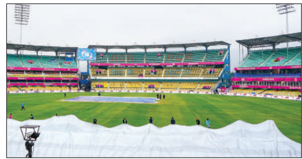
गुवाहाटी में राजस्थान रॉयल्स और चेन्नई सुपर किंग्स के बीच होने वाले मैच से एक दिन पहले बारिश के कारण मैदान को कवर कर दिया गया।

आईपीएल-2026 : दोनों बल्लेबाजों ने 148 रनों की विशाल ओपनिंग साझेदारी की