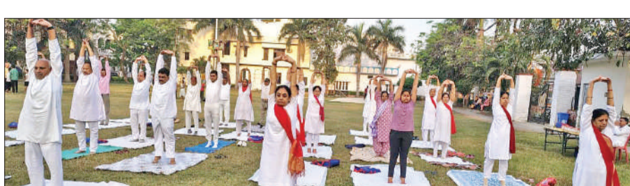
योग करती साधिकाएं।

अमृत विचार : भारतीय योग संस्थान की ओर से रविवार को अस्थि रोग निवारण शिविर बल्लभनगर कॉलोनी स्थित पार्क में आयोजित किया गया। इसमें 50 साधक शामिल हुए और योगाभ्यास किया। तीन दिवसीय योग शिविर की शुरुआत साधिकाओं द्वारा संयुक्त रूप से दीप प्रज्वलन, सरस्वती वंदना करके की गई। योग की क्रियाएं की गईं। अस्थि रोग में लाभदायक विभिन्न