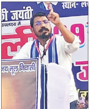
बहुजन भाईचारा संकल्प महारैली को संबोधित करते सांसद चंद्रशेखर आजाद।

चंद्रशेखर आजाद ने कहा कि जब सरकार के अपने मंत्री ही सम्मान और अधिकार के लिए संघर्ष कर रहे हैं, तो आम जनता खासतौर पर दलित, पिछड़े और शोषित वर्ग की स्थिति का सहज अंदाजा लगाया जा सकता है।