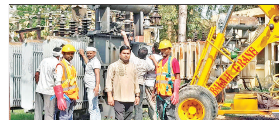
नकटादाना सब स्टेशन पर रखा जाता ट्रांसफार्मर।

बता दें कि ग्रामीण अंचल ही नहीं शहरी क्षेत्र में बिजली की