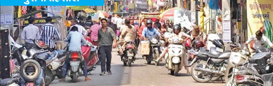
पुरानी तहसील के पास अतिक्रमण के चलते इस तरह गुजरते हैं लोग।