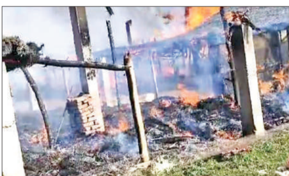
बिड़ौली में जलता पोल्ट्री फार्म। ● अमृत विचार

अमृत विचार: गोला थाना क्षेत्र के बिड़ौली फार्म में पोल्ट्री फार्म में अज्ञात कारणों से आग लग गई, जिससे चार पोल्ट्री फार्म जल कर राख हो गए। आग से लगभग 30 लाख से ज्यादा का नुकसान हुआ है। आग लगने से फार्म में 6500 चूजे और मुर्गी दाना जलकर खाक हो गए। आग लगने के कारणों का पता नहीं चल पाया है। स्थानीय लोगों ने मिलकर आग पर काबू पाया, लेकिन तब तक काफी नुकसान हो चुका था। चारों पोल्ट्री फार्म जलकर राख हो गए। फार्म में 7200 चूजे थे, जिसमें लगभग