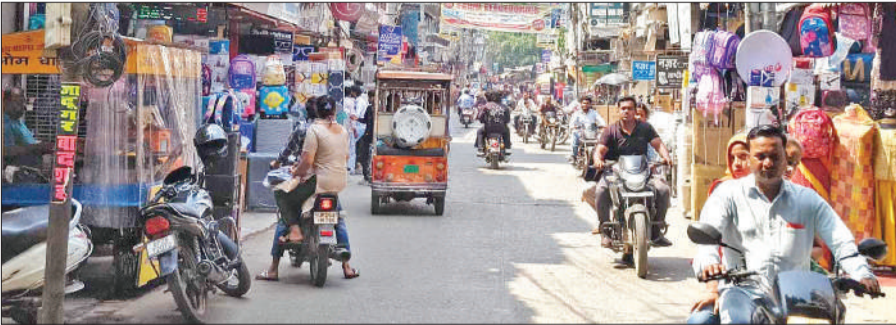
मुख्य बाजार में दुकानों के आगे फुटपाथ घेरकर रखा सामान।

पुरानी तहसील : शहर के सुनहरी मस्जिद चौराहा से इमंडगंज चौराहा को जाने वाली सड़क बाजार क्षेत्र का इलाका है।