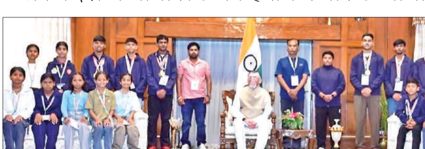
झारखंड राजभवन में राज्यपाल के साथ यूपी की सेपक टाकरा टीम।