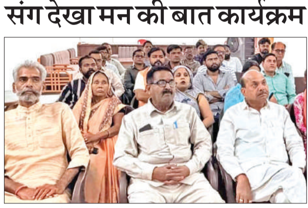
गोला में प्रधानमंत्री के मन की बात सुनते पालिकाध्यक्ष व अन्य।