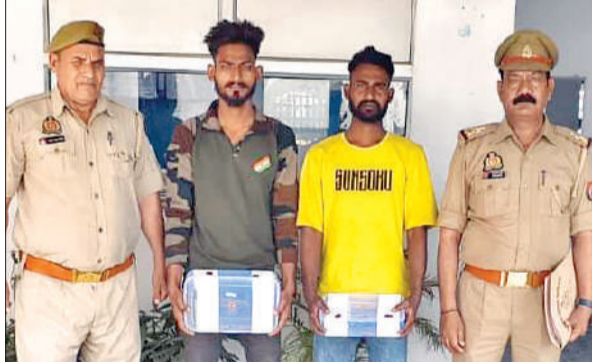
बरखेड़ा पुलिस की गिरफ्त में पकड़े गए आरोपी।