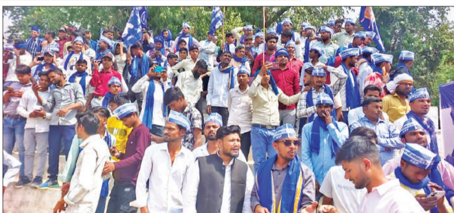
विलोबी मैदान में चंद्रशेखर आजाद की झलक पाने को मशवकत करते युवा।

पांच किलो राशन के लिए यदि वोट देते हो तो अपने लिए ही गद्दा खोद रहे हो। धर्म के नाम पर बेवकूफ बनाकर वोट लेने वाले जीतने के बाद वापस नहीं आते। जनता भी अब समझ चुकी है और समय आने पर वोट के जरिए