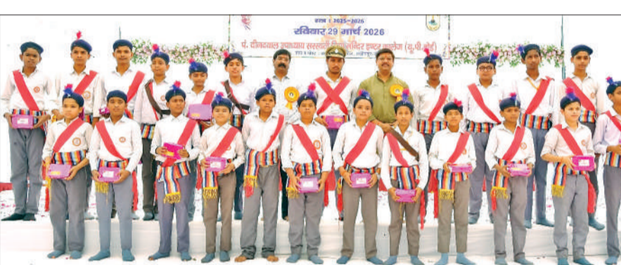
सम्मान हासिल करने के दौरान मेधावी विद्यार्थी।