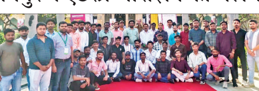
कानपुर विश्वविद्यालय में प्राध्यापकों संग जमुनाबाद कृषि महाविद्यालय के छात्र।

अमृत विचार: चंद्रशेखर आजाद कृषि एवं प्रौद्योगिकी विश्वविद्यालय कानपुर के अंतर्गत संचालित कृषि महाविद्यालय कैम्पस जमुनाबाद के बीएससी के विद्यार्थियों ने कानपुर में आयोजित ट्रेड शो में टेक्सटाइल, हैंडलूम एवं एक जिला एक उत्पाद आधारित उत्पादों प्रदर्शनी में नेटवर्किंग, उद्यमिता एवं स्वरोजगार की जानकारी प्राप्त की। युवाओं को आत्मनिर्भर एवं रोजगार सृजन के नए अवसरों की दिशा देने के उद्देश्य से कृषि महाविद्यालय के बीएससी तृतीय, चतुर्थ वर्ष के 56 छात्रों ने 27 से 29