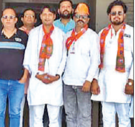
प्रशिक्षण अभियान में भाजपा नेता।