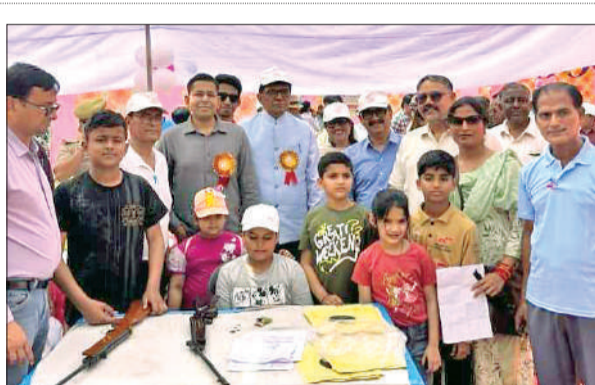
प्रतियोगिता के दौरान बच्चों ने भी एयरगन से निशाना साधा।

एसपी ने ने शूटिंग प्रतियोगिता के आयोजन पर लोगों को शुभकामनाएं देते हुए कहा कि वर्तमान में मिशन शक्ति 5.0 को दूसरा फेज चल रहा है। हम चाहते हैं कि बच्चियों और महिलाएं आगे आए और प्रतियोगिता में प्रतिभाग करें। इस दौरान डीएम एवं एसपी ने 22 बोर रायफल से निशाना लगाकर शानदार प्रदर्शन किया। पहले दिन प्रतियोगिता में अधिकारियों के अलावा सीनियर सिटीजन, महिलाओं एवं बालक-बालिकाओं ने भी हिस्सा लेकर प्रदर्शन किया।