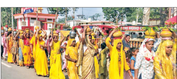
कलशयात्रा में शामिल महिलाएं।