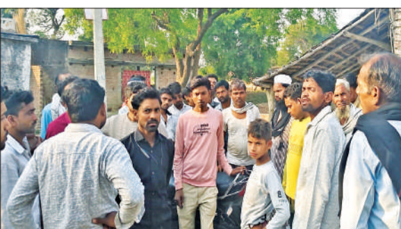
मृतकों के घर पर लगी ग्रामीणों की भीड़।