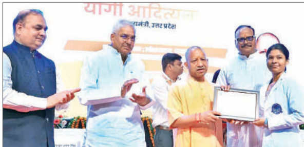
लखनऊ : लोकभवन में एक अभ्यर्थी को नियुक्ति पत्र देते मुख्यमंत्री योगी।

अमृत विचार : मुख्यमंत्री योगी आदित्यनाथ ने कहा कि जनता द्वारा नकारे जाने के बाद कुछ लोग अब अफवाह और दुष्प्रचार के सहारे समाज को गुमराह करने का प्रयास कर रहे हैं। उन्होंने प्रदेशवासियों से ऐसे लोगों से सतर्क रहने की अपील करते हुए कहा कि संकट के समय दुष्प्रचार करना राष्ट्रहित के खिलाफ है। मुख्यमंत्री योगी रविवार को लोक भवन में आयोजित 665 नवनियुक्त नर्सिंग अधिकारियों को नियुक्ति पत्र वितरण कार्यक्रम में बोल रहे थे। उन्होंने डीजल-पेट्रोल और रसोई गैस को लेकर अफवाह और दुष्प्रचार फैलाने वाले विपक्षी नेताओं पर तीखा