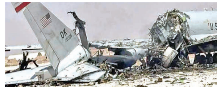
ईरान के हमले में ध्वस्त हुआ अमेरिका का अत्याधुनिक ई-3 सेंटी विमान।