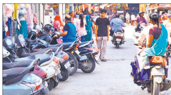
मुख्य बाजार में दुकानों के बाहर इस तरह खड़े होते हैं वाहन।

अमृत विचार : शहर की सड़कों पर फैला जाम दशकों से राहगीरों के लिए समस्या का सबब बना हुआ है। इसके समाधान के लिए दावों के सिवाए कुछ नहीं हो सका है। एक तरफ सड़कों पर फैले अतिक्रमण की बदहाल तस्वीर तो है ही। वहीं, इसके पीछे एक दूसरी वजह बिना पार्किंग के संचालित हो रहे प्रतिष्ठान भी है। नगर पालिका और प्रशासन के स्तर से पार्किंग स्थल को लेकर भी कोई ठोस कदम नहीं उठाया जा सका है। ऐसा भी नहीं कि इसे लेकर आंदोलन नहीं हुए। पिछले साल ही हिंदू महासभा के कार्यकर्ताओं ने इसे लेकर कई बार धरना प्रदर्शन किया, जाम लगाया लेकिन आश्वासन और विन्धोकरण के नाम पर कार्रवाई सिमटकर रह गई। इस दिशा में अब