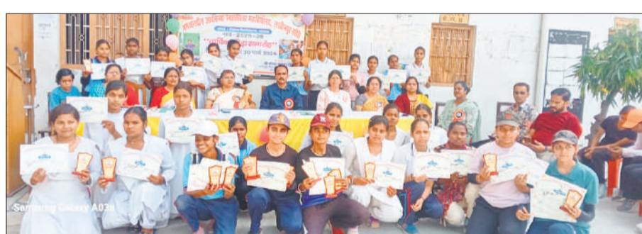
स्मृति चिह्न और प्रमाण पत्र के साथ प्रतिभागी।