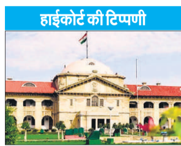
हाईकोर्ट की टिप्पणी