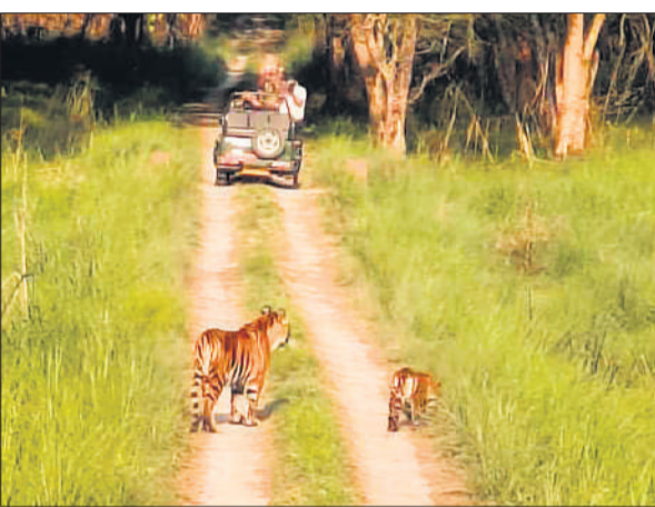
जंगल सफारी के दौरान बाघों को कैमरे में कैद करते दिखे पर्यटक।

बताया कि पर्यटन सत्र के दौरान सैलानियों के साथ वन्यजीवों की सुरक्षा पर भी विशेष ध्यान दिया जा रहा है। पर्यटन सत्र के चलते पीलीभीत टाइगर रिजर्व पर्यटकों के लिए इस बार 01 नवंबर को खोला गया था। मौजूदा पर्यटन सत्र में भी पीलीभीत टाइगर रिजर्व बाघों की साइटिंग का प्रमुख केंद्र बिंदु बना हुआ है। इसकी वजह यह है कि पिछले पर्यटन सत्र के दौरान