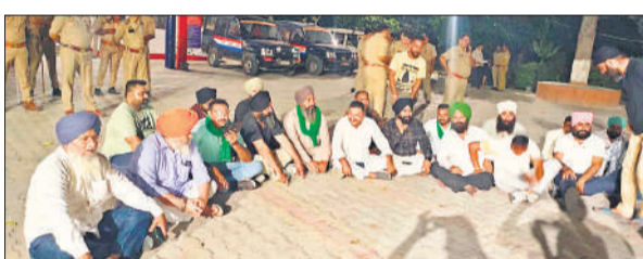
कोतवाली निघासन में धरने पर बैठे किसान।

सोमवार की देर शाम किसान नेता और कार्यकर्ता निघासन सदर चौराहा पर इकट्ठा हुए, जहां उन्होंने सरकार के खिलाफ जमकर नारेबाजी करते हुए धरना-प्रदर्शन शुरू कर दिया। देखते