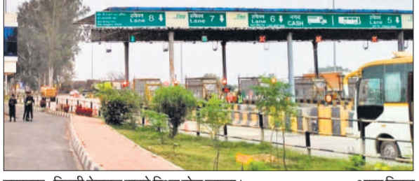
लखनऊ-दिल्ली नेशनल हाइवे स्थित टोल प्लाजा।

अमृत विचार: कस्बे से होकर गुजरने वाले राष्ट्रीय राजमार्ग (एनएच-30) पर स्थित टोल प्लाजा की दरों में एक वर्ष के भीतर तीसरी बार बढ़ोतरी कर दी गई है। नई दरें पहली अप्रैल से लागू होंगी। टोल शुल्क बढ़ने से सड़क मार्ग से सफर अब आम लोगों के लिए और महंगा हो गया है। भारतीय राष्ट्रीय राजमार्ग प्राधिकरण (एनएचएआई) और सड़क परिवहन एवं राजमार्ग मंत्रालय की ओर से देशभर में राष्ट्रीय राजमार्गों पर टोल शुल्क में लगभग पांच प्रतिशत तक की वृद्धि की गई है। इसी क्रम में मैंगलगंज टोल प्लाजा पर भी नई दरें लागू की जा रही हैं। बताया गया है कि कुछ माह पूर्व लागू किए गए वार्षिक फायदेनुपास की कीमत 3000 रुपये तक की गई थी, जो 200 यात्राओं या एक वर्ष (जो पहले