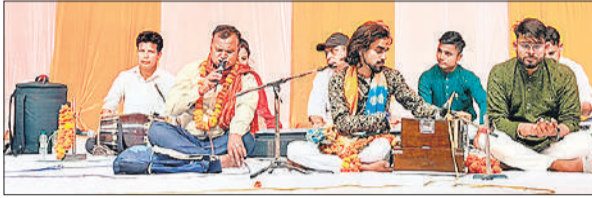
वाद्ययंत्रों के साथ भजन गाते गायक।