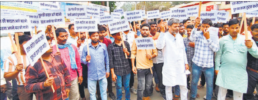
कलेक्ट्रेट में क्षतिग्रस्त पुल के सुधार की मांग करते ग्रामीण।

अमरिया तहसील क्षेत्र के ग्राम भगा मोहम्मदगंज में देवहा नदी पर बना पुल करीब तीन साल पहले बाढ़ आने पर क्षतिग्रस्त हो गया था। जिसके बाद से 50 से अधिक गांव