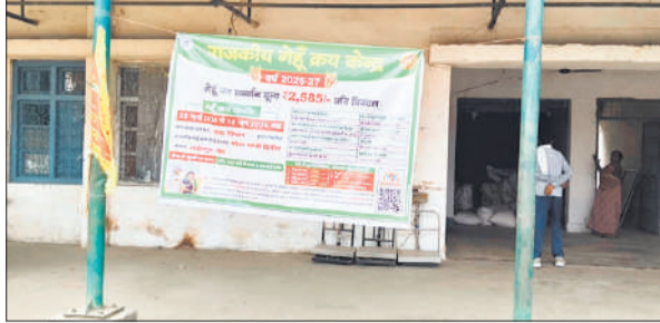
गोला में मंडी समिति में गेहूं खरीद केंद्र पर टंगा बैनर।