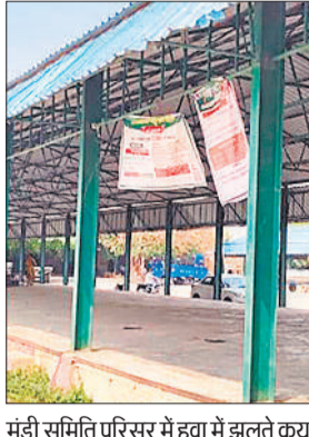
मंडी समिति परिसर में हवा में झूलते क्रय केंद्रों के बैनर।