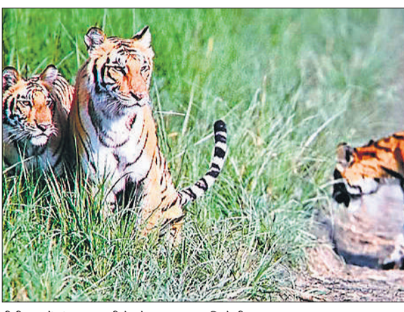
पीटीआर में जंगल सफारी के दौरान एक साथ दिखे तीन बाघ।