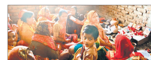
बिड़ौली में भगवान जगन्नाथ की पूजा करती महिलाएं।

अमृत विचार: ग्रामीण क्षेत्र में भगवान जगन्नाथ की विधि विधान से पूजन किया गया। महिलाओं ने नए अनाज से बने व्यंजनों से भोग लगाकर धन धान्य, सुख समृद्धि की कामना की। बिड़ौली में महिलाओं ने चैत्र माह के अंतिम सोमवार को भगवान जगन्नाथ की नए अनाज से पूजा अर्चना की। घरों में पंचामृत से प्रतिमा को स्नान कराकर चंदन, कुसुम, टेसू के फूल चढ़ाकर आटे के दीपक जलाए। गेहूं की सात बालियां, कच्चे आम, गुड़धनिया, गुड़िया, खीर, दही, हलवस, पूड़ी का प्रसाद चढ़ाया। मान्यता है कि भगवान जगन्नाथ की साधना करने वालों के जीवन में सदैव समृद्धि रहती है। उनको अन्न और जल की त्रासदी नहीं झेलनी होती। जगन्नाथ जी की कृपा से ही दरिद्र