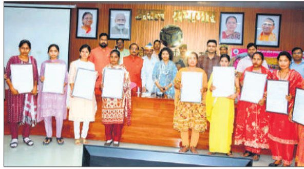
नियुक्ति पत्रों के साथ आंगनबाड़ी सहायिकाएं।