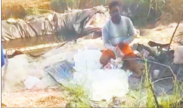
प्लास्टिक की पत्थियों में अवैध शराब पैक करता युवक।

इस अवैध धंधे को पूरी योजना के तहत संगठित तरीके से संचालित किया जा रहा है। जंगल के अंदर गहराई में जहां आम लोगों की पहुंच मुश्किल होती है, वहां भंडियां लगाई जाती हैं। रात ही नहीं, बल्कि दिन में भी धुएं के गुबार उठते देखे जा सकते हैं। इसके बाद तैयार शराब को छोटे-छोटे पाउच में भरकर खपाने के लिए