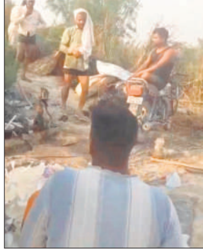
लालबोड़ी जंगल में धधक रही शराब भंडी।

की ओर इशारा करता है। ग्रामीणों में इसको लेकर भारी नाराजगी है। उनका कहना है कि अवैध शराब का यह कारोबार न केवल कानून का उल्लंघन है, बल्कि यह सीधे तौर पर लोगों की जान से खिलवाड़ भी है। पहले भी अवैध शराब के कारण कई घटनाएं सामने आ चुकी हैं। लोगों की जानें तक चली गईं। बावजूद इसके प्रशासन की सुस्ती समझ से परे है। आक्रोशित ग्रामीणों ने चेतावनी दी है कि यदि जल्द ही इस अवैध कारोबार पर सख्त कार्रवाई नहीं की गई, तो वे आंदोलन करने को मजबूर होंगे। उन्होंने उच्च अधिकारियों से मांग की है कि पूरे मामले की निष्पक्ष जांच कराई जाए और इसमें