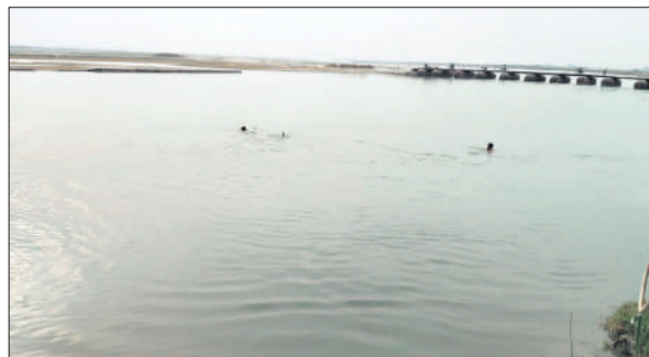
शारदा नदी में युवक की तलाश करते गोताखोर।

घटना के बाद मौके पर अफरा-तफरी मच गई। साथियों के शोर मचाने पर आसपास के लोग दौड़