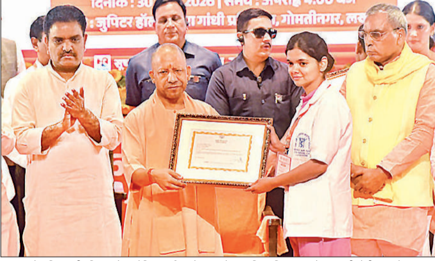
लखनऊ के इंदिरा गांधी प्रतिष्ठान में आयोजित कार्यक्रम में छात्रा को छात्रवृत्ति का वितरण करते मुख्यमंत्री योगी, साथ में अन्य।

मुख्यमंत्री सोमवार को इंदिरा गांधी प्रतिष्ठान में कक्षा 9-10 और दशमोत्तर के 27,99,982 विद्यार्थियों के खातों में 3350 करोड़ रुपये की छात्रवृत्ति व शुल्क प्रतिपूर्ति का अंतरण किया। उन्होंने गरीब परिवारों के मुख्य अर्जक की मृत्यु होने पर राष्ट्रीय पारिवारिक लाभ योजना के अंतर्गत 33,334 आश्रित परिवारों को भी 100 करोड़ रुपये की सहायता राशि भी सीधे खातों में भेजी। कार्यक्रम को संबोधित करते हुए मुख्यमंत्री योगी ने समाजवादी पार्टी के नेताओं