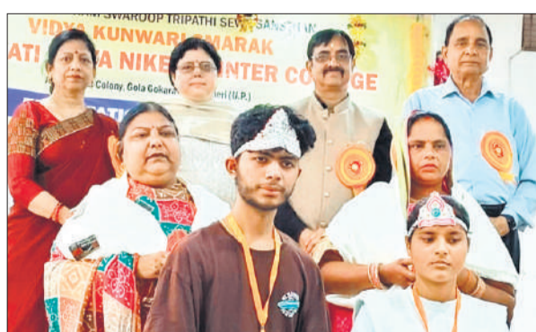
चांदी का मुकुट पहने हाईस्कूल और इंटर के टॉपर्स।