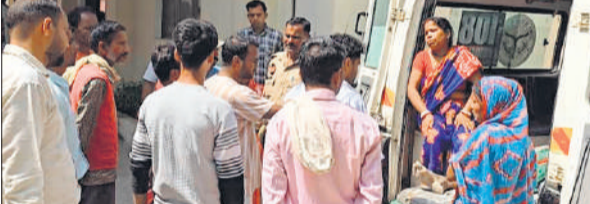
जिला अस्पताल पहुंचने पर लगी भीड़।

कार्यालय संवाददाता, पीलीभीत अमृत विचार : मिक्सरी में चटनी बनाते वक्त एक महिला को करंट लगने से मौत हो गई। जिला अस्पताल लाने पर चिकित्सक ने उसे मृत घोषित कर दिया। सूचना मिलने पर पहुंची पुलिस ने जानकारी की। हालांकि परिजन ने पोस्टमार्टम कराने से इन्कार कर दिया। परिजन का रोक बुरा हाल रहा। गजरौला क्षेत्र के ग्राम गांधीनगर निवासी 38 वर्षीय शिक्षा पटारी पत्नी