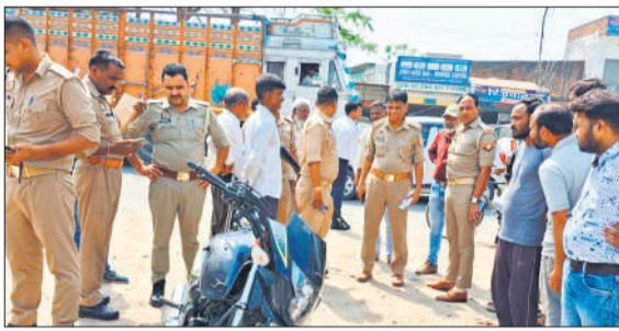
हादसे के बाद डिग्री कॉलेज के पास मौके पर मौजूद पुलिस फोर्स व दुर्घटना में क्षतिग्रस्त हुई बाइक।