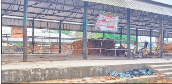
पलिया के गेहूं क्वय केंद्रों पर छाया सन्नाटा।

अमृत विचार: जिले में गेहूं खरीद केंद्रों के संचालन को लेकर प्रशासनिक दावे और जमीनी हकीकत के बीच बड़ा अंतर देखने को मिल रहा है। जहां एक ओर अधिकारियों ने सोमवार से सभी खरीद केंद्रों के शुरू होने का दावा किया, वहीं अधिकांश केंद्रों पर न तो आवश्यक व्यवस्थाएं पूरी हैं और न ही खरीद प्रक्रिया शुरू हो सकी है। इससे किसानों में असमंजस की स्थिति बनी हुई है। गेहूं खरीद के लिए शहर समेत जिले में 134 केंद्र बनाए गए हैं। इस बार गेहूं का खरीद मूल्य 2585 रुपये प्रति क्विंटल निर्धारित किया गया है, जो पिछले साल से 160 रुपये अधिक है। जिले में 7 हजार किसानों ने अब तक पोर्टल पर अपना पंजीकरण करा लिया है। गेहूं खरीद के पहले दिन जिले के विभिन्न क्षेत्रों में पड़ताल करने पर सामने आया कि कई स्थानों पर केवल औपचारिकता निभाने के लिए बैनर जरूर लगा दिए गए हैं, लेकिन अधिकांश केंद्रों पर बुनियादी सुविधाओं का अभाव है।