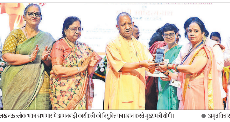
लखनऊ :लोक भवन सभागार में आंगनबाड़ी कार्यकर्त्री को नियुक्ति पत्र प्रदान करते मुख्यमंत्री योगी।

अमृत विचार : मुख्यमंत्री योगी आदित्यनाथ ने सोमवार को आंगनबाड़ी व्यवस्था में बड़े बदलाव करते हुए पांच हजार कार्यकर्त्रियों और 60 हजार सहायिकाओं की भर्ती समेत मानदेय में बढ़ोतरी का एलान किया। उन्होंने 'स्मार्ट सैलरी' व्यवस्था लागू करने की बात कहते हुए विभाग को जल्द प्रस्ताव तैयार करने के निर्देश दिए। मुख्यमंत्री ने कहा कि भर्ती प्रक्रिया पूरी तरह पारदर्शी होगी और 'न पर्वी-न खर्ची' के आधार पर चयन किया जाएगा।