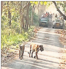
दो बाघ देखकर गद्गद दिखे पर्यटक।

पीलीभीत टाइगर रिजर्व में आने वाले करीब 90 फीसदी पर्यटकों को बाघों की अच्छी साइटिंग हुई थी। वहीं मौजूदा पर्यटन सत्र में टाइगर साइटिंग ने पिछले सारे रिकार्ड ध्वस्त कर दिए। मौजूदा पर्यटन सत्र के दौरान लगभग रोजाना ही पर्यटकों को बाघों के दीदार हो रहे हैं। कुछ सैलानियों को तो दो-तीन नहीं बल्कि चार से लेकर पांच बाघ तक देखने को मिल रहे हैं।