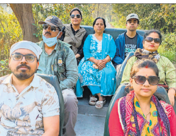
जंगल सफारी करने पहुंचा परिवार।

अमृत विचार : जंगल में बाघ को घूमते देखना कोई आश्चर्य की बात नहीं है। मगर, कई लोगों के लिए बाघों को उनके प्राकृतिक वास स्थल में देखना आज भी एक सपना बना हुआ है। ऐसे लोगों के लिए पीलीभीत टाइगर रिजर्व खासा मुफीद साबित हो रहा है। इसकी वजह यह है कि यहां मौजूदा पर्यटन सत्र के दौरान सैलानियों को लगभग रोजाना ही बाघों के दीदार हो रहे हैं। टाइगर रिजर्व में बीते रविवार का दिन टाइगर साइटिंग के नाम रहा। जंगल सफारी के दौरान पर्यटकों ने दो-तीन नहीं बल्कि चार से लेकर पांच बाघों के दीदार किए। टाइगर साइटिंग को लेकर पर्यटकों में खासा उत्साह देखा जा रहा है।