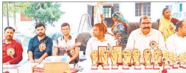
झाऊपुर के स्कूल के वार्षिकोत्सव में मंचावली अतिथि।