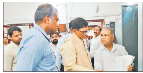
कलेक्ट्रेट में निरीक्षण के दौरान अभिलेख के संबंध में जानकारी लेते मंडलायुक्त।