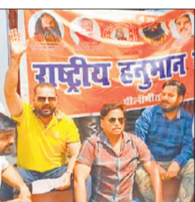
बिलसंडा में विरोध प्रदर्शन करते राष्ट्रीय हनुमान दल के पदाधिकारी।