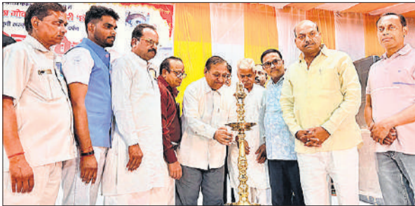
गोला के चैती मेला के मंच पर दीप प्रज्वलित करते अतिथि।