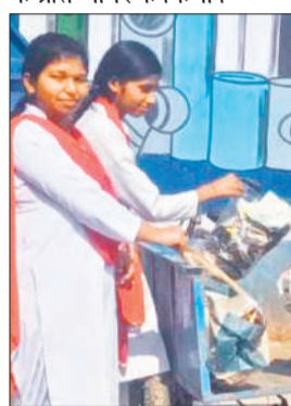
शिविर में मौजूद छात्राएं।