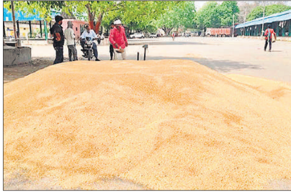
मंडी में गेहूं का ढेर।

शासन ने इस बार 30 मार्च से गेहूं की सरकारी खरीद करने के निर्देश दिए। यह दीगर बात है कि जनपद में गेहूं की फसल अभी पककर तैयार नहीं हुई है। जनपद में 125 क्रय केंद्र के माध्यम से खरीद की जानी है। वहीं पीलीभीत मंडी समिति परिसर में 26 क्रय केंद्रों के माध्यम से खरीद होनी है। 30 मार्च से शुरू होने वाली गेहूं खरीद को लेकर जिम्मेदारों ने क्रय केंद्रों से संबंधित तैयारियां पूरी होने के दावे किए थे, मगर गेहूं खरीद के पहले दिन सोमवार को क्रय केंद्रों की तैयारियों