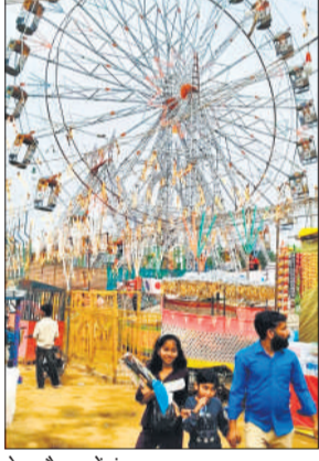
मेला मैदान में बंद पड़ा झूला।